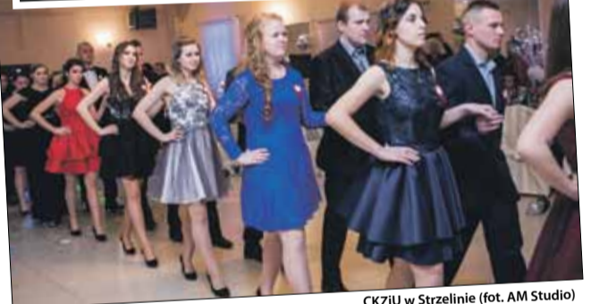
CKZIU w Strzelinie