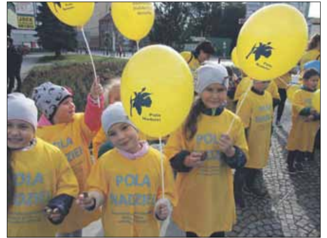
Jedną ze sztandarowych akcji stowarzyszenia jest jesienne sadzenie żonkili

Zarząd stowarzyszenia cały czas stara się dokupować