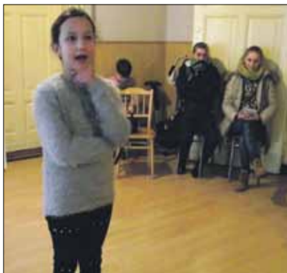
Program przedstawienia był bogaty. Dzieci przygotowały m.in. opowiadania

seniorom kolorowe laurki. Panie nagrodziły dzieci gromkimi brawami i odwdzięczyły się wręczając im słodycze. Warto dodać, że dzieci ze świetlicy środowiskowej przygotowują również przedstawienia z różnych innych okazji, jak np. Dzień Seniora.