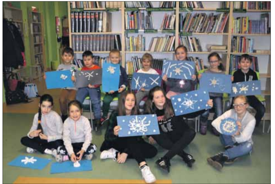
Z barku widocznych oznak zimy w naturze dzieci same zadbały o gwiazdki śniegu