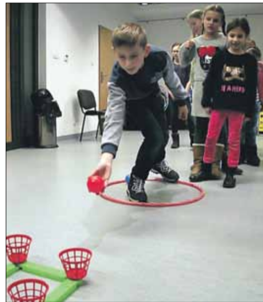
Brak sniegu sprawił, że śnieżne igrzyski zamieniono na inną zabawę