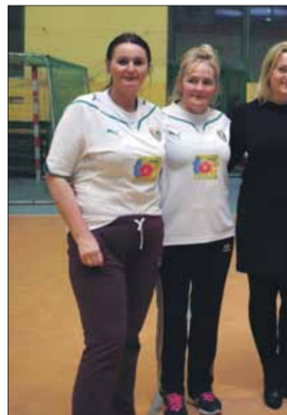
W turnieju zagrała m.in. reprezentacja soltysów gminy Strzelin