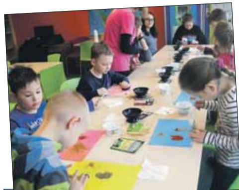
Pieprz i sól, to nie tylko przyprawy, ale też... tworzywo do plastycznych realizacji

Panie bibliotekarki, wspomagane przez wolontariuszy, dbają o to, aby dzieci nie tylko dobrze się bawiły, ale i zaspokajały swoją pasję poznawczą oraz dawały upust własnej kreatywności. Czasem obie funkcje zostają połączone, jak w Dniu Pikantnych Potraw, kiedy nie tylko zetknęły się z różnorodnością egzotycznych przypraw, ale też mogły je wykorzystać jako tworzywo do działań plastycznych. Powstałe dzieła dostępne były nie tylko oczom, ale uruchomiły całą gamę doznań zmysłowych a aromaty niesły się