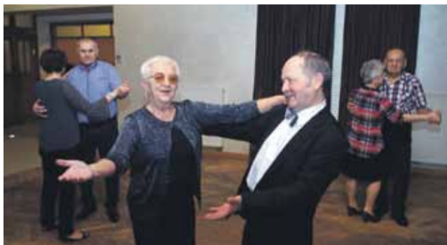
Seniorzy znakomicie bawili się do późnego wieczora

W czwartek, 11 stycznia w restauracji Sezam odbyło się tradycyjne spotkanie oplatkowe, zorganizowane przez strzełiński oddział Polskiego Związku Emerytów, Rencistów i Inwalidów.