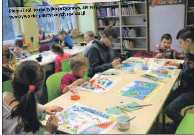
Ferie to nie tylko beztrudna zabawa, ale i czas uwolnionej kreatywności

po całej bibliotece. Miejsce zobowiązuje, a zatem wiele zajęć było inspirowanych literaturą, jak wykonanie fantazyjnego nakrycia głowy Szalonego Kapelusznika z „Alicji w Krainie Czarów” czy wymodelowanie w masie solnej postaci z książek o Misiu, co lubił miód. Rekompen-