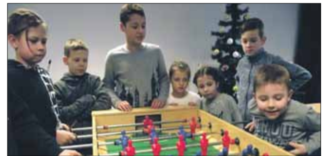
Turniej piłkarzyków był bardzo zacięty, a zwycięzcy otrzymali słodkie nagrody

Warto podkreślić, że dwukrotnie Strzeliński Ośrodek Kultury gościł także na zajęciach półkolonie z Aquaparku Granit w Strzelinie.