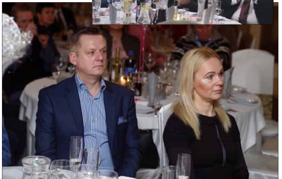
W spotkaniu uczestniczyli m.in. szefowie dużych lokalnych przedsiębiorstw