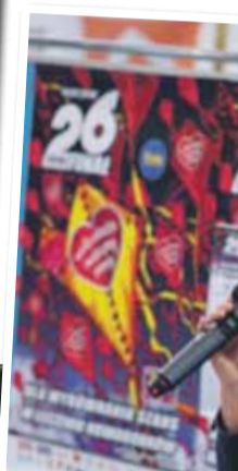
Na scenie wystąpiła m.in. z występu w „T...