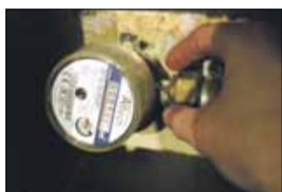
Wodomierze należy wymieniać co pięć lat

stępująco: 2019 r. - 744, 2020 r. - 1784, 2021 r. - 1057 - dodaje. Prezes ZWiK apeluje do mieszkańców o wpuszczenie pracowników na posesje i umożliwienie im dostępu do wodomierza. - Zdarza się, że mimo wielokrotnych prób uzyskania dostępu do wodomierzy oraz wysyłania pism, nie udaje się dokonać okresowej wymiany urządzeń. Prosimy o wyrozumiałość. Jesteśmy skłonni ustalić dogodny termin wizyty, tak, aby mieszkańcy nie musieli zmieniać swoich planów - tłumaczy. Należy dodać, że uprawnieni przedstawiciele spółki zgodnie z obowiązującymi przepisami mają prawo wstępu na teren nieruchomości lub do pomieszczeń należących do odbiorcy m.in. w celu odczytu lub wymiany wodomierza, a kto nie