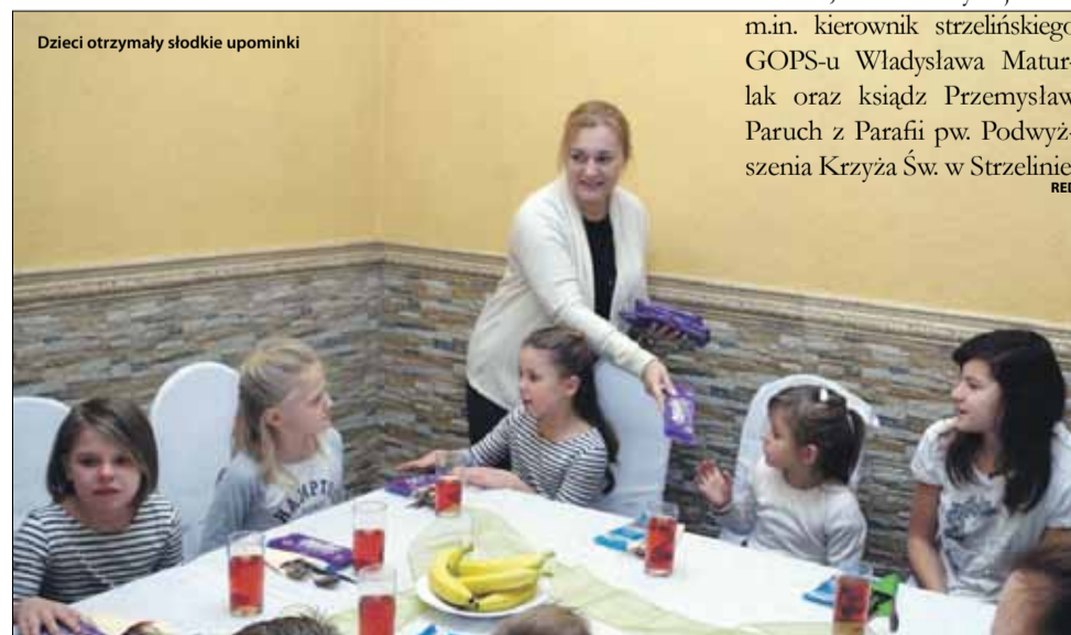
Dzieci otrzymały słodkie upominki