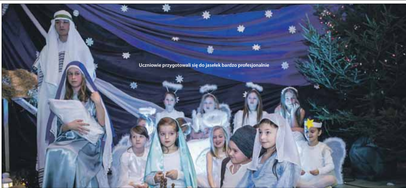
Uczniowie przygotowali się do jasełek bardzo profesjonalnie