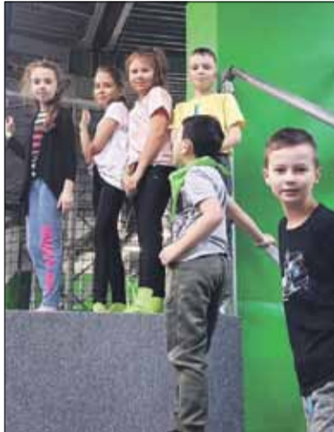
Jedną z atrakcji podczas zimowego wypoczynku był wyjazd do parku trampolin Go Jump we Wrocławiu (na zdjęciu uczniowie PSP nr 5 w Strzelinie)

do strzelińskiego kina „Grażyna”, w których uczestniczyło ok. 70 dzieci. Uczniowie Samorządowej Szkoły Muzycznej I Stopnia w Strzelinie wzięli udział w Przeglądzie Kołęd i Pastorałek w Centrum Kultury Śląskiej w Świętochłowicach, Ogólnopolskim Konkursie Pianistycznym w Libiążu oraz Ogólnopolskim Konkursie „Młodzi artyści na Zam-