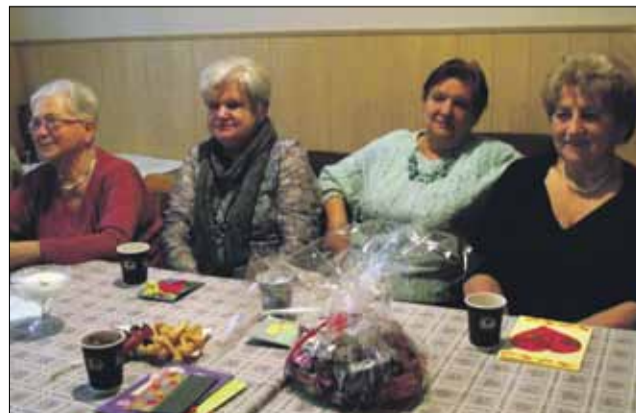
Panie z Klubu Seniora z uwagą oglądały przedstawienie