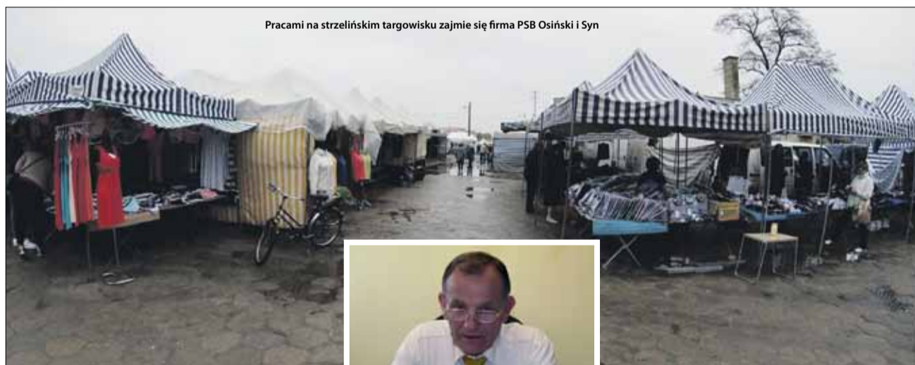
Pracami na strzełińskim targowisku zajmie się firma PSB Osiński i Syn

no CUKiT przeprowadził losowania stanowisk. Wzięło w nim udział około 75 handlujących. – Z uwagi na to, że miejsc mieliśmy tylko 50, musieliśmy ogłosić dodatkowe losowanie, w którym wzięło udział ponad 25 handlujących, którym wcześniej nie udało się wylosować miejsca. Te osoby będą miały wyznaczone stanowiska na terenie zielonym przy chodniku w pobliżu aquaparku – tłumaczy. Losowanie nie dotyczyło handlujących starociami, którzy będą nadal sprzedawać tam, gdzie dotychczas. W czasie przebudowy targ będzie funkcjonował tak jak zwykle, czyli we wtorki i piątki. Warto również zaznaczyć, że handlujący przy aquaparku nie zajmą całego parkingu. Część (najbliżej basenu) będzie dostępna dla kierowców, aby mogli swobodnie za-