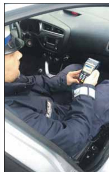
W strzeelińskiej jednostce są trzy takie urządzenia, w które wyposażeni są policjanci ruchu drogowego

Strzeelińscy policjanci otrzymali terminale płatnicze. Dzięki temu za mandat kierowcy będą mogli zapłacić od razu kartą. Nowe wyposażenie mundurowych to efekt projektu ustawy przyjętej przez Radę Ministrów. - Wybór formy płatności będzie zależał od osoby ukaranej – zaznacza asp. sżtab.