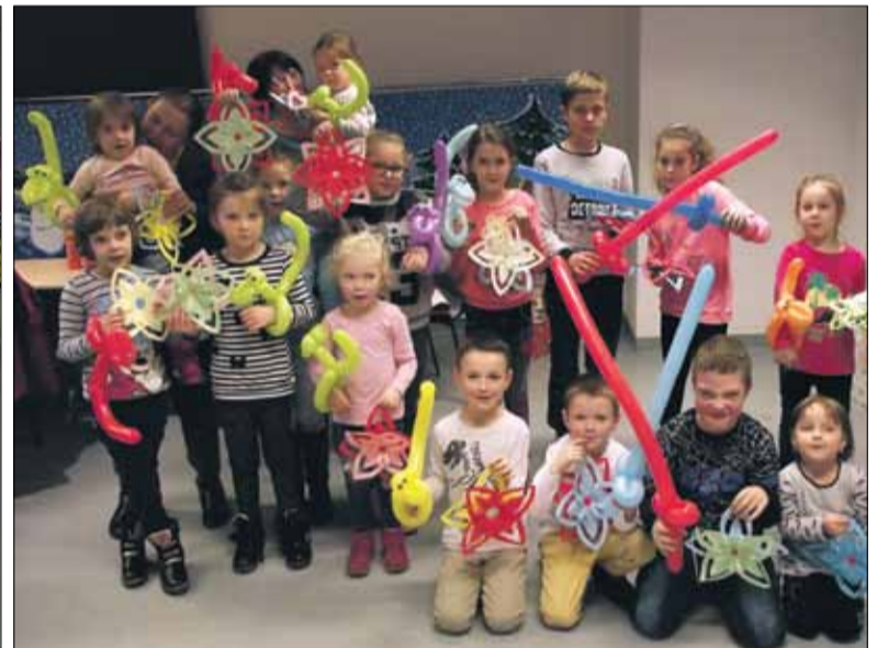
Dla dzieci z Chociwela przygotowano zajęcia w Strzelińskim Ośrodku Kultury