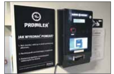
Urządzenie zamontowano w pomieszczeniu Komendy Powiatowej Policji w Strzelinie