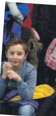
W salie sportowej...