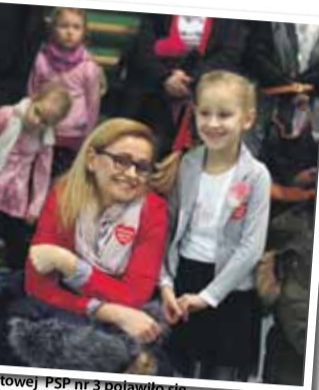
owej PSP nr 3 pojawiło się mieszkańców Strzelina

ska ze Strzeleńskiego Ośrodka Kultury, a wiele z wystawionych na sprzedaż przedmiotów szybko znalazło nowych właścicieli. W holu hali sportowej przygotowano liczne kiermasze, na których można było nabyć np. ciasta, książki itp. W szkolnej stolówce serwowano m.in. frytki i pierogi. Sporym zainteresowaniem cieszyły się przejażdżki elektrycznymi busami, które już wiosną będą regularnie kursować po Strzelinie w ramach gminnej komunikacji. Z tej możliwości skorzystało wielu mieszkańców.