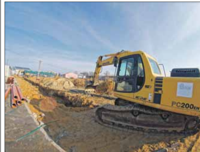
Jedną z inwestycji jest przebudowa targowiska, która ma zakończyć się w lipcu bieżącego roku