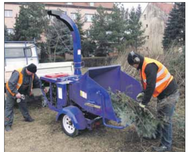
JO Rębak kosztował około 40 tys. zł

w Strzelinie Ryszard Piestrak. - Do tej pory pracownicy wywozili je samochodem dostawczym do Muchowca, gdzie ulegały utylizacji. Wiązało się to jednak z częstymi kursami, a co za tym idzie większymi kosztami prowadzonych prac. Dzięki zakupionemu rębakowi gałęzie są kruszone, a trociny wywożone, albo pozostawiane jako naturalna ściółka – dodaje. Rębak kosztował około 40 tys. zł.