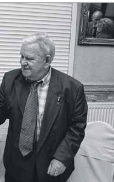
mi lokalnego samorządu