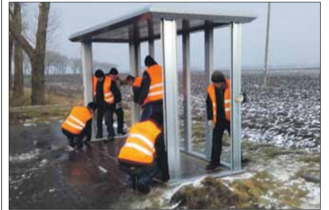
Pracownicy Centrum Usług Komunalnych i Technicznych w Strzelinie zamontowali nowy przystanek

Dolnośląskie osoby korzystające z gminnej komunikacji będą mogły zakupić bilet zintegrowany i zaoszczędzić rocznie na przejazdach busami i pociągami KD nawet 500 zł. Warto podkreślić, że wstępne rozkłady jazdy dostosowano do godzin odjazdów i przyjazdów pociągów