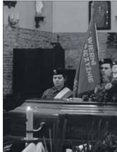
W ostatnim pożegnaniu zmarłego towarzyszyli m.in. uczniowie Sybiraków w Strzelinie