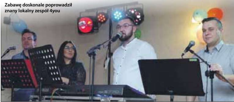
Zabawę doskonale poprowadził znany lokalny zespół 4you

niem cieszyli się np. karnety do Aquaparku Granit oraz na sploty pontonowe w Bardzie. Bal okazał się naprawdę udanym przedsięwzięciem, a wszyscy goście nie kryli zadowolenia i pochlebnych uwag. Rada rodziców już myśli o kolejnych akcjach, które pozwolą na zgromadzenie środków dla uczniów. O tych planach napiszemy w jednym z kolejnych wydań gazety.