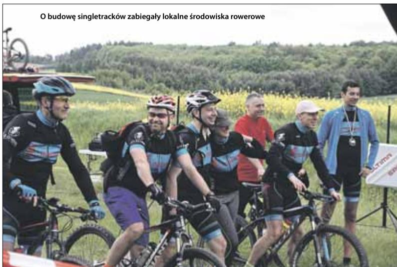
O budowę singletracków zabiegały lokalne środowiska rowerowe