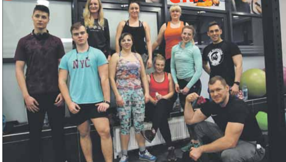
Strzeleńska siłownia Granit Gym świętowała swoje trzecie urodziny