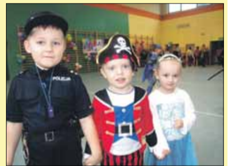
Rodzice przygotowali pociechy na bal z niezwykłą dbałością o szczegóły

W poniedziałek, 12 lutego w sali gimnastycznej Publicznej Szkoły Podstawowej nr 3 w Strzelinie zorganizowano integracyjny „Bajkowy Bal karnawałowy”, na który zaproszono wszystkie dzieci z gminy Strzelin. Najmłodszy od godziny szesnastej powoli zapełniali salę. Duże słowa uznania należą się rodzicom, którzy z niezwykłą dbałością o szczegóły przygotowali pociechy na bal.