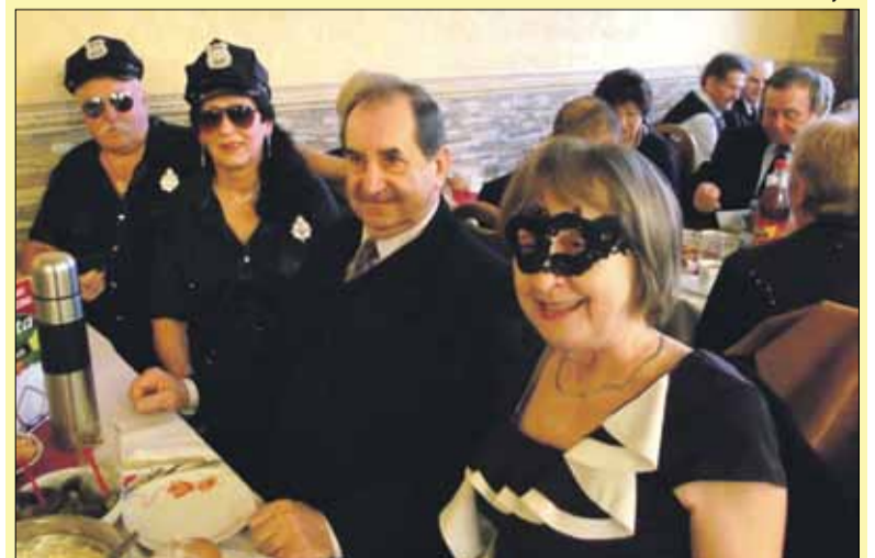
Na zabawie nie mogło zabraknąć odpowiednich ubiorów