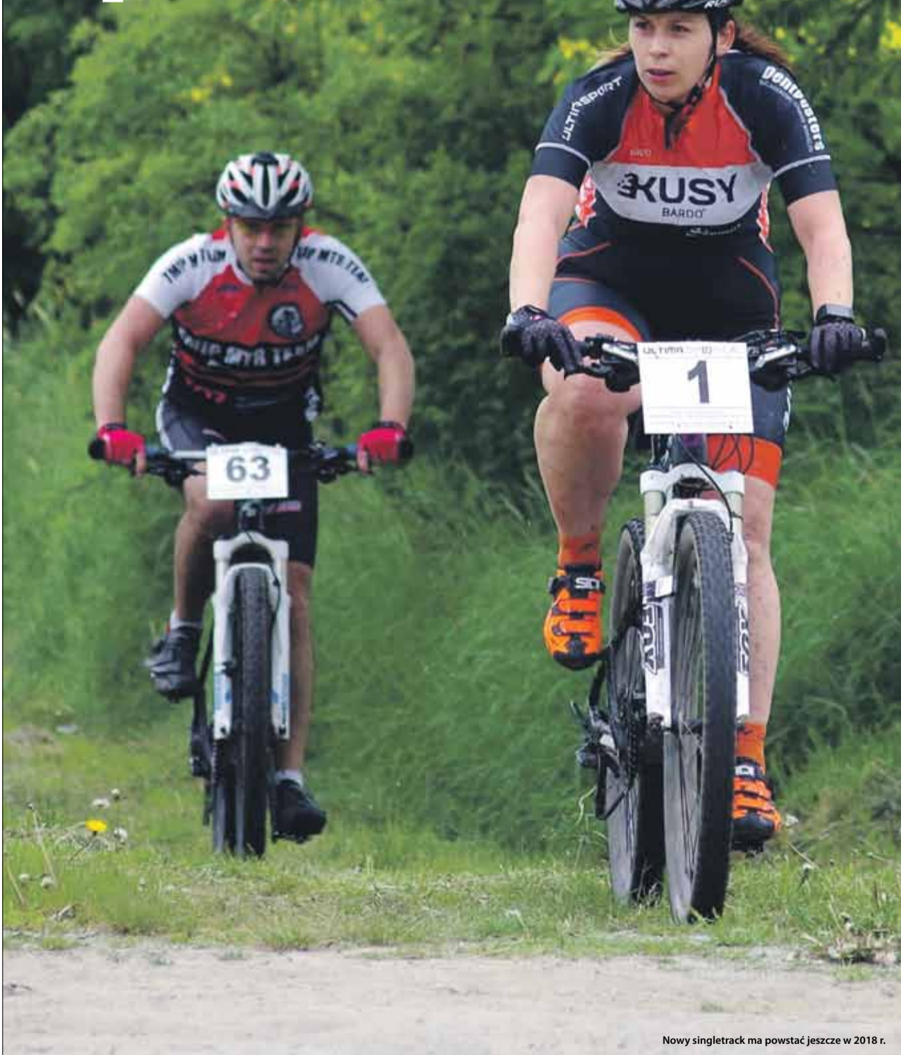
Nowy singletrack ma powstać jeszcze w 2018 r.

Już w 2018 roku turystyczno-rekreacyjna oferta gminy Strzelin poszerzy się o pierwszy odcinek „singletracka”. Docelowa długość planowanej gminnej sieci „singletracków”, która ma być w przyszłości główną atrakcją Wzgórz Strzelińskich, to blisko 10 kilometrów.