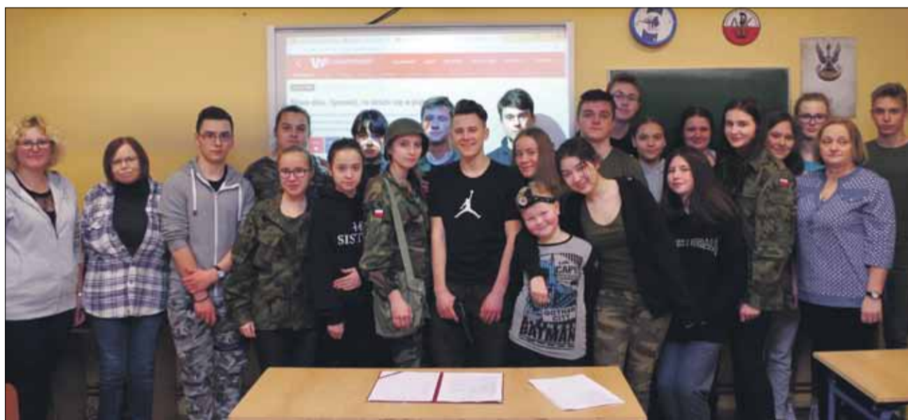
Uczestnicy nocy historycznej na pamiątkowym zdjęciu