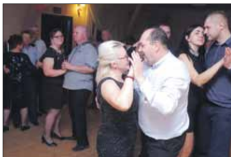
Zabawa trwała do białego rana