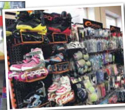
Oprócz artykułów papierniczych i zabawek klienci mogą także kupić w sklepie produkty sportowe