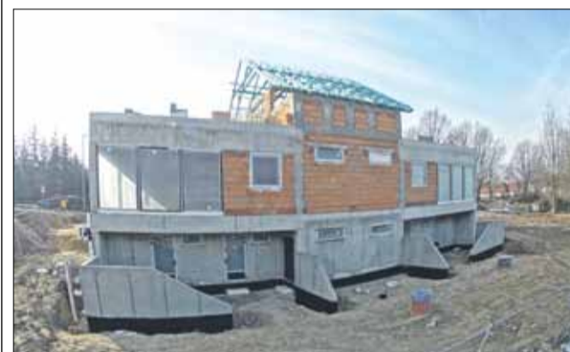
Budowa budynku rekreacyjnego jest już mocno zaawansowana

Ośrodek Wypoczynkowy w Białym Kościele już od miesięcy jest wielkim placem budowy. W 2018 roku strzeliński samorząd, poprzez gminną spółkę – Strzelińskie Centrum Sportowo-Edukacyjne – zainwestuje tam kolejne, bardzo poważne środki.