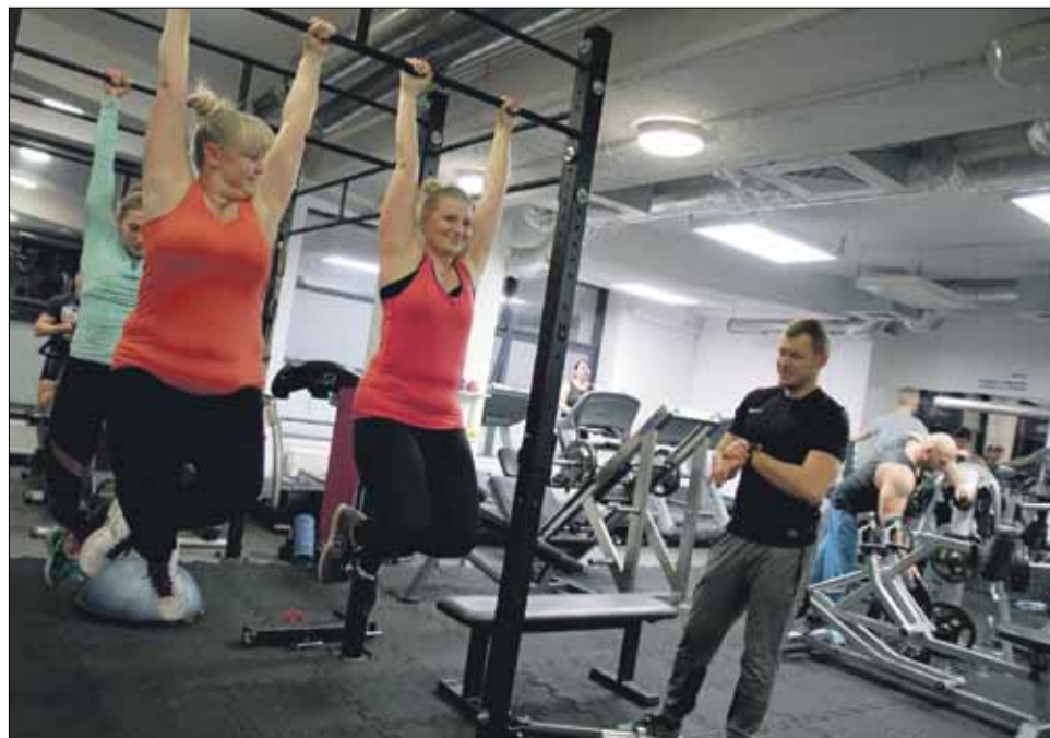
W turnieju przewidziano kilka różnych konkurencji