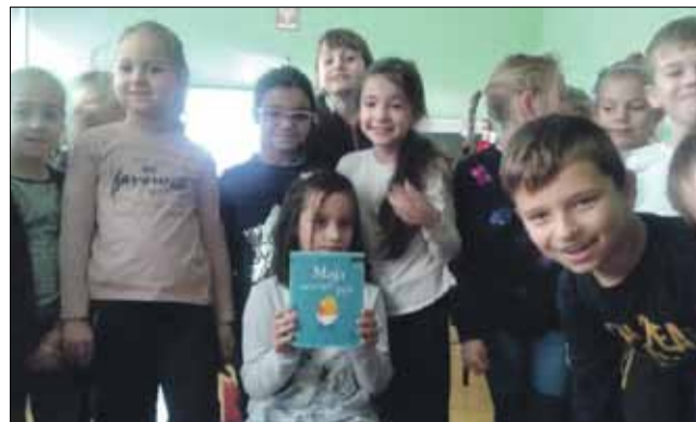
Publiczna Szkoła Podstawowa nr 4 w Strzelinie skorzystała niedawno z Narodowego Programu Rozwoju Czytelnictwa

ki z cyklu „Tomek Łębski”, „Dziennik cwaniaczka”, serię Star Wars, Lego, Nela Mała Reporterka, serię „W Kratkę”, „Kroniki Archeo”, sporo książek przygodowych, tj. „Magiczne Drzewo”, „Najfutbolniejszy”, „Matylda”, „Doktor Proktor”, książki detektywistyczne dla starszych czytelników, jak seria „Clue”, czy „Dawid i Larisa”, a także książki popularnonaukowe m.in. o roślinach, zwierzętach, odkryciach, środkach transportu, fantastykę, bajki, wśród których największą popularnością cieszą się te z serii „Charlie i Lola”, „Franklin” oraz „Złota Księga Bajek”, książeczki do nauki i doskonalenia techniki czytania z serii pt. „Czytam Sobie” oraz spory zasób komiksów. Wiele z tych pozycji jak np. seria Minecraft nie zagrzewa miejsca na półce. Prowadzimy zapisy wypożyczeń, ponieważ jest tylu chętnych – podkreśla. W bogatym zbiorze bibliotecznym nie brakuje także atlasów czy książek z literatury obyczajowej dotyczących np. miłości, relacji rodzinnych i przyjacielskich, złości, odwagi, lęku. Jak zauważa bibliotekarka,