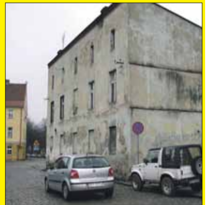
Budynek komunalny przy skrzyżowaniu ulicy Pocztowej z ul. Jana Pawła II za kilka miesięcy zostanie wyburzony

Wracamy do sprawy wyburzenia budynku komunalnego przy skrzyżowaniu ul. Jana Pawła II i ul. Pocztowej w Strzelinie. Budynek jest w złym stanie technicznym i jego remont jest nieopłacalny. Obecnie gmina Strzelin przygotowuje dokumentację, następnie zwróci się do Starostwa Powiatowego w Strzelinie o pozwolenie. Warto podkreślić, że budynek stoi już pusty. Dwie rodziny,