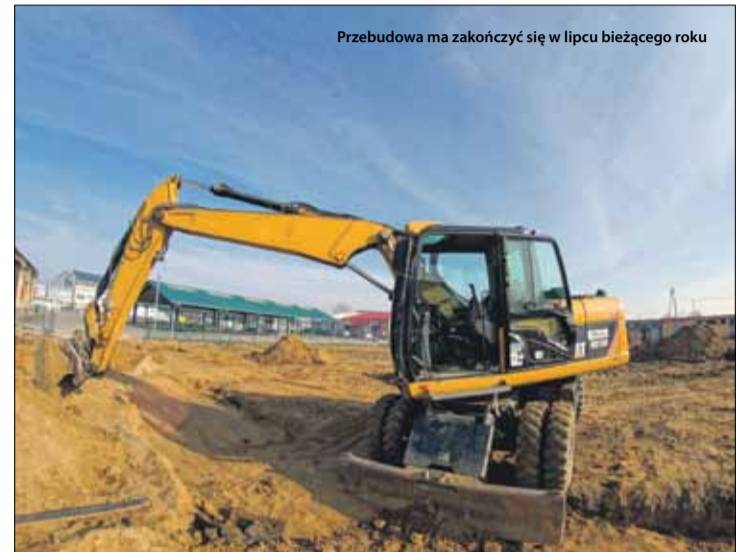
Przebudowa ma zakończyć się w lipcu bieżącego roku

Przypomnijmy, że inwestycja warta ponad 2 mln zł zakłada m.in. budowę 108 stanowisk handlowych, wykonanie instalacji oświetleniowej oraz elektrycznej części targowiska, instalacji wodociągowej, przyłączy kanalizacji deszczowej, ogrodzeniu terenu, dróg, chodników, miejsc postojowych, montaż śmietników oraz stojaków na rowery. Ponadto przebudowany zostanie budynek gospodarczo-socjalny, wycięte będą także dwa drzewa. Na sfinansowanie zadania gmina Strzelin otrzyma dofinansowanie (ponad 990 tys. zł). Środki pochodzą z Programu Rozwoju Obszarów Wiejskich na lata 2014-2020. Przebudowa ma zakończyć się w lipcu bieżącego roku. Do tego czasu stara część targowiska będzie zamknięta, a handel będzie odbywał się na parkingu przy Aquaparku Granit w Strzelinie.