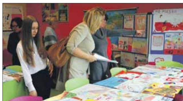
Goście wernisażu skorzystali z okazji, aby zobaczyć cały plon konkursu, którego nie mogła objąć ekspozycja

teżny żubr, czasem dumny ptak orzeł, a czasem mityczny feniks, który przecież powstał z popiołów i dlatego może być symbolem odrodzonej Polski. Niektóre prace są wyrazem zachwytu nad pięknem polskich Tatr a inne sławią urodę i barwność strojów ludowych. Zdarzają się obrazy zwycięskiej bitwy, to znów przywołane zostały zabytkowe budowle czy postaci wybitnych Polaków. Za każdym razem powstał wzruszający przekaz plastyczny o wydźwięku patriotycznym. Bowiem mimo różnych motywów – nośników polskości w indywidualnym rozumieniu autorów prac, to każdy z nich stworzył pełną ciepła i serdeczności wizualną opowieść o swojej Ojczyźnie. Trzeba przyznać, że nasi młodzi artyści nie mieli łatwego zadania. Należało przemyśleć temat, znaleźć dla niego syntetyczną ideę lub uogólniającą metaforę, zaś na koniec postarać się o adekwatną formę obrazowania. Tu ważny był pomysł, wrażliwość estetyczna, no i sprawność warsztatowa. Temu zadaniu podolali przede wszystkim laureaci wyłonieni przez jury pod przewodnictwem artysty - Bogusława Szychowiaka: