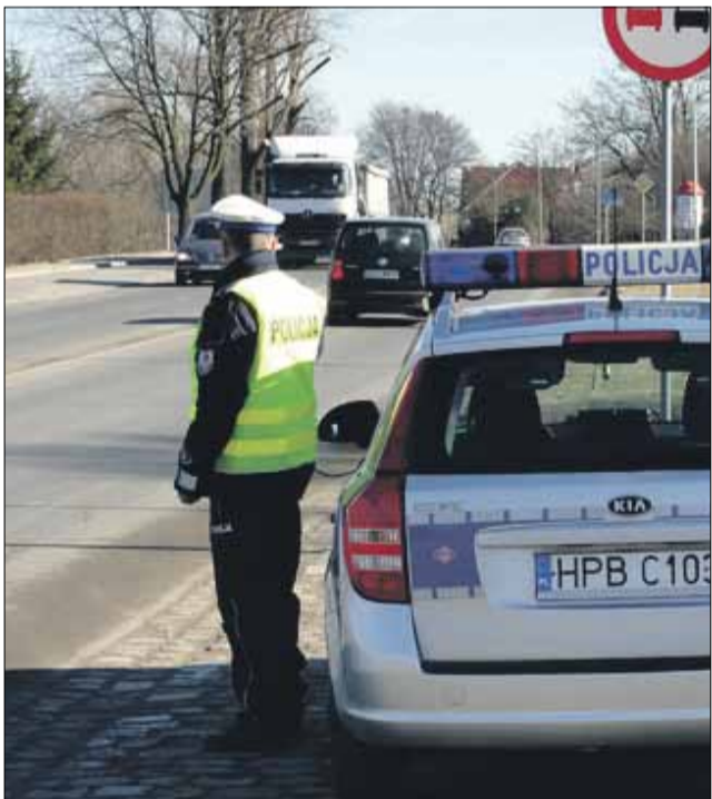
W ramach przeprowadzonej akcji policjanci skontrolowali 212 zmotoryzowanych

Na początku lutego policjanci ze strzeelińskiej drogówki przeprowadzili na drogach powiatu strzeelińskiego działania pn. „Niebezpieczne ProMile”. Brało w nich udział sześciu policjantów, którzy skontrolowali 212 zmotoryzowanych (w tym 44 kierowców samochodów ciężarowych i 2 kierujących autobusami). – W wyniku działań funkcjonariusze nałożyli sześć mandatów (łącznie na 600 zł) i zatrzymali jeden dowód rejestracyjny – informuje asp.szt. Ireneusz Szalajko z Komendy Powiatowej Policji w Strzelinie.