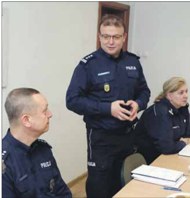
W odprawie uczestniczył m.in. zastępca Komendanta Wojewódzkiego Policji we Wrocławiu (w środku)

poszukiwanych. Strzeelińscy policjanci doskonale wiedzą, że ich skuteczność zależy m.in. od bliskiej współpracy z lokalną społecznością. Dlatego często i chętnie organizują spotkania z mieszkańcami (np. dotyczące prewencji). Takich spotkań odbyło się w 2017 roku aż 379. Nasi policjanci oraz sami mieszkańcy aktywnie korzystają z nowoczesnych narzędzi przyczyniających się