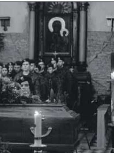
niowie klasy mundurowej i poczet sztandarowy Związku