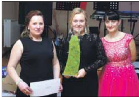
Organizatorzy przygotowali sporo licytacji