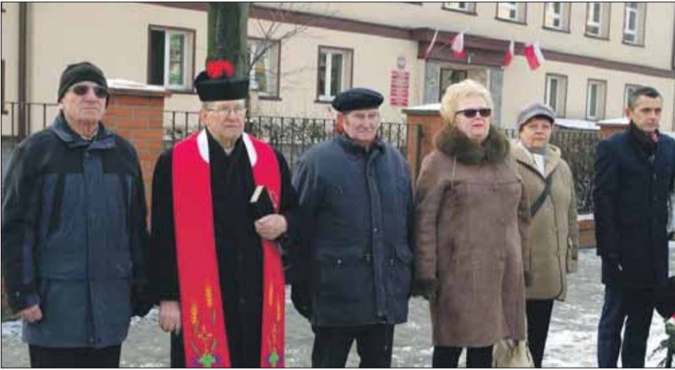
Pod obeliskiem Sybiraków stawiły się liczne oficjalne delegacje

Projekt zakłada wiele różnych wydarzeń w ciągu roku