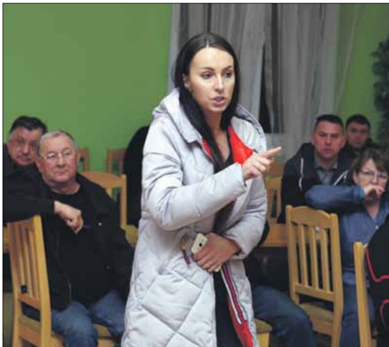
Mieszkańcy zgłosili sporo spraw i problemów

Bieżącym sprawom sołectwa oraz planowanym inwestycjom było poświęcone spotkanie w Pławnej, zorganizowane we wtorek, 13 lutego w miejscowej świetlicy.