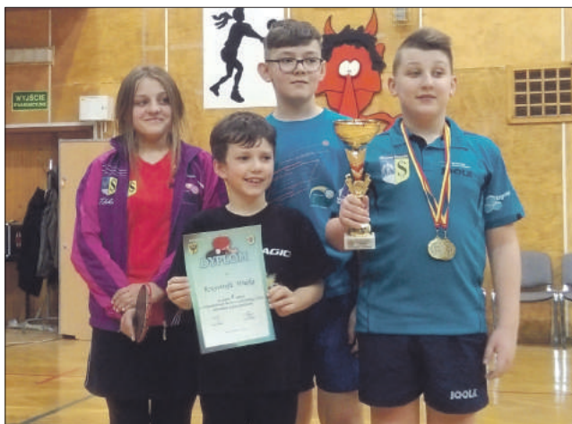
Zawodnicy TKS Granit Strzelin po raz kolejny dobrze spisali się podczas ważnych zawodów