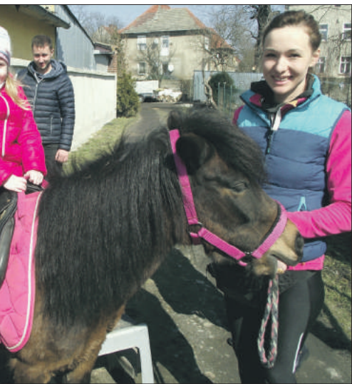
da atrakcją dla maluchów