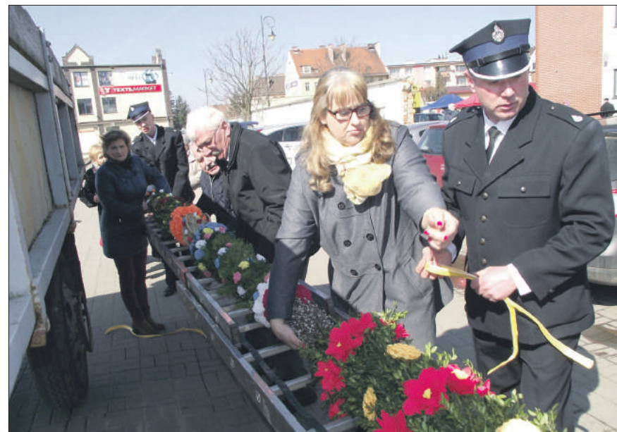
Mieszkańcy Pławnej przygotowali na konkurs największą palmę wielkanocną, która mierzyła ponad 7 metrów