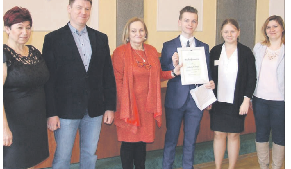
W uroczystej inauguracji uczestniczyli m.in. przedstawiciele władz samorządowych