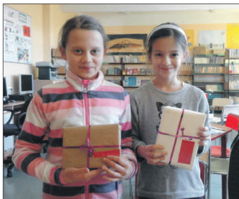
Na uczniów czekały przygotowane książki i niespodzianki

W piątek, 9 marca w Publicznej Szkole Podstawowej nr 4 w Strzelinie odbyła się akcja biblioteczna pod hasłem „Randka w ciemno z książką”. Na uczniów z klas 4-7 czekały przygotowane książki – niespodzianki, opakowane w szary papier i zaopatrzone jednym krótkim opisem dotyczącym treści. Na „randkę” z czytelnikiem czekały różne książki. Akcja cieszyła się dużym zainteresowaniem, a najbardziej zadowoleni byli uczniowie lubiący podejmować ryzyko, odkrywać tajemnice... i czytać.