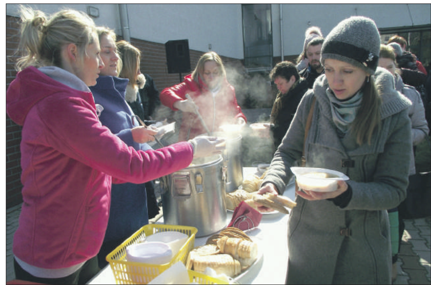
Tradycją Jarmarku Wielkanocnego jest serwowany żur