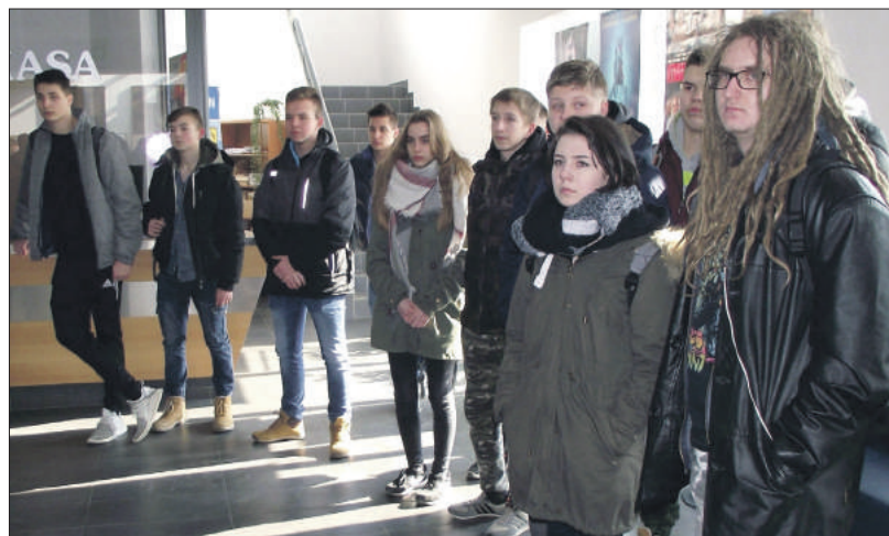
Podczas otwarcia wystawy obecni byli głównie uczniowie