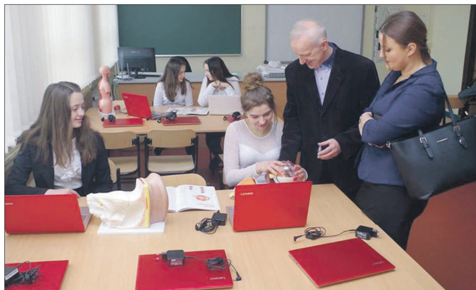
Uczniowie będą korzystać z wielu urządzeń

kwasomierze glebowe, kolekcja podstawowych skal, model powierzchni ziemi, modele ukształtowania terenu w przekrojach, mikroskopy, preparaty mikroskopowe, fartuchy, okulary i rękawice ochronne, lornetki, zestawy do badania wody, gleby, powietrza, mini szklarnia, umożliwiająca obserwację wzrostu roślin w klasie, wagi elektroniczne, model anatomiczny człowieka, zestawy brył geometrycznych oraz plansze interaktywne z zagadnień matematycznych. Do sali zakupiono też nowe stoły i krzesła szkolne, szafę na 30 laptopów, stojaki na mapy, tablice i stół demonstracyjny. Swoją „cegielkę” dołożyła również sama szkoła, która z własnego budżetu sfinansowała wymianę oświetlenia w pracowni. Warto podkreślić, że ten edu-