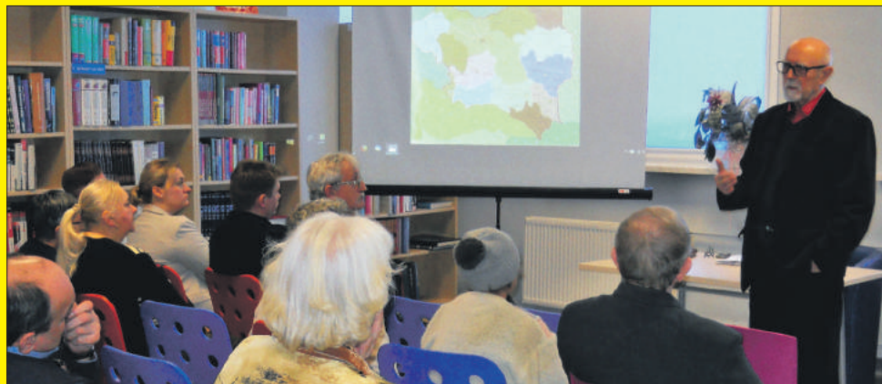
Prelegenta i słuchaczy połączyła emocjonalna więź wynikająca ze wspólnoty kresowej przeszłości

począwszy od prozy, poezji i dramatu poprzez krytykę literacką i publicystykę aż do podjęcia się roli scenarzysty. Na podstawie jednej z jego książek powstał głośny film Wojciecha Smarzowskiego „Wołyń”. Obecność takiego gościa podkreśliła charakter uroczystości rocznicowych i wniosła istotne walory poznawcze. Pochodzący z kresów autor z dużym zapałem zagadnienia, ale i w osobistej tonacji opowiadał o tamtej trudnej rzeczywistości. Dla