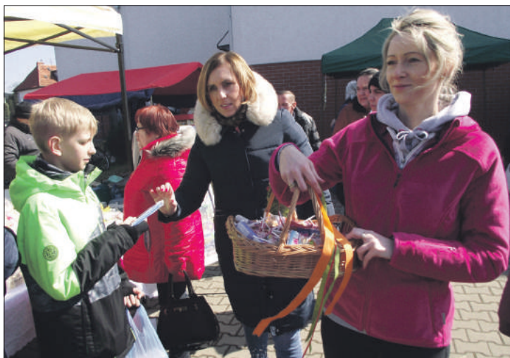
Na słodkie upominki ufundowane przez Strzeliński Ośrodek Kultury mogli liczyć najmłodszy

W programie jarmarku znalazło się również dużo innych atrakcji. Najmłodszy mieli okazję na przejażdżkę kucykiem, które zapewnił klub jeździecki Pony-klub z Wrocławia. Dodatkowo dzieci wspólnie z animatorem Strzelińskiego Ośrodka Kultury szykowali palmę wielkanocną na konkurs. Odbyła się także zabawa pn. „W poszukiwaniu czekoladowych jajeczek”, a rodzice z dziećmi mogli przygotować wielkanocne ozdobne jajka czy prace plastyczne. Dla spragnionych przygotowano tradycyjnie żur, którego wykonaniem zajęła się strzelińska restauracja „Sesam”. Chętni mogli również kupić gadżety (breloki, kubki, magnesy) z wizerunkiem naszego miasta, zwiedzić wystawę afrykańską w sali SOK-u, a nawet przejechać się nowym pojazdem komunikacji miejskiej, która już niedługo zostanie uruchomiona w gminie Strzelin. Nowym akcentem była Strzelińska Karta Świąteczna, na której każdy mógł wpisać życzenia (więcej o tym w artykule obok).