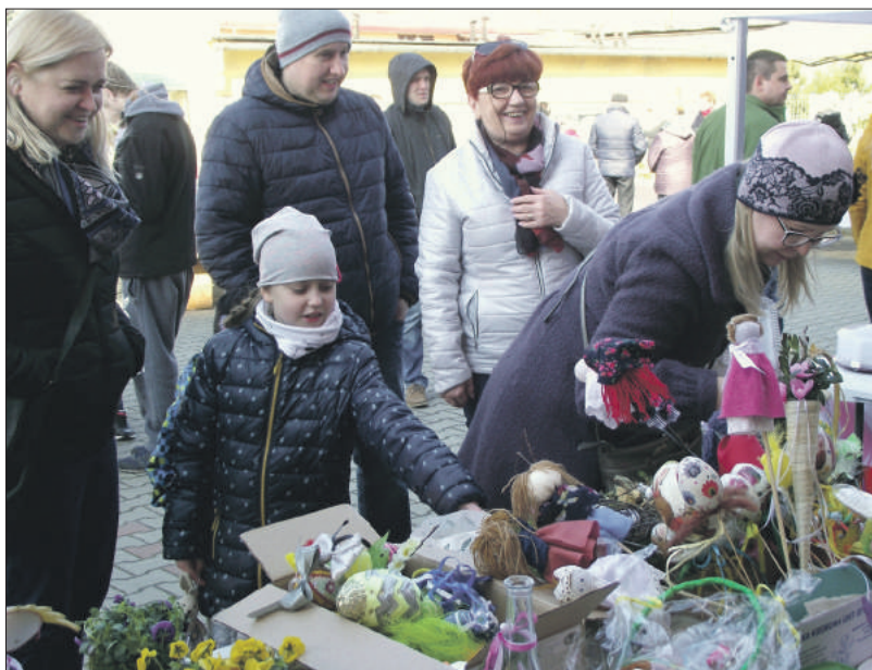
Wypełnione stoiska asortymentem nawiązującym do świąt cieszyły się sporym zainteresowaniem mieszkańców