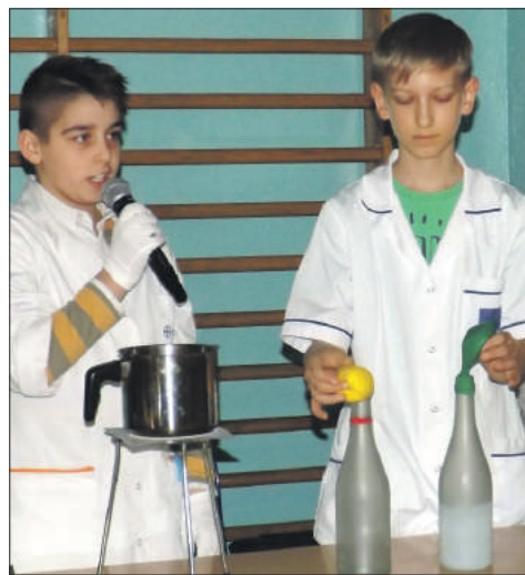
Uczniowie przedstawiali różne doświadczenia i eksperymenty