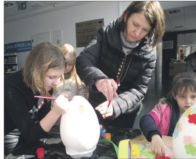
Rodzice wspólnie z dziećmi brali udział w różnych zajęciach animacyjnych