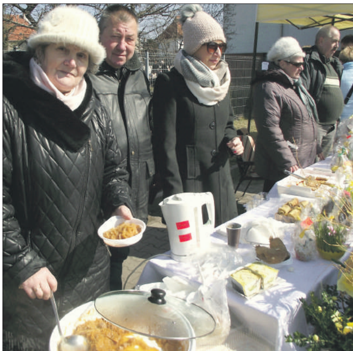
Koło Gospoń Wiejskich z Białego Kościoła proponowało m.in. pyszny bigos