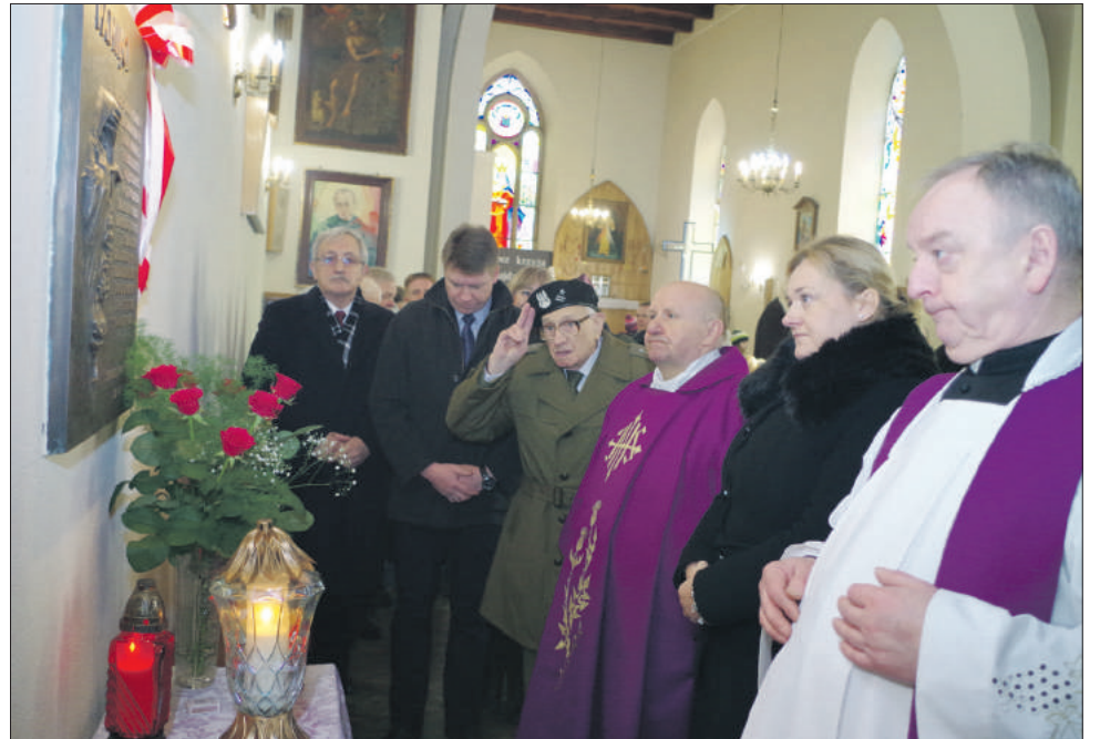
Po mszy złożono kwiaty i znicze pod epitafium

bliskich. Strzeleńskie obchody rocznicowe już tradycyjnie miały również element świecki, którym było spotkanie autorskie ze znanym pisarzem Stanisławem Srokowskim. Więcej o tym wydarzeniu piszemy na stronie 10 w artykule pt. „PAMIĘĆ O KRESACH WEDŁUG SROKOWSKIEGO”