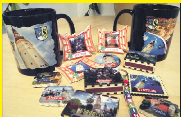
Strzeliński Ośrodek Kultury zachęca do zakupu unikatowych pamiątek z wizerunkiem naszego miasta