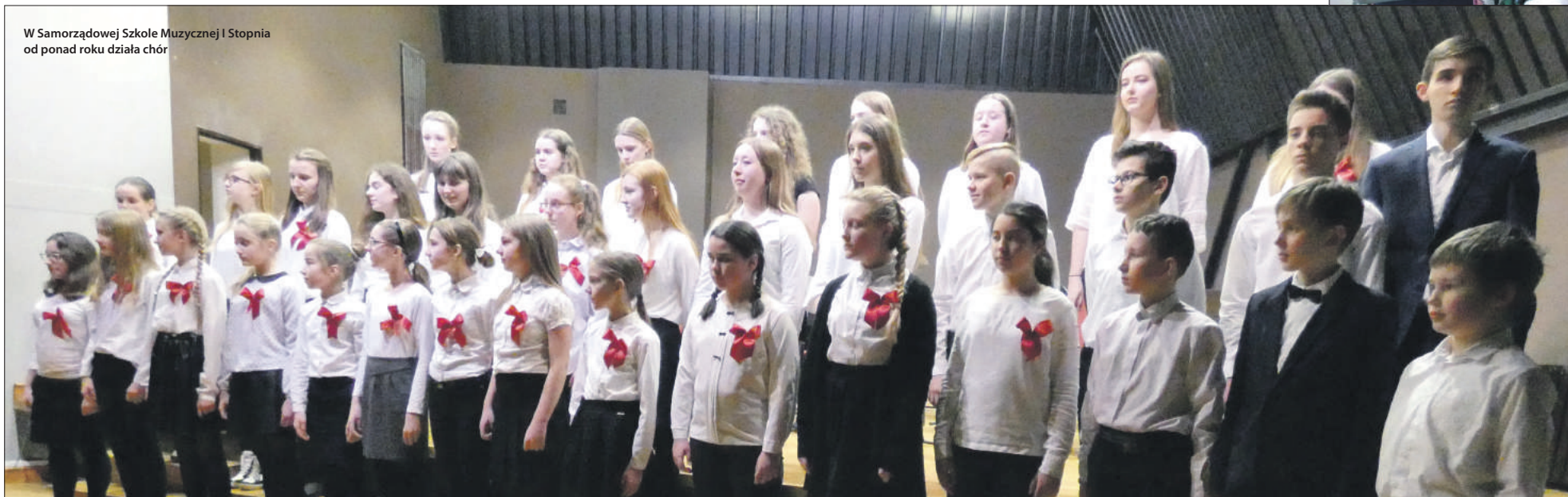
W Samorządowej Szkole Muzycznej I Stopnia od ponad roku działa chór