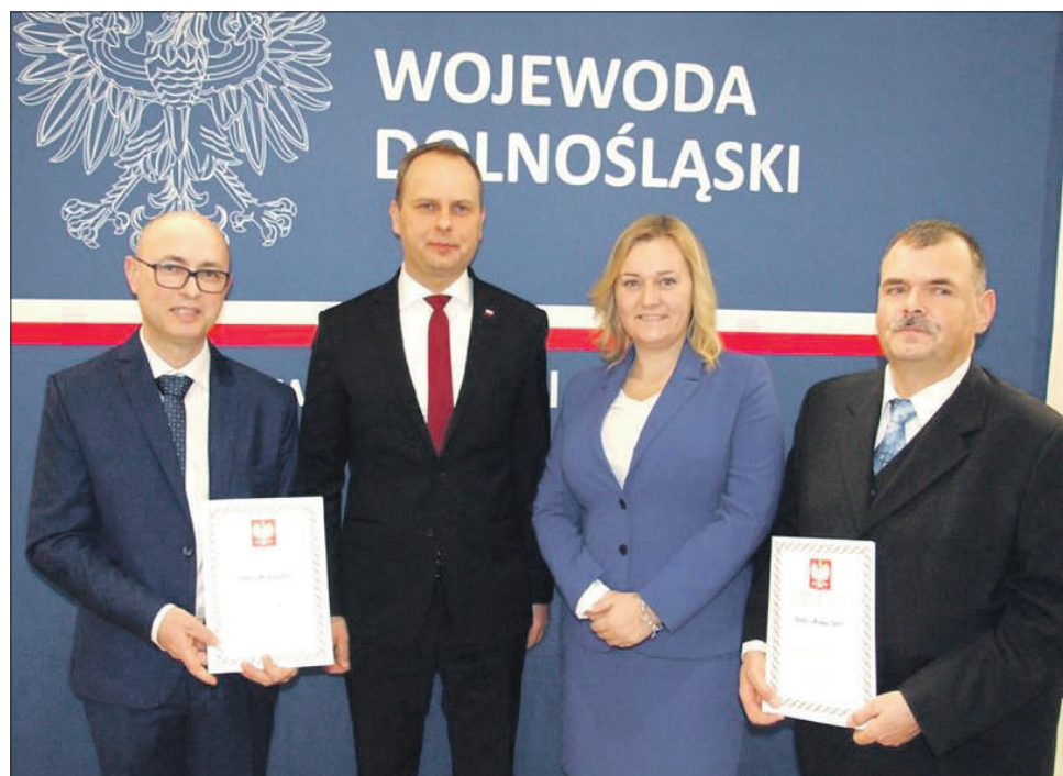
Pamiętkowe zdjęcie z uroczystej gali