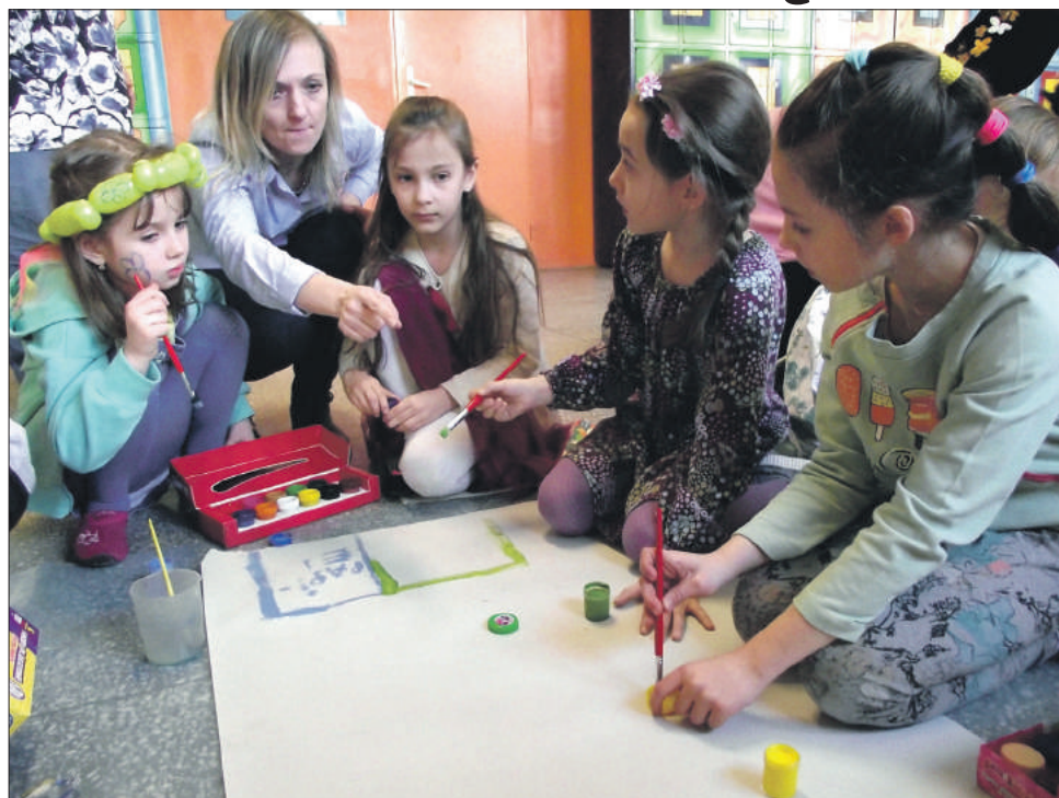
Podczas Szkolnego Festiwalu Nauki uczniowie mieli wiele zadań do wykonania

W środę, 21 marca w Publicznej Szkole Podstawowej nr 5 w Strzelinie odbył się Szkolny Festiwal Nauki. Wydarzenie zorganizowano w ramach programu grantowego „Żywiec - Zdrój S.A.” pod nazwą „Inicjatywy po STRONIE NATURY”. Był to dzień szczególny, w którym uczniowie mogli podzielić się szeroką wiedzą z kolegami i koleżankami w czasie licznych prezentacji i wystąpień. Dzieci z klas IV i V zaprezentowały młodszym klasom swoje zwierzęta (psy, koty, króliki) a także hobby i zainteresowania, co w najmłodszych wzbudziło wielką radość i ogromne zainteresowanie. Uczestnicy koła przyrodniczego przedstawili na forum klas 4-6 oraz licznie przybyłych rodziców i dziadków doświadczenia i eksperymenty pozwalające odpowiedzieć na pytanie „Dlaczego balon lata?” Wszyscy razem sprawdzili w praktyce zdobytą wiedzę, gdy w sali oraz na boisku szkolnym wypuścili w powietrze wielki balon wykonany z bibuły. Rodzice wzięli także udział w rodzinnym turnieju wiedzy przyrodniczo-ekologicznej i wspólnie z dziećmi rozwiązywali nietrudne łamigłówki, zagadki, zadania z dziedziny ekologii i przyrody oraz zjawisk nią rządzących. Najmłodszy przedstawiał techniką kolażu wylosowane hasło związane z ochroną przyrody. Mieli również możliwość obejrzenia animacji komputerowych, krótkich filmików ilustrujących właściwe postawy ekologiczne i rozwiązać quizy. Dyrekcja PSP nr 5 w Strzelinie dziękuje wszystkim uczestnikom festiwalu za zaangażowanie.