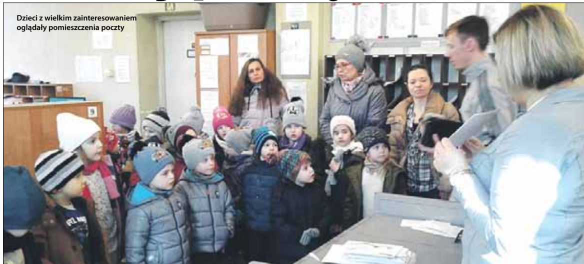
Dzieci z wielkim zainteresowaniem oglądały pomieszczenia poczty

Niedawno dzieci z grupy „Miśków” oraz „Poziomek” Przedszkola Miejskiego w Strzelinie wybrały się na pocztę. Celem wycieczki było zapoznanie z instytucją i pracą listonosza. Dzieci poznały zakres usług pocztowych, zadania jakie spełnia urząd oraz dowiedziały się, jak po-