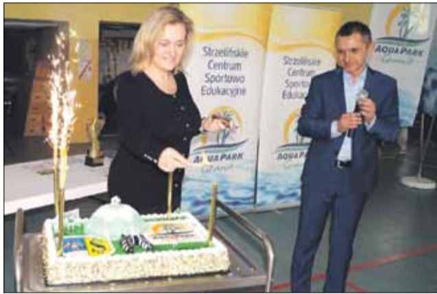
Podczas wręczenia nagród na zawodników czekała słodka niespodzianka

W niedzielę, 4 marca w hali sportowej Publicznej Szkoły Podstawowej nr 3 w Strzelinie rozegrano Turniej Mistrzów Halowej Ligi Piłki Nożnej. Tego dnia odbyła się również gala wręczenia nagród dla zwycięzców XV edycji Halowej Ligi Piłki Nożnej.