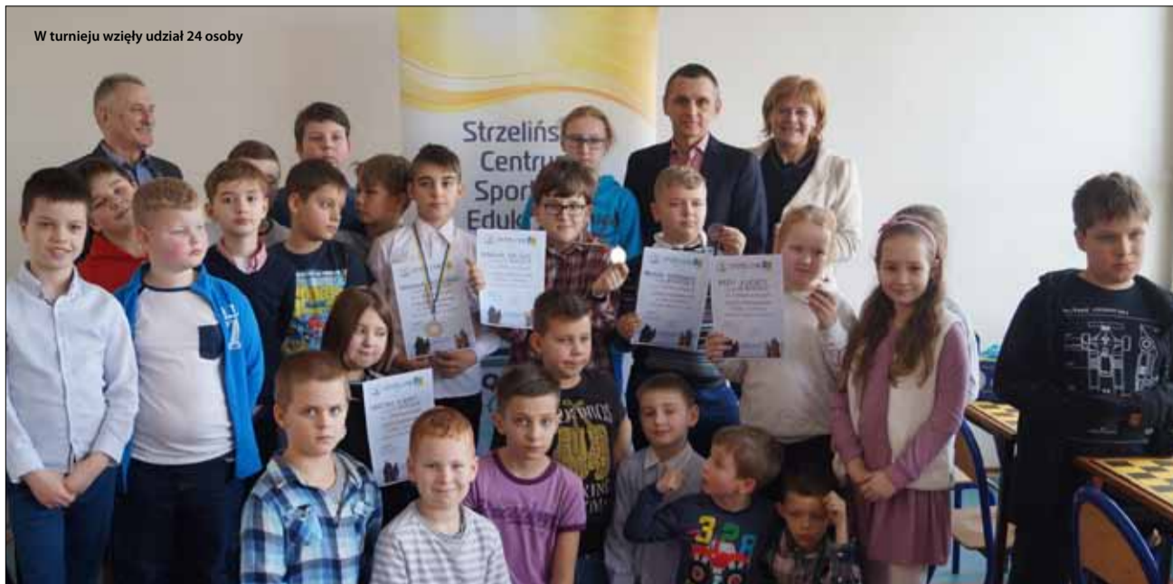
W turnieju wzięły udział 24 osoby