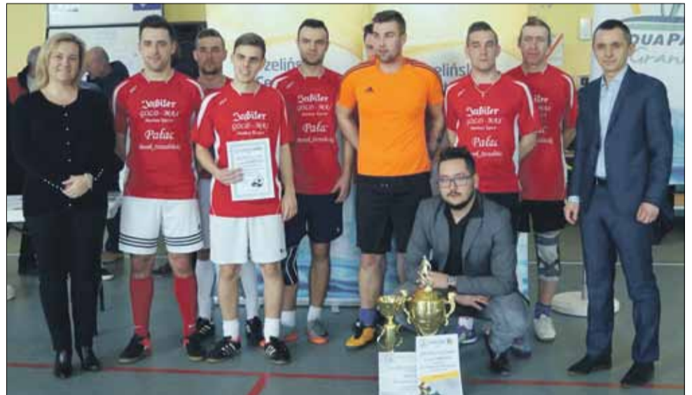
Zdecydowanym zwycięzcą tegorocznych rozgrywek została drużyna FMS Jubiler Goldmax, zdobywając komplet punktów