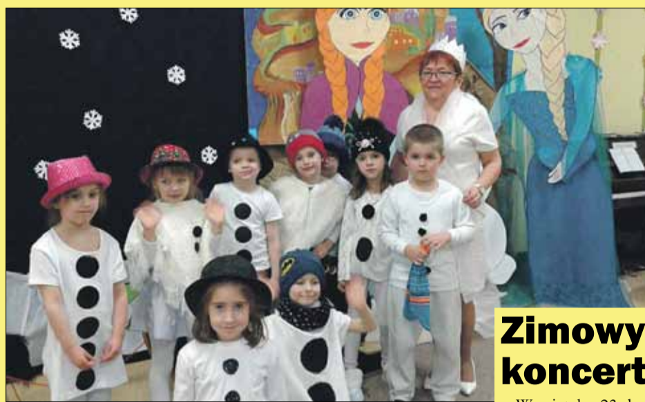
Przedzkolaki miały stroje odpowiednie do zimowego koncertu