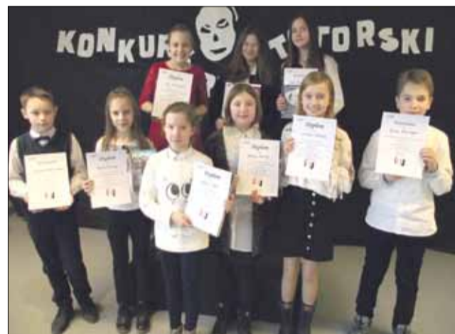
Nagrody dla uczestników (książki i dyplomy) ufundował Strzeliński Ośrodek Kultury