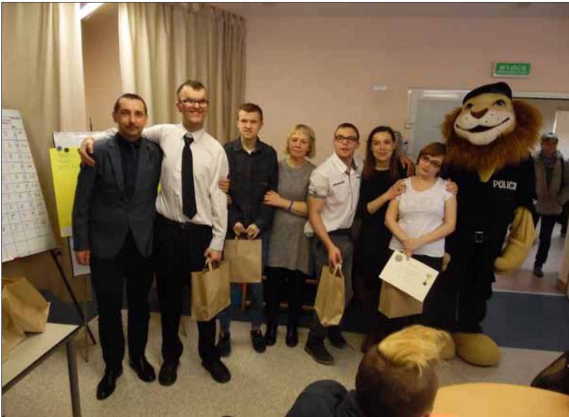
W turnieju wzięła udział młodzież z placówek oświatowych powiatu strzeleńskiego i gminy Kąty Wrocławskie