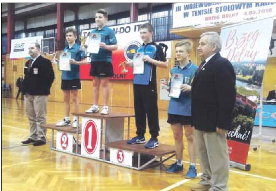
Dwóch zawodników z klubu TKS Granit Strzelin stanęło na najwyższych stopniach podium