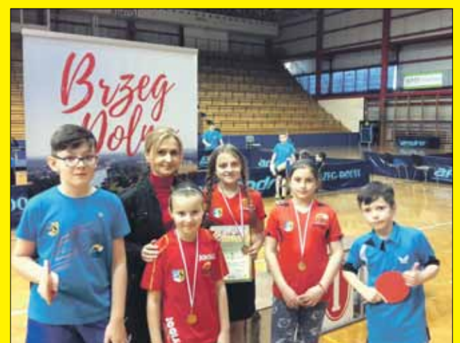
W turnieju w Brzegu Dolnym wzięli udział uczniowie PSP nr 4 w Strzelinie