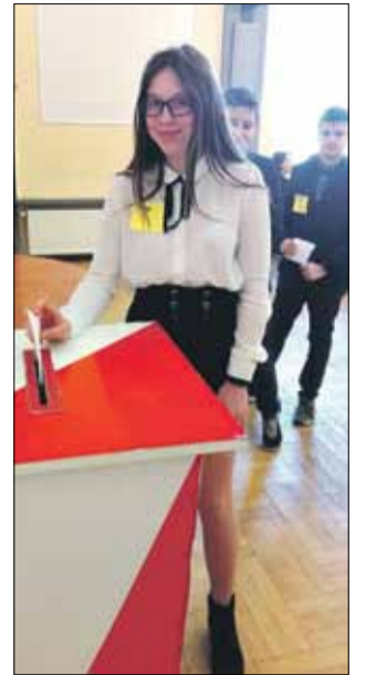
Głosowanie, które wyłoniło przedstawicieli Młodzieżowej Rady Gminy, było tajne

Nowi radni dołączyli do ogólnopolskiego progra-