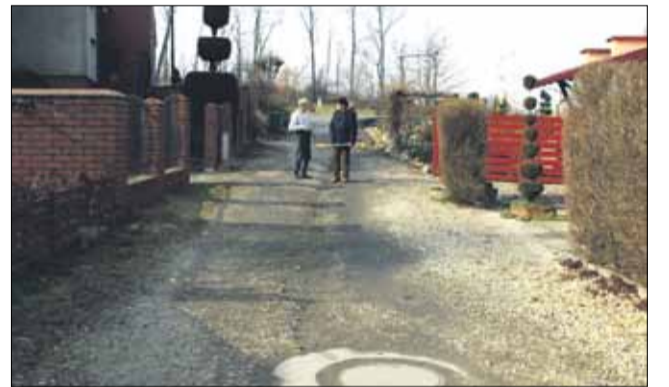
Droga gminna w Szczodrowicach jest jedną z tych, które czeka w najbliższym czasie remont

Remont ulicy Brzozowej w Gęsińcu (ok. 130 mb), który obejmuje w szczególności: wy-