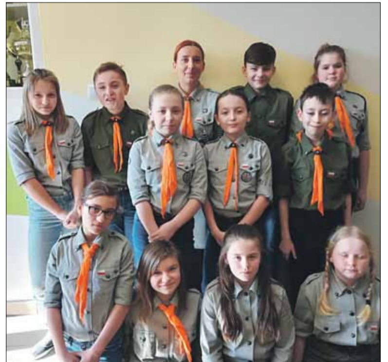
Dzień Myśli Braterskiej to ważne wydarzenie dla każdego harcerza (na zdjęciu drużyna harcerska „Ogniki” działająca przy PSP w Białym Kościele)