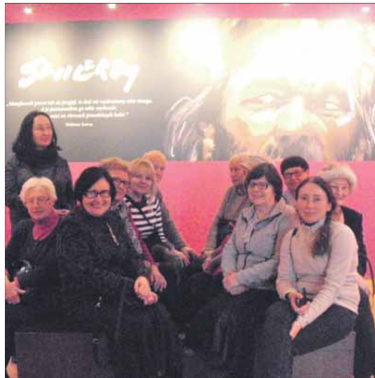
Nowy poczet władców polskich zaskakiwał odkrywczym ujęciem pozornie znanych postaci historycznych.

Bywalcy naszego Saloniku Artystycznego, to prawdziwi miłośnicy sztuki, skoro unieśli aż potrójną dawkę estetycznych doznań. Odwiedzając muzea wrocławskie, zobaczyli 3 interesujące wystawy czasowe, na których można było odkryć nowe oblicza piękna, ale też zaskoczyć się złamaniem stereotypów na temat polskich władców, wreszcie – zakosztować chińskiej egzotyki.