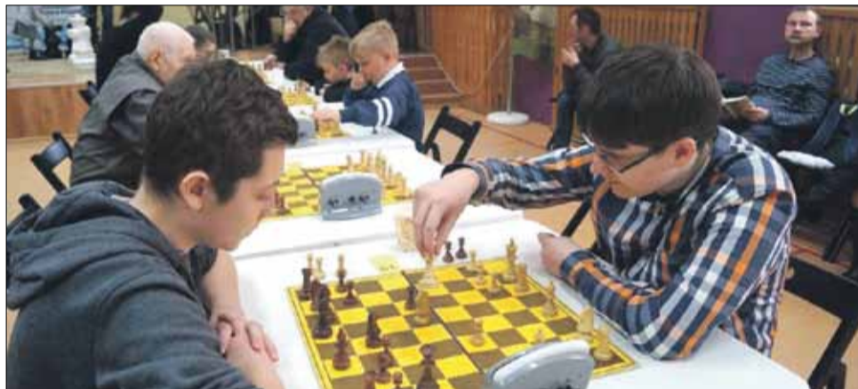
W pierwszej edycji turnieju rywalizowało ponad 40 zawodników

W sobotę, 17 marca o godzinie 10:00 w auli Publicznej Szkoły Podstawowej nr 3 w Strzelinie odbędzie się druga edycja memoriału szachowego poświęconego pamięci znanego strzeleńskiego szachisty Zbigniewa Chomickiego, nad którym honorowy patronat objęła Burmistrz Miasta i Gminy Strzelin Dorota Pawnuć.