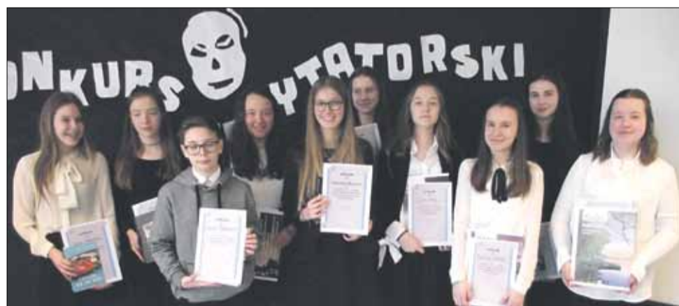
Oto laureaci 63. Dolnośląskiego Konkursu Recytatorskiego dla siódmych klas szkół podstawowych i gimnazjów