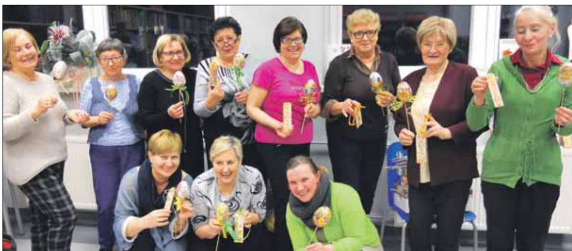
Warsztaty dekupażu sprawiły, że uśmiech nie zniknął z twarzy uczestniczek