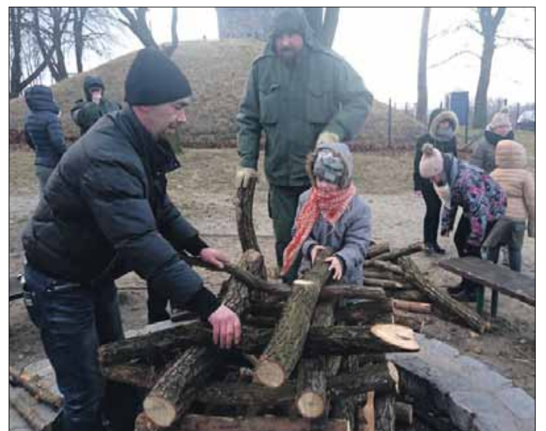
Spotkanie przy ognisku to nieodzowny element harcerskiej przygody