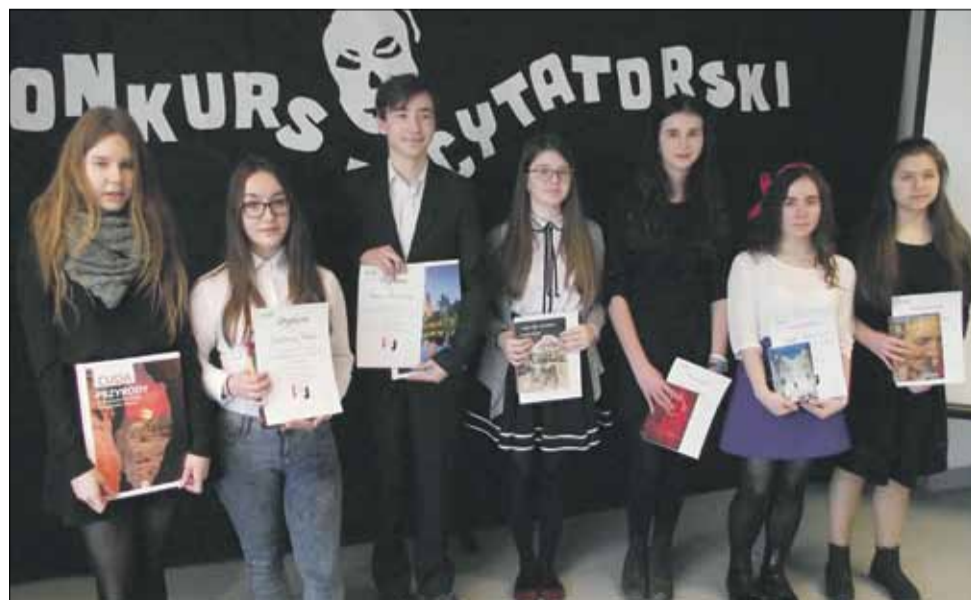
W eliminacjach 23. Dolnośląskiego Konkursu Recytatorskiego „Pegazik” dla siódmych klas szkół podstawowych i gimnazjów wzięło udział 19 uczestników