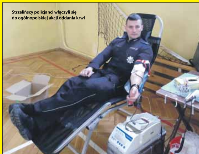
Strzełińscy policjanci włączyli się do ogólnopolskiej akcji oddania krwi

Dobroczynność i chęć niesienia pomocy potrzebującym - takie cele przyświecały osobom, które w ramach ogólnopolskiej akcji „SpoKREWnieni służbą” oddały krew. Zbiórka, w której wzięli udział strzełińscy policjanci odbyła się w sali gimnastycznej CKZiU w Strzelinie i została inaugurowana 1 marca w Narodowym Dniu Pamięci Żołnierzy Wyklętych. Ta data została wybrana nieprzypadkowo. To święto państwowe ustanowione na cześć żołnierzy zbrojnego podziemia antykomunistycznego, którzy przelewali krew w obronie niepodległości Polski. Obsługę przy pobieraniu krwi zapewnił personel medyczny Regionalnego Centrum Krwiodawstwa i Krwiolecznictwa we Wrocławiu z ulicy Czerwonego Krzyża.