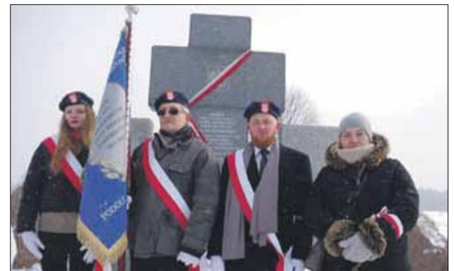
Poczet sztandarowy Stowarzyszenia Huta Pieniacka pod pomnikiem