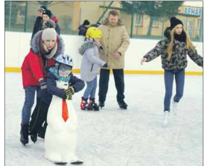
Dużą popularnością cieszyły się m.in. specjalne misio-chodziki

Zima powoli dobiega końca. Mimo iż to pierwszy sezon funkcjonowania lodowiska, to cieszyło się ono dużym zainteresowaniem wśród okolicznych mieszkańców. Od 3 grudnia 2017 roku obiekt odwiedziło blisko 9 tys. osób. Największą liczbę sprzedanych biletów stanowiły wejścia ulgowe (3400) oraz rodzinne (2600). Klienci najchętniej korzystali z lodowiska w styczniu, m.in. ze względu na ferie zimowe, podczas których zorganizowano „Zimową zabawę na lodzie”. W programie imprezy znalazły się liczne gry i konkursy m.in. slalom między pacholkami oraz jazda na czas. Ponadto największe obłożenie odnotowywano w weekendy. W tygodniu natomiast odbywały się zajęcia uczniów z pobliskich szkół, w ramach lekcji wf-u. W ofercie strzelińskiego lodowiska znalazło się wypożyczenie łyżew oraz kasków. Dużą popularnością cieszyły się także specjalne misio-chodziki, które miały