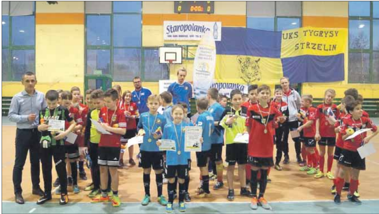
Podczas Halowego Turnieju Piłki Nożnej Dzieci młodzi piłkarze rywalizowali w trzech kategoriach

W ostatnią niedzielę lutego salę sportową Publicznej Szkoły Podstawowej nr 3 w Strzelinie wypełniły tłumy młodych piłkarzy. Wszystko za sprawą „Halowego Turnieju Piłki Nożnej Dzieci”, organizowanego przez Strzelińskie Centrum Sportowo-Edukacyjne. Zawodnicy rywalizowali w trzech kate-