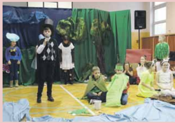
Uczniowie czwartych klas przedstawili różne baśnie