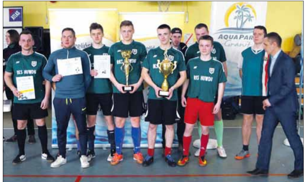
Drugie miejsce w tabeli rozgrywek zajęła drużyna RSK HUWDU