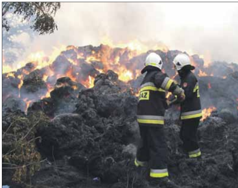
Strażacy otrzymują sporo zgłoszeń dotyczących pożarów ściernisk i nieużytków rolnych (fot. ilustracyjna)

Na polach trwają żniwa. Za naszym pośrednictwem Komenda Powiatowa Państwowej Straży Pożarnej w Strzelinie apeluje o niewypalanie ściernisk. W ostatnim czasie strażacy z naszego powiatu otrzymują sporo zgłoszeń dotyczących pożarów ściernisk i nieużytków rolnych. Niestety, większość z nich to celowe podpalenia. Z tym