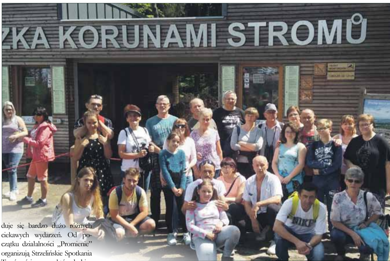
Stowarzyszenie organizuje w ciągu roku wiele wydarzeń, m.in. różne wycieczki krajoznawcze

Powstali blisko 17 lat temu i dla wielu byli ostatnią deską ratunku. Dzięki ich działalności życie wielu osób jak i rodzin zmieniło się o 180 stopni.