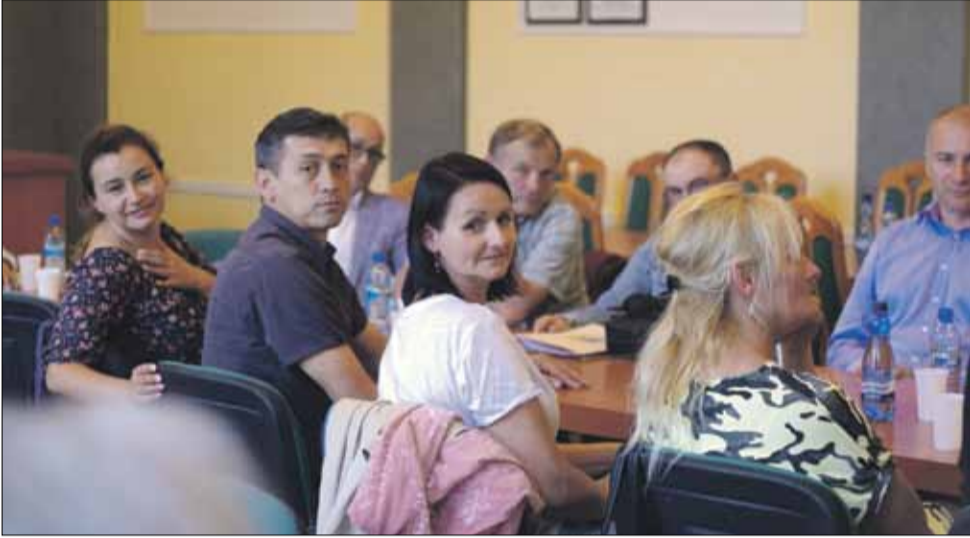
W spotkaniu licznie uczestniczyli sołtysy