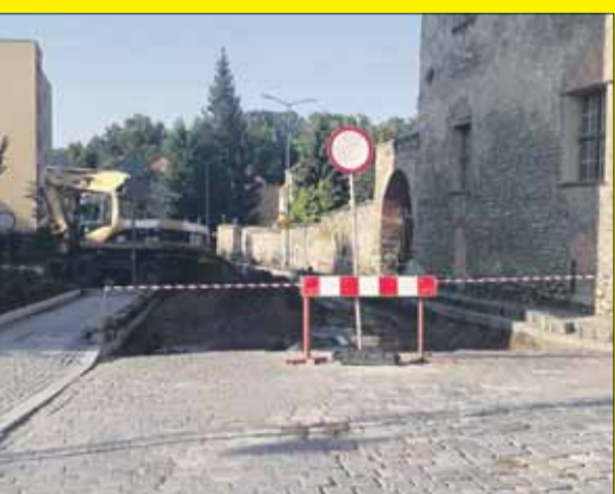
Pracownicy ruszyli prace na ul. Św. Floriana

Przebudowana zostanie zarówno kamienna nawierzchnia utwardzony parking przy przychodni weterynaryjnej. Dodatkowo przewidziano wykonanie chodnika i nowego oświetlenia drogowego ul. Św. Floriana