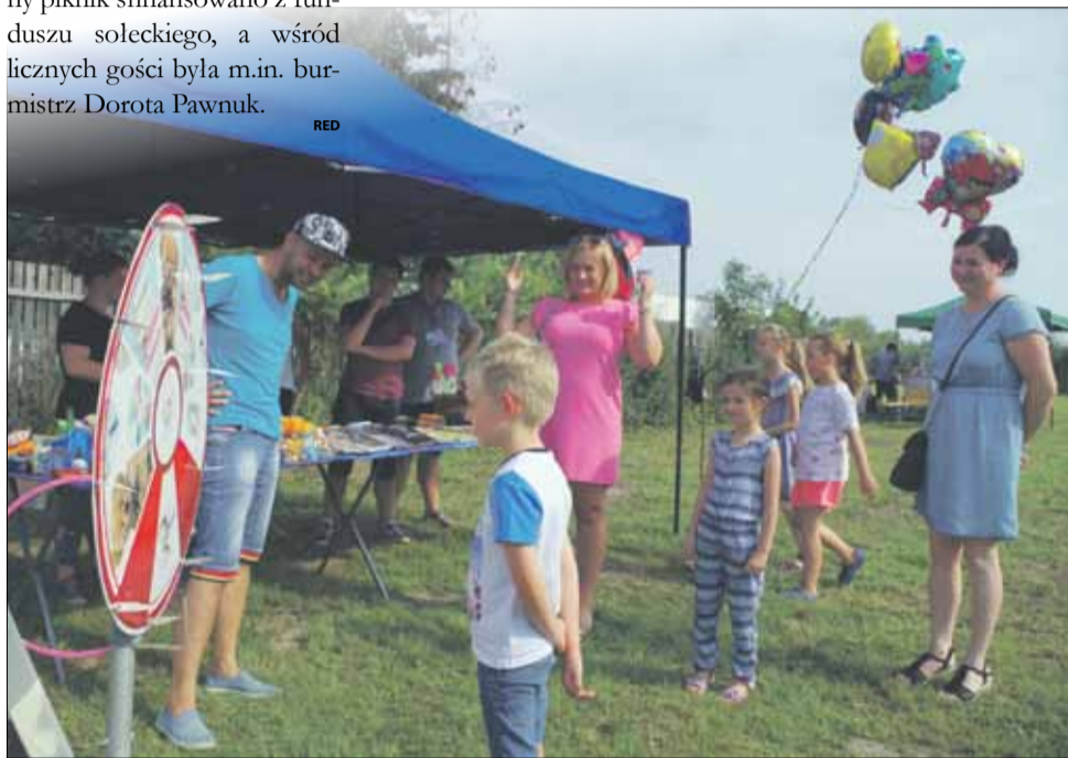
Na stoisku stowarzyszenia „Gramy o Życie” można było wygrać atrakcyjne nagrody