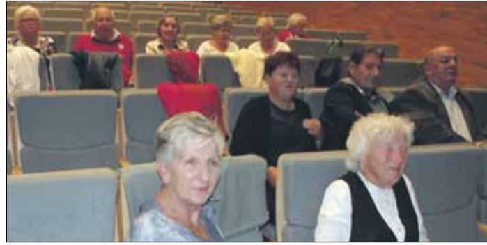
Seniorzy zadawali pytania dotyczące uruchomionej Strzełińskiej Komunikacji Publicznej