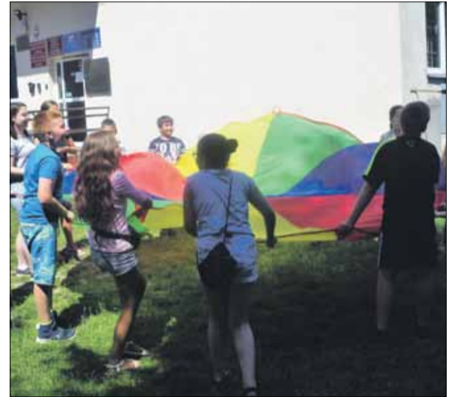
Chusta Klanzy animuje, integruje, a przede wszystkim daje radość wspólnej zabawy