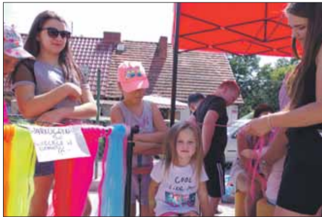
Wśród piknikowych atrakcji nie brakowało tych dedykowanych dla najmłodszych mieszkańców