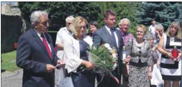
Po mszy złożono kwiaty i znicze pod pomnikiem Jana Pawła II