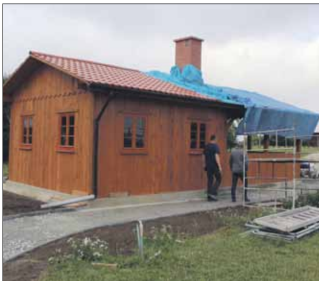
Prace w Chociwelu są już mocno zaawansowane

Na boisku w Chociwelu powstaje drewniana wiata rekreacyjna. Gminną inwestycję realizuje za ponad 152 tys. zł firma KURNATOWSKI z Nysy.