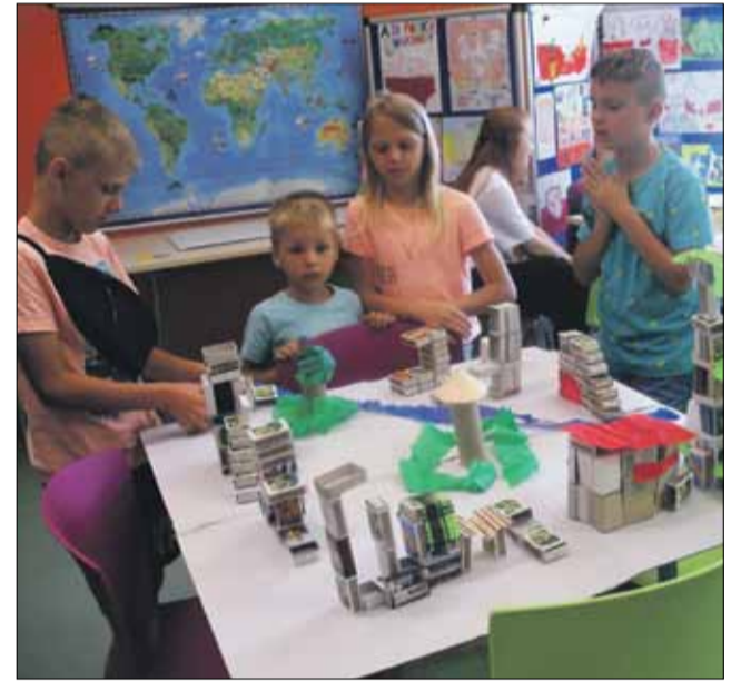
Tak młodzi strzełińskianie widzą swoje miasto w przyszłości

rozkłada się i faluje kolorami chusta „klanzowa”. Mamy jeszcze wiele pomysłów, aby te wakacje mieniły się barwami tęczy. Pod koniec lipca spodziewamy się trupy teatralnej z wesołym przed-