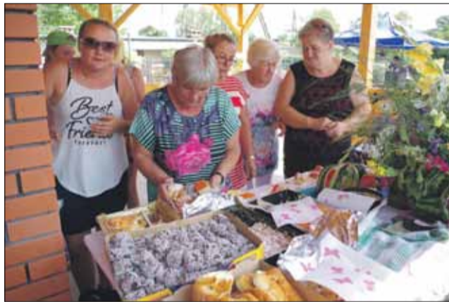
Gospodynie z Głębokiej zadbały o pyszny poczęstunek