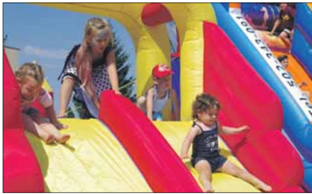
Prawdziwą furorę zrobili dmuchane atrakcje

Jak zawsze w wakacje dziecięca biblioteka przestaje być miejscem cichej i skupionej pracy, zamieniając się w miejsce rekreacji i radosnej zabawy. Okazuje się, że książki w tym nie przeszkadzają. Przeciwnie, same też potrafią umilić czas.