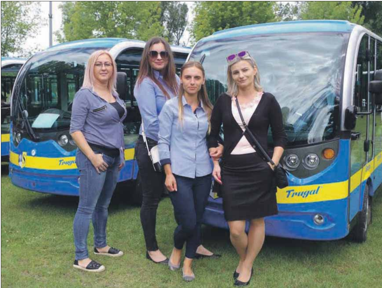
Pojazdy komunikacji miejskiej prowadzą m.in. te panie