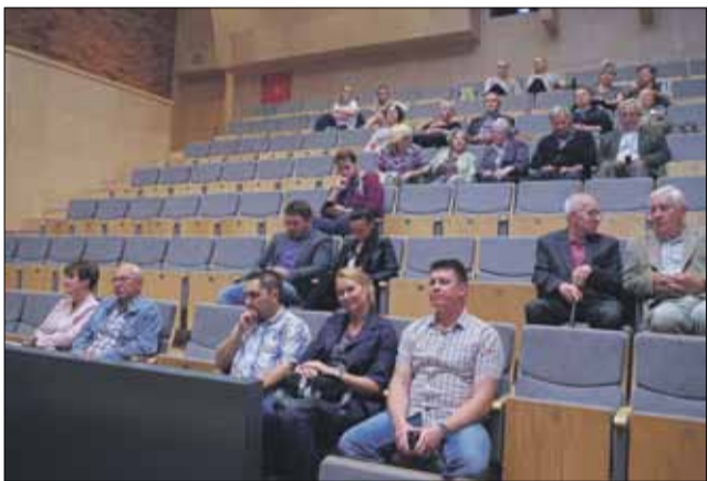
Film pt. Wołyń obejrzało kilkadziesiąt osób