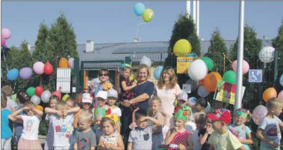
Ten dzień na długo zapadnie w pamięci przedszkolakom