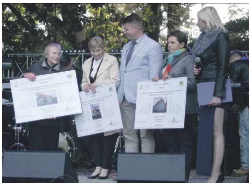
Podczas niedzielnych obchodów ogłoszono wyniki konkursu „Ładna Fasada”

Poniżej podajemy wyniki tegorocznej edycji konkursu, ustalone przez specjalną ko-