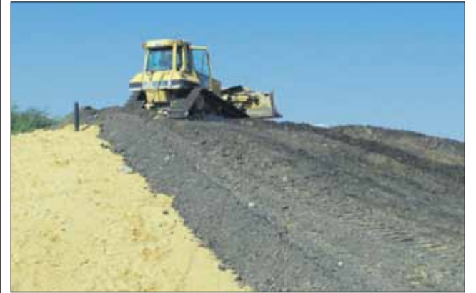
Na wąwolnickim wysypisku intensywnie pracuje ciężki sprzęt