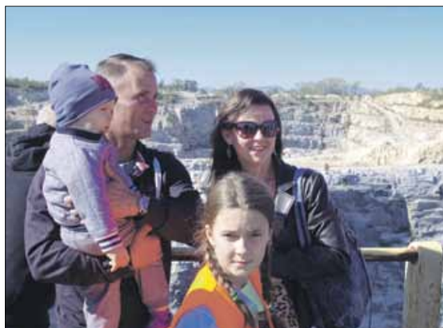
Goście mogli zająć do strzeleńskiego wyrobiska