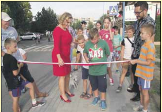
Podczas pikniku uroczystie otwarto niedawno wyremontowany chodnik przy ul. Grunwaldzkiej