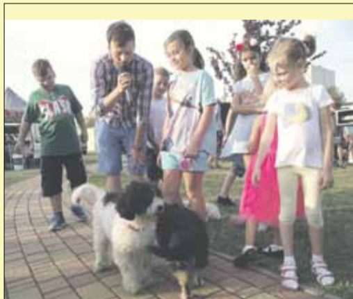
W konkursie na najładniejszego psa właściciele opowiadali o swoich czworonogach