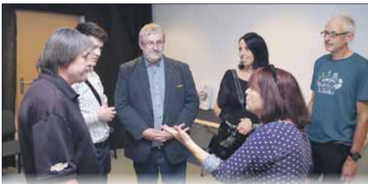
Wiele prezentowanych fotografii było szczegółowo omawianych