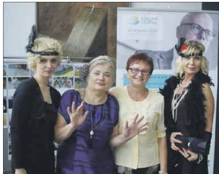
W tym dniu zadbano o piękne stylizacje

do refleksji na istotne tematy społeczne czy polityczne. Nie stracił też na aktualności kulturowy motyw powieści, czyli idea „szklanych domów”. Idea do tego stopnia utopijna, że gdyby dziś przyszło nam wskazać jej wierną materializację, to pewno należałoby sięgnąć po egzemplifikacje z egzotycznego Dubaju czy Aby Zabi. W naszej scenicznej wersji te wizyjne fragmenty utworu odczytali miejscowi artyści oraz literaci i zrobili to z właściwą ludziami sztuki ekspresją. Jednak