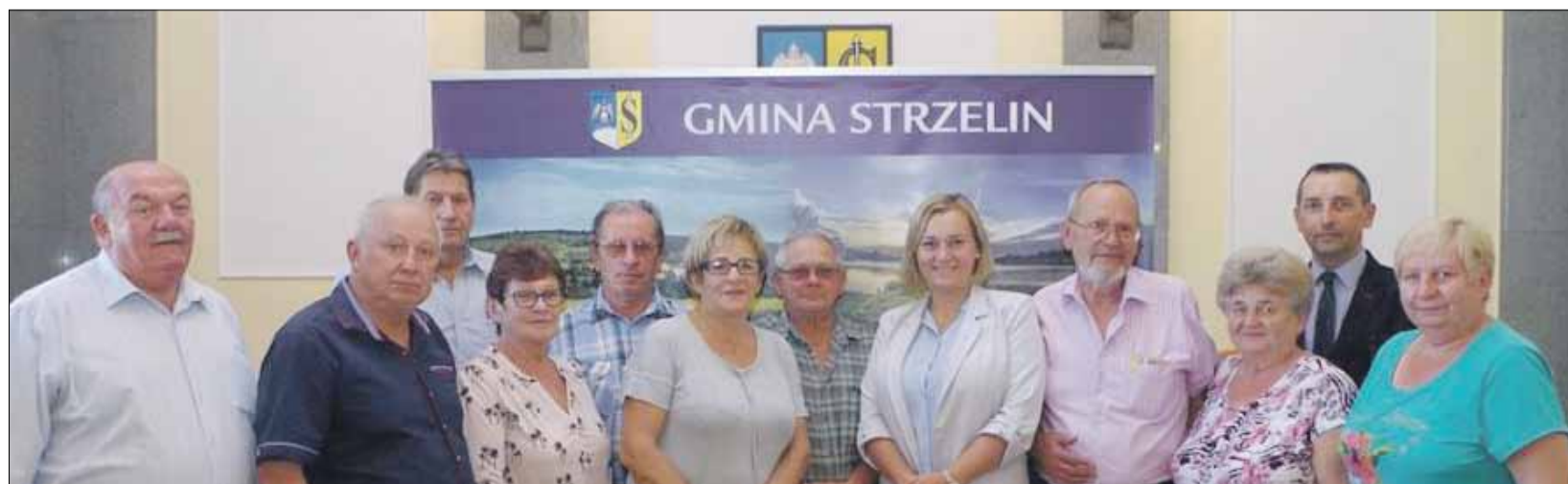
Po pierwszym posiedzeniu rady wykonano pamiątkowe zdjęcie