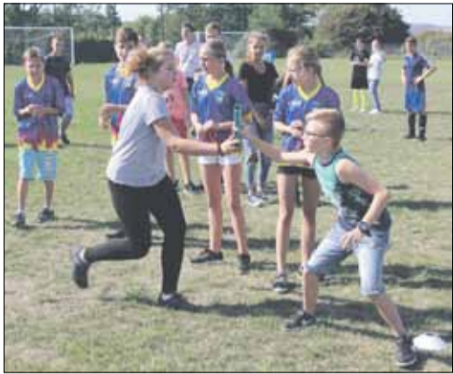
W ramach projektu zorganizowano wiele sportowych i zręcznościowych konkurencji

„Ekologia, sport i dobra zabawa” to hasło, które przyświecało kolejnej i już ostatniej części partnerskiego polsko-czeskiego projektu pn. „Pogranicze bez granic”. Wydarzenie odbyło się 15-16 września w Publicznej Szkole Podstawowej w Białym Kościele. Kładło główny nacisk na dzieci i młodzież szkolną. Miało uczyć współpracy w grupach zarówno pod względem warsztatów ekologicznych, jak również wspólnych zawodów sportowych. Na warsztatach dzieci w grupach zajmowały się pracami dotyczącymi działań ekologicznych, sposobów jak można dbać o środowisko oraz wzięły udział w marszu na orientację na terenie Białego Kościoła. Elementem podsumowującym współpracę młodzieży był wspólny pokaz ekomodny, na którym zaprezentowane zostały stroje