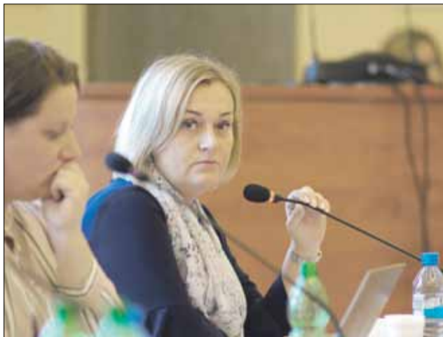
Na liczne pytania radnych odpowiadała burmistrz Dorota Pawnuć

by fizycznej nieruchomości zabudowanej, położonej we wsi Ludów Polski.