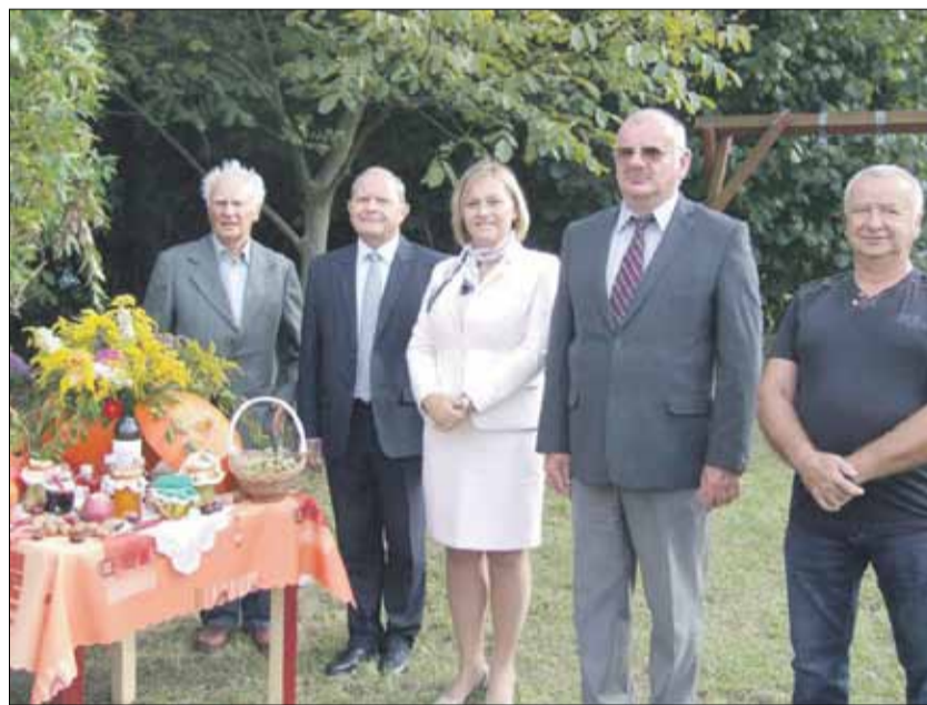
Uczestnicy spotkania na pamiątkowym zdjęciu