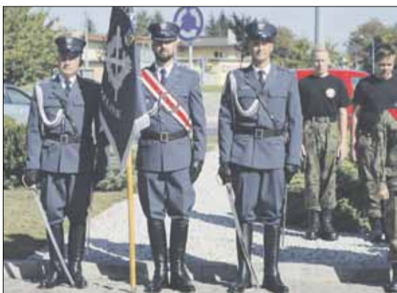
Wśród oficjalnych delegacji była również reprezentacja Zakładu Karnego w Strzelinie