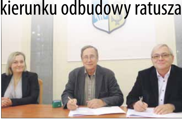
Podpisanie umowy na wykonanie dokumentacji projektowej to ważny krok w kierunku odbudowy strzelińskiego ratusza

Ma sprostować nieprawdę i zapłacić 2 tys. zł