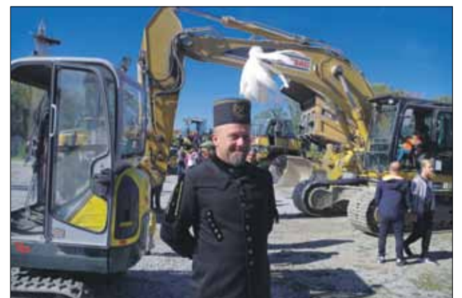
Niektórzy pracownicy kopalni zaprezentowali galowe górnicze umundurowanie