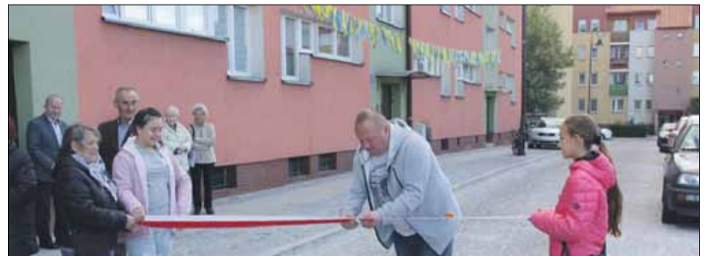
W uroczystym otwarciu uczestniczyli m.in. mieszkańcy ulicy Zamkowej