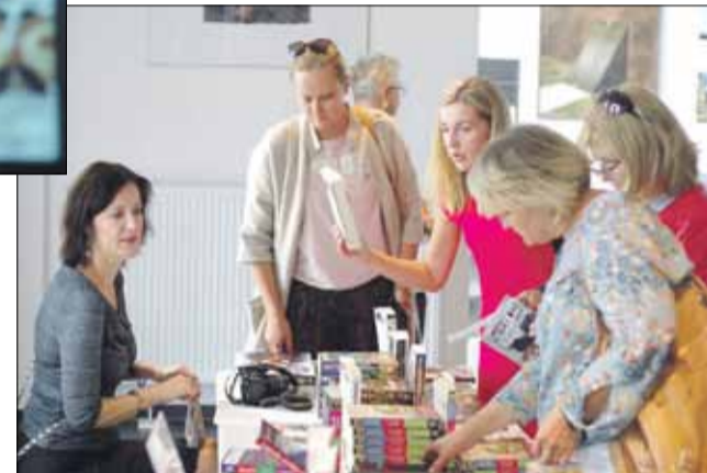
W holu SOK-u można było zakupić książki