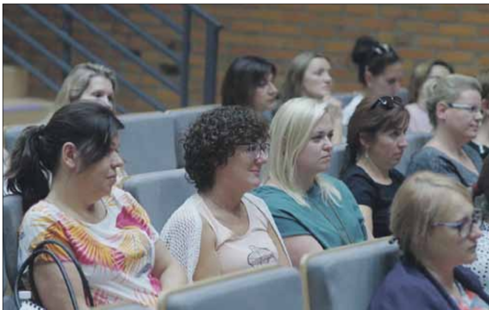
Konferencja pt. „Mediacje sposobem na porozumienie” cieszyła się sporym zainteresowaniem

W czwartek, 13 września w Strzelińskim Ośrodku Kultury odbyła się konferencja pt. „Mediacje sposobem na porozumienie”. Głównym organizatorem wydarzenia byli Kancelaria Mediacyjna Joanny Pomagruk, Instytut Mediacji Tak oraz Gmina Strzelin i Burmistrz Miasta i Gminy Strzelin. Wśród prelegentów wystąpiła m.in. Anna Maria Wesołowska.