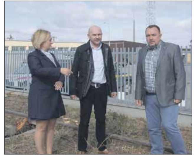
Postęp prac sprawdzili niedawno szefowie gmin Strzelin i Kondratowice