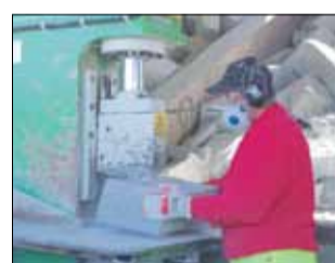
Zwiedzającym zaprezentowano m.in. proces produkcji kostki