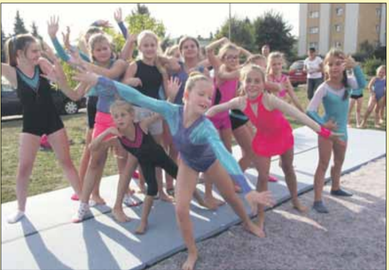
Pokaz akrobatyki sportowej Akro-Fizjo wzbudził spore zainteresowanie wśród widzów