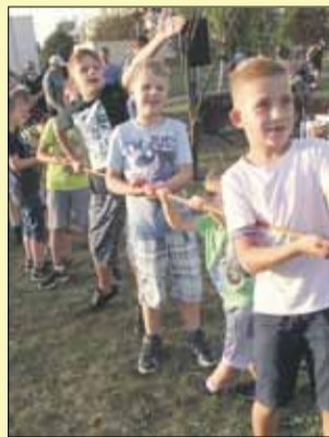
Wśród konkursów było m.in. przeciąganie liny

Za naszym pośrednictwem dyrektor Strzełińskiego Ośrodka Kultury dziękuje wszystkim, którzy przyczynili się do zorgani-