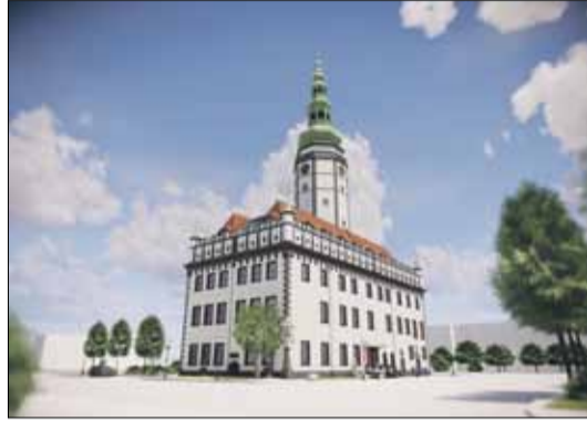
Tak ma wyglądać odbudowany ratusz

Strzeleński Ratusz Zdzisław Rataj. - Podaję cenę netto, gdyż spółka odzyska podatek VAT. W zakresie dokumentacji projektowej wchodzi: projekt budowlany, wszelkie uzgodnienia w tym pozwolenie na budowę, wielobranżowe projekty wykonawcze, a także dokumentacja dotycząca aranżacji wnętrz oraz wszystkie specyfikacje techniczne i kosztorysy - tłumaczy. Wykonawca dokumentacji projektowej będzie w ramach ww. kwoty sprawował również tzw. nadzór autorski, co oznacza, że w czasie budowy pracownia arch. M. Malachowicza będzie nadzorowała zgodność realizowanej inwestycji przez przyszłego wykonawcę ratusza z dokumentacją projektową. Na wykonanie kompletnej dokumentacji firma ma 240 dni (około 8 miesięcy), co oznacza, że pod koniec maja przyszłego roku powinna być gotowa. W międzyczasie spółka będzie pracowała nad ważną kwestią