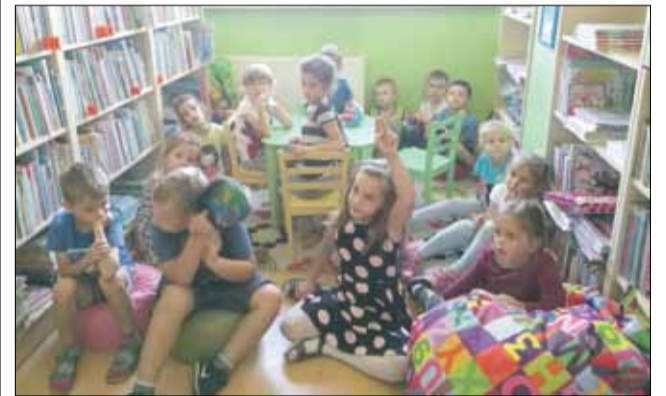
Najmłodszy chętnie zadawali pytania