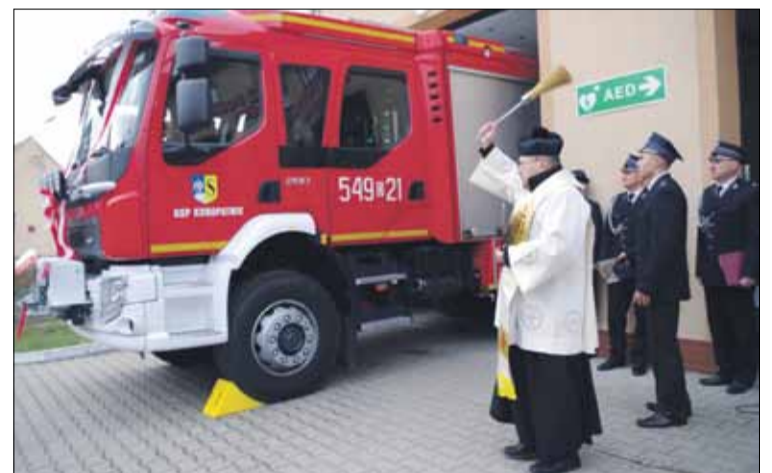
Wóz strażacki poświęcił proboszcz ksiądz Tadeusz Polan