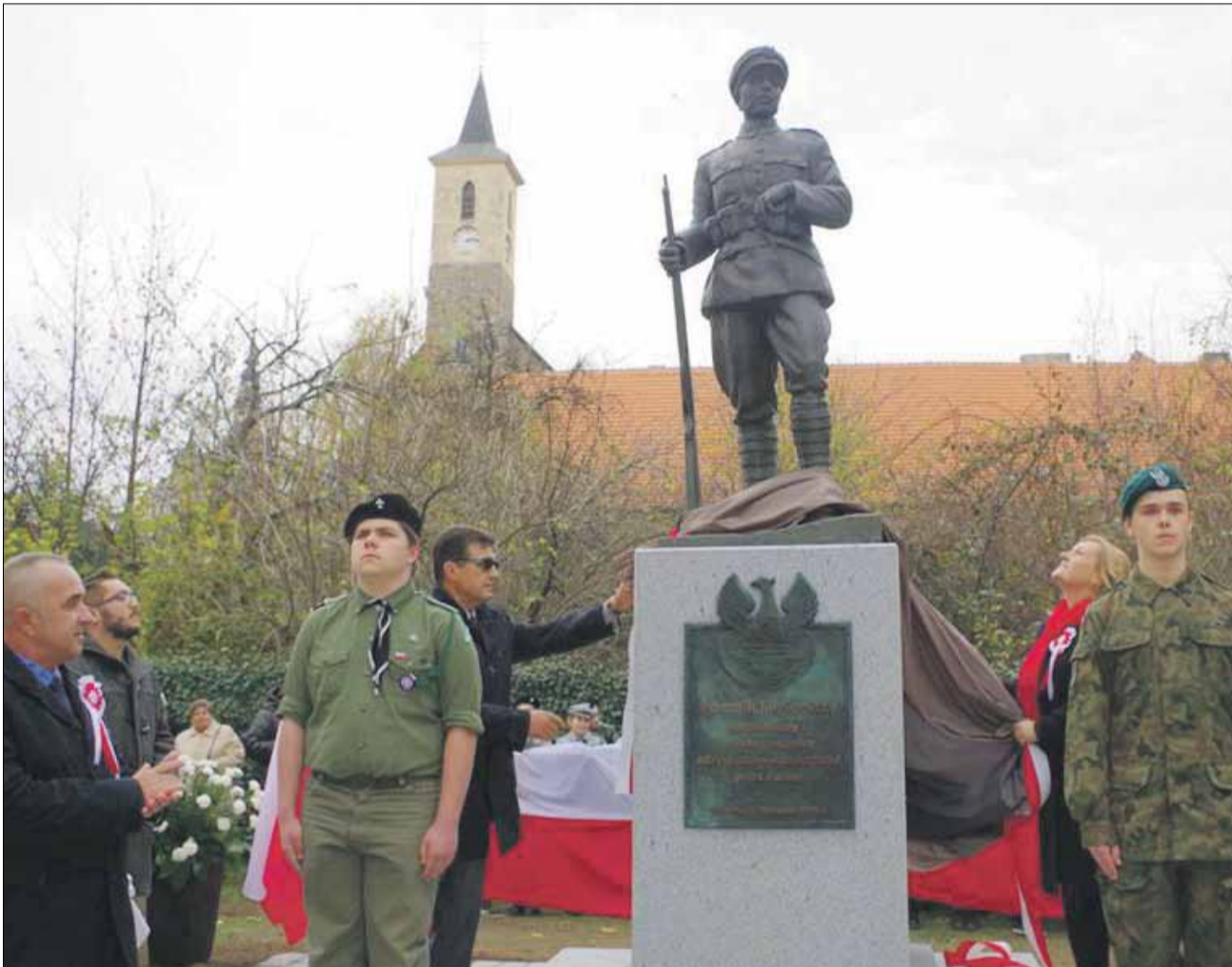
Uroczyste odsłonięcie Pomnika Legionisty odbyło się podczas obchodów setnej rocznicy odzyskania przez Polskę niepodległości

Przez rok społeczny komitet pracował nad budową pomnika, który stoi od kilku tygodni na skwerze przy ul. Rybnej w Strzelinie. Spory udział w tym przedsięwzięciu miały lokalne firmy, ale także mieszkańcy, którzy kupując cegielki wsparli inicjatywę.