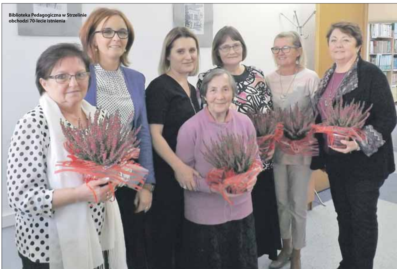
Biblioteka Pedagogiczna w Strzelinie obchodzi 70-lecie istnienia