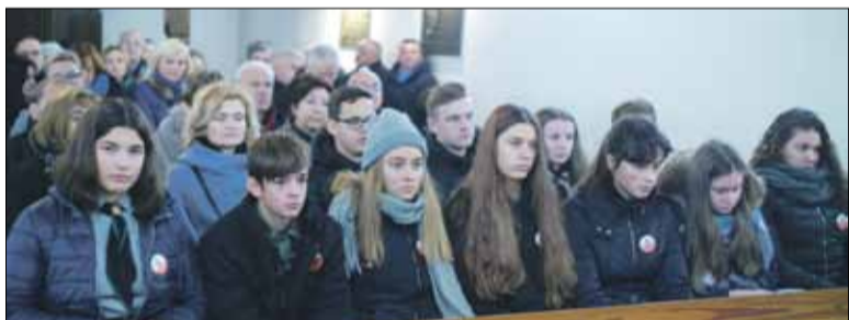
Kapitana żegnała młodzież