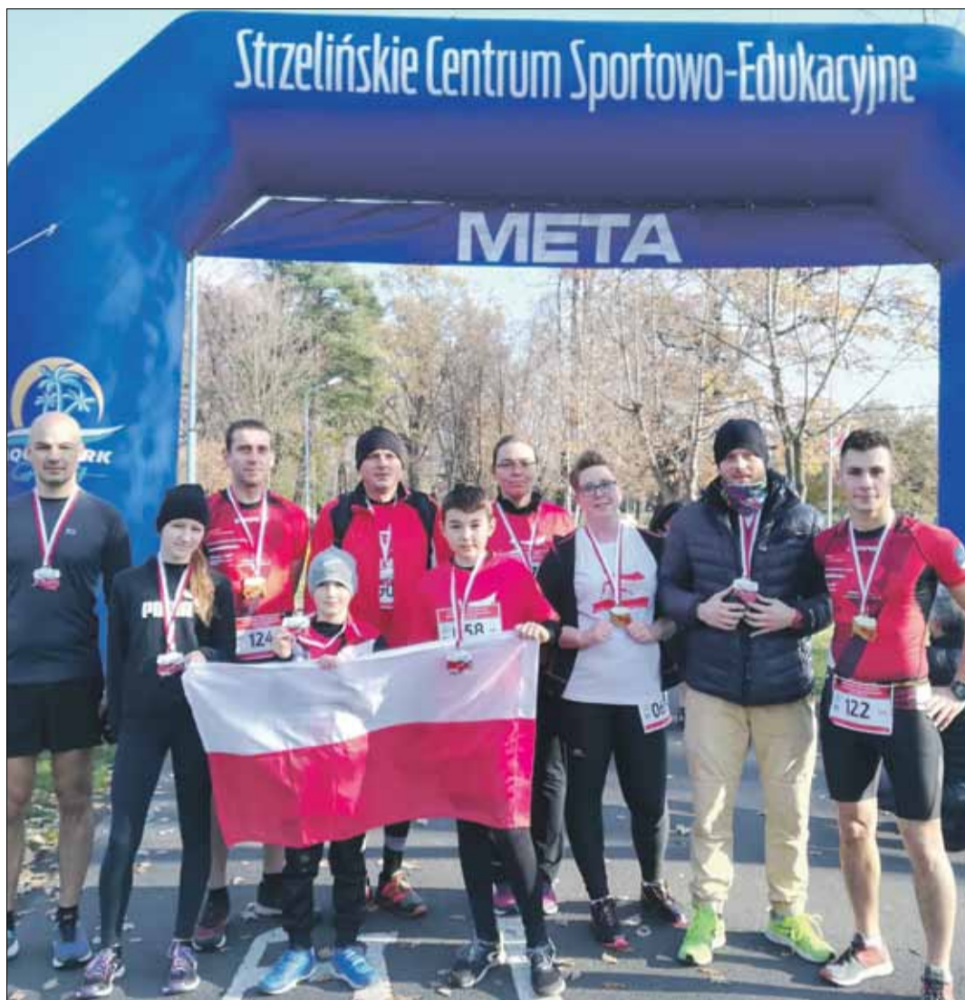
Strzeńscy biegacze wzięli udział w zawodach niepodległościowych

Gratulacje dla wszystkich zawodników, którzy wzięli udział w biegach niepodległościowych. RED