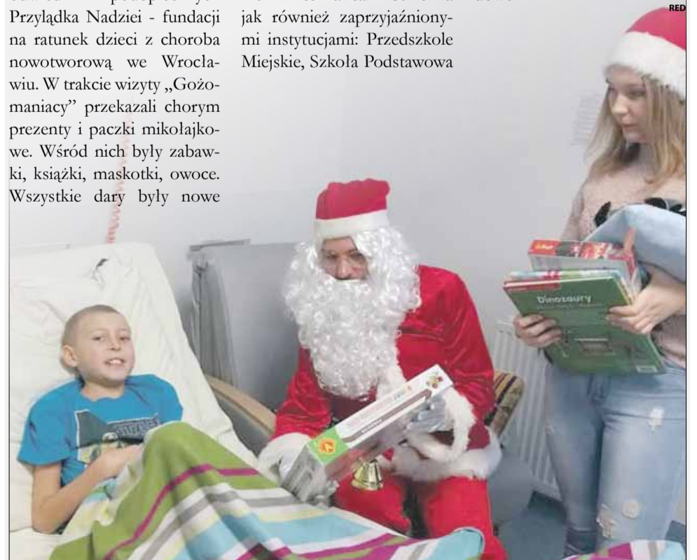
Dla pacjentów Przylądka Nadziei był to wyjątkowo szczęśliwy dzień