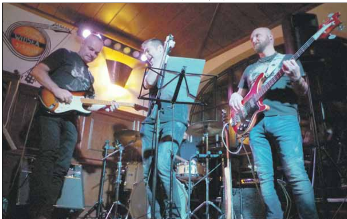
Wśród zespołów, które wystąpiły podczas festiwalu był również Tribute To The Doors