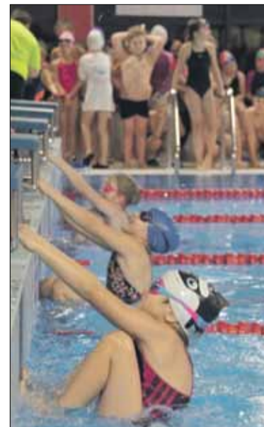
Zawodnicy mieli do pokonania 25 lub 50 metrów stylem dowolnym

Ponad setka młodych pływaków rywalizowała podczas „Mikołajkowych Zawodów Pływackich”, których organizatorem było Strzelińskie Centrum Sportowo-Edukacyjne. Poza jak najlepszym wynikiem sportowym, liczyła się świetna zabawa oraz rodzinna atmosfera. Impreza odbyła się w piątek, 7 grudnia w Aquaparku Granit w Strzelinie. Zawody rozegrane zostały aż w dziewięciu rocznikach: 2012 i młodsi, 2011, 2010, 2009, 2008, 2007, 2006, 2005, aż do kategorii 2004 i starsi. Uczestnicy wydarzenia mieli za zadanie pokonać (w zależności od wieku) 25 lub 50 metrów stylem dowolnym.