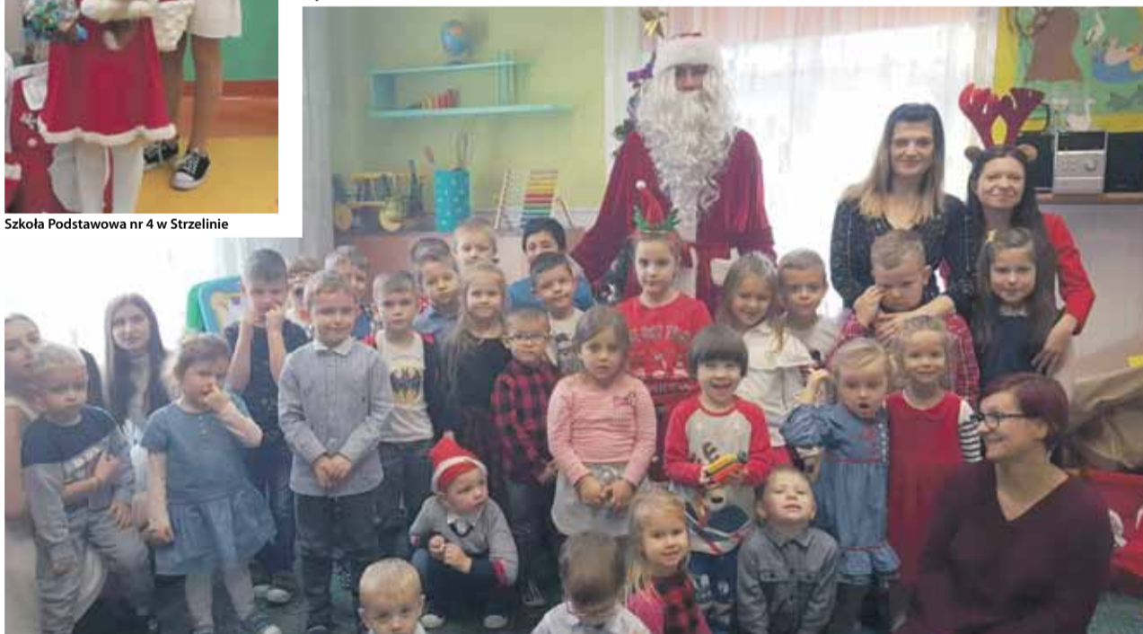
Przedszkole Miejskie Kolorowa Kraina