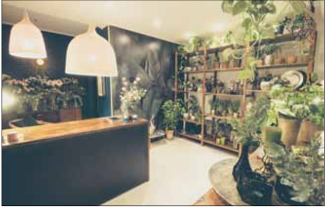
Kwiaciarnia „Dzikie Kwiaty” mieści się obecnie przy ul. Grahama Bella w Strzelinie