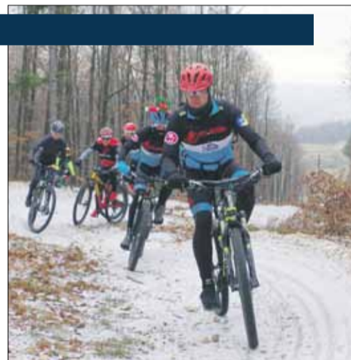
W programie wydarzenia była przejażdżka single trackiem