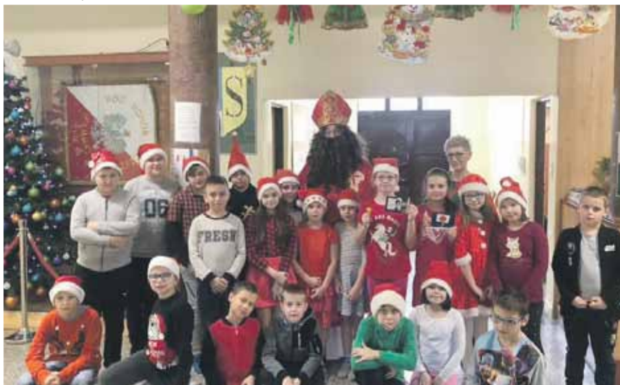
Szkoła Podstawowa nr 3 w Strzelinie