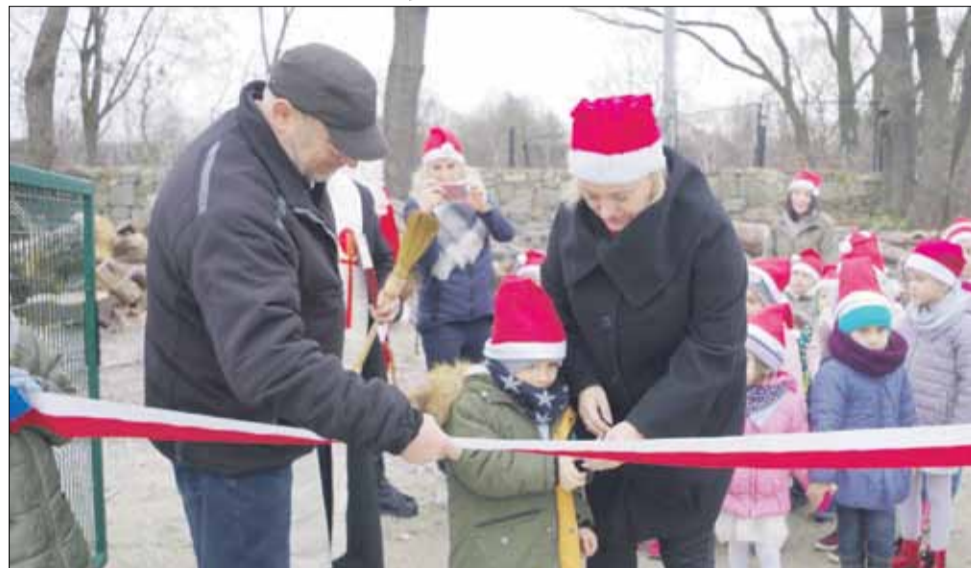
Podczas otwarcia przecięto tradycyjną, biało-czerwoną wstęgę

To inwestycja zrealizowana przez Gminę Strzelin w bieżącym roku. Jej wykonawcą był Zakład Kształtowania Terenów Zielonych Dol-ek Kazimierza Dołecińskiego z Tarnowa. Wartość robót budowlanych wyniosła ponad 169 tys. zł. W ramach zadania zamontowano: zestaw zabawowy, huśtawkę podwójną i wagową, zestaw domek przedszkolaka, lokomotywę wagonik bez dachu, bujaczki, obiekty tzw. małej architektury (ławki z oparciem, tablicę informacyjną z regulaminem, kosze na śmieci). Wykonano strefę bezpieczną o nawierzchni syntetycznej.