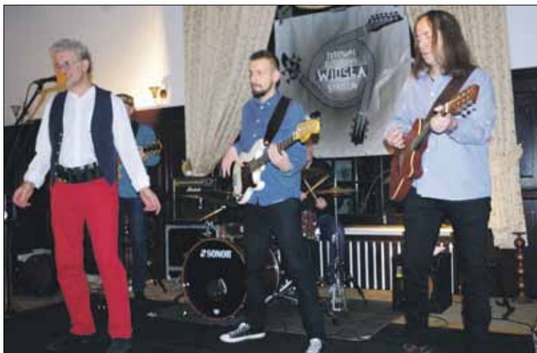
Nocna Zmiana Bluesa zagrała energetyczny koncert w Hotelu Maria w Strzelinie