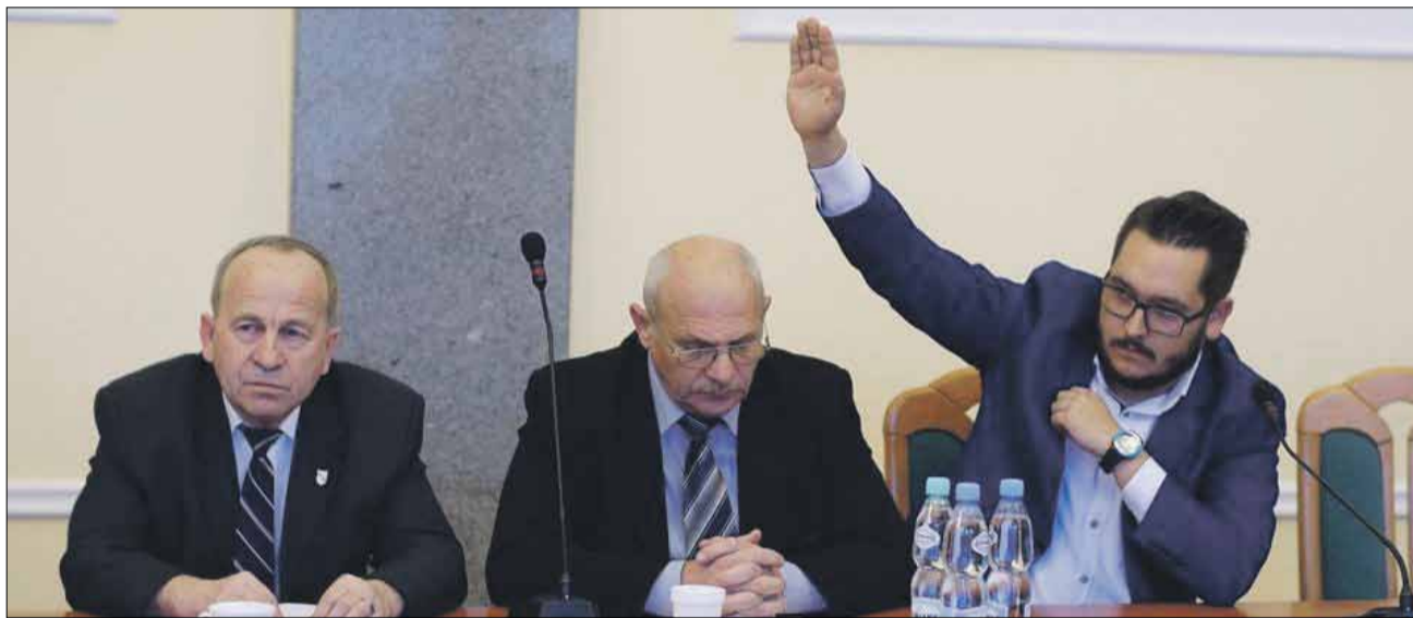
Radni pracują podczas obrad według nowego statutu

W połowie listopada Rada Miejska Strzelina uchwaliła nowy statut gminy Strzelin, który będzie obowiązywał w kadencji 2018-2023. Jakie zmiany wprowadza?