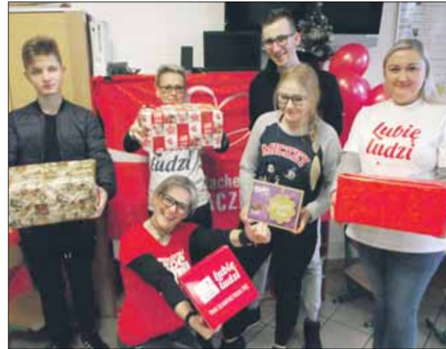
To już czwarta edycja Szlachetnej Paczki w Strzelinie