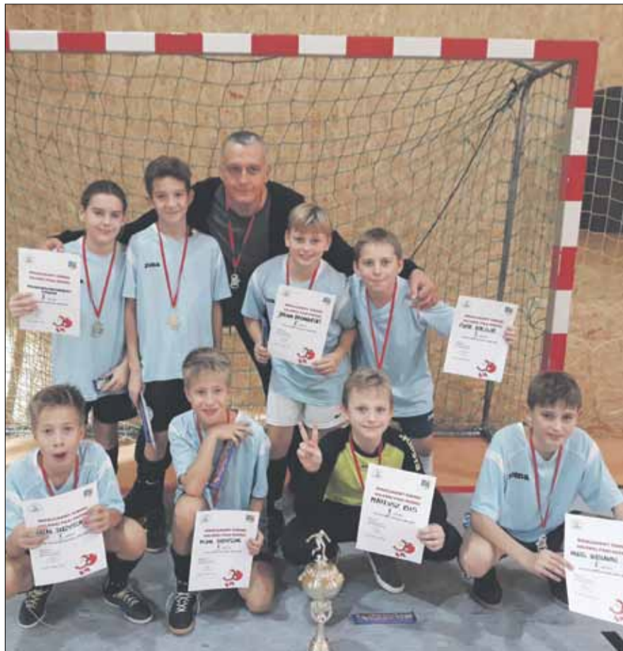
Wśród drużyn z rocznika 2006-2007 zwyciężyła drużyna z PSP nr 5 w Strzelinie

Strzeliński Ośrodek Kultury zaprasza na koncert kolęd i pastorałek „NA GÓRALSKĄ NUTĘ”