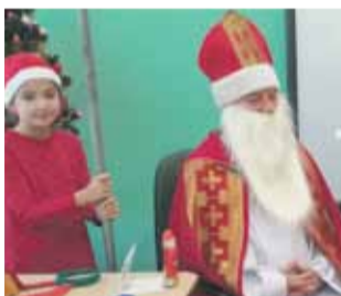
Szkoła Podstawowa nr 4 w Strzelinie