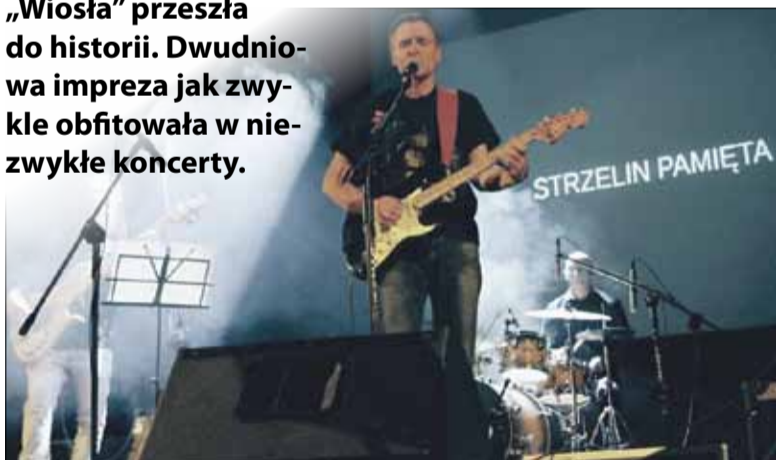
Pierwszy dzień muzycznej imprezy rozpoczął się od koncertu pt. Strzelin pamięta

Siódma edycja Festiwalu Gitarowego „Wiosła” przeszła do historii. Dwudniowa impreza jak zwykle obfitowała w niezwykle koncerty.