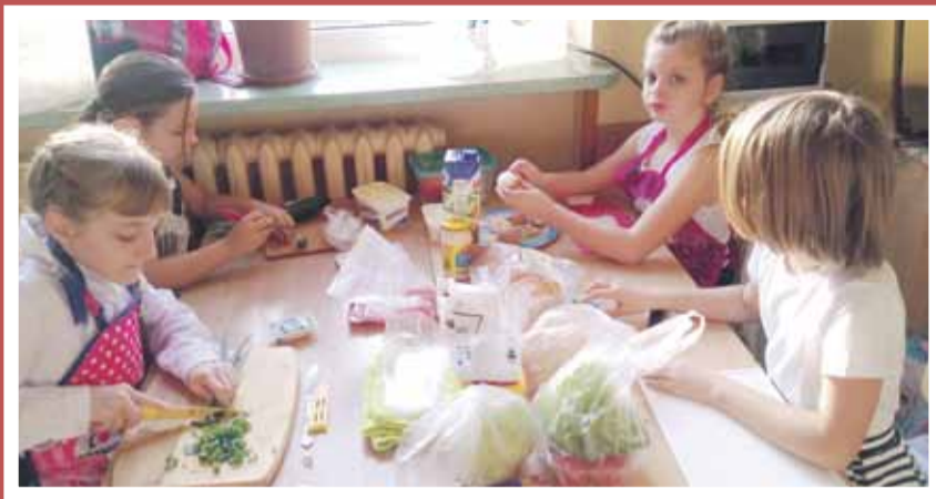
RED Uczennice przygotowywały pyszne, zdrowe śniadania

Po raz kolejny Publiczna Szkoła Podstawowa nr 4 w Strzelinie wzięła udział w programie „Śniadanie Daje Moc”. Dzięki niemu uczniowie młodszych klas poznają zasady zdrowego żywienia. Wiedzą już jak ważne jest zjadanie śniadania w domu oraz II śniadania w szkole. Na początku listopada wszystkie dzieci sprawdzały swoją wiedzę praktycznie. W grupach przygotowywały pyszne, zdrowe śniadania, które potem zjadły. Było kolorowo, radośnie i pysznie.