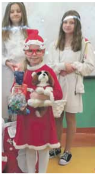
Szkoła Podstawowa nr 4 w Strzelinie