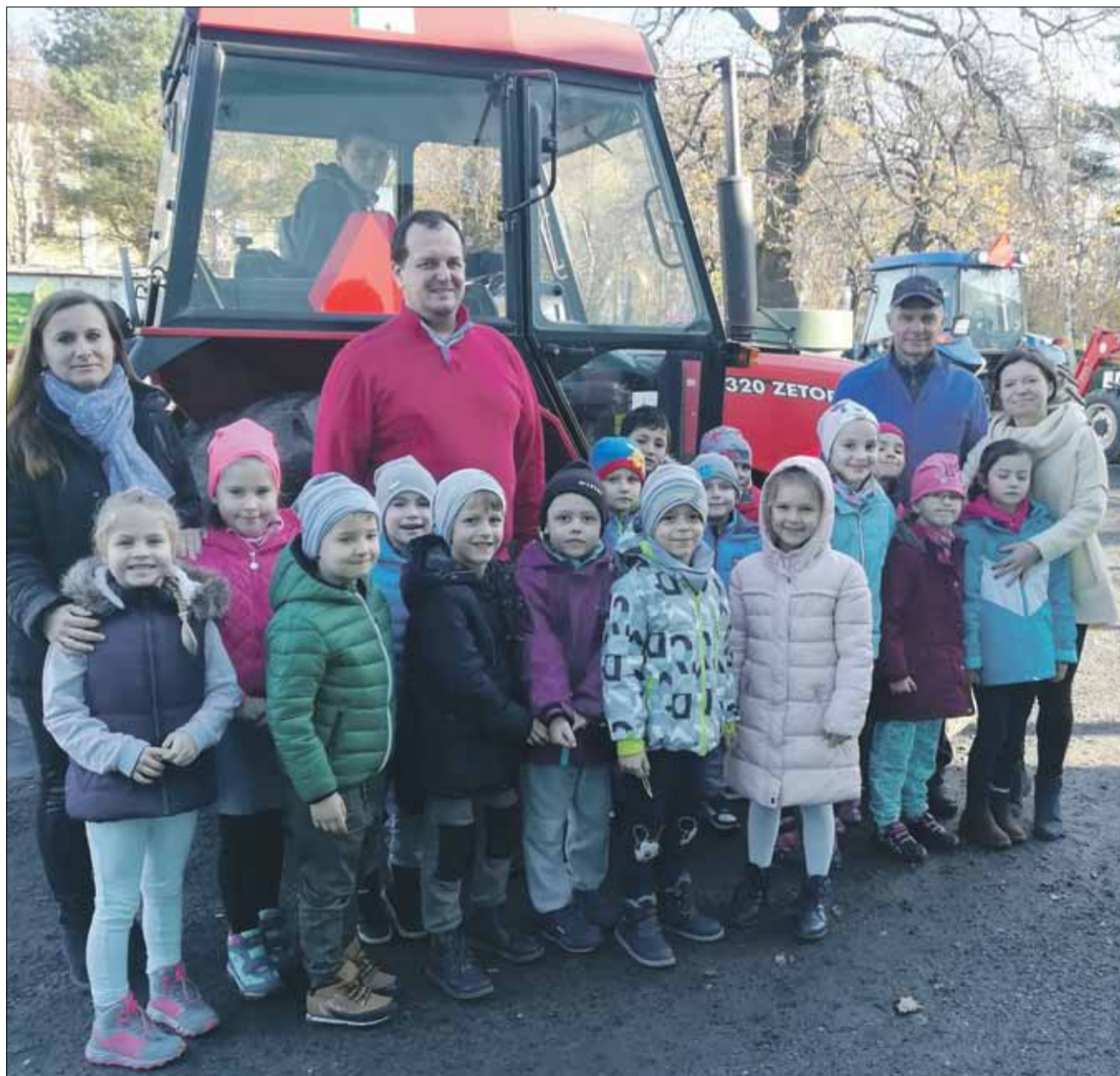
Przedszkolaki uczestniczyły w warsztatach poświęconych produkcji żywności