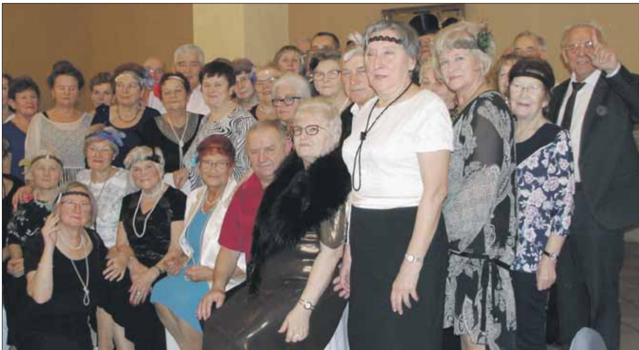
Studenci Uniwersytetu Trzeciego Wieku oprócz zajęć często spotykają się na różnych imprezach

Warto dodać, że wszystkie działania UTW opłacane są ze składek słuchaczy, ale Burmistrz Miasta i Gminy Strzelin i Strzelińska Rada Seniorów wsparli jednostkę finansowo dopłacając do zakupu koszulek z logo UTW i godłem Strzelina.