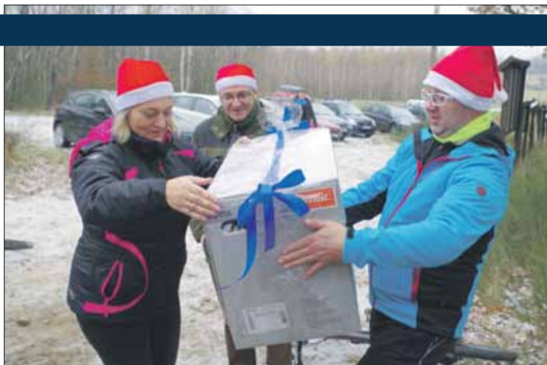
Burmistrz przekazała stowarzyszeniu dmuchawę