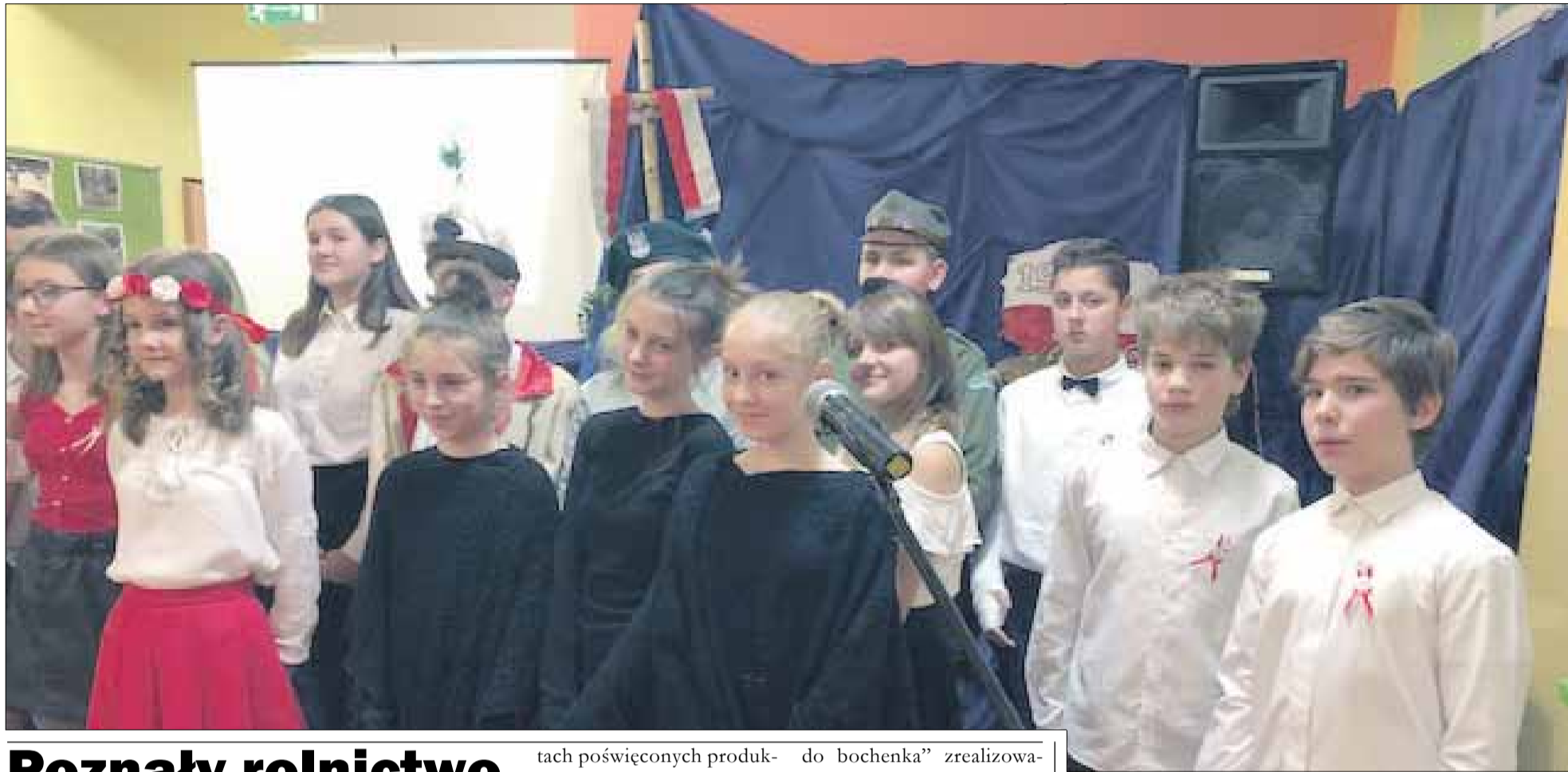
Uczniowie przenieśli widzów w literacko-muzyczną podróż w burzliwe dzieje naszej ojczyzny