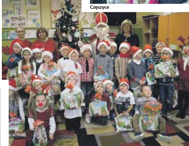
Szkoła Podstawowa nr 5 w Strzelinie