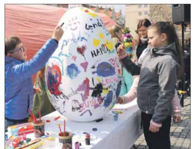
Dzieci chętnie zdobyły Strzelińską Megapisankę