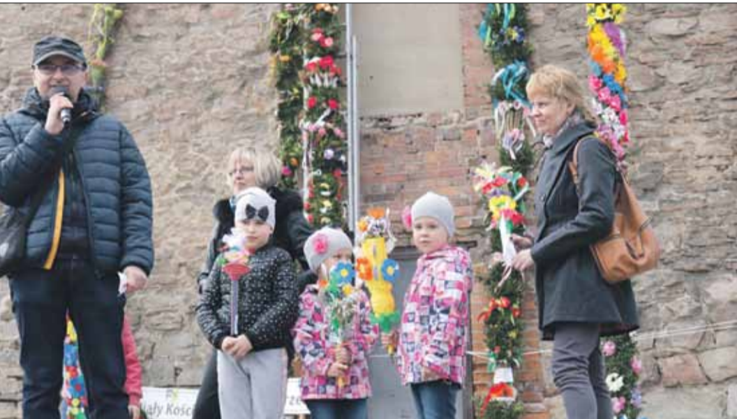
...ne palmy zostały wykonane przez dzieci m.in. z plastikowych korków i rurek