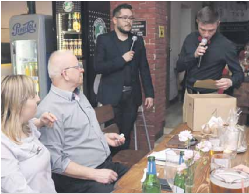
Licytacje, zwłaszcza pudełek z nieznaną zawartością, cieszyły się bardzo dużym zainteresowaniem