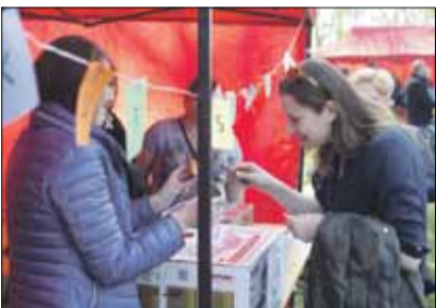
Jedną z atrakcji była loteria fantowa