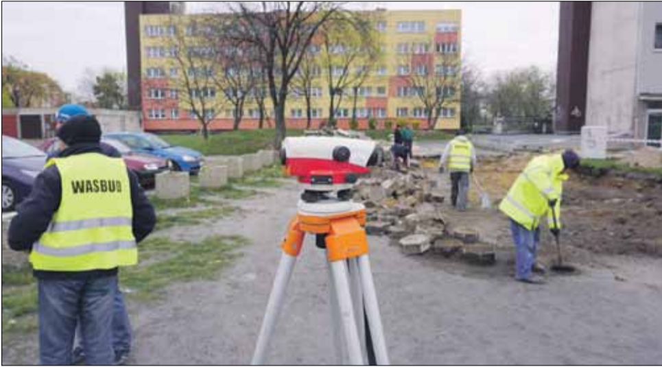
Na terenie budowy trwają już intensywne prace

W ubiegłym tygodniu ruszyły prace związane z rewitalizacją wschodniej pierzei strzeelińskiego Rynku. W momencie zamykania aktualnego numeru „Nowin Strzeelińskich” roboty ziemne trwały przy budynku, w którym działają lokale „Przepis Bistro & Cafe” i „KawauDrania”.