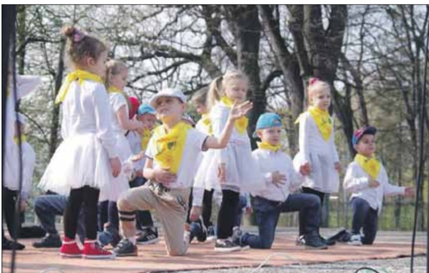
Piękny występ dały dzieci z Przedszkola Miejskiego „Kolorowa Kraina”