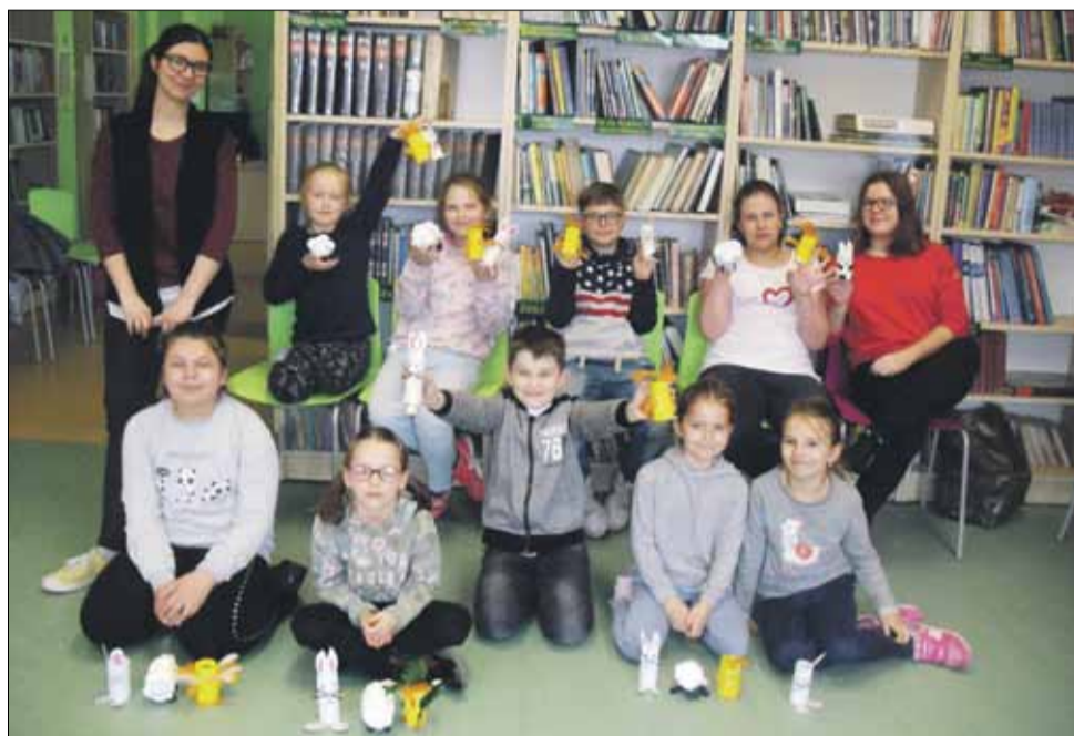
Efektom ostatnich warsztatów plastycznych były zajęcia, a to nieomylny znak, że zbliża się święta

ruchu młodym organizmom jest bardzo ważne, ale równie ważny jest rozwój instynktu poznawczego. Temu służył blok programowy pod wspólnym tytułem „Jaki ten świat jest piękny”. Młodzi wraz z prelegentką-podróżniczką wybrali się niemal na krańce świata, by poznać egzotyczne kraje. Mogli podziwiać piękno ich przyrody oraz zabytków, ale też zwyczajne życie, zwłaszcza to dotyczące ich rówieśników. Zorganizowany potem konkurs