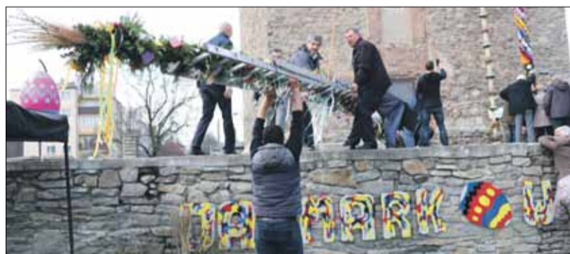
Najdłuższą palmę przygotowali mieszkańcy Trzeźni, a do jej postawienia potrzebna była duża drabina