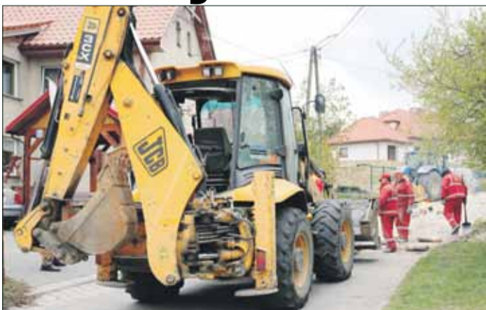
Na ulicy Dębowej w Gęsińcu trwają prace remontowe

Rozpoczął się remont ul. Dębowej w Gęsińcu. Przypomnijmy, że wykonawca Przedsiębiorstwo Robót Drogowo-Mostowych z Brzegu, zgodnie z umową powinien zakończyć prace do końca czerwca. Zakres inwestycji obejmuje m.in. wykonanie stabilizacji cementem, podbudowy z mieszanki kamiennej, nawierzchni bitumicznej, regulację studzienek. Polecza uzupełnione zostaną tłucz-