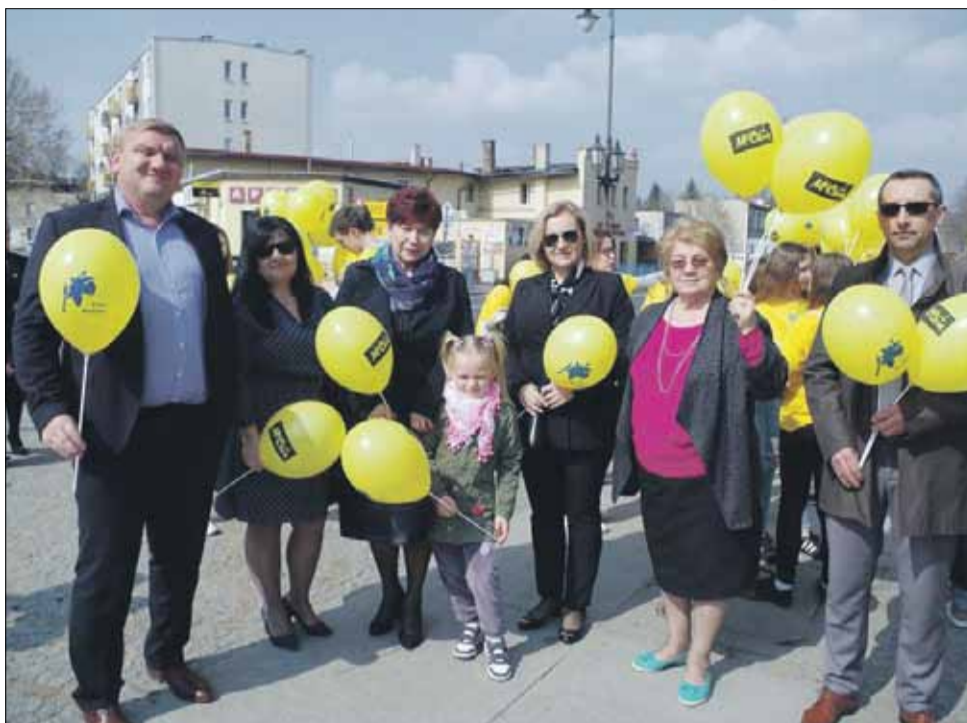
W finale uczestniczyli m.in. nasi samorządowcy