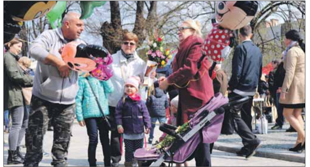
Stoisko z balonami wypełnionymi helem zawsze wzbudza spore zainteresowanie najmłodszych