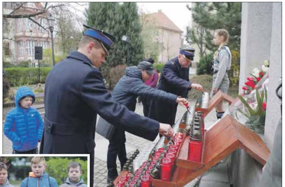
Tradycyjnie zapalono 96 zniczy, za każdą z ofiar katastrofy smoleńskiej