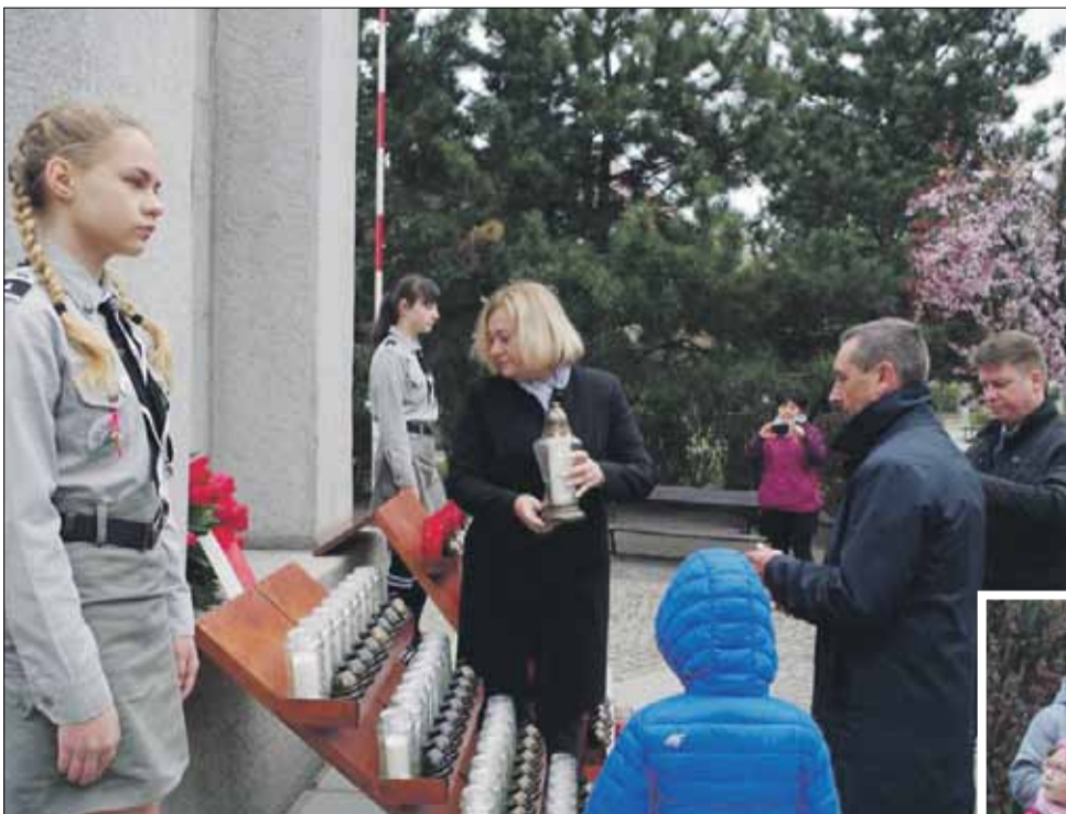
Kwiaty złożyła m.in. delegacja władz gminy Strzelin