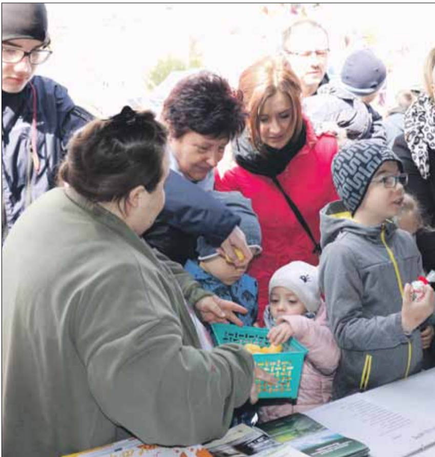
Zabawa pn. „Losowanki z jajka niespodzianki” cieszyła się bardzo dużym zainteresowaniem