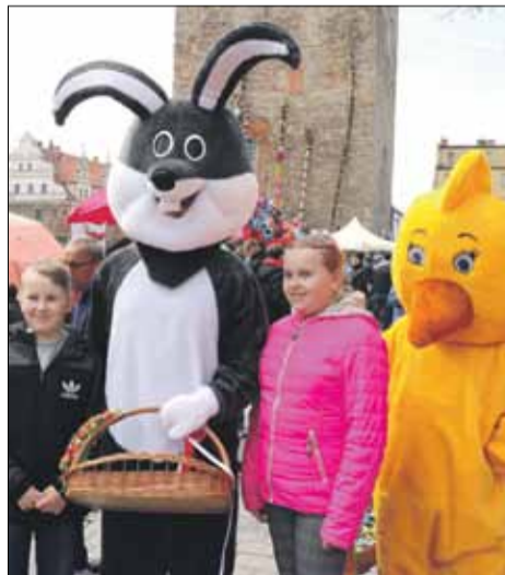
Miłym akcentem tegorocznego jarmarku była wizyta zajęczka i kurczaczka, którzy rozdawali słodkości