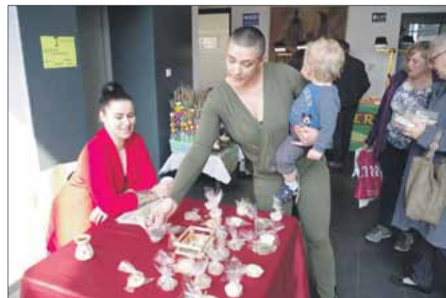
Na targach można było nabyć m.in. oryginalne mydełka