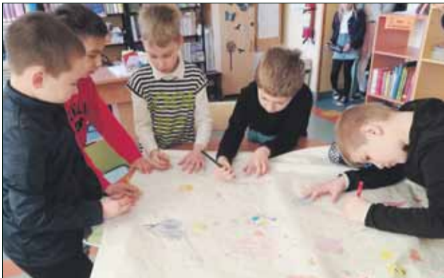
Uczniowie na wielkiej laurce pisali życzenia dla książek z okazji ich święta

2 kwietnia na całym świecie obchodzony był Międzynarodowy Dzień Książki Dla Dzieci. W tym dniu biblioteka Publicznej Szkoły Podstawowej nr 4 w Strzelinie zachęcała uczniów do wzięcia udziału w zabawie pod nazwą „Życzenia dla książki”. Uczniowie mogli napisać, na przygotowanej wcześniej przez panię bibliotekarkę ogromnej laurce, życzenia dla książek z okazji ich święta lub ozdobić laurkę pięknym rysunkiem. Zaproponowano także akcję „Półka bookcrossingowa”. Bookcrossing to ruch, który powstał, żeby „uwalniać” książki. Szkolna biblioteka w tym roku po raz pierwszy stworzyła specjalną półkę bookcrossingową, na której nauczyciele i uczniowie mogą dla siebie wzajemnie zostawiać przeczytane książki, a wziąć w zamian inne. Każdy mógł się także przebrać za ulubioną postać książkową lub na kolorowo, aby zaakcentować ten dzień. W bibliotece został również ogłoszony konkurs „Selfie z książką”. Warunkiem udziału w nim jest wykonanie zdjęcia – selfie – z czytaną książką i przesłanie jednej fotografii na adres mailowy: martha007-28@o2.pl. Konkurs potrwa do 15 maja 2019 r.