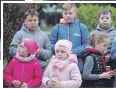
W wydarzeniu uczestniczyli m.in. uczniowie lokalnych szkół

Pamięć ofiar mordu katyńskiego i katastrofy smoleńskiej uczcili 10 kwietnia m.in. samo-