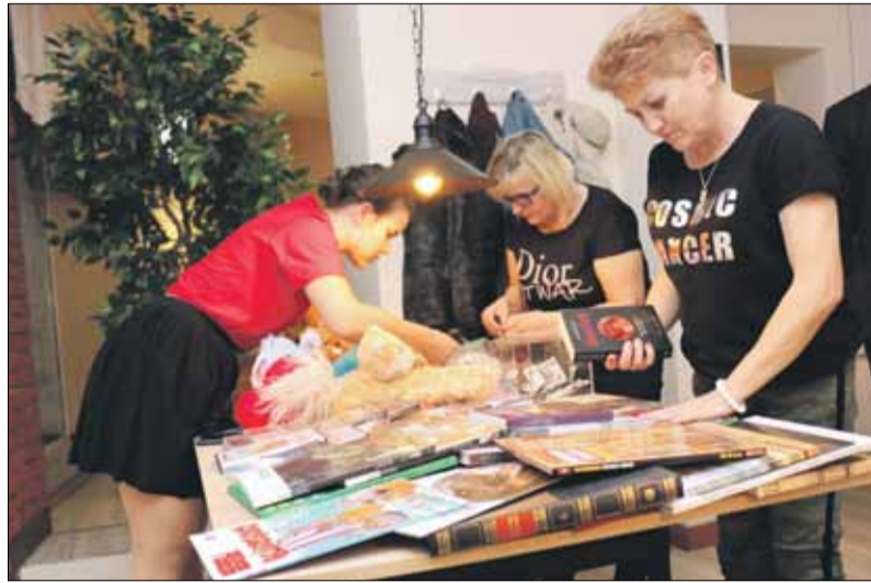
W loterii fantowej można było wygrać m.in. książki, pluszaki i płyty