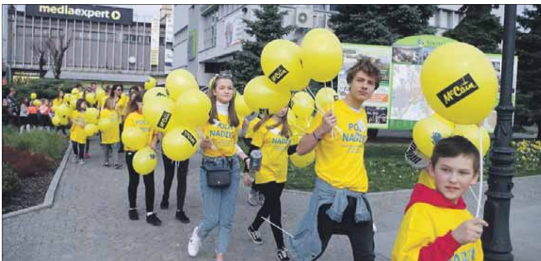
W marszu żonkilowym licznie uczestniczyła młodzież z naszych szkół