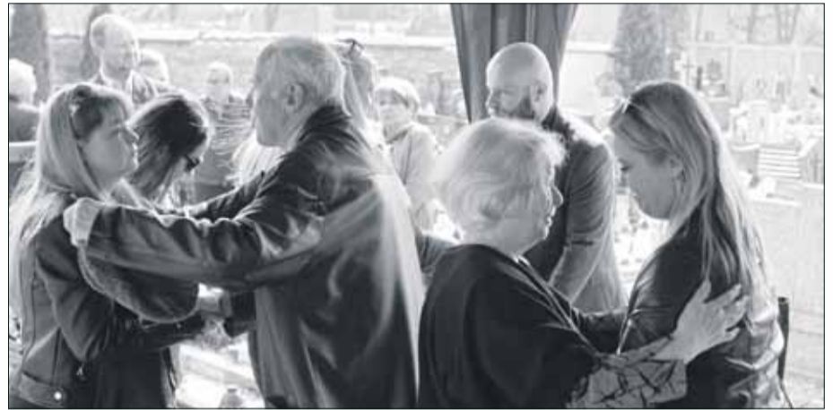
Bliskim zmarłego złożono kondolencje