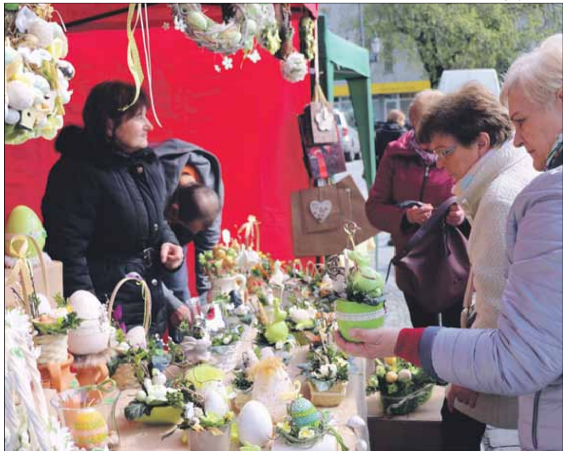
Na jarmarku można było kupić m.in. ozdoby nawiązujące do świąt wielkanocnych