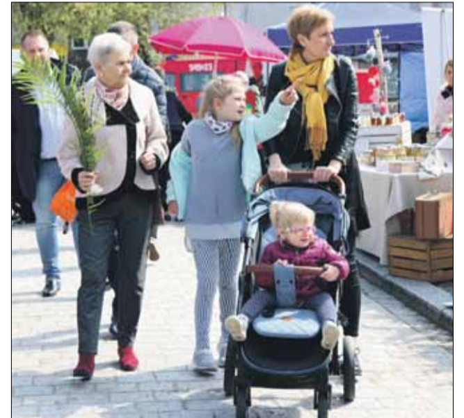
Słoneczna pogoda sprawiała, że jarmark licznie odwiedzały rodziny z dziećmi