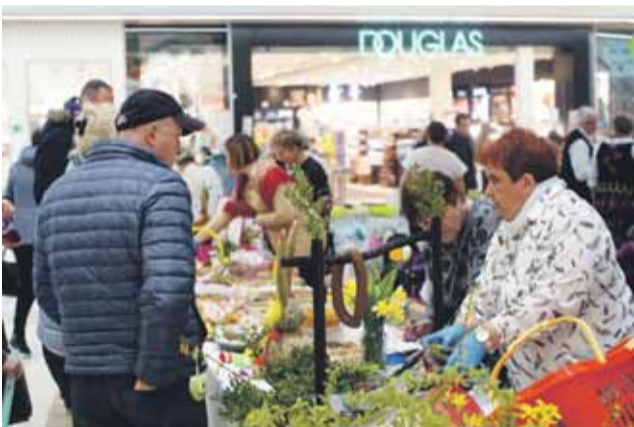
Na stoisku naszego koła były ozdoby, ciasta i wędliny