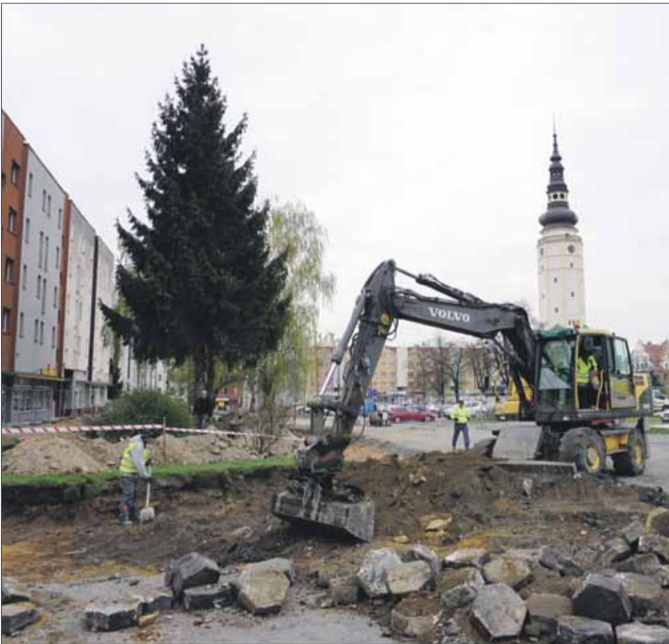
Na strzeelińskim Rynku pracuje ciężki sprzęt