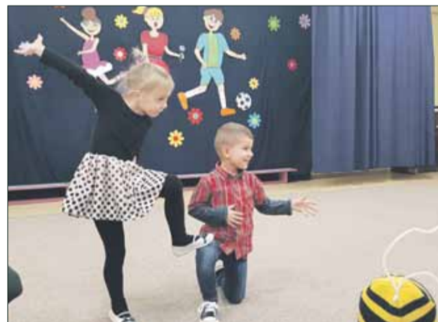
Przedszkolaki zaprezentowały m.in. zdolności taneczne