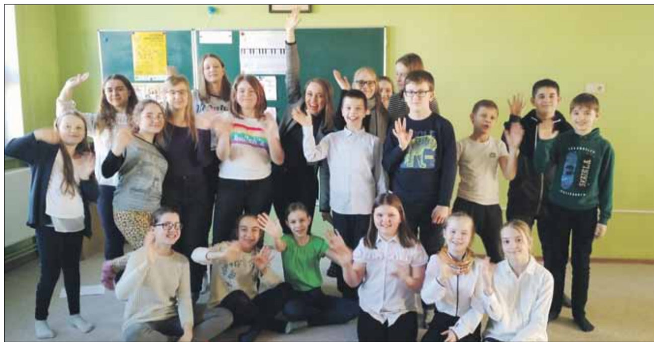
Uczniowie Samorządowej Szkoły Muzycznej I Stopnia w Strzelinie brali niedawno udział w warsztatach chórnych

Ostatnie tygodnie obfitowały w kilka sukcesów i ważnych wydarzeń Samorządowej Szkoły Muzycznej I Stopnia w Strzelinie. Uczniowie uczestniczyli w warsztatach i zdobywali wyróżnienia w konkursach.