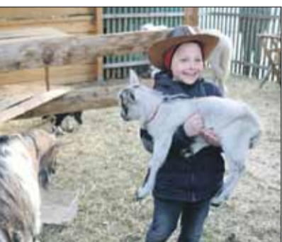
...z pierwszy podczas jarmarku dostępna była zagroda ze ...mi