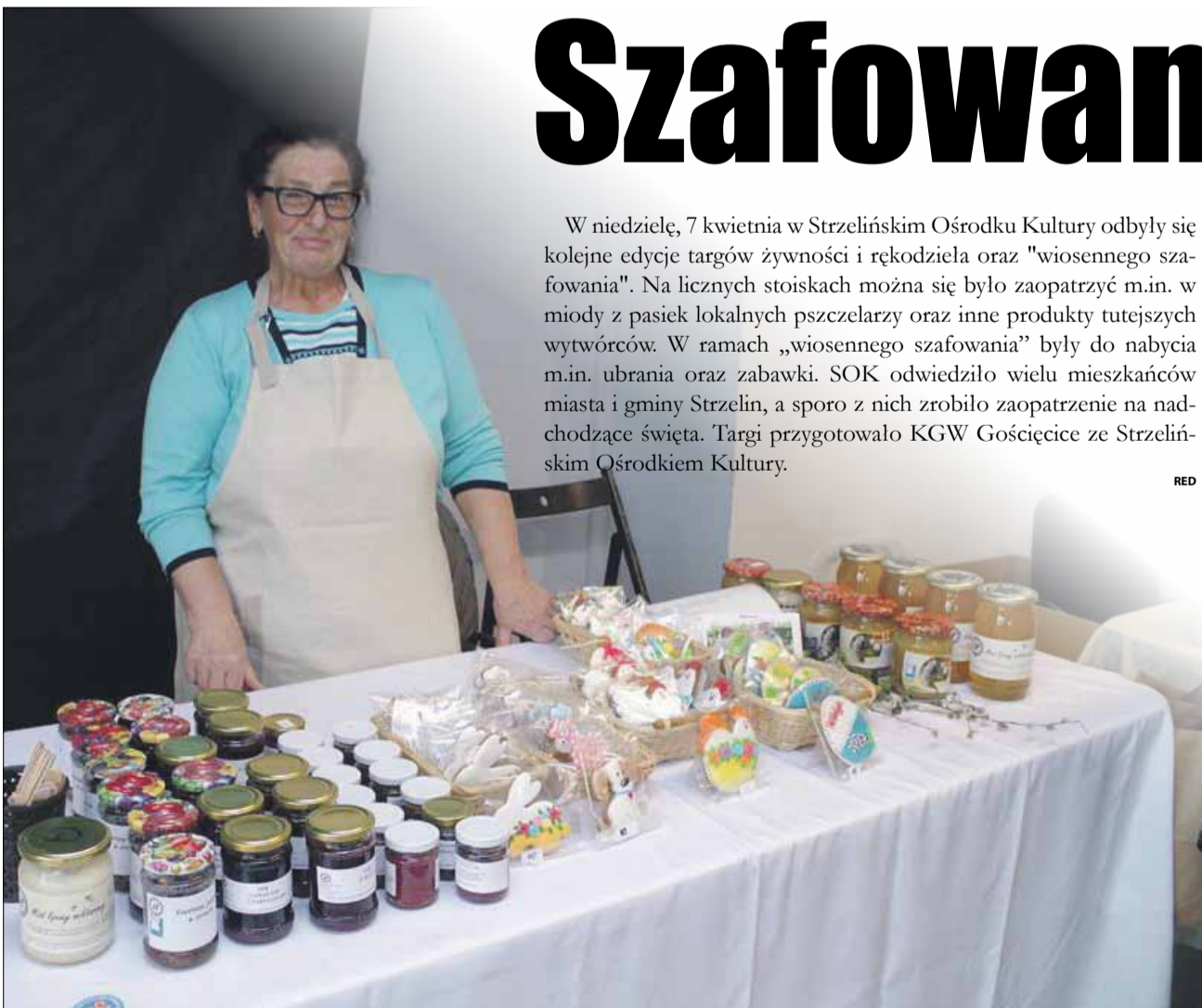
Na stoisku Pani Malinowskiej można było kupić pyszne miody