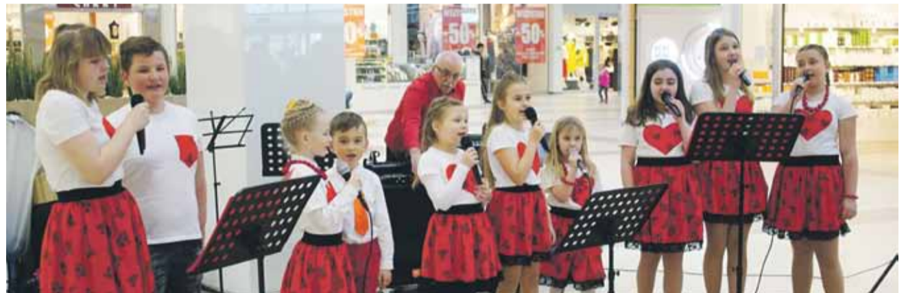
W galerii wystąpiły m.in. „Gęsińskie Nutki”