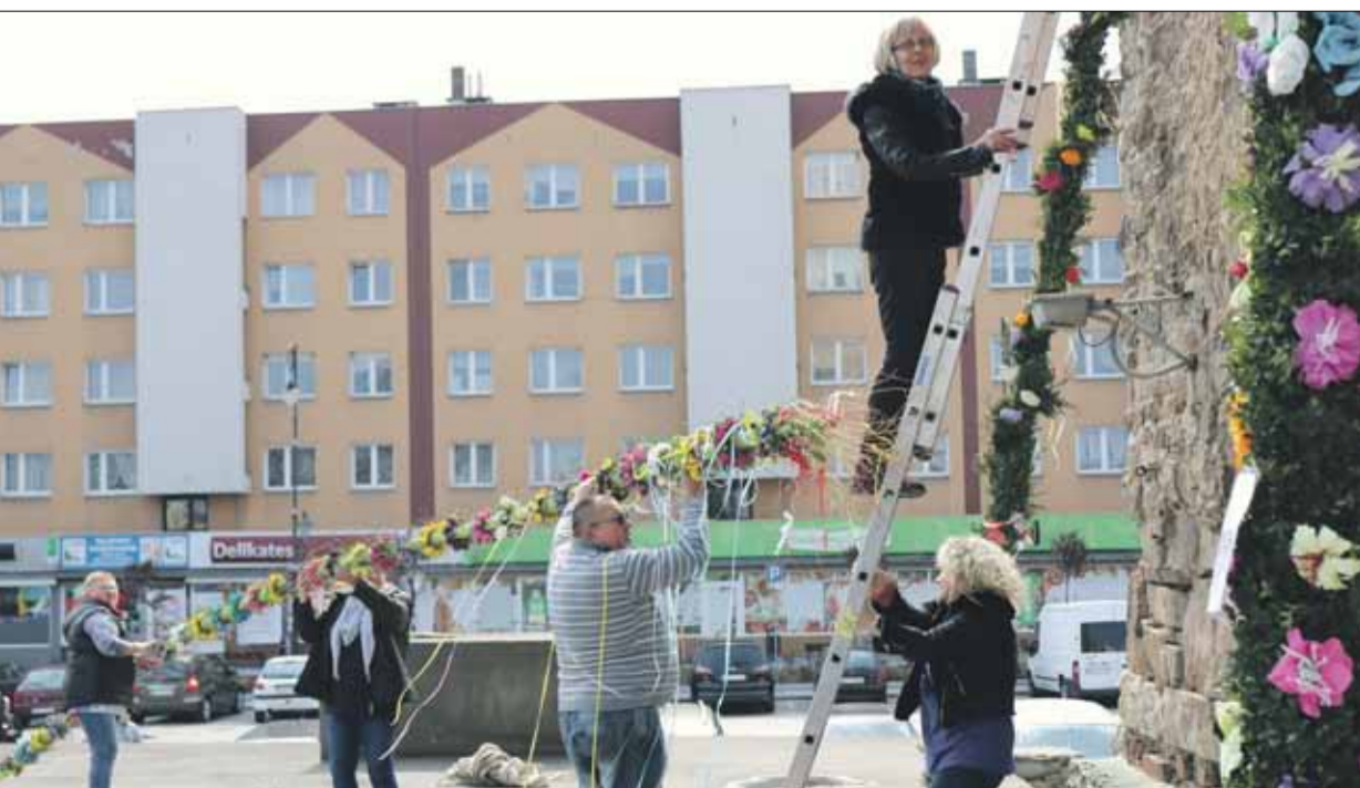
...al nie był łatwym zadaniem

Członkini KGW ze Szczawina podaje ciekawy przepis