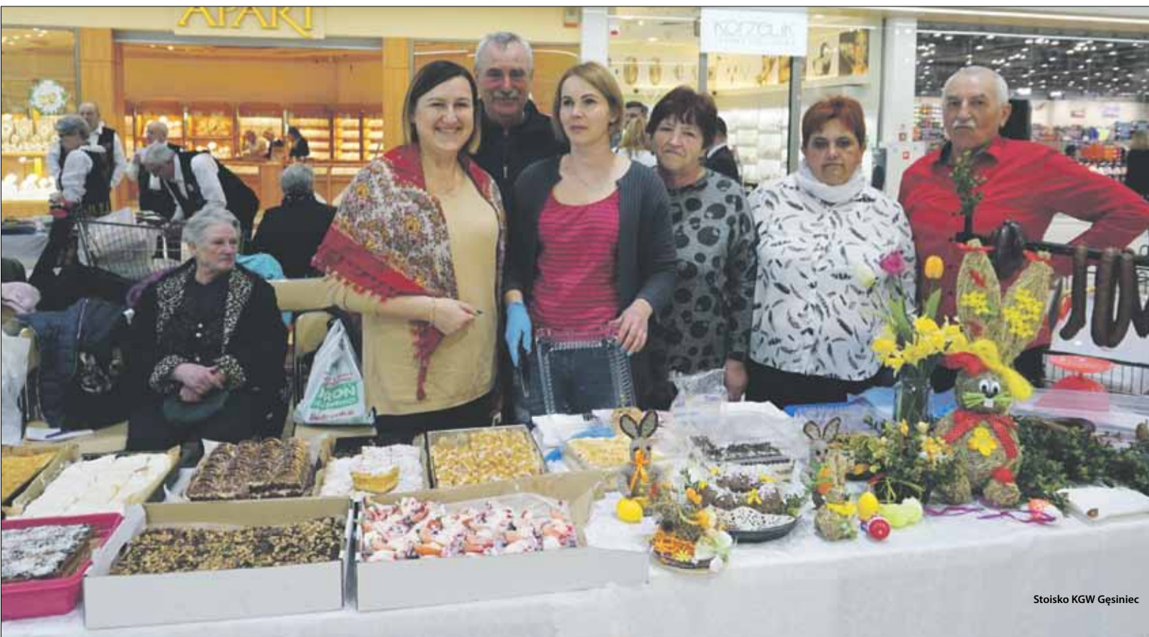
Stoisko KGW Gęsiniec