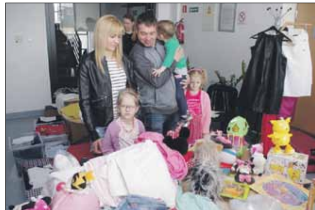
Na stoiskach wiosennego szafowania dominowały zabawki i ubrania