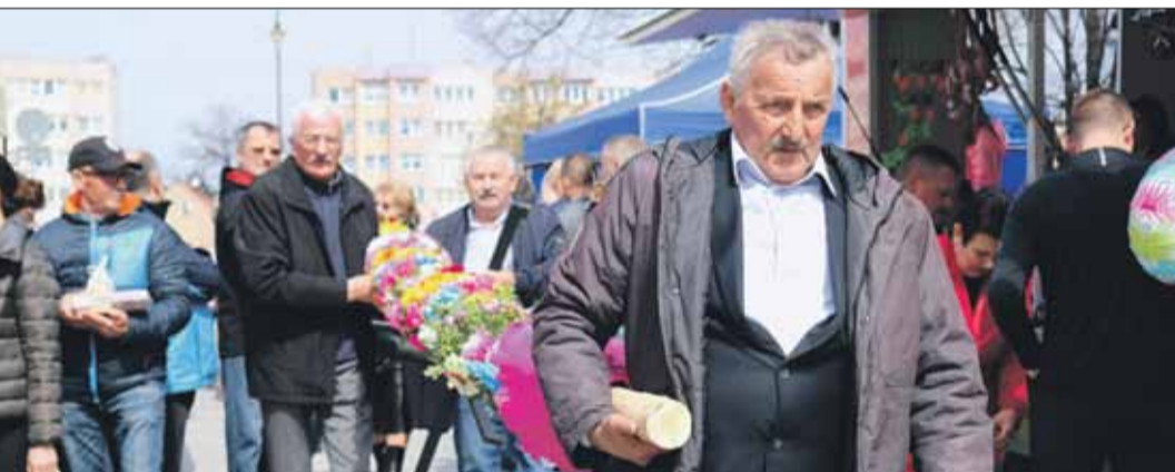
...palmy zgłoszone na konkurs były tak długie, że niosło je kilka osób