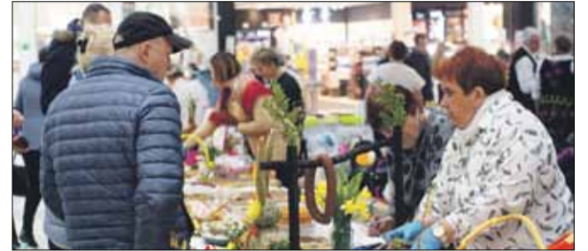
Na stoisku KGW z Gęsińca były ozdoby, ciasta i wędliny