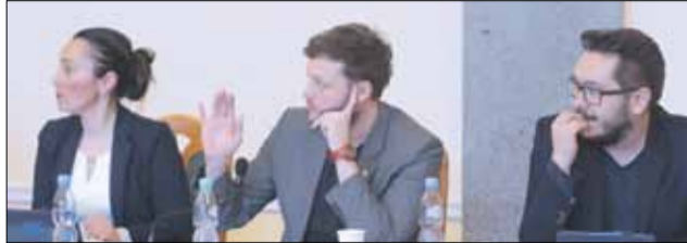
Na VII sesji przyjęto 19 uchwał

11. Uchwała nr VII/84/19 w sprawie szczegółowych zasad wnoszenia inicjatyw obywatelskich, tworzenia komitetów inicjaty-