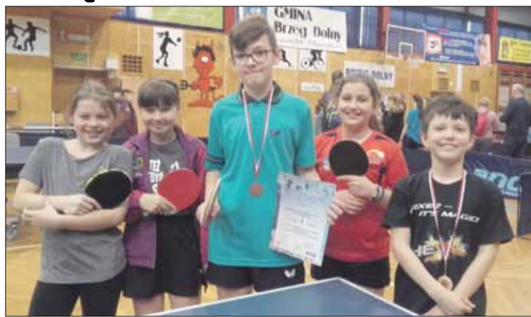
Reprezentacja PSP nr 4 w Strzelinie zajęła w zawodach III miejsce