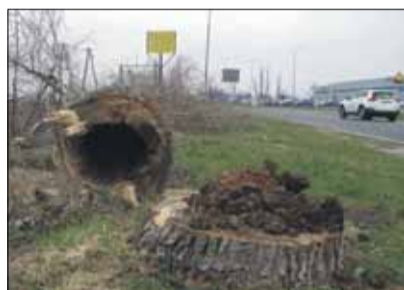
Wiele wyciętych topoli było w bardzo złym stanie

Przy drodze wojewódzkiej 395, na odcinku Strzelin-Ludów Polski, prowadzona jest wycinka niebezpiecznych dla kierowców topól. W niedalekiej przyszłości zastąpią je lipy drobnolistne. O zgodę na wycinkę wystąpił zarządca drogi 395 - Dolnośląska Służba Dróg i Kolei. Znacz-