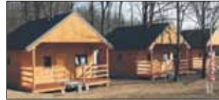
Na terenie Ośrodka Wypoczynkowego „Nad Stawami” w Białym Kościele stoją już nowe domki

Coraz bliżej końca prac modernizacji Ośrodka Wypoczynkowego „Nad Stawami” w Białym Kościele. Na terenie obiektu stoją już 22 nowe domki letniskowe. Każdy z nich może pomieścić 6 osób. Obecnie zakończono odbiory wykonania domków parterowych oraz przyłączy wodnokanalizacyjnych i energetycznych.