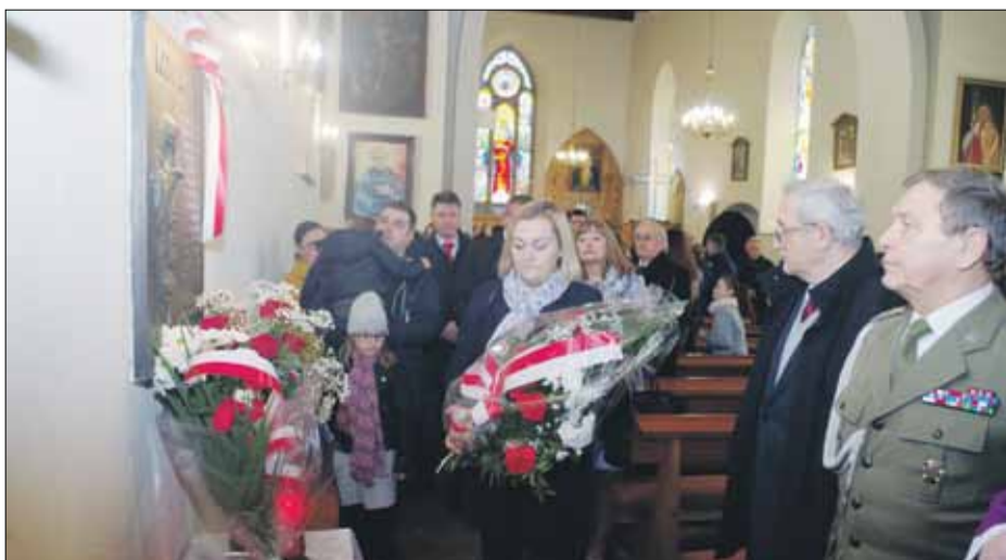
Kwiaty i znicze złożyły pod epitafium oficjalne delegacje