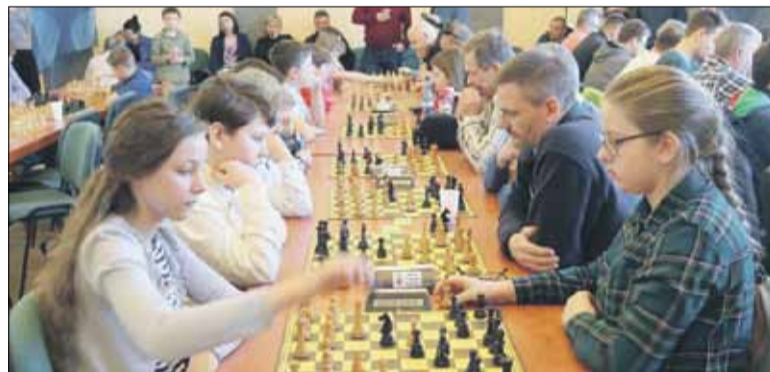
W turnieju wzięło udział 42 zawodników