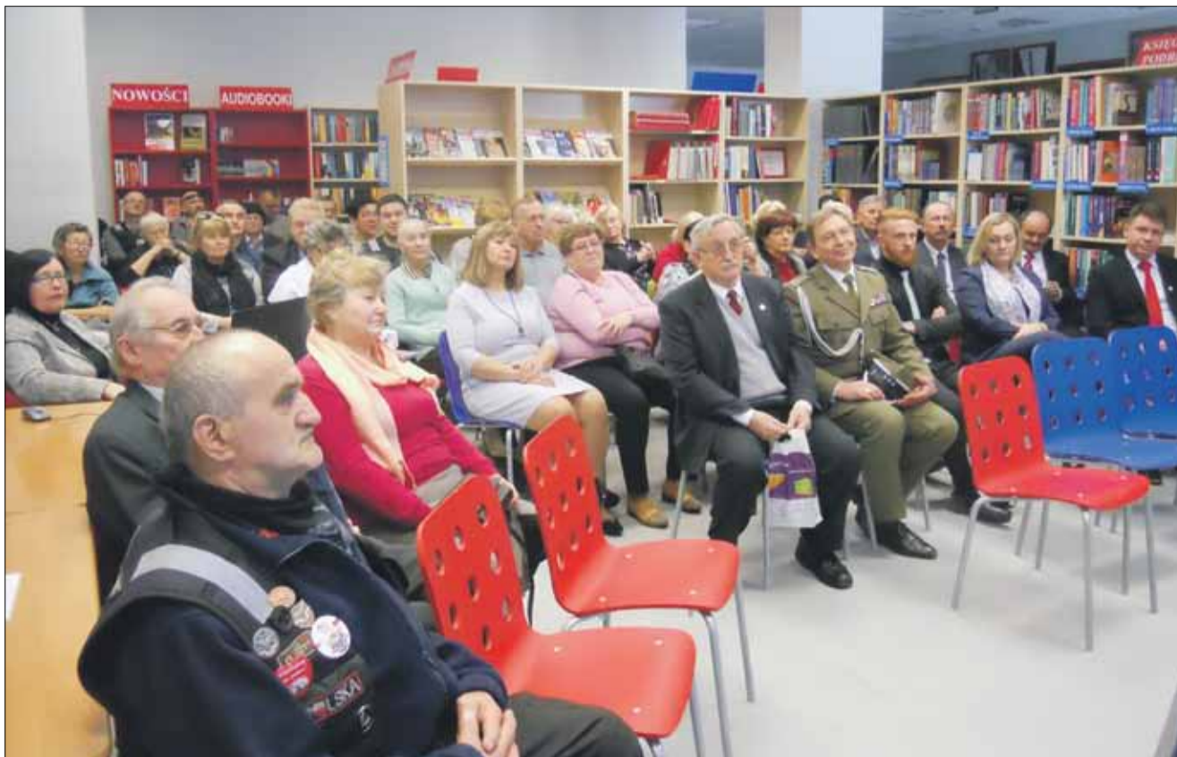
Uczestnicy spotkania w skupieniu wysłuchali opowieści o kobietach ze Lwowa w wykonaniu autorki tak zatytułowanej książki

Miejska Biblioteka Publiczna w Strzelinie