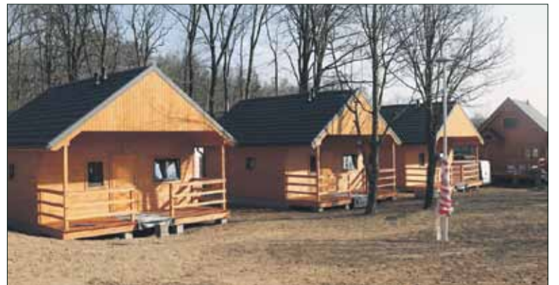
Na terenie Ośrodka Wypoczynkowego „Nad Stawami” w Białym Kościele stoją już nowe domki