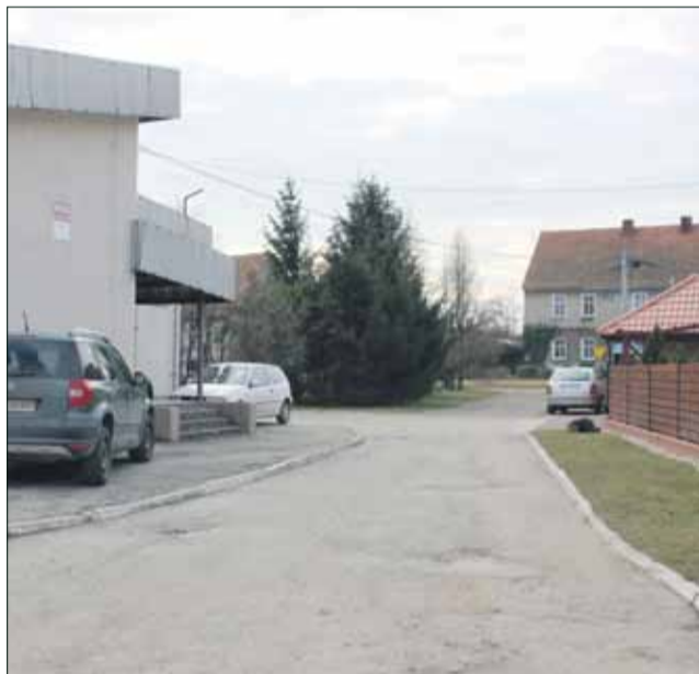
O remont drogi zabiegali mieszkańcy Biedrzychowa