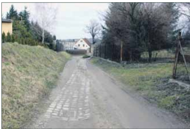
Ul. Dębowa w Geśiniecu zostanie wyremontowana