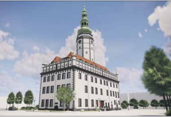
Wygląd odbudowanego ratusza