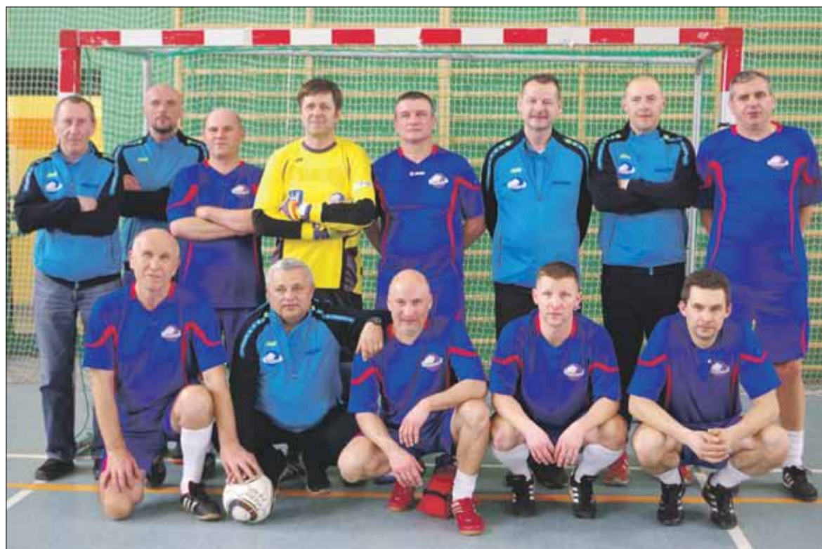
Turniej wygrała drużyna Polar Wrocław