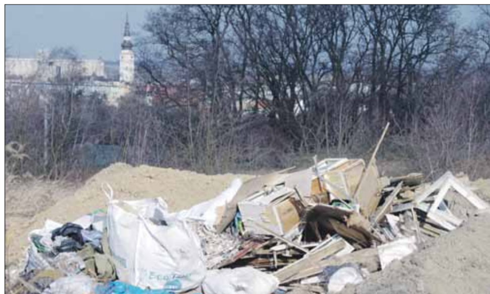
Takie odpady porzucano 2 marca na Górze Szańcowej. Sprawcę szybko wykryto i przykładowo ukarano

Nielegalnie odpady pochodziły z remontu budynku. Były tam m.in. stare meble i wyposażenie oraz elementy budowlane. Piszemy o tym, żeby przestrzec wszystkich, którzy w imię pozornej oszczędności i wielkiej bezczelności nielegalnie pozbywają się odpadów, niszcząc środowisko i psując estetykę oraz wizerunek miasta i gminy. Władze gminy Strzelin oraz podległa im straż miejska nie zamierzają pobrać takim delikwentom i sprawcy podobnych wykroczeń muszą się liczyć z poważnymi konsekwencjami finansowymi.