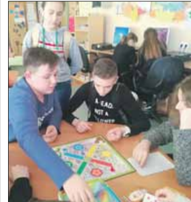
Uczniowie skorzystali z dobrej rozrywki

Biblioteka w Publicznej Szkole Podstawowej nr 4 w Strzelinie zorganizowała w marcu Tydzień Gier Planszowych. W czytelnicy powstały specjalne miejsca z grami planszowymi. Wszyscy zainteresowani uczniowie mogli skorzystać z dobrej rozrywki. Panie bibliotekarki zagwarantowały duży wybór gier i wesołą zabawę. Gry planszowe to świetna odskocznia od świata pełnego komputerów, telefonów komórkowych i telewizji oraz okazja do kreatywnego spędzenia czasu. Atrakcyjne pod względem graficznym, gry planszowe rozwijają również umiejętności kluczowe, czytanie, liczenie, rozumowanie.