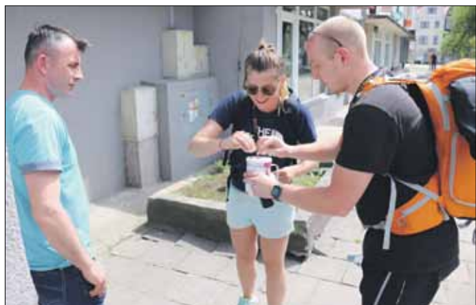
Akcji przyświecał charytatywny cel