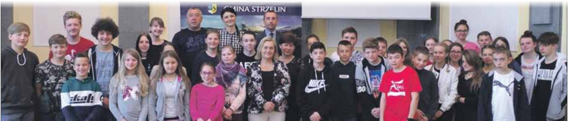
Uczestnicy wymiany odwiedzili strzeleński magistrat

W maju uczniowie Publicznej Szkoły Podstawowej nr 4 im. Tadeusza Kościuszki w Strzelinie uczestniczyli w trwającej już 22 lata wymianie młodzieży polsko-niemieckiej ze szkołą Heinrich-Middendorf-Oberschule w Aschendorf. Spotkanie ma na celu doskonalenie kompetencji językowych oraz poszerzenie wiedzy na temat zwyczajów, obyczajów i kultury Niemiec.