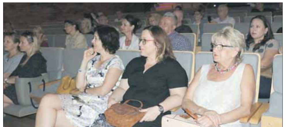
Do Strzeleńskiego Ośrodka Kultury przyszło na spotkanie kilkadziesiąt osób