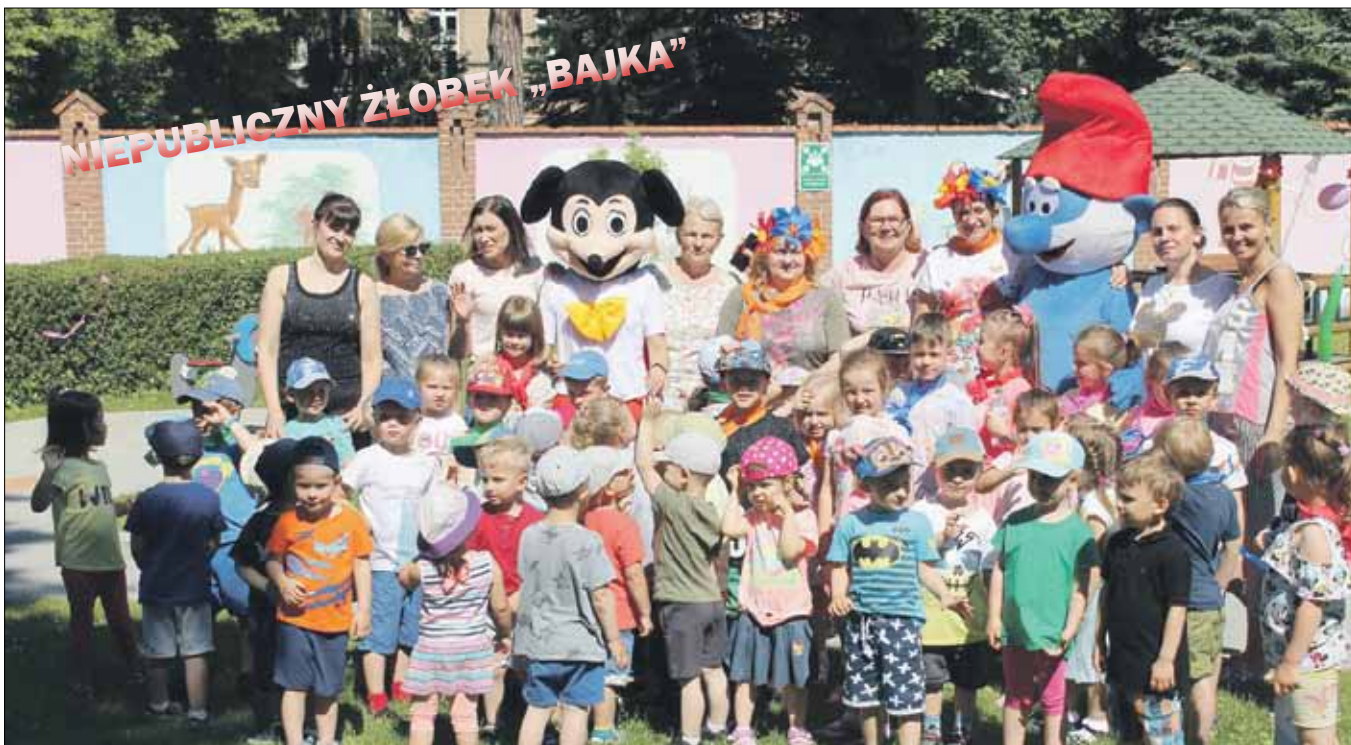
NIEPUBLICZNY ŻŁOBEK „BAJKA”