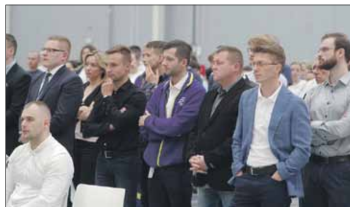
Na spotkanie zaproszono cały zespół Antolin Silesia