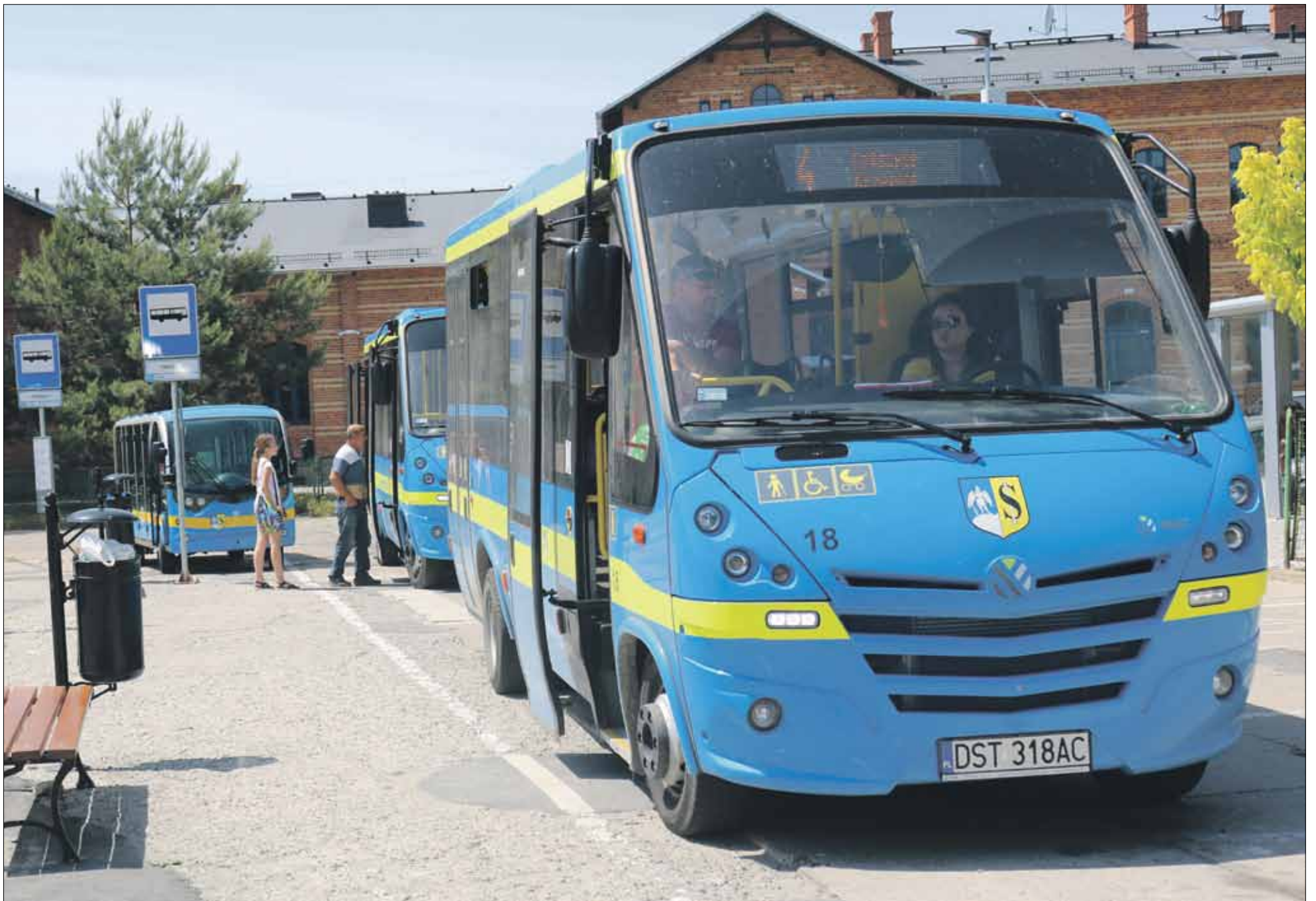
Autobusy Strzelińskiej Komunikacji Publicznej podczas wakacji będą kursowały w innych godzinach