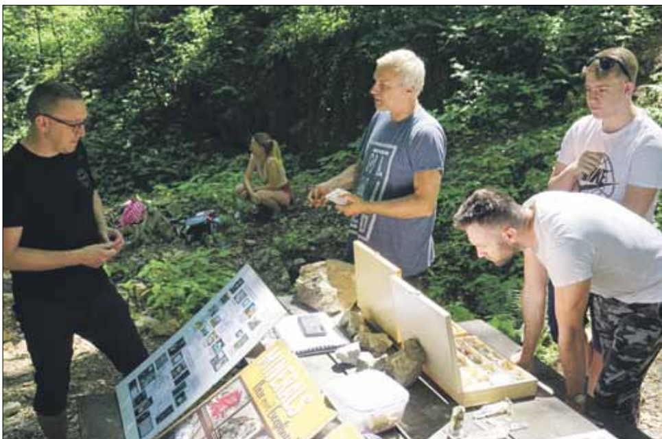
Organizatorzy przygotowali również wystawę minerałów