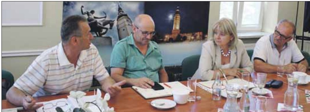
W spotkaniu uczestniczyli m.in. przedstawiciele gminy oraz DSDiK

Rozpoczęły się prace związane z remontem ulicy Aleksandra Zawadzkiego, znajdującej się na strzeleńskim osiedlu „na Skarpie”. Wykonawcą tej inwestycji jest, wyłonione w ramach przetargu nieograniczonego, Przedsiębiorstwo Handlowo-Usługowe ZURB z Borowa, które realizuje prace za blisko 179 tys. zł. Zdegradowana nawierzchnia bitumiczna jezdni zostanie sfrezowana i zdjęta. Wraz z jej rozbiórką usunięte zostaną krawężniki betonowe. Zakres wykonywanych prac obejmuje ułożenie nowej nawierzchni bitumicznej, wtopionego krawężnika betonowego na lawie betonowej, regulację wpustów deszczowych, wymianę skrzynek i urządzeń obcych (np. zaworów wody, itp.), które zostały uszkodzone w trakcie eksploatacji ulicy. Prosimy o zachowanie ostrożności w rejonie prowadzonych prac.