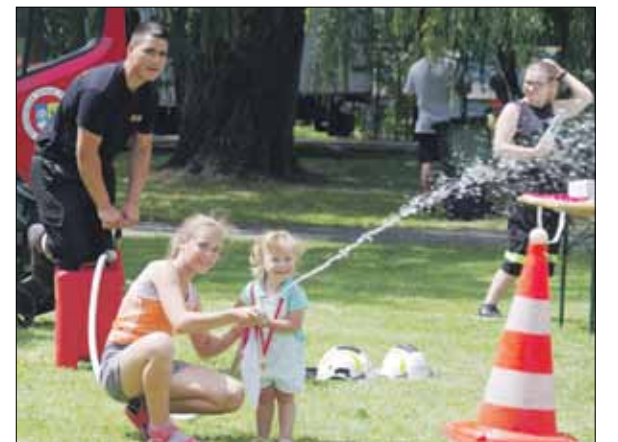
Wielkim zainteresowaniem cieszyły się m.in. hydronetki