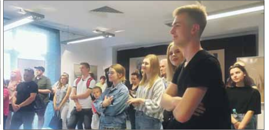
Wernisaż cieszył się sporym zainteresowaniem