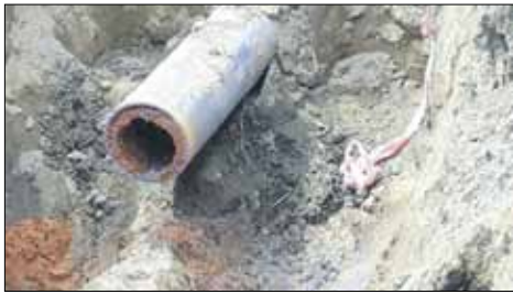
Tak wyglądał osad w wodociągu wody surowej, który musieli wyczyścić pracownicy ZWiK