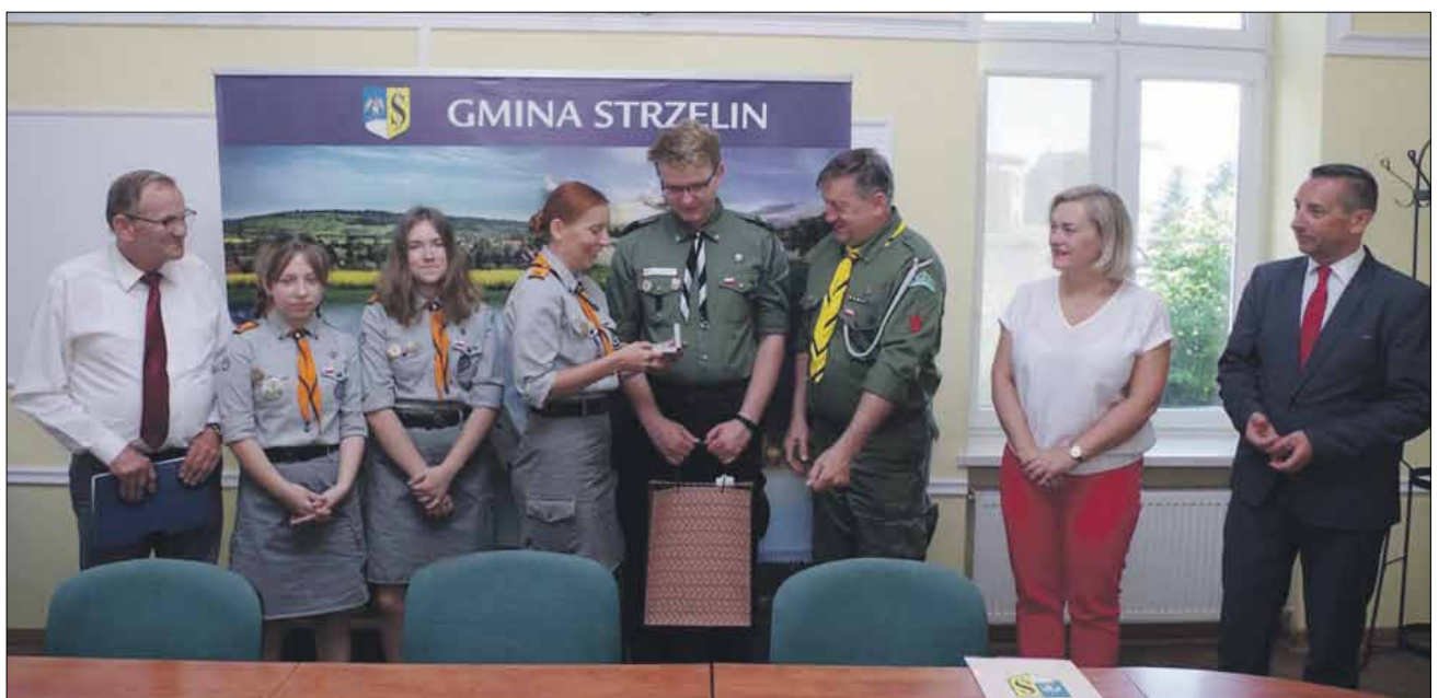
Podczas kameralnej uroczystości harcerze otrzymali klucze do nowej harcówki