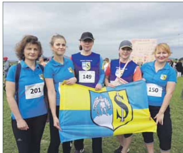
W biegu na 500 m wystartowała m.in. reprezentacja strzeleńskiego magistratu