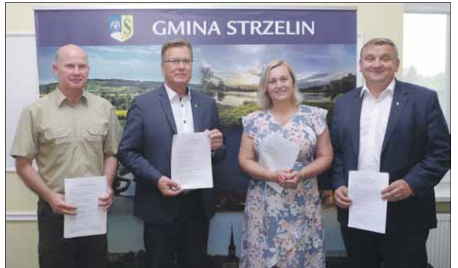
Sygnatariusze listu intencyjnego i umowy partnerskiej