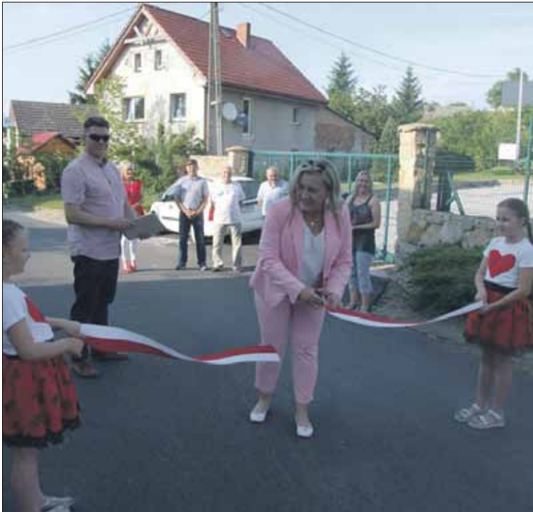
Podczas uroczystości przecięto tradycyjną wstęgę

Będą wspólnie promować Wzgórza Strzeleńskie