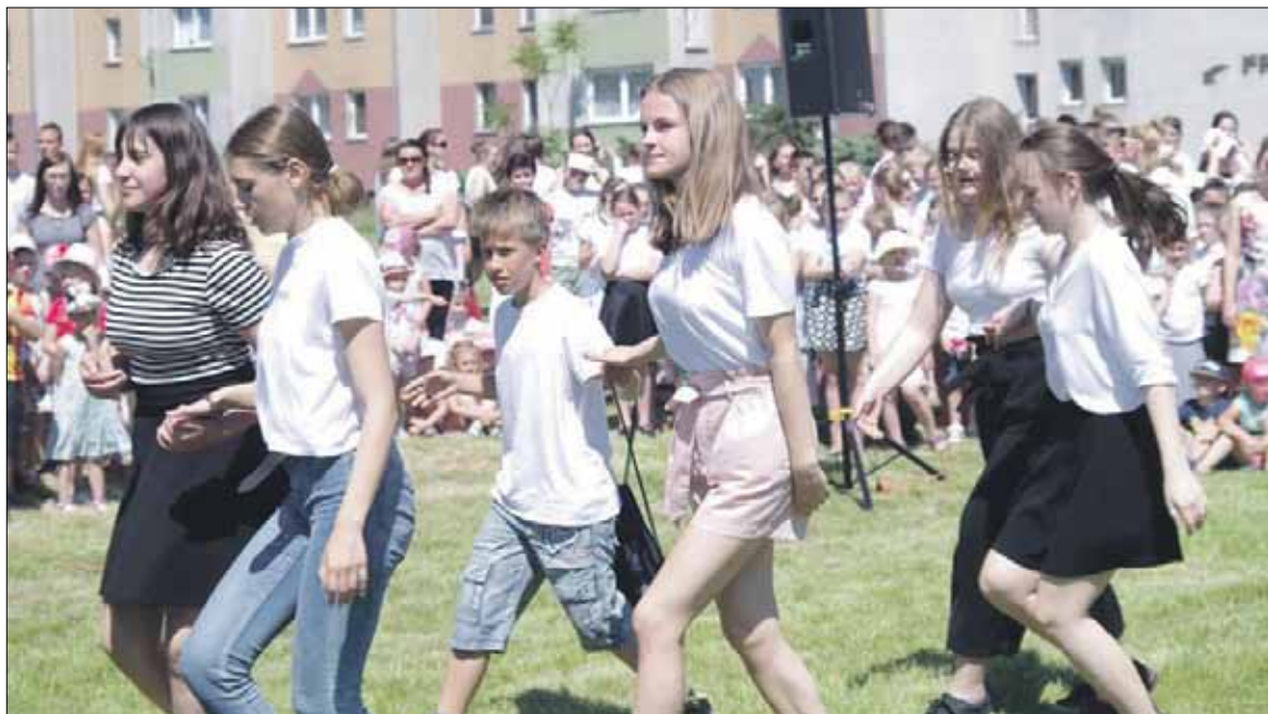
Taniec „Belgijka” zaprezentowali uczniowie PSP nr 5 w Strzelinie

W wydarzeniu uczestniczyli m.in. uczniowie szkół podległych gminie Strzelin