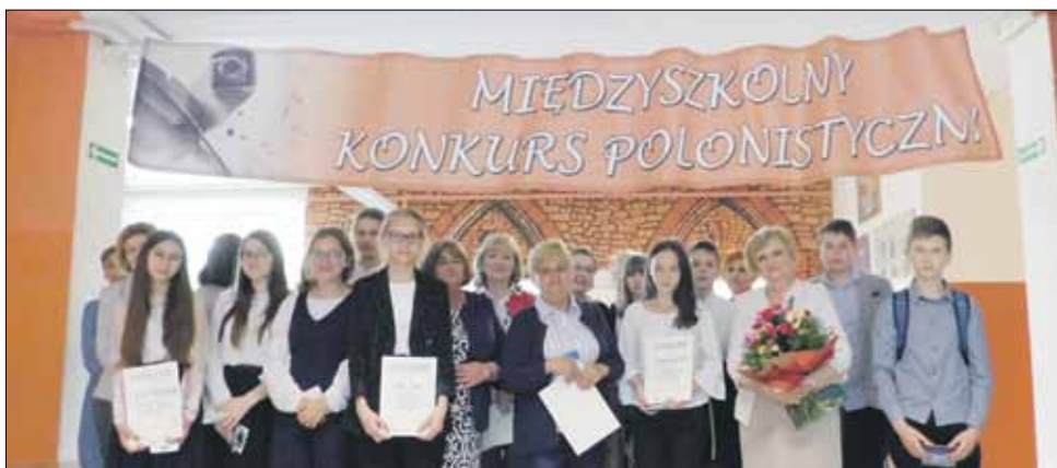
Oto laureaci Międzyszkolnego Konkursu Polonistycznego

Pod koniec maja w Publicznej Szkole Podstawowej nr 5 w Strzelinie odbył się piętnasty jubileuszowy Międzyszkolny Konkurs Polonistyczny. Kto tym razem okazał się najlepszy?