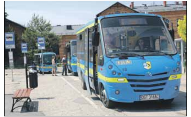
Autobusy Strzeelińskiej Komunikacji Publicznej podczas wakacji będą kursowały w innych godzinach

Z wyprzedzeniem i w pierwszej kolejności, nowe rozkłady