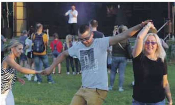
Zabawa przy tanecznych rytmach trwała do wieczora