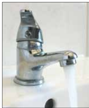
W czerwcu zmieniła się taryfa opłat za wodę i ścieki

za m3, zaś ścieków 9,58 zł. Łącznie mieszkańcy zapłacą więc 13,65 zł za m3 wody i ścieków. To mniej o 10 gr/m3 w porównaniu do ubiegłego roku. - Trzeba zaznaczyć, że opłata za m3 ścieków wynika z dopłaty (obecnie 1,64 zł do każdego m3), którą od dwóch lat stosuje Gmina Strzelin, a którą to przyjęli strzeLińscy radni – wyjaśnia prezes