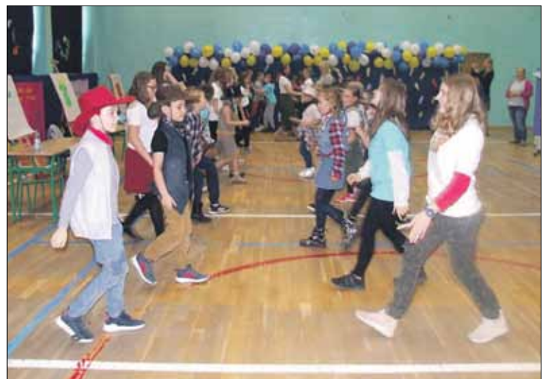
Głównym celem przedsięwzięcia była integracja