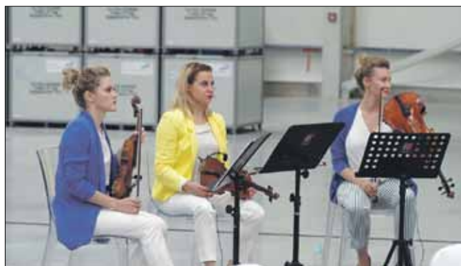
Uroczystość uświetnił występ kwartetu smyczkowego Neonquartet