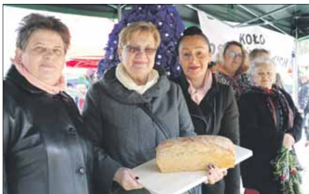
Zawiązane niedawno Koło Gospodyń Wiejskich w Szczawinie ma za sobą m.in. udział w tegorocznym jarmarku wielkanocnym

– Jesteśmy otwarci i zachęcamy do przyłączania się. W naszych szeregach przydadzą się nie tylko panie, ale także mężczyźni, którzy będą mogli pomóc nam w bardziej fizycznych zadaniach – przekonuje. Koło ma już za sobą kilka udziałów w różnych imprezach. Naj-