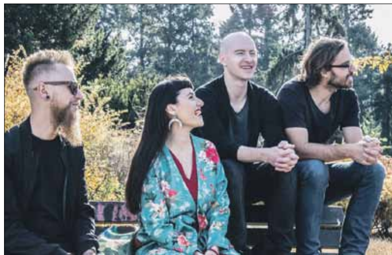
Na koncercie inauguracyjnym nowy sprzęt wystąpi zespół Charles Pakowsky

Tomasz Sekielski powiedział m.in. o wstrząsającym filmie dokumentalnym