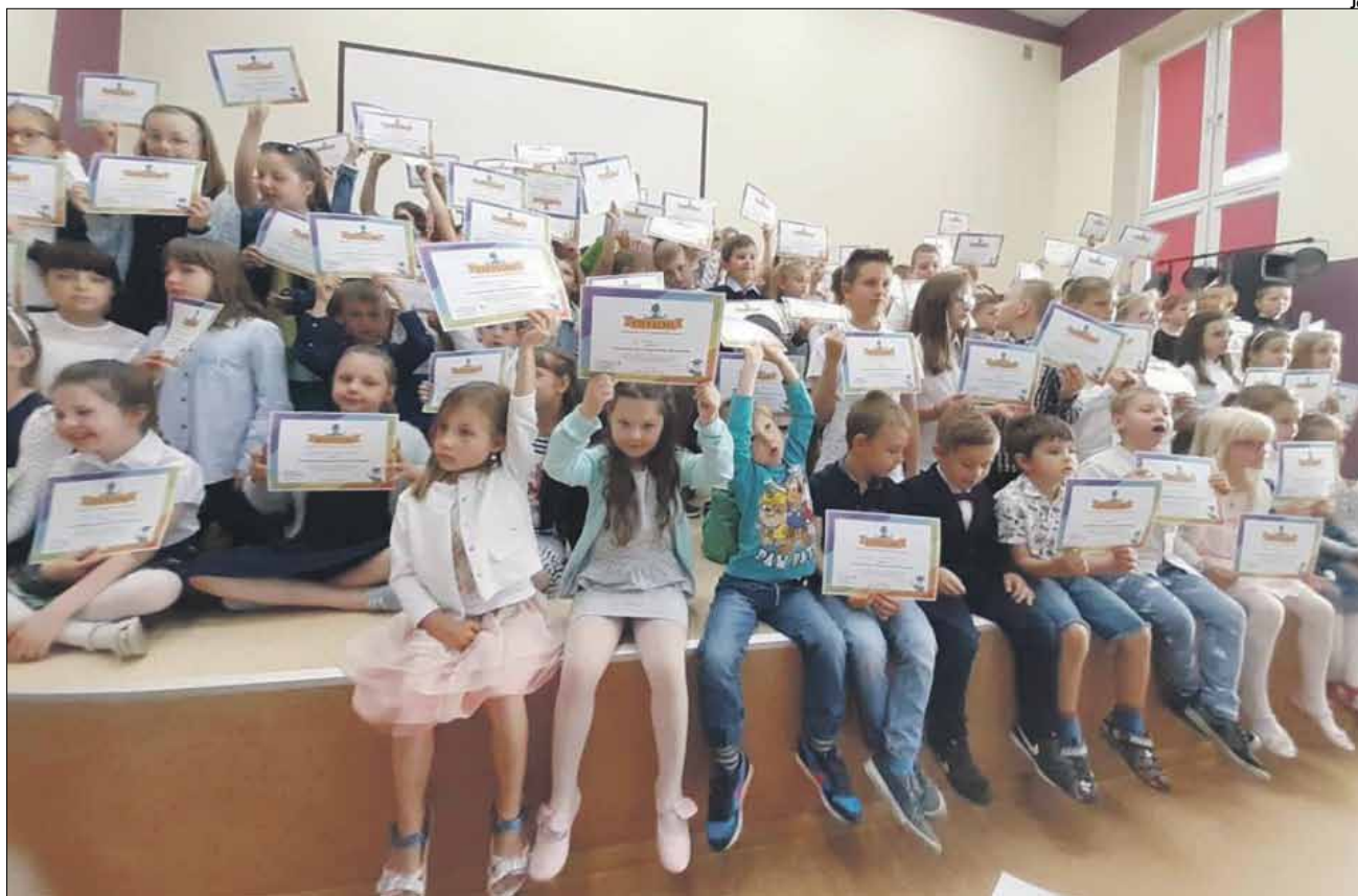
Ponad 150 osób uczestniczyło w zakończeniu roku akademickiego Strzeleńskiego Uniwersytetu Dziecięcego

ekonomii, fizyki i astronomii, tańca i malarstwa, chemii, robotyki oraz programowania, dziennikarstwa, improwizacji i akrobatyki. Dodatkowo przewidziane są spotkania ze sławnymi osobami ze świata polityki, sportu, a także lekcje żywej historii w muzeach, muzyki czy kultury.