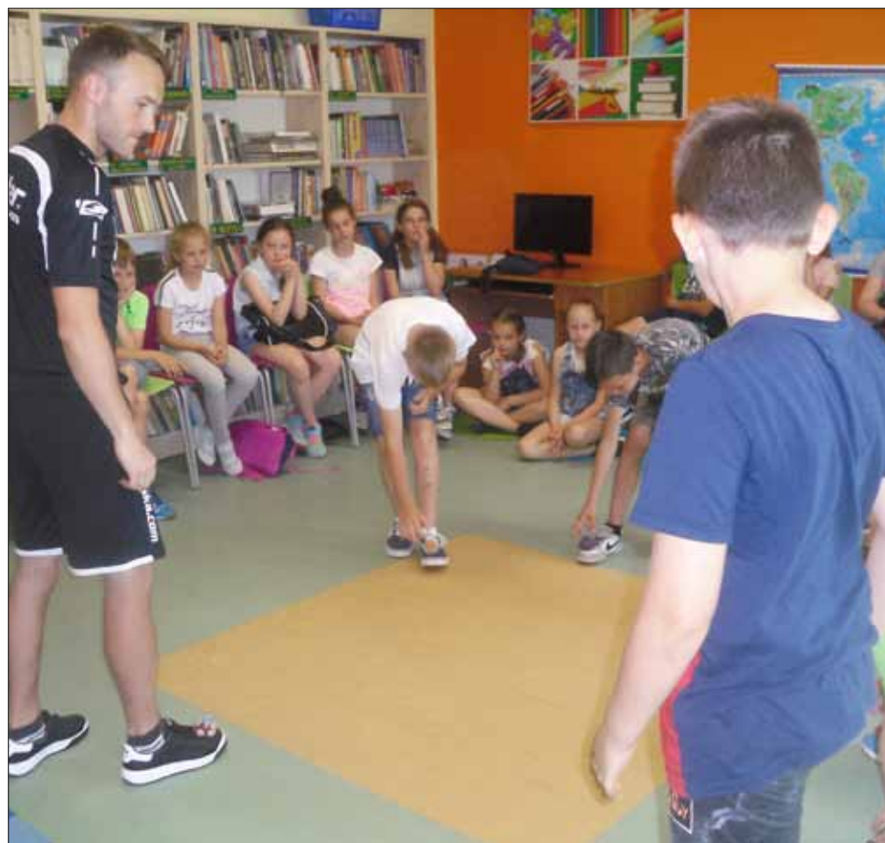
Każdy chciałby tak żonglować „zośką”, jak mistrz Rafał Kaleta

tę „Z książką na walizkach”. Tym razem - w ramach tej tradycyjnej imprezy, organizowanej od wielu lat przez DBP we Wrocławiu - przybyła do nas pisarka Renata Piątkowska, której utwory dobrze znają także nasi młodzi czytelnicy. Jak przystało na laureatkę Orderu Uśmiechu wszystkich ujęła swoim przyjazną naturą... no i ciepłym uśmiechem. Szybko złapała kontakt z dziecięcą publicznością i przeprowadziła ciekawy wywód o swoich tekstach literackich, uwrażliwiając na zawarty w nich przekaz o całkiem życiowych sprawach. Bowiem obok wątków sensacyjnych poruszyła także aktualny problem tolerancji dla inności czy kwestię właściwego traktowania zwierząt. Mimo wagi spraw wszystko podane z humorem, bez natrętnej dydaktyki. Nic dziwnego, że zauroczone autorką dzieciaki, opuszczając miejsce spotkania, koniecznie chciały zabrać ze sobą jej książki. I nie były to książki biblioteczne, ale już ich własne, opatrzone ceną