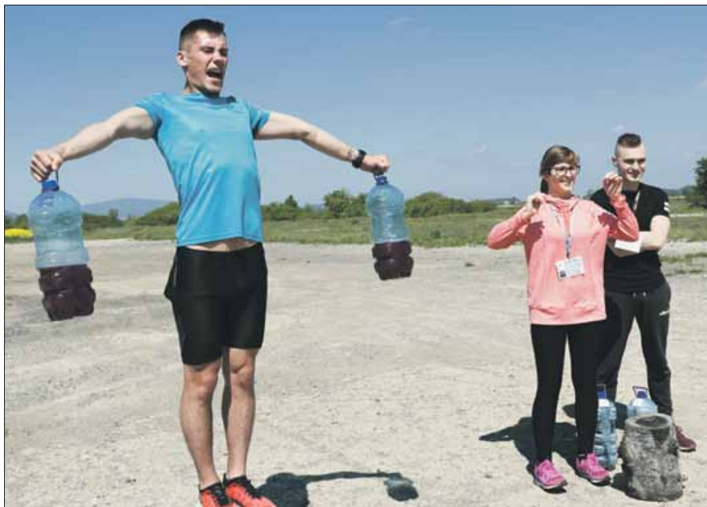
Niektóre zadania były bardzo wymagające dla uczestników