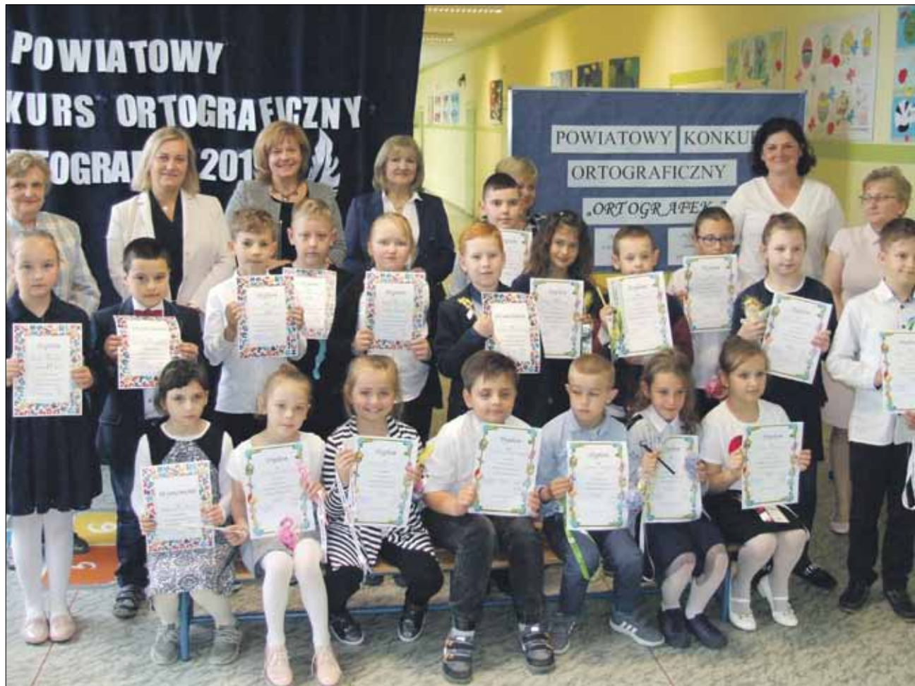
Z ortograficznymi pułapkami zmierzyło się 19 uczniów z siedmiu szkół naszego powiatu