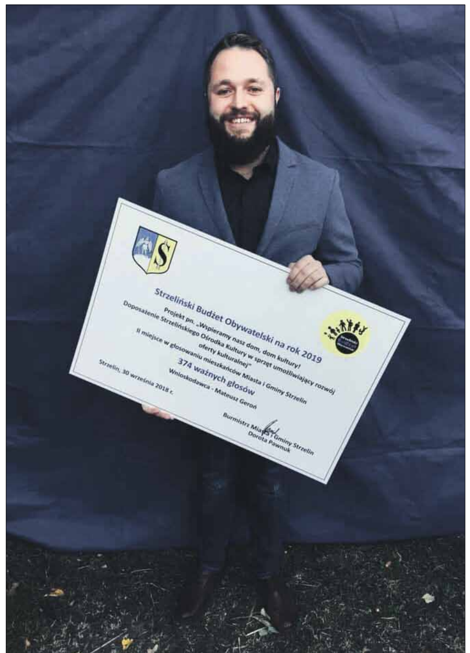
Pomysłodawcą projektu był Mateusz Geroń