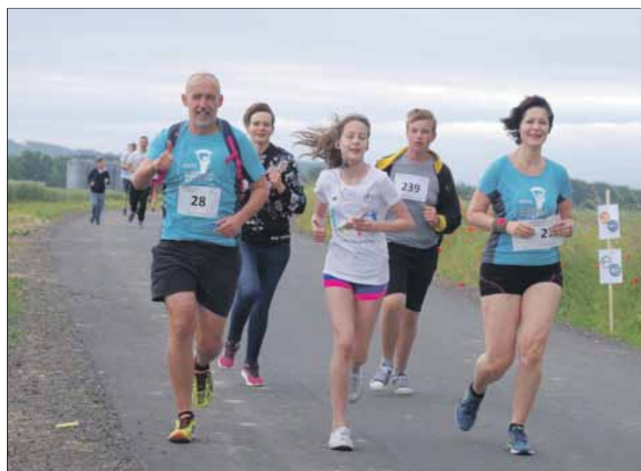
W wydarzeniu wzięli udział liczni przyjaciele i sympatycy mikoszowskiego stowarzyszenia