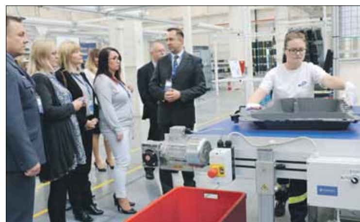
Goście mieli możliwość zwiedzenia całej fabryki