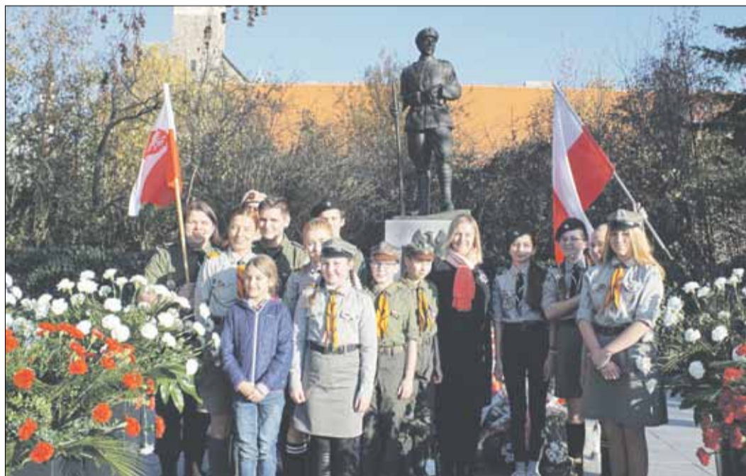
RED Uczestnicy obchodów pod Pomnikiem Legionisty