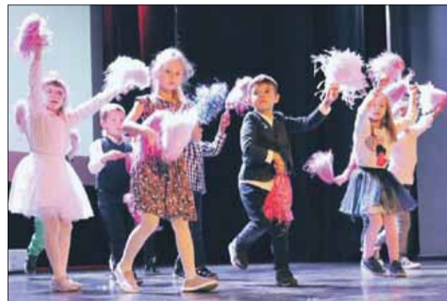
Nie zabrakło układów tanecznych