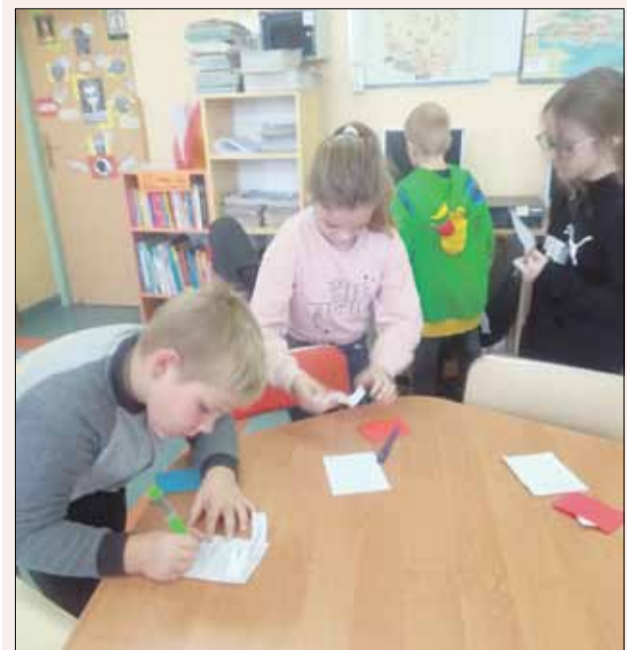
Uczniowie z dużym zaangażowaniem przystąpili do zabawy