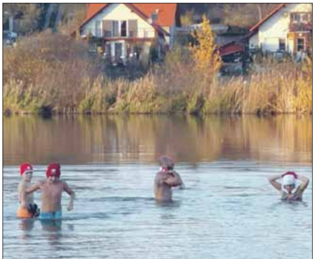
Dzieci przebywały w wodzie nieco ponad 2 minuty

Katarzyna Psiurska