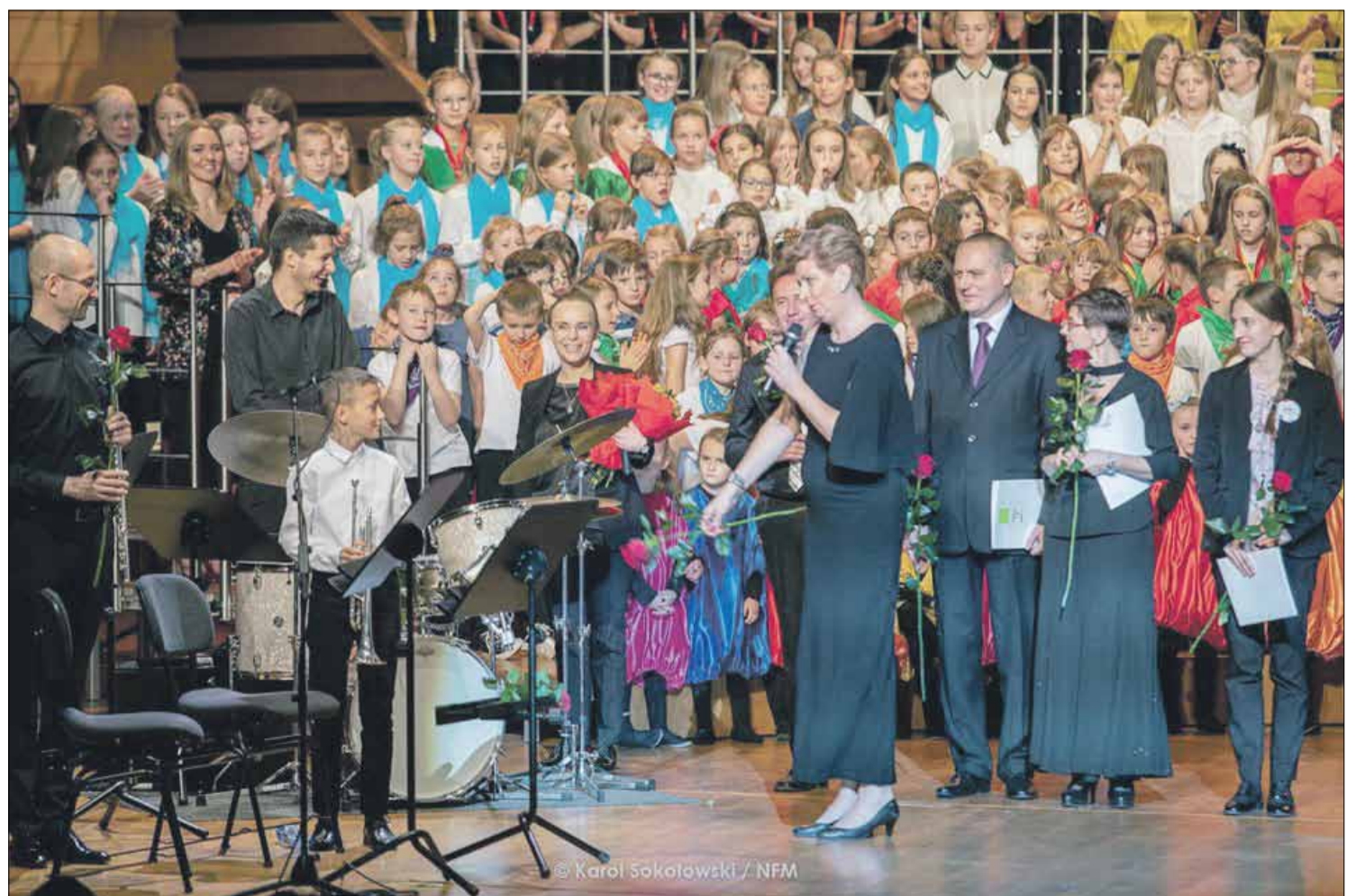
Podczas koncertu wyróżniono dyrygentów