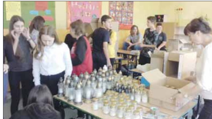
Podczas tegorocznej akcji zebrano 294 znicze białe i 258 zniczy czerwonych

roku szkoła włączyła się w akcję Ministra Edukacji Narodowej pn. „Szkoła pamięta”. Uczniowie wspominali zarówno swoich bliskich jak też tych, którzy zapisałi się w historii – tej ogólnonarodowej i lokalnej. Odwiedzili lokalne miejsca pamięci, zglębili ich historię, sprzątaли bez-