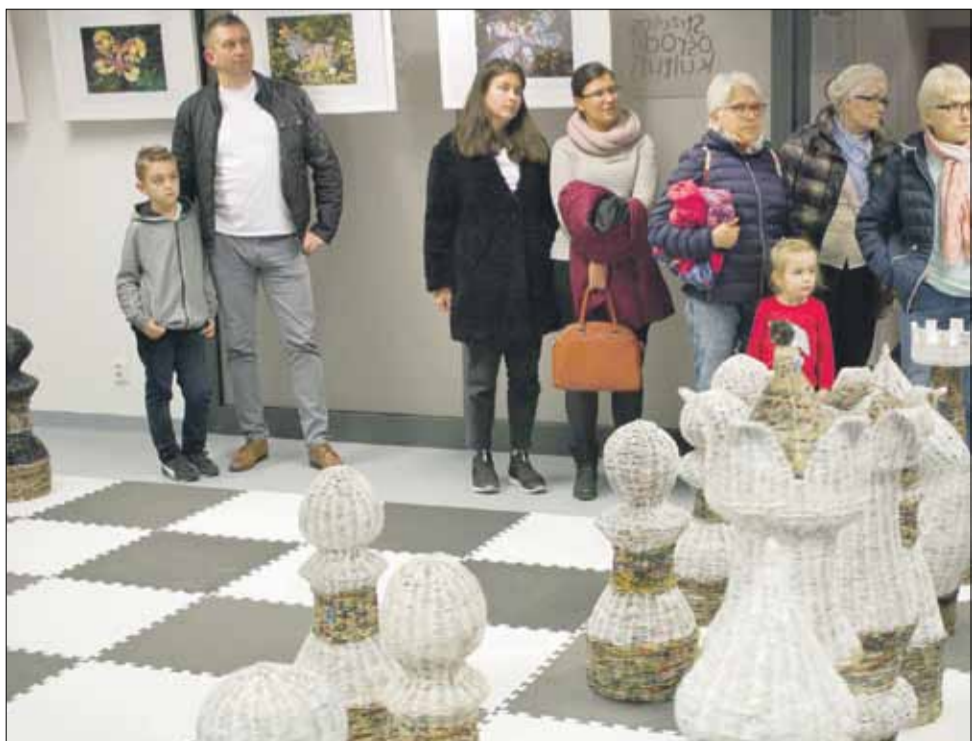
Wystawa pn. „Eko-wyploty – papierowy recykling” dostępna jest w Strzeleńskim Ośrodku Kultury