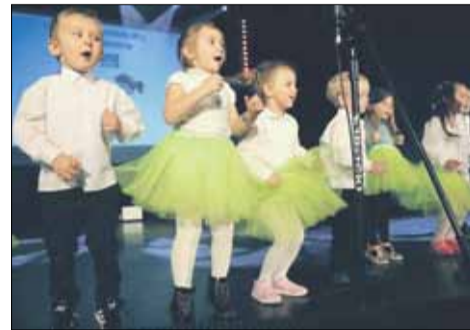
Przedszkolaki udowodniły, że mają talent