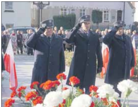
W obchodach wzięła udział m.in. delegacja zakładu karnego