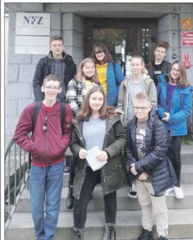
Uczniowie „Czwórki” odwiedzili podopiecznych Zakładu Pielegnacyjno-Opiekuńczego

Już po raz kolejny w bibliotece Publicznej Szkoły Podstawowej nr 4 w Strzelinie ruszyła akcja pt.: „Czytanie międzypokoleniowe”. Młodzi uczniowie odwiedzili podopiecznych Zakładu Pielegnacyjno-Opiekuńczego działający przy strzeelińskim szpitalu. Czytając książki zadbałi o tych, którzy leżąc, niejednokrotnie „przykuci” do łóżek, nie mogą uczestniczyć w wydarzeniach kulturalnych. Uczniowie z zadowoleniem i przyjemnością poświęcili czas „napelniając puste życie” osób starszych i często samotnych.