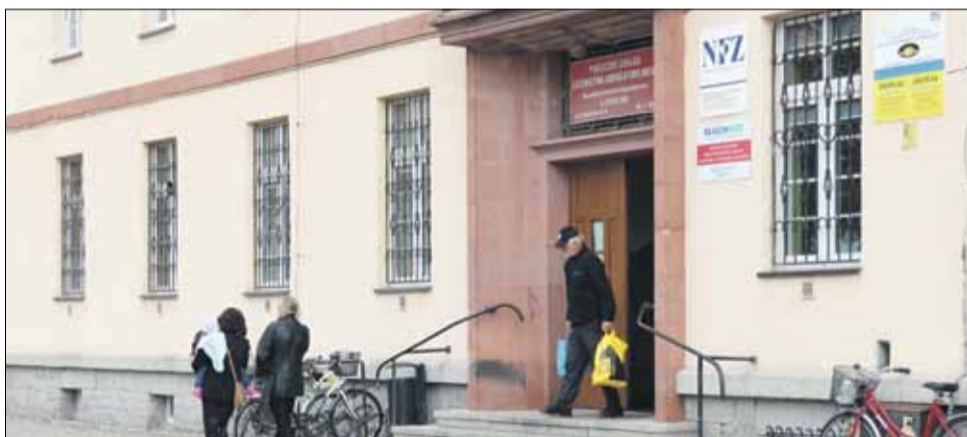
Strzeleńska przychodnia realizuje darmowe szczepienia przeciwko grypie dla osób powyżej 65 roku życia

Już ponad 300 seniorów skorzystało z darmowych szczepień przeciwko grypie. Profilaktyka jest ważna, gdyż zmniejsza powikłania, które mogą być bardzo groźne dla organizmu starszego człowieka.