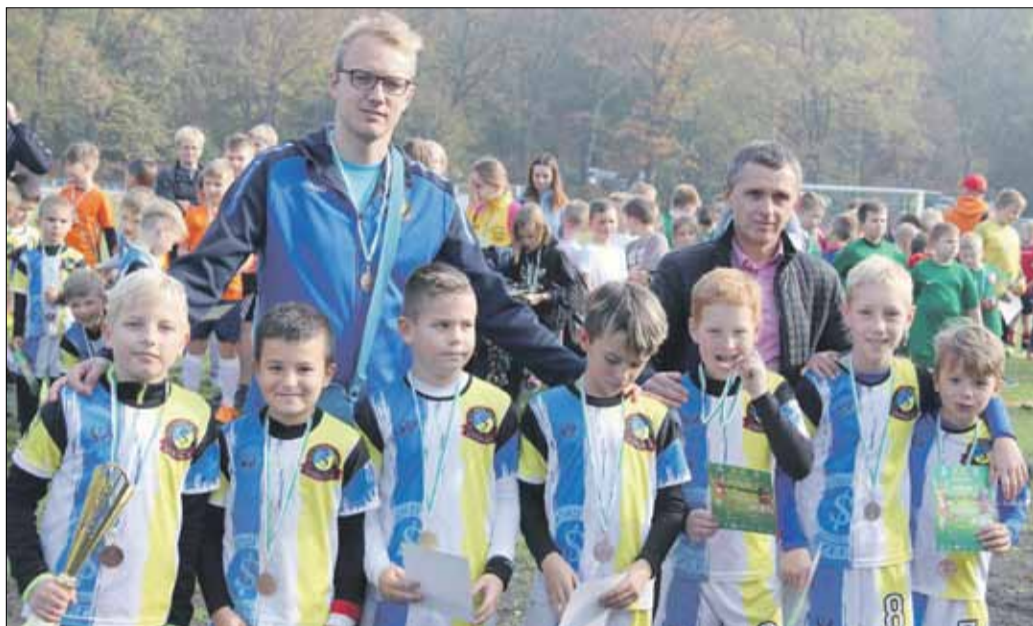
W kategorii U-10 bezkonkurencyjna była drużyna „Strzelinianki”

rii U-8. W meczu dziewcząt w kategorii U-12 SP z Borka Strzeleńskiego pokonała SP Wawrzyszów 5:0, zapewniając sobie udział w rozgrywkach wojewódzkich. Finały