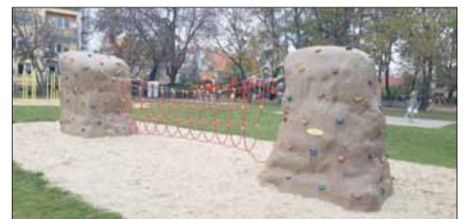
Skalki wspinaczkowe w Parku Jordanowskim w Strzelinie