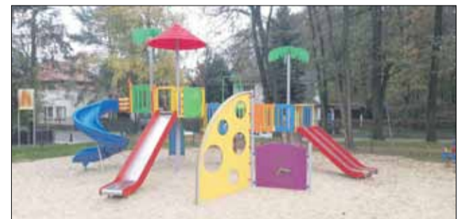
Nowy zestaw zabawowy w Parku Miejskim im. Armii Krajowej

Koniec roku to dla każdego samorządu właściwy czas na podsumowanie zrealizowanych zadań. Na łamach kolejnych wydań naszej gazety będziemy publikować materiały prezentujące wykonane przedsięwzięcia, inwestycje i remonty. W bieżącym numerze piszemy o modernizacji miejskich i gminnych placów zabaw.