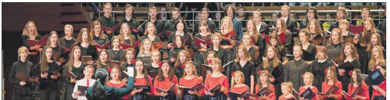
„Triole” wystąpiły w gronie najlepszych dolnośląskich chórów

„Triole” to od lat ścisła czołówka dolnośląskich chórów. Można ich usłyszeć na wielu wydarzeniach kulturalnych wysokiej rangi.