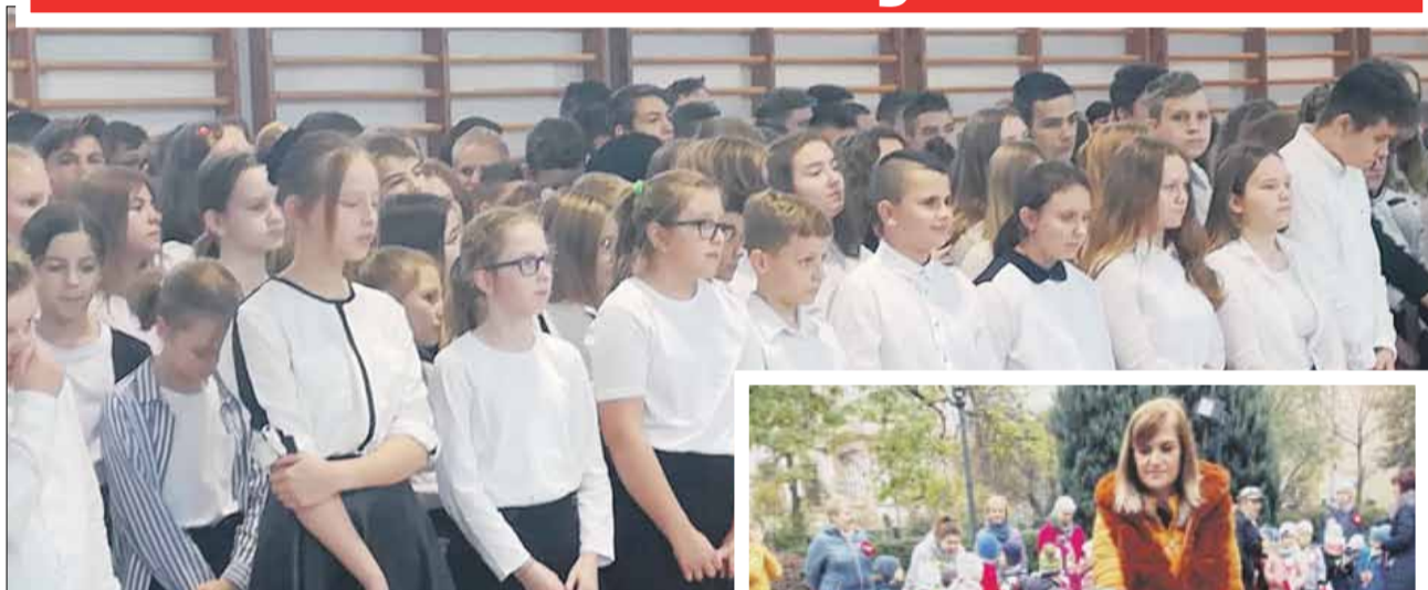
Z okazji 101. rocznicy odzyskania przez Polskę niepodległości apel odbył się m.in. w PSP nr 4 w Strzelinie

W piątek, 8 listopada w Publicznej Szkole Podstawowej w Białym Kościele podczas uroczystego apelu uczczono 101. rocznicę odzyskania przez Polskę niepodległości. Uczniowie klasy VII przypomnieli zebranych na sali gimnastycznej kolegom i koleżankom tragiczne losy Polski z okresu rozbiorów i I wojny