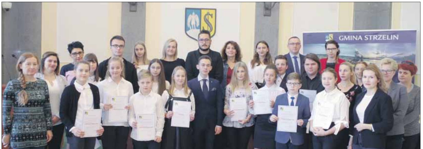
Młodzieżowa Rada Gminy Strzelin i przedstawiciele lokalnych władz