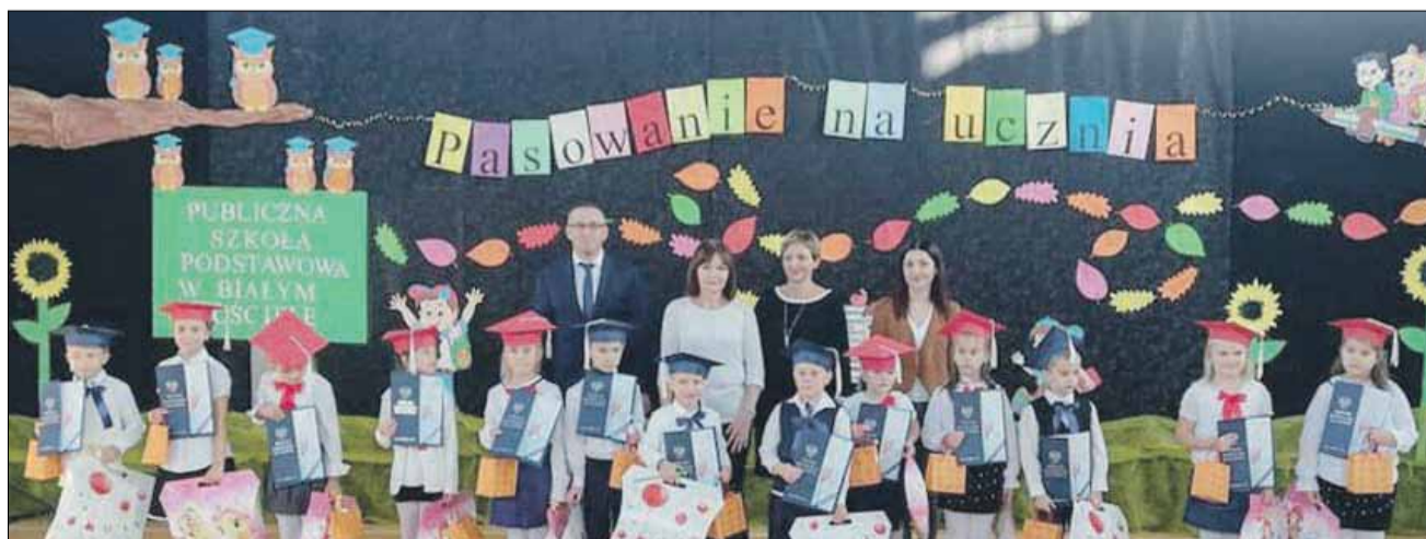
To był szczególny dzień dla pierwszoklasistów