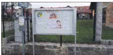
Jedną z nowych tablic zamontowano w Krzepicach

W 2019 roku sześć naszych sołectw zostało wyposażonych w nowe gabloty informacyjne. Gabloty są estetyczne, pojemne, zamykane na klucz, wyposażone w magnetyczne podłoże, szybę hartowaną oraz teleskopy. Na pewno długo posłużą sołtysom i mieszkańcom Gębzczy, Dobrogoszczy, Karszówka, Krzepic, Białego Kościoła i Pławnej. Przypomnijmy, że na tablicach są zamieszczane przede wszystkim informacje urzędowe a także materiały promujące wydarzenia kulturalne i sportowe.