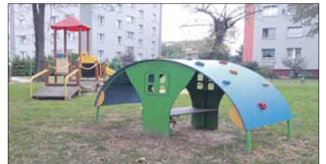
Nowe urządzenie zabawowe przy ul. Popieluszki

W 2019 roku na chętnie uczęszczanych miejskich placach zabaw zamontowano kilka nowych urządzeń zabawowych. Nowoczesne zestawy pojawiły się m.in. w Parku Miejskim im. Armii Krajowej oraz na placu zabaw przy ul. Dubois. W tym drugim miejscu zakup sfinansowano ze środków funduszu osiedlowego Osiedla Zachodniego. Strzeleński plac zabaw przy ul. Ks. Jerzego Popieluszki wzbogacił się o domek wspinaczkowy i bujaczek, a w Parku Jordanowskim zamontowano nową atrakcję - skalki wspinaczkowe połączone mostem linowym. Nowe urządzenia przybyły także w sołectwach. Dla Kazanowa zakupiono karuzelę kołową, a w Muchowcu jeszcze w listopadzie zostanie zamontowany stół do tenisa stołowego. Szczawin wzbogacił się o nową huśtawkę wahadłową a w Pławnej na tzw. „nowym osiedlu”