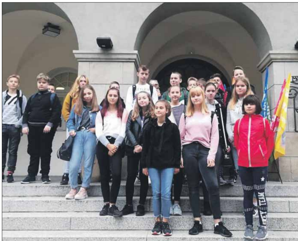
Uczniowie ze szkoły w Białym Kościele uczestniczą w cyklicznych wyjazdach na warsztatowe lekcje fizyki i chemii