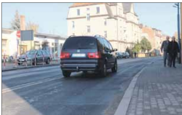
Od dłuższego czasu trwają rozmowy w sprawie remontu ulicy Wolności w Strzelinie

Po zapoznaniu się z aktualnymi uwarunkowaniami omówiono zasady współpracy oraz ustalono kolejność działań prowadzących do rozpoczęcia realizacji inwestycji, z uwzględnieniem planowanego przez GDDKiA remontu istniejącego ronda w ciągu drogi krajowej