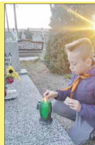
Harcerze zapalili znicze na grobach osób, które poświęciły życie abyśmy mogli żyć w wolnym kraju

W pierwszych dniach listopada cmentarze wypełnione były przez ludzi odwiedzających groby swoich bliskich. Harcerze z drużyn harcerskich działających w Strzelinie i w Białym Kościele po raz pierwszy wzięli udział w akcji „Znicz pamięci”. Zapalili znicze na grobach żołnierzy, weteranów, harcerzy, pamiętali o tych, którzy poświęcili życie abyśmy mogli żyć w wolnym kraju.