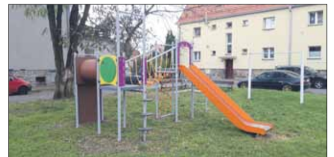
Zestaw zabawowy na placu zabaw przy ul. Dubois