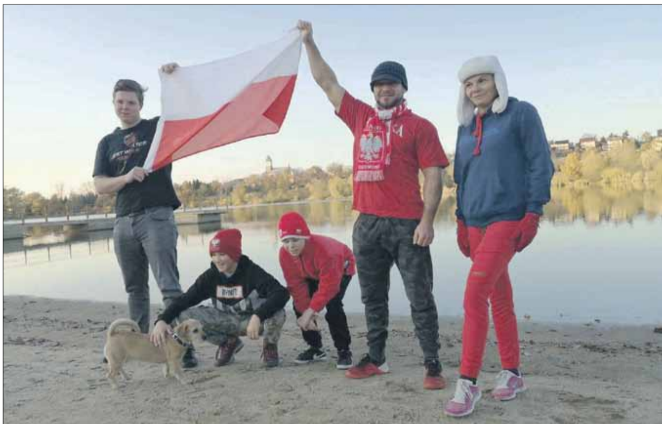
Strzeliński Klub Morsów uhonorował święto na terenie ośrodka w Białym Kościele