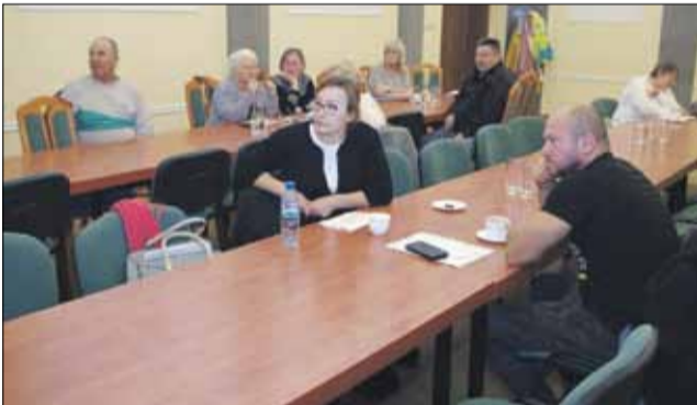
Szkolenie dla organizacji pozarządowych odbyło się w sali obrad strzeelińskiego magistratu