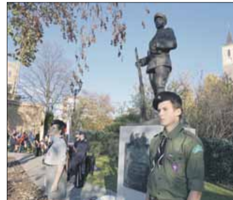
Wartę honorową pełnili nasi harcerze