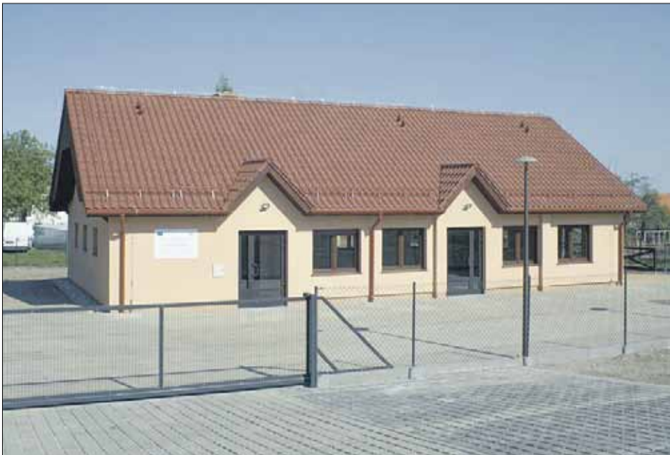
Świetlica w Gościęcicach prawie gotowa