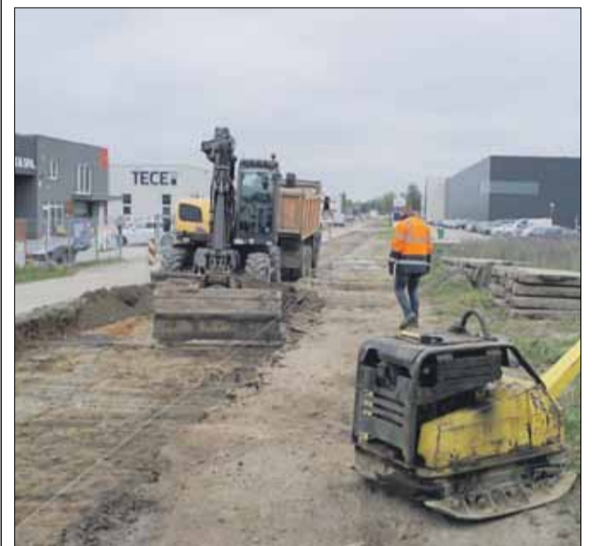
Z ulicy Energetyków systematycznie znikają potężne betonowe płyty

Niedawno na ulicy Energetyków w Strzelinie rozpoczęły się prace związane z jej przebudową. Kierowcom przypominamy, że w związku z tą gminną inwestycją zmieniła się organizacja ruchu. Wprowadzono tam ruch jednokierunkowy. W ul. Energetyków wjeżdżamy od ul. Dzierżonowskiej i wyjeżdżamy na ul. Borowską. To ważna informacja szczególnie dla roztargnionych lub jeżdżących „na pamięć” kierowców. Oczywiście służby będą reagować na naruszenie przepisów a nieostrożni kierujący, którzy będą jeździć „po staremu” muszą się liczyć z mandatem.