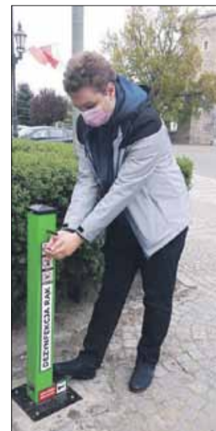
Pojemniki z płynem do odkażania rąk CUKiT zamontował w kilku miejscach w mieście