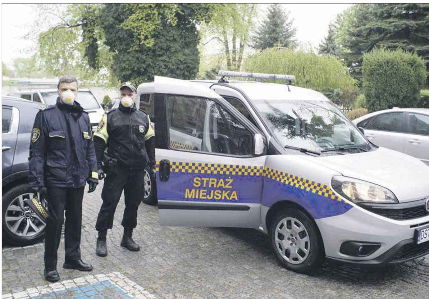
Nowy samochód służbowy straży miejskiej