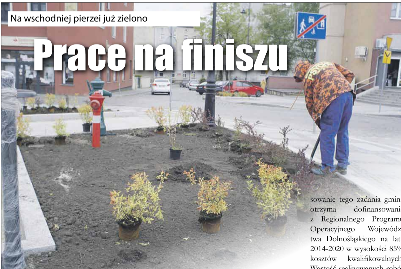
Na pierzei posadzono już wiele roślin

Dobiega końca rewitalizacja wschodniej pierzei strzeleńskiego Rynku, a inwestycja ma się zakończyć do 29 maja 2020 r. W ostatnich dniach wykonano m.in. nasadzenia drzewek i krzewów. Pracownicy firmy WASBUD posadzili już m.in. tawuły, berbe-