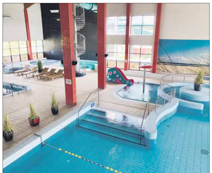
Po otwarciu na klientów będzie czekał mocno odświeżony basen