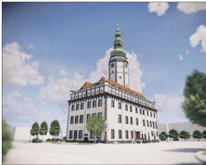
Tak ma wyglądać strzeleński ratusz

Dodajmy, że przetarg na budowę ratusza cieszył się dużym zainteresowaniem o czym świadczy nie tylko 10 złożonych ofert, ale też setki pytań, które wpłynęły do spółki Strzeleński Ratusz. Rozpiętość ofert była naprawdę spora. Oferta wyliczona najwyżej była od niej o ponad 7 milionów złotych