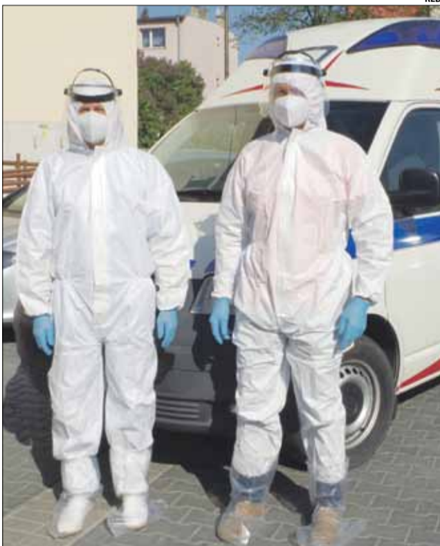
Strzelelińska przychodnia wspomaga strzeleliński sanepid w wykonywaniu wymazów