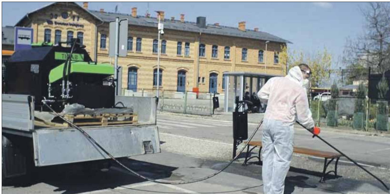
Pracownicy Centrum Usług Komunalnych i Technicznych w Strzelinie sukcesywnie odkażają miasto

są pojemniki z płynem do odkażania rąk. CUKiT zamontował takie urządzenia na ul. Kościuszki - przy skrzyżowaniu z ul. Pocztową, dworcu Strzeleńskiej Komunikacji Publicznej i ul. Książąt Brzeskich - przy skrzyżowaniu z ul. Św. Floriana. Stacjonarne pojemniki mieszczą w sobie 5 litrów płynu. Sukcesywnie są uzupełniane. - Zachęcamy mieszkańców do ko-