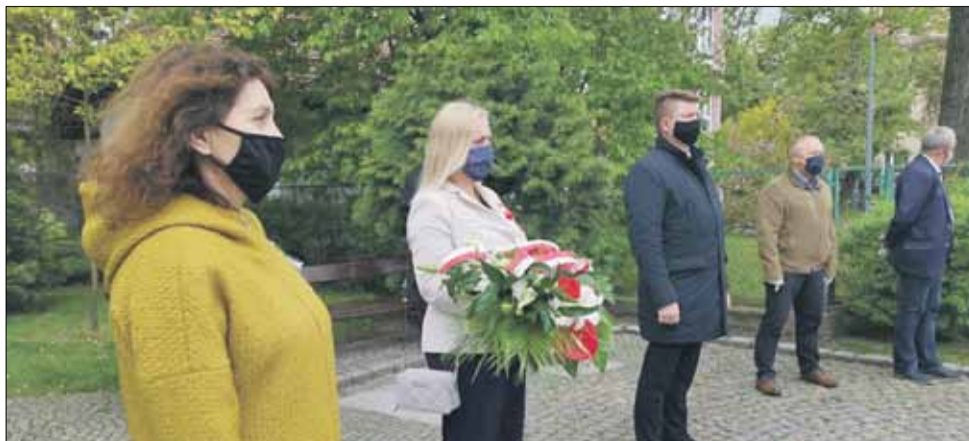
Pod pomnikiem pojawiła się m.in. delegacja lokalnego samorządu