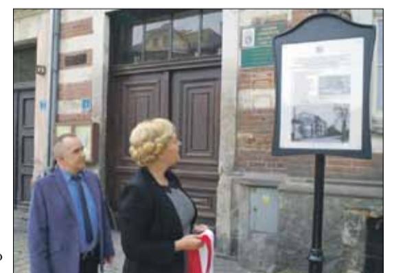
Pięć lat temu na ul. Bolka i Świdnickiego odsłonięto pamiątkową tablicę