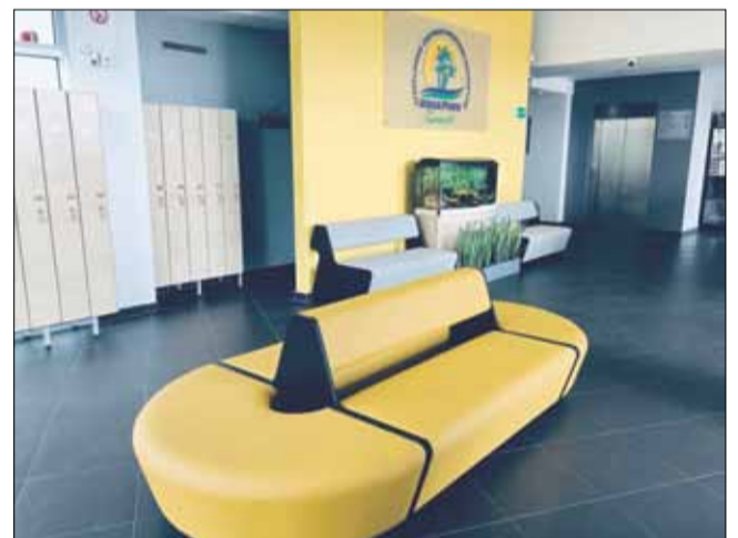
W czasie zamknięcia w aquaparku skupiono się na pracach konserwatorskich i renowacyjnych