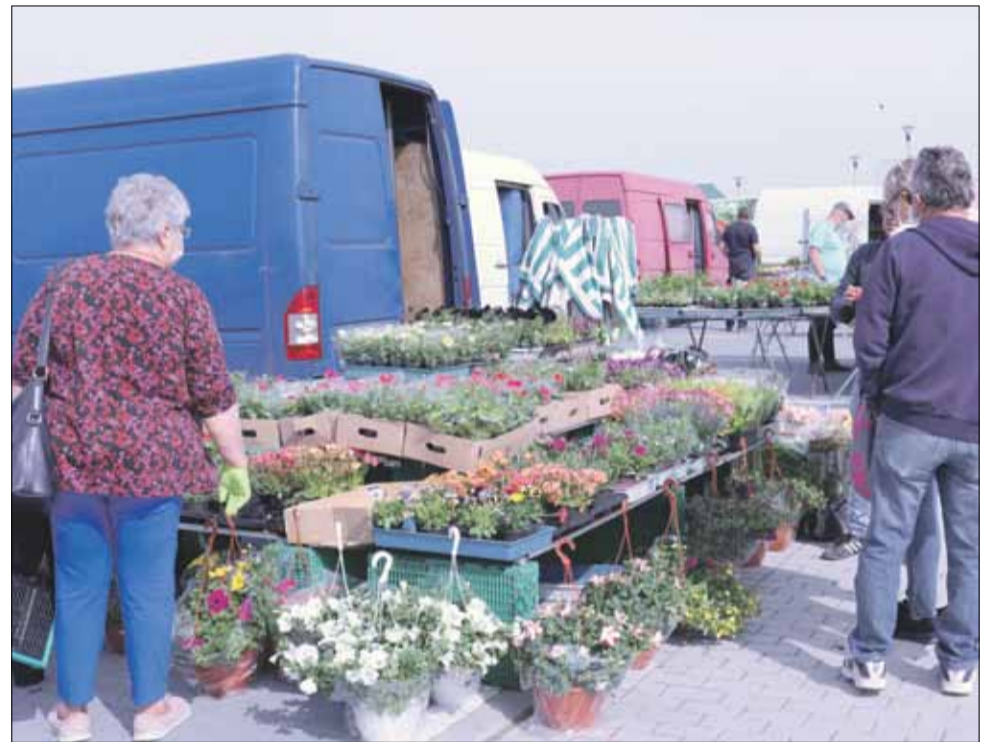
Choć targowisko miejskie jest otwarte to na jego terenie obowiązują szczególne środki ostrożności

które odwiedzają targowisko (zachowanie 2-metrowej odległości). Kupujący mają obowiązek przebywania na terenie targowiska maskach. Przy jednym stanowisku może być maksymalnie do 4 klientów. Nasi pracownicy wspólnie ze strażnikami miejskimi i policjantami będą zwracać na to szczególną uwagę – podkreśla. Warto zaznaczyć, że przed każdym z wejść na targowisko zamontowane zostały dezynfekatory, z których powinien korzystać każdy odwiedzający. Podkreślił, że handel odbywa się wyłącznie na terenie targowiska. Na razie nie jest możliwe wznowienie