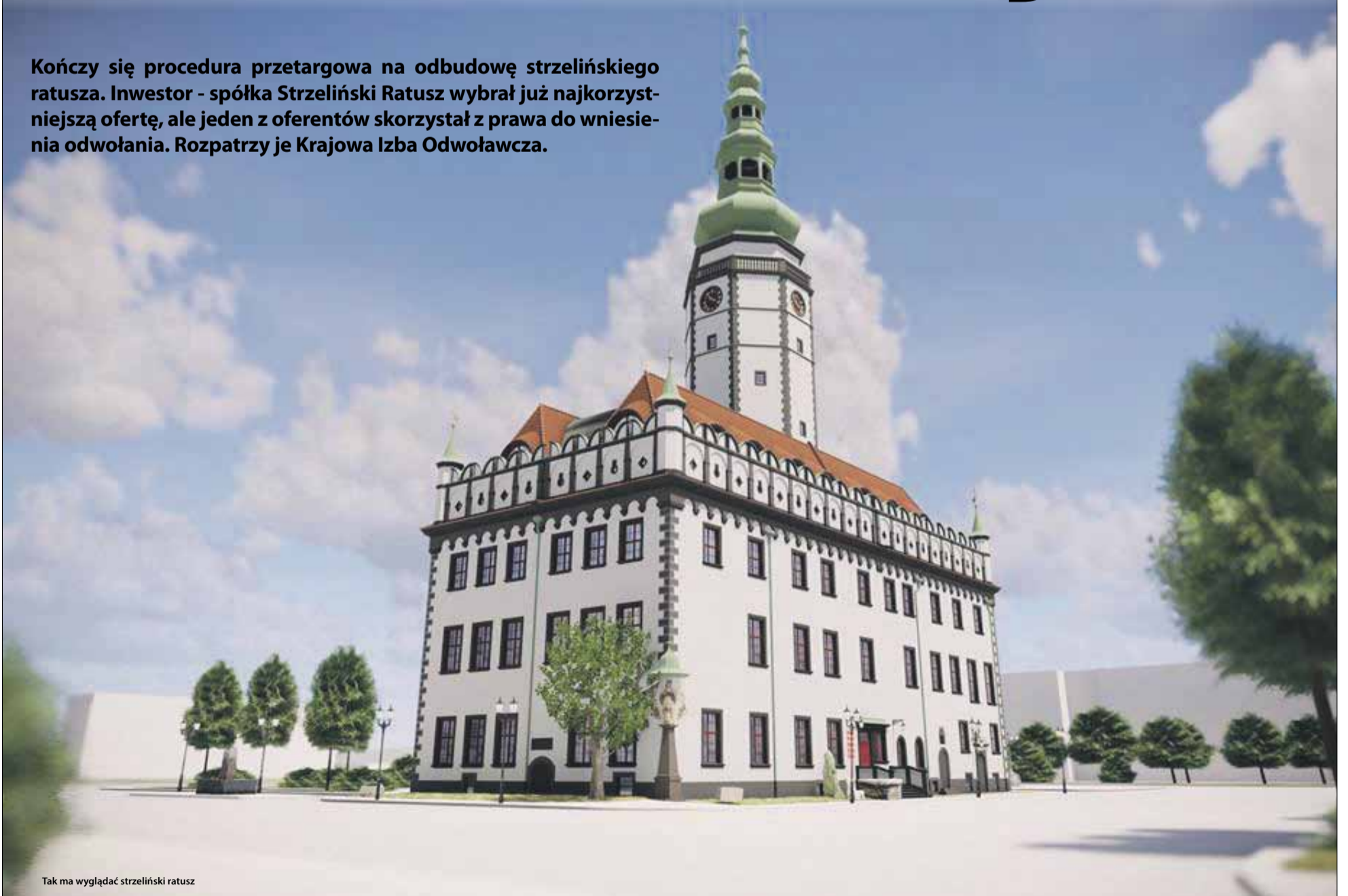
Tak ma wyglądać strzeleński ratusz

Kończy się procedura przetargowa na odbudowę strzeleńskiego ratusza. Inwestor - spółka Strzeleński Ratusz wybrał już najkorzystniejszą ofertę, ale jeden z oferentów skorzystał z prawa do wniesienia odwołania. Rozpatrzy je Krajowa Izba Odwoławcza.