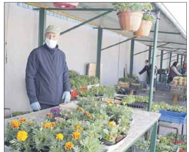
Na handlujących spoczywa m.in. obowiązek zachowania odległości między stanowiskami

które odwiedzają targowisko (zachowanie 2-metrowej odległości). Kupujący mają obowiązek przebywania na terenie targowiska maskach. Przy jednym stanowisku może być maksymalnie do 4 klientów. Nasi pracownicy wspólnie ze strażnikami miejskimi i policjantami będą zwracać na to szczególną uwagę – podkreśla. Warto zaznaczyć, że przed każdym z wejść na targowisko zamontowane zostały dezynfekatory, z których powinien korzystać każdy odwiedzający. Podkreślił, że handel odbywa się wyłącznie na terenie targowiska. Na razie nie jest możliwe wznowienie