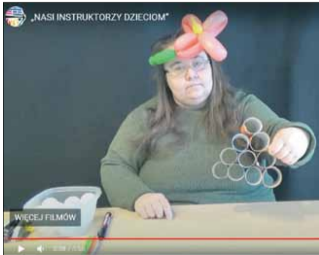
Instruktorka Strzeelińskiego Ośrodka Kultury pokazuje, jak w prosty sposób stworzyć grę zręcznościową

W czasie pandemii znacznie osłabły wydarzenia kulturalne. Nie mogą być organizowane koncerty, spektakle, nie funkcjonują również kina. Strzeeliński Ośrodek Kultury musiał zrezygnować z wielu planowanych wydarzeń. Anulowano m.in. występ Abelarda Gizy, a osoby, które zakupiły bilety otrzymają zwrot pieniędzy. Nie wiadomo jak długo potrwa zakaz organizacji imprez, ale niektóre wydarzenia przesunięto. Przeniesiono spektakl pt. „Kobieta idealna”, który pierwotnie miał się odbyć 12 marca. Nowy termin ustalono na środę, 2 grudnia. Zakupione bilety zachowują ważność. Wiele instytucji przeniosło działania do sieci. Podobnie działa SOK, który pracuje za zamkniętymi drzwiami. Powstał specjalny profil facebookowy Kulturalny Sztab Kryzysowy, na którym pojawiają się m.in. konkursy, linki do bajek, muzyka czy ciekawostki kulturalne. Na oficjalnym profilu facebookowym SOK pracownicy umieszczają również cyklicznie różnego rodzaju fil-