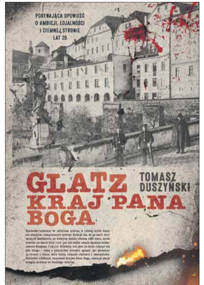
Tak prezentuje się okładka najnowszej książki strzelińskiego pisarza

W tej chwili mogę jedynie zachęcić do zamówienia w księgarniach interneto-