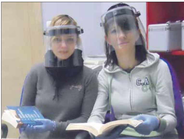
Biblioteka w Strzelinie, tak jak inne w kraju, otworzyły swoje drzwi dla czytelników

zasięg funkcji bibliotecznych oraz nowy system organizacji wypożyczeń. Biblioteka ta sama, ale nie taka sama. Świadczenie usługi bibliotecznej według nowego trybu będzie obowią- zywało tak długo, jak to tylko będzie konieczne. Bowiem musimy przedsięwziąć szczególne środki ostrożności - obsługa w warunkach rygoru sanitarnego to jest nasz wspólny interes. Nie chodzi tylko o obowiązkową dezynfekcję rąk (zapewniamy to) oraz konieczność posiadania maseczki. Ze względów bezpieczeństwa obecność naszych gości w bibliotece musi być ograniczona do czasu niezbędnego tylko do wymiany wypożyczonych pozycji. A zatem działalność musiała zostać sprowadzona wyłącznie do funkcji podstawowej. Nie można więc korzystać ze zbiorów na miejscu, czyli w Czytelni, to samo dotyczy usługi internetowej. Niestety, ale praktykowany do tej pory wolny dostęp czytelnika do pólek nie jest teraz możli-