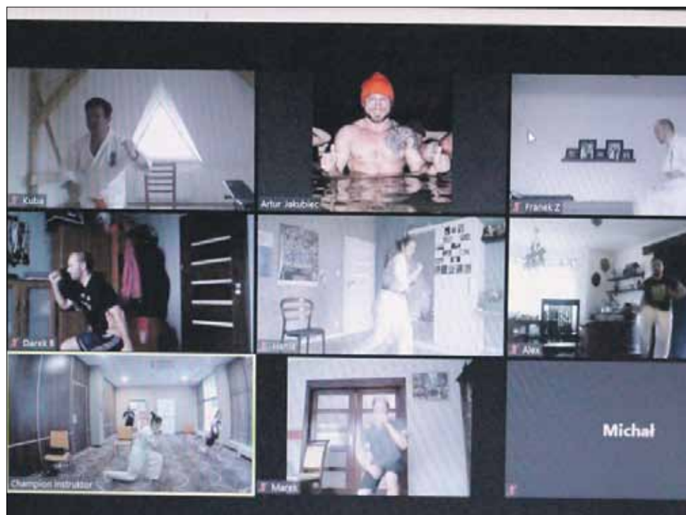
Strzeeliński Klub Karate Kyokushin skupia się na treningach online