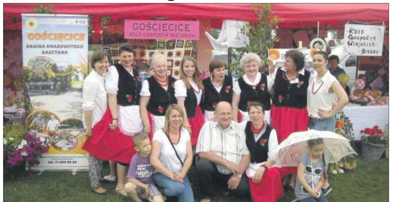
KGW w Gościęcicach to jedno z najprężniej działających kół w naszej gminie

- Trudno wybrać to najważniejsze. Jest ich wiele. Wymienię te najważniejsze. W pierwszym roku działalności wygraliśmy na jarmarku konkurs w kategorii potrawa. Zrobiono o tym filmik. Potem uszyłyśmy sobie same stroje (jako pierwsze koło w powiecie). Otrzymałyśmy z gminy na ten cel 2 tys. zł. Uszyłyśmy 12 kompletnych