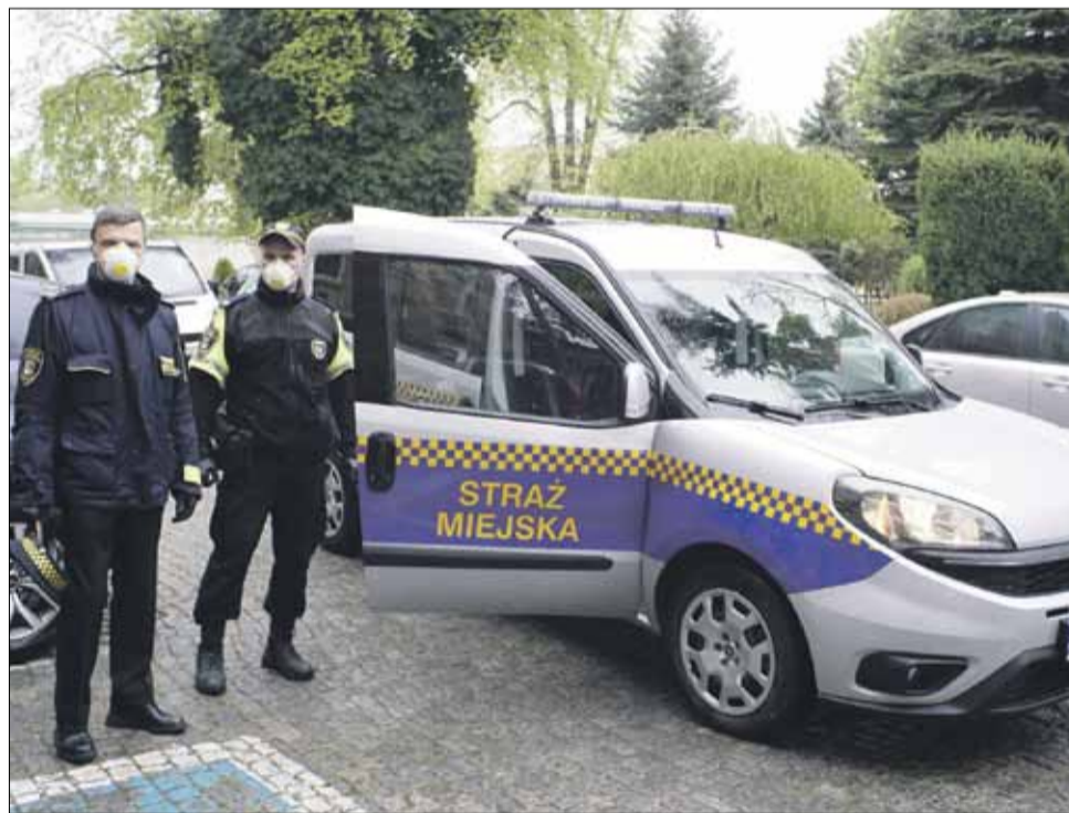
Straż Miejska w Strzelinie podejmowała w tym roku szereg działań

w piecach CO, stosowanie przepisów prawa o ruchu drogowym. W tym ostatnim zakresie w szczególności kontrolowaliśmy pojazdy nieprawidłowo parkujące zbyt blisko przejść dla pieszych oraz skrzyżowań utrudniających ruch oraz pojazdy ciężarowe parkujące w miejscach do tego nie wyznaczonych. Podejmowaliśmy działania wobec właścicieli psów, którzy nie stosowali się do obowiązujących przepisów, psy bezdomne umieszczaliśmy w schroniskach - wymie-