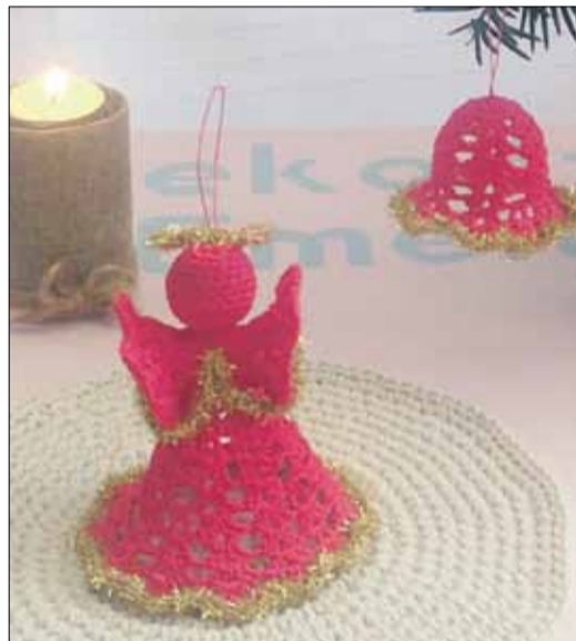
Sporym zainteresowaniem cieszą się czerwone aniołki i dzwoneczki