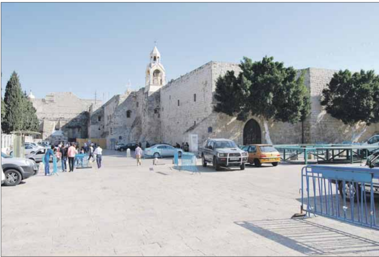
Bazylika Narodzenia Pańskiego. Zaczęto ją budować w 326 roku. To pod tą świątynią znajduje się grota, w której według tradycji urodził się Jezus

Jakieś 3 kilometry od Betlejem znajdują się groty „gdzie pasterze trzód swych strzeżli”. To przy którejś z nich aniołowie ogłosili tym skromnym ludziom, że na świat przyszedł Mesjasz. Wchodzę do jednej z jaskiń. Jest mała i zaaran-