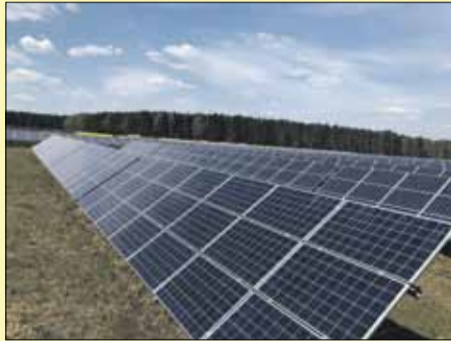
W Muchowcu planowana jest budowa podobnej farmy fotowoltaicznej (zdj. poglądowe)

PA: Energia uzyskana z instalacji fotowoltaicznej jest tak zwaną energią czystą, która jest uznawana za przyjazną środowisku. Z elektrowni