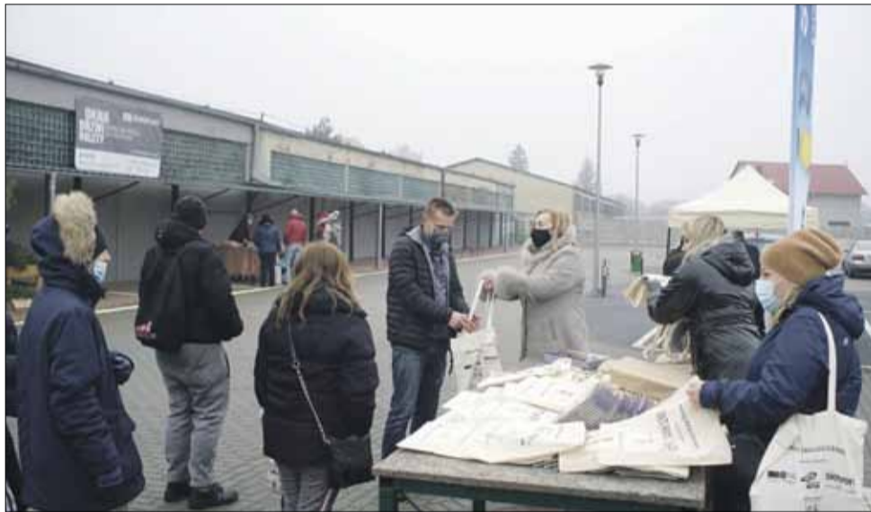
Na bazarze rozdawano gminne kalendarze i torby ekologiczne