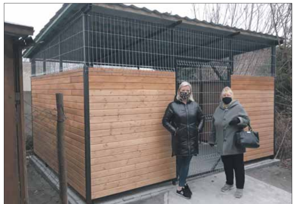
Dotację otrzymała m.in. Wspólnota Mieszkaniowa „Nasz Dom” przy ul. św. Jana w Strzelinie

2. Wspólnota Mieszkaniowa „Nasz Dom” przy ul. św. Jana w Strzelinie.