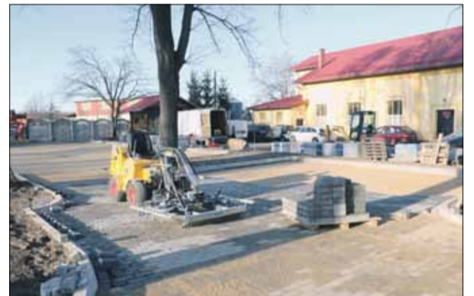
Nawierzchnia parkingu została wykonana z kostki betonowej