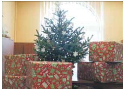
Zakupione artykuły zapakowano do kilku wielkich paczek

Do konkursu można zgłaszać się do końca roku