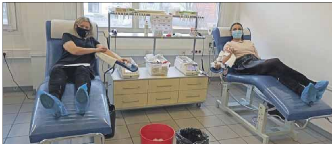
Pracownicy strzelińskiego magistratu oddali cenne osocze