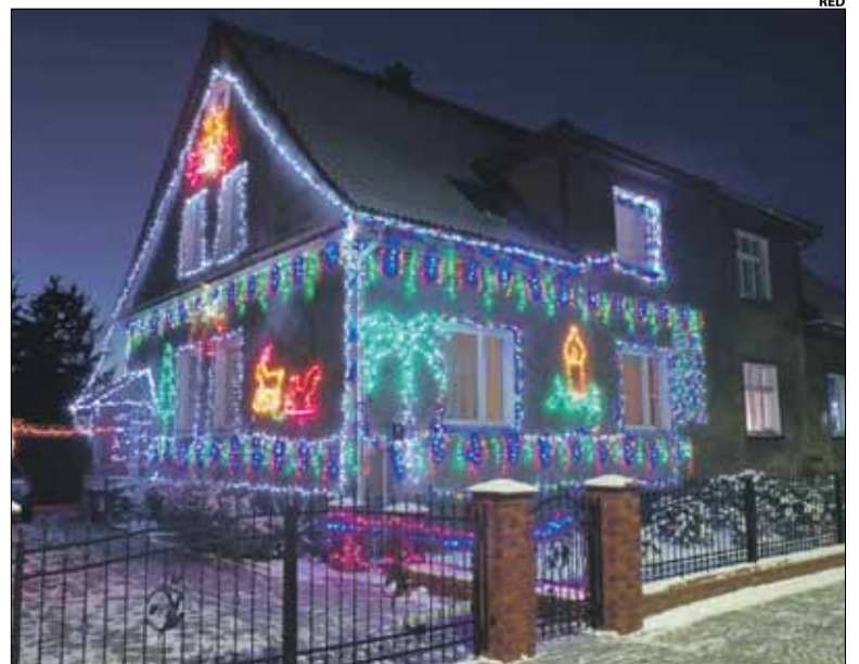
W ubiegłym roku w konkursie nagrodę zdobyli m.in państwo Dragańczukowie, którzy od wielu lat dekorują swoją posesję