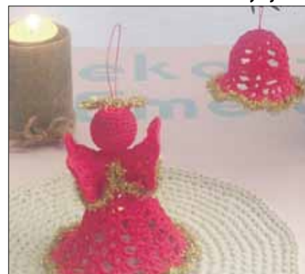
Sporym zainteresowaniem cieszą się czerwone aniolki i dzwoneczki