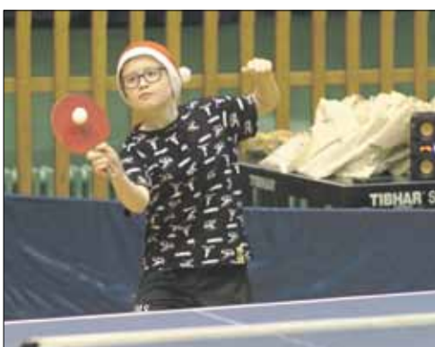
W zawodach uczestniczyło 14 zawodników i zawodniczek