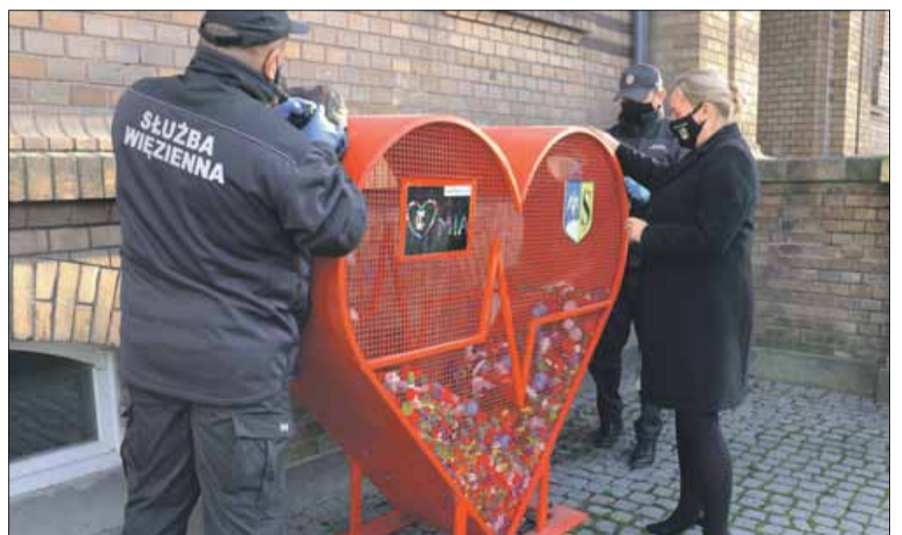
Pracownicy Zakładu Karnego w Strzelinie przekazali kilka worków nakrętek, które trafiły do serca przy strzelińskim magistracie