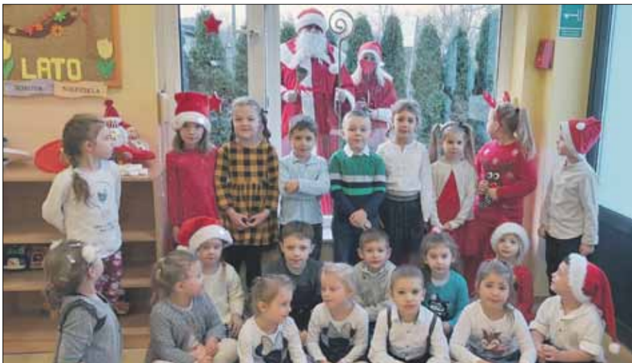
Świętego Mikołaja dzieci z Przedszkola Miejskiego Kolorowa Kraina mogły zobaczyć przez okna swoich sal