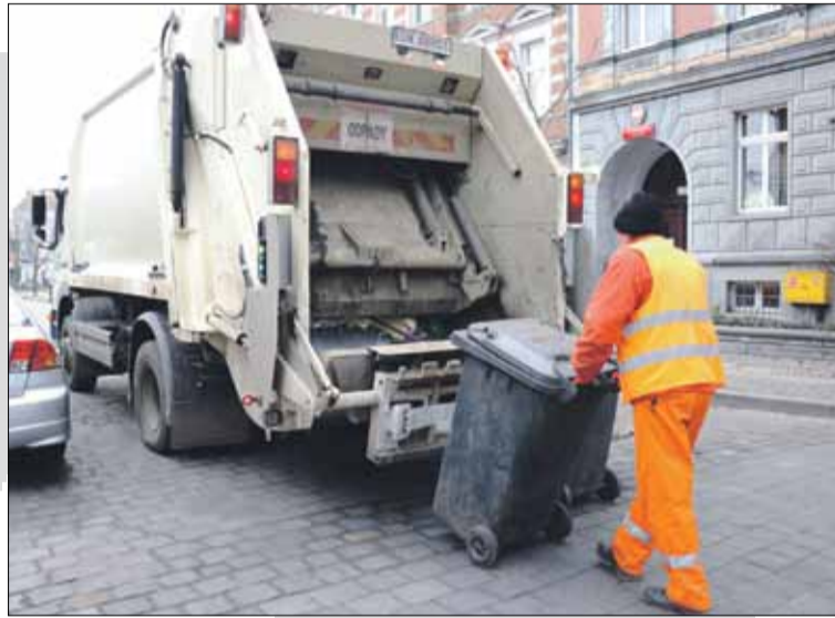
Firma KOMUS jest podwykonawcą operatora obsługującego odbiór i wywóz odpadów z terenu gminy Strzelin

Dobra wiadomość dla osób, które chcą wymienić stary piec węglowy