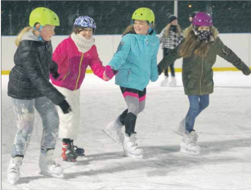
Lodowisko to dla wielu nie lada atrakcja

nut trwa przerwa techniczna, podczas której tafle lodu jest czyszczona i wyrównywana. Nieodłącznym elementem działania lodowiska jest wypożyczalnia, która cieszy się dużym zainteresowaniem. Na miejscu można zaopatrzyć się w łyżwy, kaski, tzw. chodziki dla dzieci ułatwiające jazdę czy skorzystać z namowej zabawy na lodzie oraz nieodpłatnie wypożyczyć sprzęt w godz. 12:00-12:45 oraz 13:30-14:15. Chętni