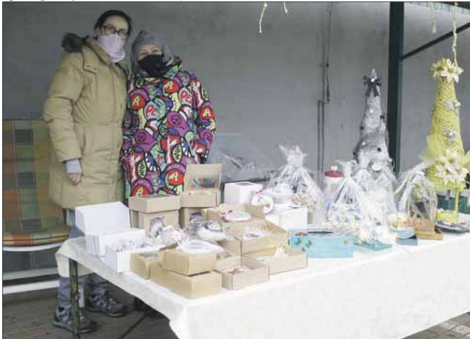
Na bazarze można się było zaopatrzyć w piękne świąteczne ozdoby