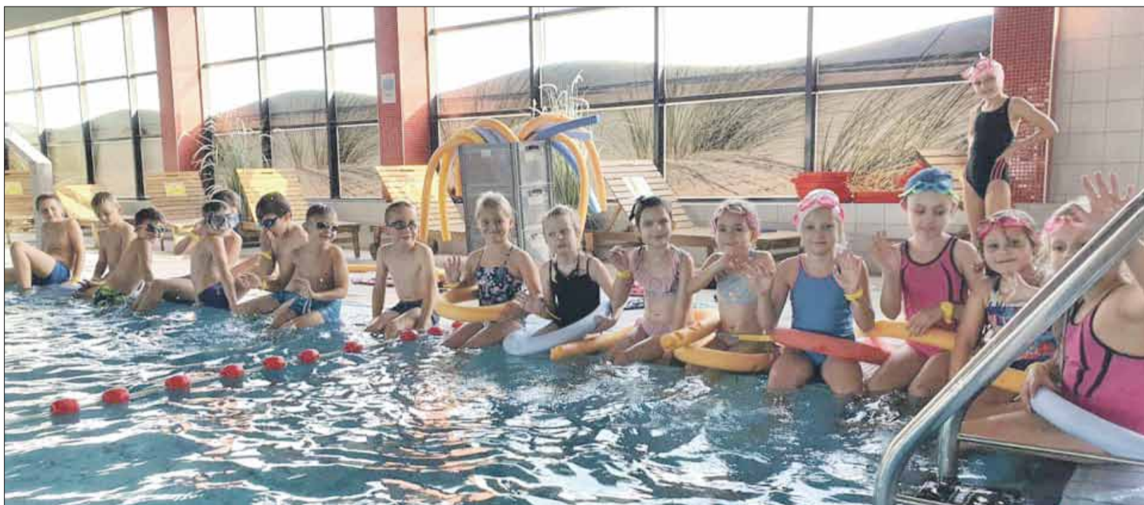
Kolejna edycja projektu „Umiem Pływać” cieszyła się sporym zainteresowaniem