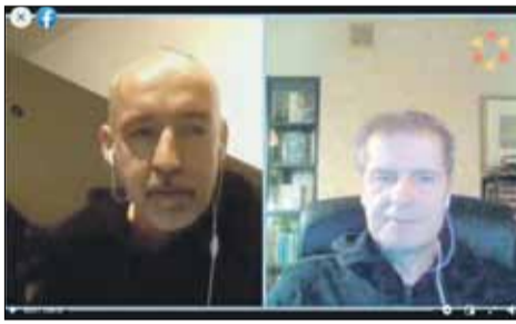
Spotkania online z pisarzami cieszą się sporym zainteresowaniem

www.biblioteka-publiczna.strzelin.pl, gdzie można znaleźć informacje o działaniach i nowościach w jednostce.