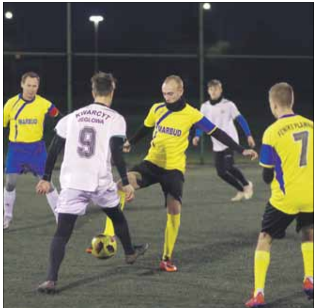
Spotkania w Zimowej Lidze Orlika rozgrywane są systemem każdy z każdym