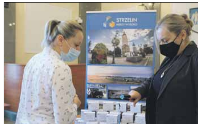
Otrzymane przez gminę Strzelin pulsoksymetry trafiły do kilku instytucji