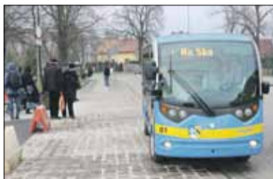
W wigilię Bożego Narodzenia oraz sylwestra Strzeelińska Komunikacja Publiczna będzie obsługiwać pasażerów do godziny 16