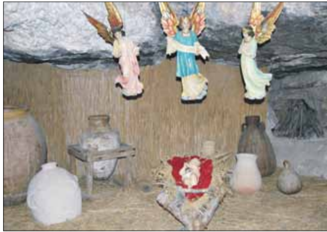
Bożonarodzeniowa ekspozycja w Grocie Pasterzy niedaleko Betlejem