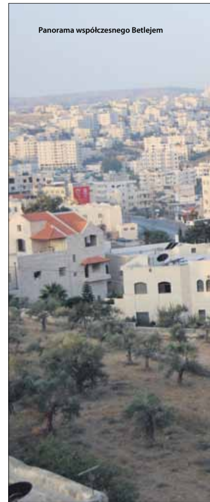
Panorama współczesnego Betlejem