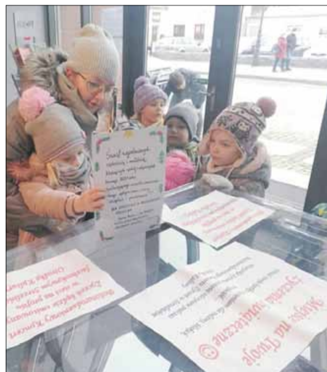
Do urny życzenia wrzuciły przedszkolaki

nego. Do kontaktu z odbiorcami kultury wykorzystano także witrynę, która znajduje się w holu na parterze. Najpierw przechodnie mogli oglądać przepiękną wystawę „Moja jesień”, która składała się ze zdjęć nadesłanych przez mieszkańców, a obecnie w podobnej formule w witrynie zawisła wystawa świąteczna. Można też tam podziwiać szopkę bożonarodzeniową. Bardzo aktywnie działa także fanpage Kultu-ralnego Sztabu Kryzysowego, na którym zamieszczanych jest szereg informacji, linków i filmików związanych nie tylko z działalnością nasze-