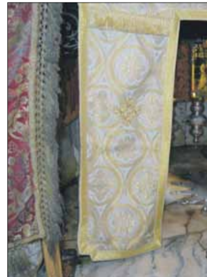
Miejsce narodzenia Jezusa