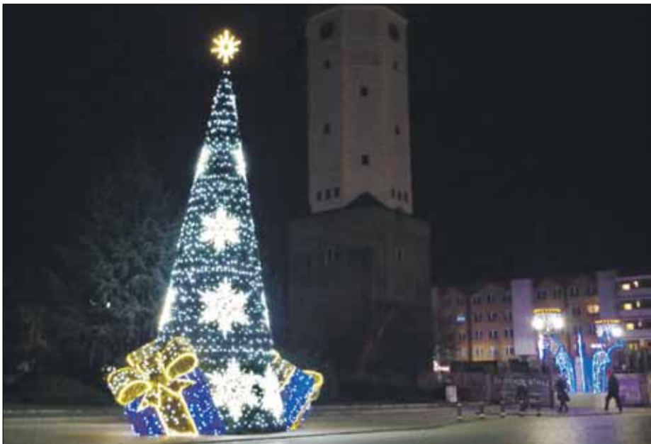
W strzeleńskim Rynku tradycyjnie stanęła choinka