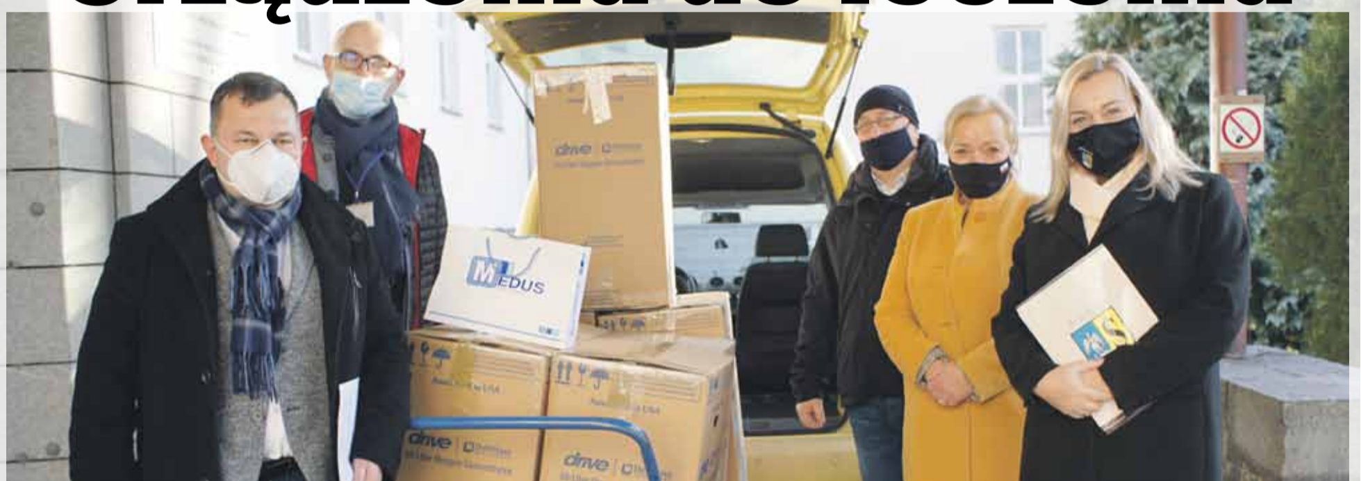
Koncentratory tlenu zostały przekazane do strzeleńskiego szpitala