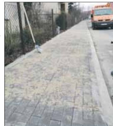
CUKIT zakończył remont chodnika w Dobrogoszczy

Centrum Usług Komunalnych i Technicznych w Strzelinie prowadziło w ostatnim czasie szereg różnych zadań. W Dobrogoszczy zakończono kolejny etap budowy chodnika, który został wyłożony typową kostką betonową typu Polbruk. Wartość inwestycji wyniosła 4 tys. zł, a środki pochodziły z funduszu sołeckiego. W Dobrogoszczy wykonano również piłkochwyty o wysokości ok. 6 metrów. Obecnie pracownicy jednostki prowadzą budowę chodnika w Skoroszowicach. Wartość inwestycji sfinansowanej z funduszu sołeckiego to 9 tys. zł. W Skoroszowicach został również naprawiony dach altany.