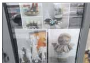
W witrynach Strzelińskiego Ośrodka Kultury można oglądać świąteczną wystawę

pomysłem było umieszczenie urny przed siedzibą Strzelińskiego Ośrodka Kultury, do której przechodnie mogli wrzucać świąteczne życzenia. Karteczki zostaną odczytane podczas emitowanego w Internecie programu świątecz-