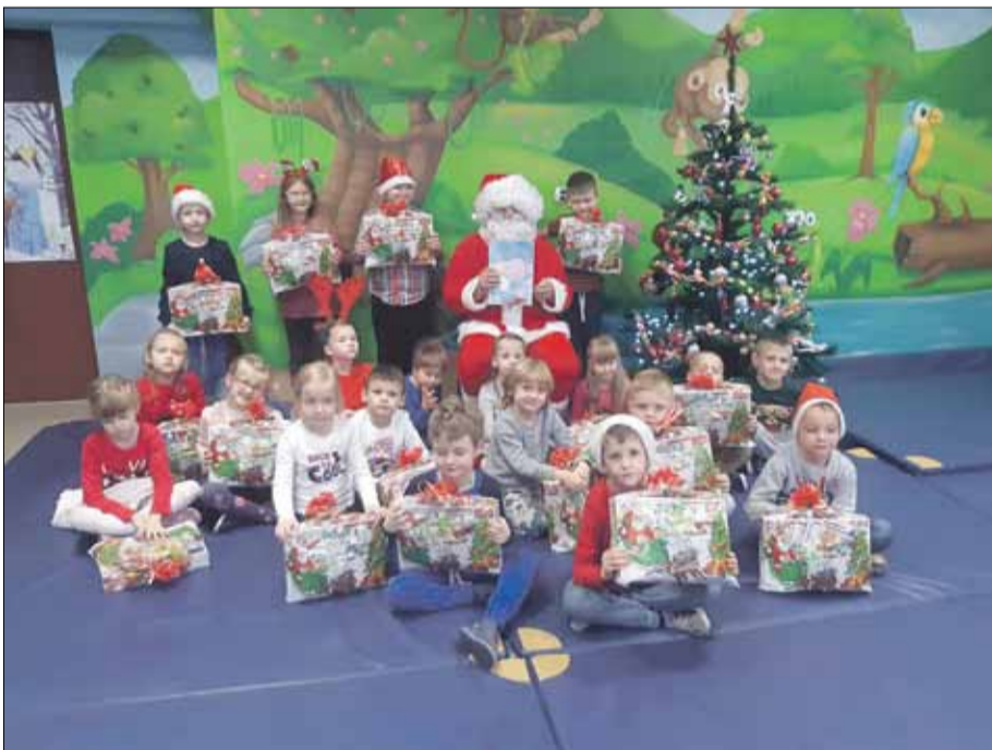
Niecodzienny gość przybył również do oddziału przedszkolnego Publicznej Szkoły Podstawowej nr 3 w Strzelinie