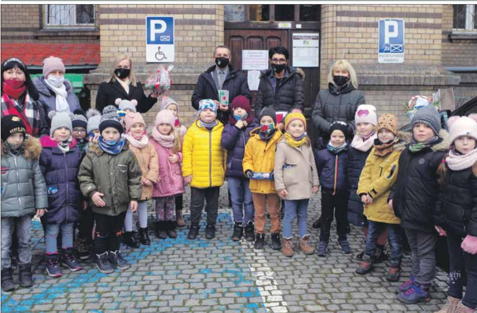
Grupa „Niezapominajek” zrobiła miłą, przedświąteczną niespodziankę