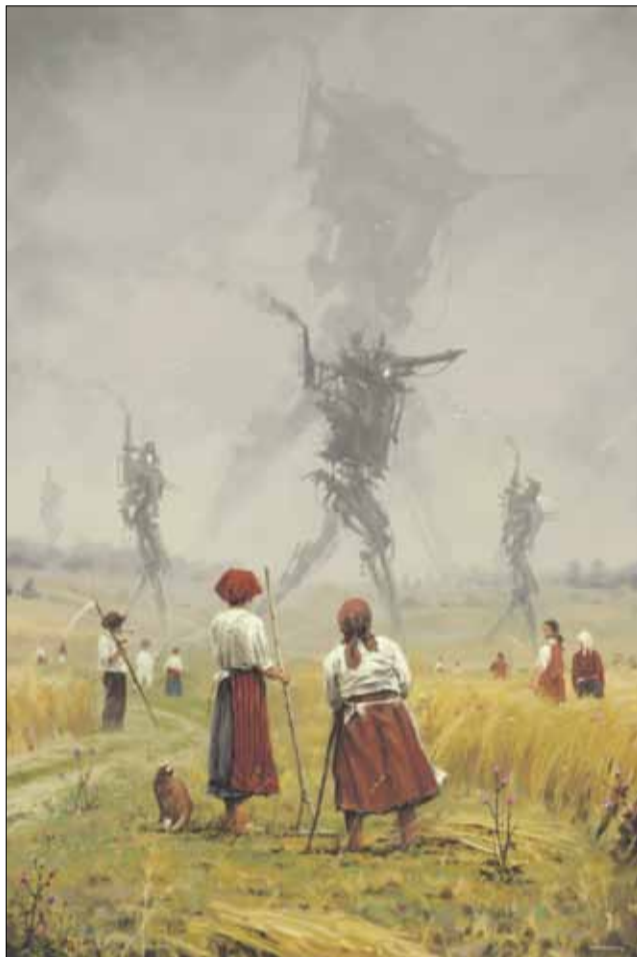
Jedna z prac artysty w ramach projektu 1920