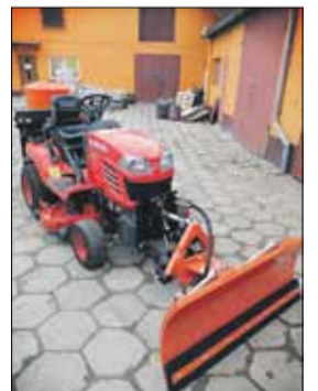
Jednostka kupiła także sprzęt do zimowego utrzymania chodników

Centrum Usług Komunalnych i Technicznych w Strzelinie zakupiło do prac drogowych samochód ciężarowy marki Renault Master o pojemności silnika 2463 cm 2 . Samochód posiada kabinę na siedem osób, skrzynię samowyladowczą wysypującą na trzy strony oraz specjalistyczne oznakowanie drogowe wraz z zewnętrznym oświetleniem pulsacyjnym. Wcześniej jednostka kupiła młot udarowy spalinowy, wyremontowano także ciągnik, przyczepę i zbiornik do emulsji asfaltowej. Zakupiono także sprzęt do zimowego utrzymania chodników. CUKiT wzbogacił się o dwie montowane posypywarki i dwa specjalistyczne pługi.