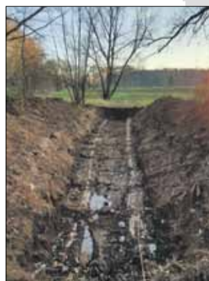
RED Na ulicy Michałkiewicza oczyszczono kanalizację deszczową

W związku z licznymi podtopieniami posesji przy ul. Michałkiewicza w Strzelinie, Gmina Strzelin dokonała geodezyjnej inwentaryzacji kolektorów przez geodetę oraz wykonała kompleksowe oczyszczenie kanalizacji deszczowej w ulicy oraz separatora. Podjęto także próbę oczyszczenia odpływów do rzek, które niestety nie powiodły się. Okazało się, że kolektory na odcinku pomiędzy Młynówką rzeką Olawą są niedrożne z powodu przemieszczenia się kęgrów. W związku z tym zachodzi konieczność wymiany wadliwych odcinków między Młynówką a rzeką. Obecnie opracowywana jest dokumentacja remontu kolektorów. Gmina zamierza wykonać prace latem przy najniższym poziomie wód. Do tego momentu kolektory będą udrażniane na bieżąco, aby umożliwić spływ wód z ulicy Michałkiewicza.