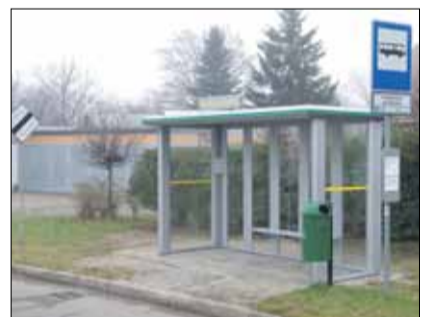
Nowa wiat stanęła m.in. przy ulicy Pułaskiego w Strzelinie

Na początku grudnia zakończyła się budowa sześciu wiat przystankowych na terenie gminy Strzelin. Nowe wiaty zostały zamontowane na przystankach autobusowych w Strzelinie na osiedlu „Na skarpie” przy ul. Pułaskiego, a także w Krzepicach, Pławnej, Strzegowie i w dwa w Pęczu. Zadanie zostało sfinansowane z gminnego budżetu oraz funduszy sołeckich i funduszu osiedlowego. Przy okazji naprawiono kilka zdewastowanych przez wandalów wiat. Cztery szyby wstawiono w miejsce wybitych na przystankach w Gęsińcu (ul. Akacjowa), Muchowcu, a także przy ul. Wojska Polskiego i Puławskiego w Strzelinie. Wymieniono również zniszczoną ławkę w wiacie przy przystanku na dworcu w Strzelinie.