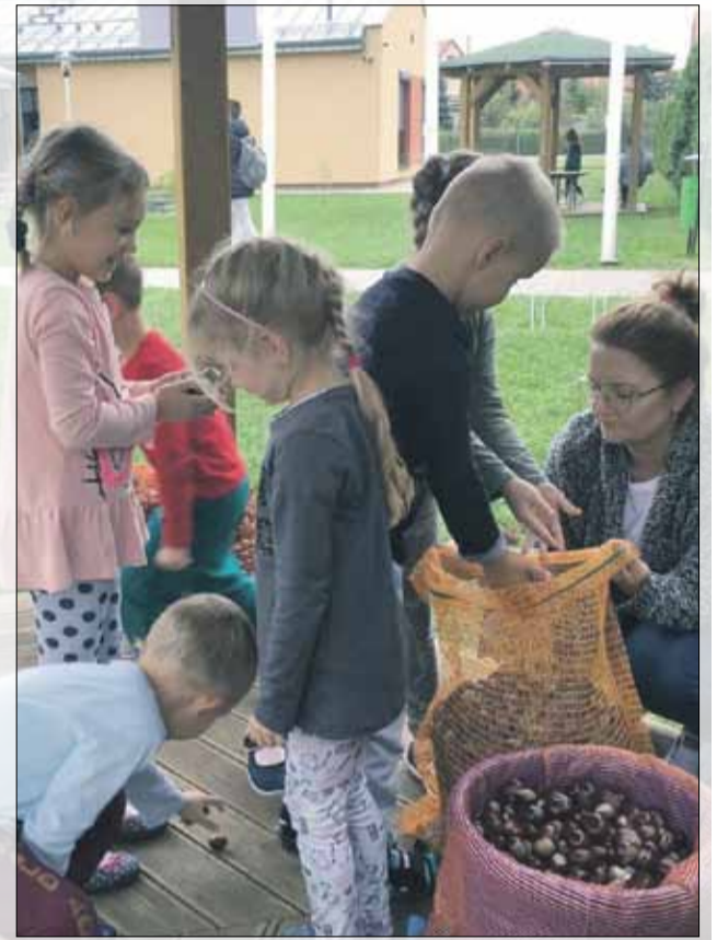
Dzieci chętnie przyłączyły się do akcji zbierania kasztanów