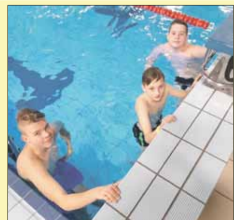
Uczniowie gminnych szkół biorą udział w zajęciach nauki i doskonalenia pływania, zorganizowanych w ramach aktywizacji sportowej

Strzelińskie Centrum Sportowo-Edukacyjne w porozumieniu z Burmistrz Miasta i Gminy Strzelin, mając na względzie ograniczoną aktywność fizyczną spowodowaną zdalnym nauczaniem, przygotowało ofertę dla uczniów szkół podstawowych. Dzięki ustaleniom udało się wypracować plan bezpłatnych zajęć nauki i doskonalenia pływania dla uczniów klas 1-8, które będą prowadzone w strzelińskim aquaparku pod okiem instruktorów pływania. Zajęcia dla uczniów szkół gminy Strzelin będą się odbywały w podziale na klasy 1-3, 4-6 oraz 7-8. Pierwsze zajęcia ruszyły od drugiego tygodnia grudnia i będą odbywały się do 16 stycznia z przerwą międzyświąteczną.