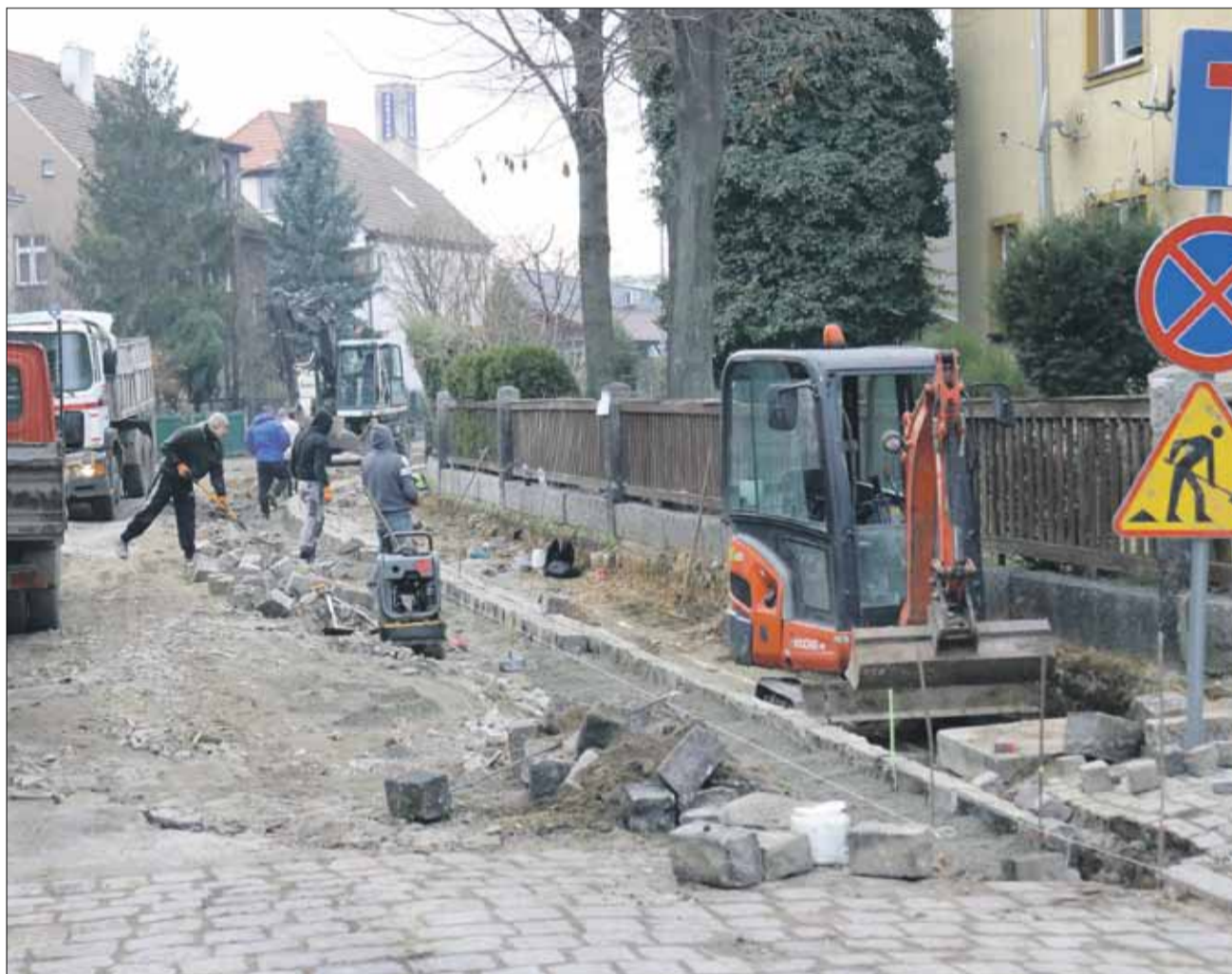
Na ulicy Królowej Jadwigi trwają intensywne prace