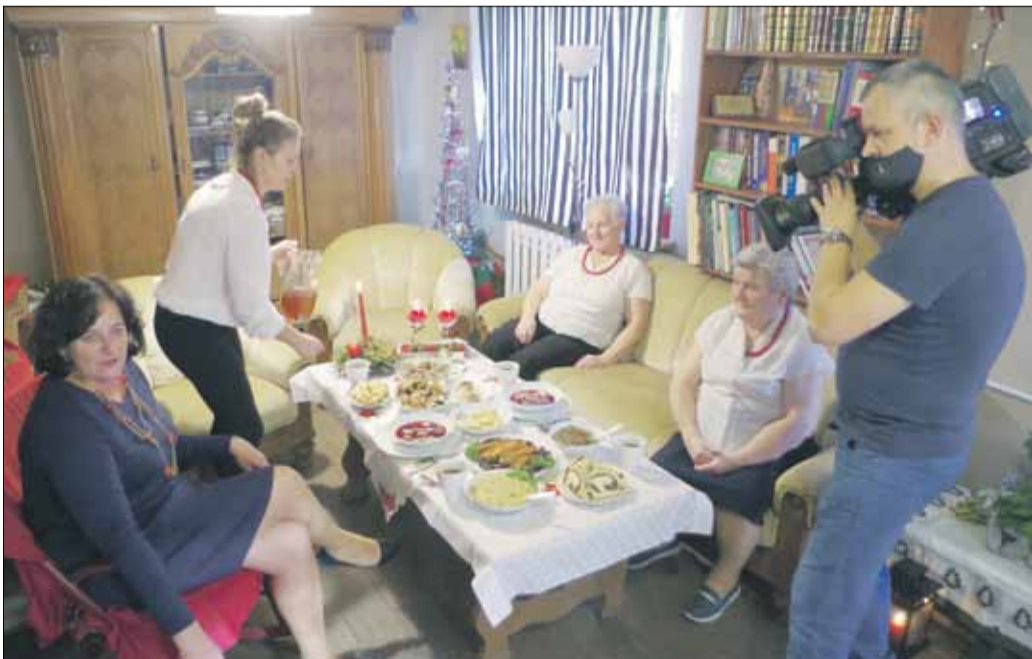
Kolo Gospodyń Wiejskich w Gościęcicach gościło ekipę Telewizji Polskiej

Kolo Gospodyń Wiejskich w Gościęcicach w ostatnim czasie już kilkakrotnie gościło ekipę Telewizji Polskiej. W listopadzie członkinie koła wystąpiły w materiale porannego magazynu dwójki „Pytanie na śniadanie”. Gospodynie opowiadały o właściwościach kasztanów jadalnych, które są specjałem gościęcickiej kuchni. Panie przygotowały aż osiem potraw m.in. zupę z kasztanów, kurczaka w sosie pieczeniowym z kasztanów, ciasto z kasztanami karmelizowanymi czy kasztany smażone w zalewie miodowej. Materiał można zobaczyć na stronie www.pytanienasniadanie.tvp.pl .