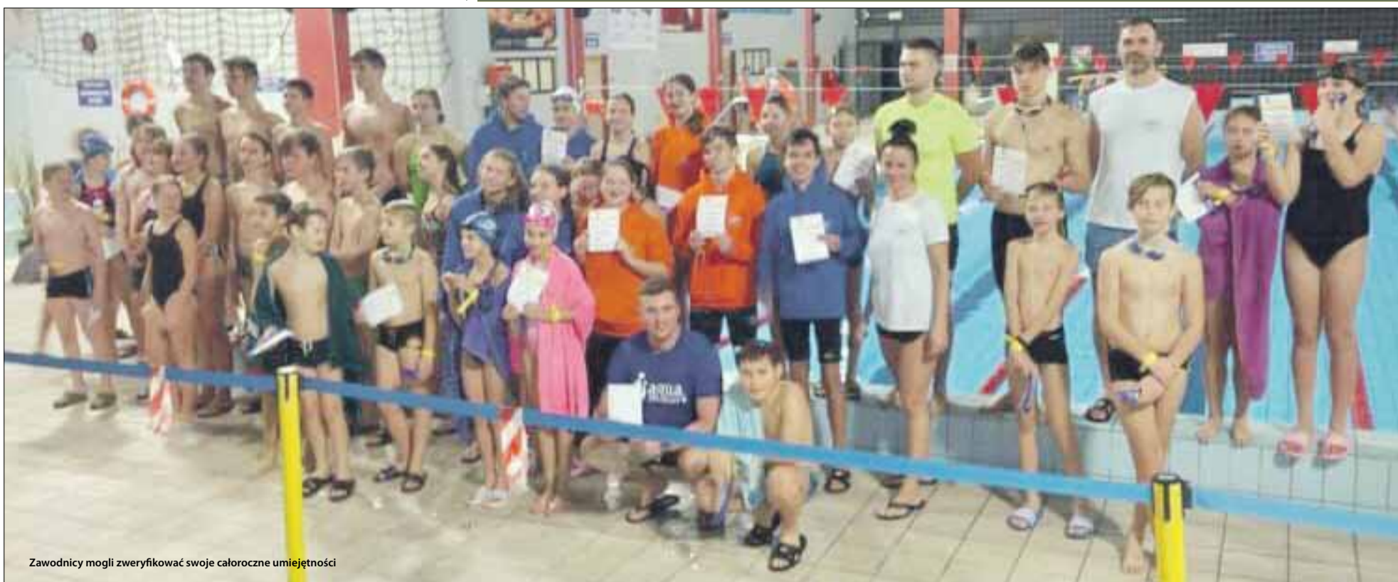
Zawodnicy mogli zweryfikować swoje całoroczne umiejętności