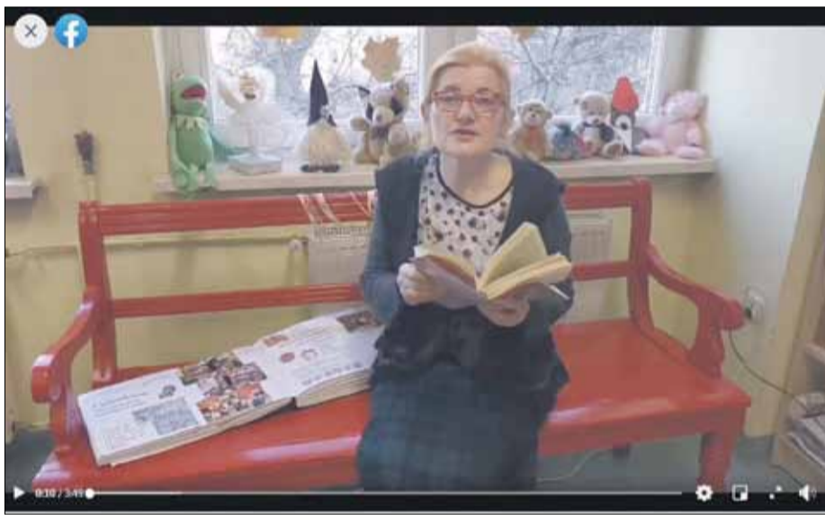
Bajki czytane przez panią Lidię można znaleźć na facebooku strzelińskiej biblioteki