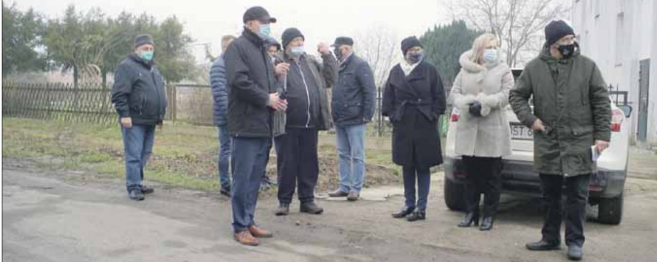
Spotkanie z sołtysem Gościęcic i rozmowy o kolejnym etapie remontu drogi

W Gościęcicach omawiano m.in. kwestie związane z odprowadzeniem wód opadowych oraz możliwości remontu kolejnego odcinka drogi powiatowej.