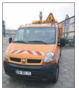
Samochód ciężarowy marki Renault Master to nowy nabytek CUKiT-u