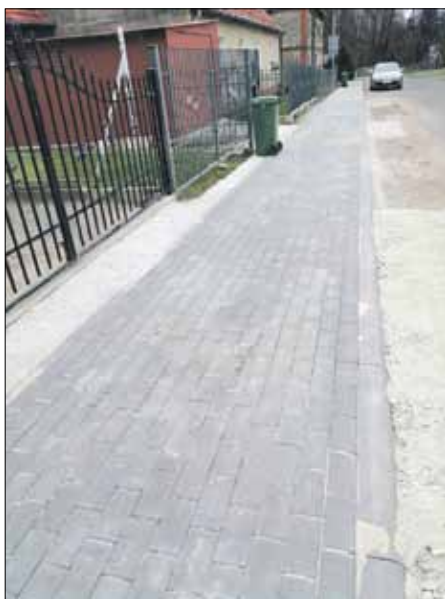
Pracownicy CUKiT wyremontowali fragment chodnika w Skoroszowicach