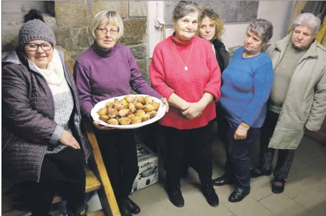
Panie z Koła Gospodyń Wiejskich w Białym Kościele podzieliły się z naszymi czytelnikami przepisem na pyszne racuchy