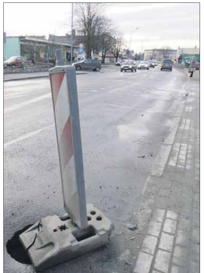
Dolnośląska Służba Dróg i Kolei we Wrocławiu ogłosiła przetarg na modernizację ulicy Wolności

Dolnośląska Służba Dróg i Kolei we Wrocławiu ogłosiła pod koniec 2020 r. przetarg na modernizację odcinka drogi wojewódzkiej nr 395 - ul. Wolności w Strzelinie. Oferty można składać do 10 lutego. Celem inwestycji, o którą od lat intensywnie zabiegają władze samorządowe gminy Strzelin, jest poprawa bezpieczeństwa użytkowników ulicy Wolności oraz zmniejszenie kosztów eksploatacji, poprzez ograniczenie remontów nawierzchni i urządzeń odwadniających. Przypomnijmy, że stan nawierzchni tej kluczowej dla miasta drogi jest coraz gorszy, a w ostatnich latach dochodzi tam do licznych awarii sieci gazowej i wodociągowej. I to właśnie dlatego w ramach inwestycji, oprócz przebudowy drogi i chodników, przewidziano m.in. wymianę sieci gazowej i wodociągowej. Inwestor – DSDiK będzie blisko współpracował z Polską Spółką Gazownictwa oraz Zakładem Wodociągów i Kanalizacji w Strzelinie. Prace powinny się zakończyć we wrześniu 2022 roku. O wynikach przetargu poinformujemy w kolejnym wydaniu gazety.