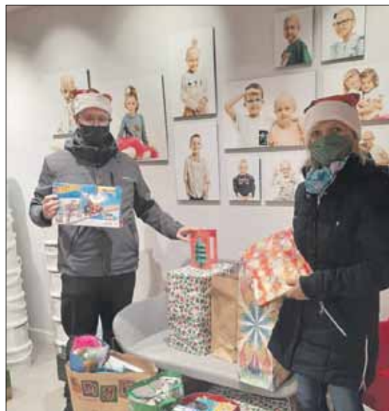
RED Podarunki zostały zawiezione pacjentom wrocławskiej kliniki Przylądka Nadziei

W grudniu wolontariat Publicznej Szkoły Podstawowej nr 4 w Strzelinie przeprowadził charytatywną zbiórkę darów w ramach dwóch akcji „Podaruj Prezent na Święta Małym Pacjentom Przylądka Nadziei” oraz „I Ty zostań świętym Mikołajem”. Dla dzieci chorych na raka zbierano m.in. gry planszowe, zabawki, klocki. Druga akcja skierowana była do jednej z potrzebujących rodzin. Pozyskano m.in. żywność, środki czystości, przybory szkolne. Akcje przeszły najsmielsze oczekiwania a darczyńców nie brakowało. – W tych trudnych czasach okazaliście wielkie serca, wykazując się ogromnym zaangażowaniem, które przekroczyło pojemność naszych samochodów. Jest jednak coś, czego było więcej niż waszych podarunków - łez wzruszenia w oczach obdarowanej rodziny – napisano na profilu facebookowym szkoły. Wielkie podziękowania należą się darczyńcom, wolontariuszom i wszystkim, którzy służyli pomocą włączając się w przygotowanie i przeprowadzenie akcji charytatywnych.