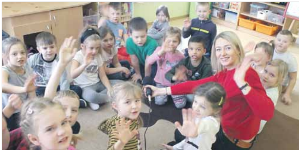
Rozmowy z przedszkolakami przeplatane były anegdotkami i solidną porcją śmiechu

W tym roku, zmuszeni niejako do zmiany formuły obchodów wspomnianych powyżej dni, zwróciliśmy się do strzełińskich przedszkoli o współpracę w przygotowaniu ciekawej propozycji on-line. Mimo obostrzeń udało się zrealizować plan, za co serdecznie dziękujemy tym, którzy podjęli się wspólnego zadania.