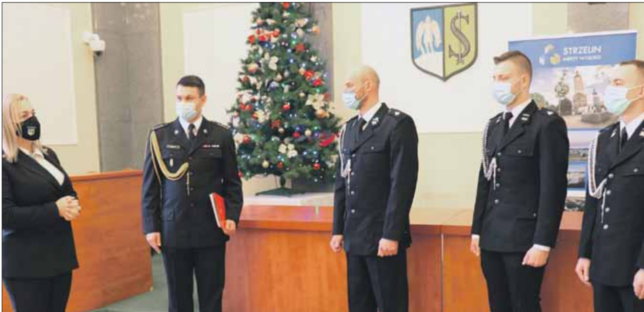
Druhowie OSP Nowolesie odebrali decyzję o włączeniu jednostki w strukturę Krajowego Systemu Ratowniczo-Gaśniczego