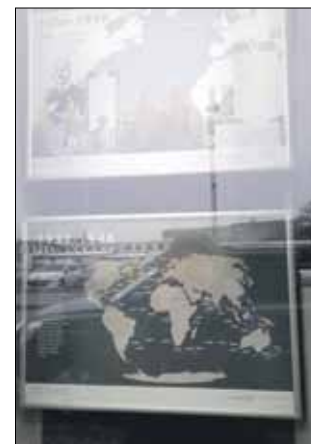
W witrynie ośrodka kultury zawiązała nowa wystawa

niepodległości oraz odbudowy polskiej państwowości. W zeszłym roku, 10 lutego, obchodziliśmy też stulecie zaślubin Polski z morzem. Morska historia II RP łączy się z wieloma sukcesami – jednym z nich była budowa transatlantyków. Projekt „B jak Batory”, opowiada o jednym z nich. M/S Batory od 1936 roku przez 33 lata pływał pod polską banderą jako regularny środek transportu do Ameryki oraz w konwojach podczas II wojny światowej. „Lucky ship”, jak go nazywano, owiany jest wieloma legendami. Podczas swojej służby odbył 222 rejsy oceaniczne, przewożąc 270 tysięcy pasażerów. M/S Batory był gotów do pierwszej podróży 21 kwietnia 1936 roku. Statek miał 156,5 m długości i 22 m szerokości, 7 pokładów, na których znalazło się miejsce dla 773 pasażerów, 334 członków załogi oraz 1200 ton ładunku. M/S Batory był ambasadorem polskiej kultury na morzach i oceanach świata – wszystkie wnętrza, wyposażenie, a nawet karty dań zostały zaprojektowane przez czołowych polskich artystów, którzy nadali im wyjątkowy, narodowy charakter. Na planszach można odnaleźć wiele archiwalnych zdjęć, map i mnóstwo ciekawostek, które pozwalają prześledzić losy statku od pierwszego rejsu po zakończenie służby. Ekspozycji będzie dostępna do końca stycznia. Ośrodek otrzymał wystawę dzięki udziałowi w projekcie „Niepodległa”.