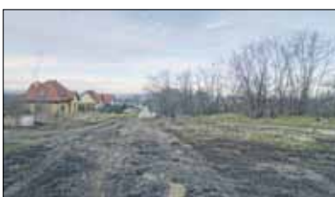
Na ulicy Wichrowej rozpoczęły się prace przygotowujące teren pod budowę drogi gminnej

Na ul. Wichrowej w Strzelinie, która prowadzi w stronę dawnej wieży ciśnieniowej i obecnego kompleksu sportowo-rekreacyjnego, zrealizowano niedawno roboty ziemne przygotowujące teren pod budowę przyszłej drogi gminnej. Nowa droga, uzbrojona w niezbędne media, zastąpi w przyszłości obecną, wykonaną z betonowych płyt. Porządna droga będzie tam niezbędna, bo już w przyszłym roku strzeliński samorząd zamierza sprzedać pierwszą partię działek budowlanych przy ul. Wichrowej. Na te atrakcyjnie położone grunty nie powinno zabraknąć chętnych, a dużym atutem tej lokalizacji będzie niewątpliwie wspomniany już kompleks sportowo-rekreacyjny, w skład którego wchodzi: wielofunkcyjny boisko o sztucznej nawierzchni, nowoczesny i świetnie wyposażony plac zabaw, siłownia zewnętrzna oraz atrakcja dla pasjonatów rowerów – pumptrack. Przy dawnej wieży ciśnieniowej jest też dogodne miejsce na organizację pikników i spotkań integracyjnych, a już w przyszłym roku ma tam powstać kolejna atrakcja – boisko do plażowej piłki siatkowej, sfinansowane z funduszu osiedlowego Osiedla na Skarpie.