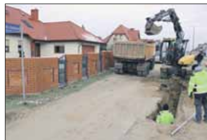
Kolejne drogi na Osiedlu Wschodnim zyskają nową nawierzchnię

Trwają prace remontowe na drogach Osiedla Wschodniego w Strzelinie. Inwestycja wykonywana jest obecnie na skrzyżowaniu ul. Galla Anonima i Gabrieli Zapolskiej, ale oprócz tych dwóch dróg dotyczy także ul. Zofii Nalkowskiej oraz ul. Stanisława Moniuszki (wylącznie kanalizacja deszczowa). Zakres robót obejmuje m.in. wykonanie nawierzchni asfaltowych o szerokości 5 m, która będzie ograniczona krawężnikami ze ściekiem z kostki betonowej. W ramach zadania zostanie też wykonana kolejna część sieci kanalizacji deszczowej, wraz z podłączeniem do istniejących kolektorów. Wykonawcą inwestycji jest firma Przedsiębiorstwo Handlowo-Usługowe ZURB z Borowa, która zrealizuje prace za blisko 770 tys. zł. Przewidywany termin zakończenia tej gminnej inwestycji to koniec czerwca 2021 roku.