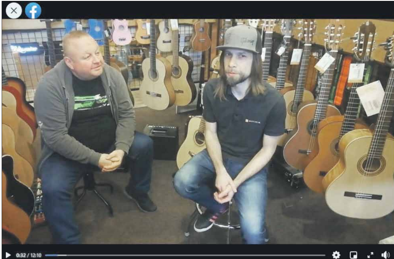
Pracownik wrocławskiego sklepu muzycznego opowiedział o gitarach akustycznych, klasycznych oraz ukulele

Bajki, teatrzyki kukielkowe, spotkania online z pisarzami, muzyczne niespodzianki i interesująca wystawa – to tylko niektóre z działań Strzelińskiego Ośrodka Kultury w czasie zimowych ferii.