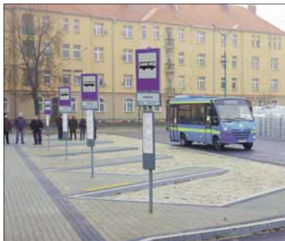
Węzeł przesiadkowy posiada sześć stanowisk postojowych dla minibusów