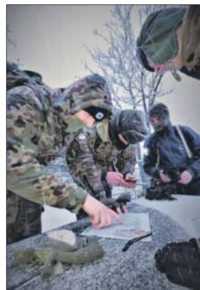
Podczas marszu ćwiczyli m.in. umiejętność nawigowania za pomocą mapy i kompasu

liśmy wzmocnieni o nowe doświadczenie i chwile, których nie zapomnimy. Kondycyjnie nasi strzelcy bez problemu mogą przejść dystanse na ok. 20 km w terenie górskim – tłumaczy Fuławka. Dowódca jednocześnie podkreśla, że w tym roku jednostka ma zamiar przeprowadzić kolejne marsze, tym razem dłuższe na dystansie ok. 45 km.