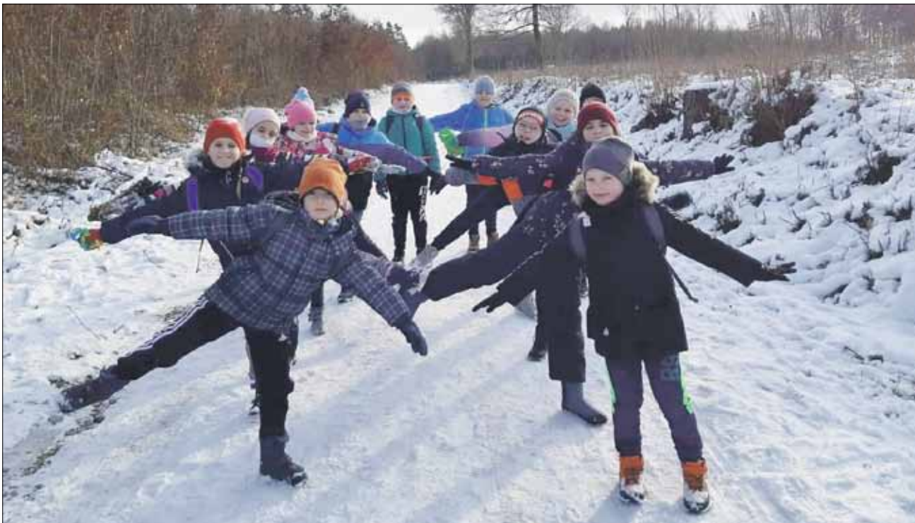
Program półkolonii zorganizowanej przez Stowarzyszenie Europolscy zakładał m.in. piesze wycieczki

Strzełiński samorząd od lat dofinansowuje zimowy wypoczynek młodych mieszkańców miasta i gminy Strzelin. Pod koniec grudnia w magistracie podpisano umowy potwierdzające przyznanie dofinansowań półkolonii dla dzieci z gminy Strzelin. Pierwszym organizatorem półkolonii był Uczniowski Klub Sportowy „Butterfly”, który otrzymał dofinansowanie z budżetu gminy w wysokości 2 300 zł. Półkolonia została zorganizowana w Publicznej Szkole Podstawowej nr 4 w Strzelinie. W trakcie jej trwania przewidziano różnorodne zajęcia sportowe, rekreacyjne, manualne, edukacyjne oraz z profilaktyki uzależnień. Z ferii skorzystało ok. 20 osób,