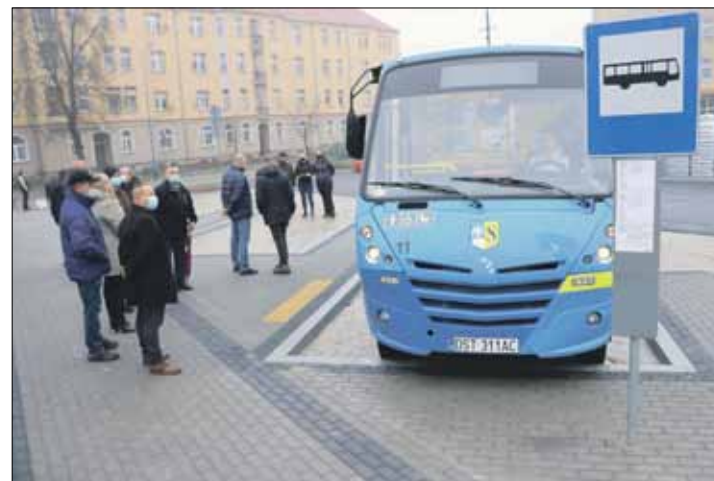
Z węzła przesiadkowego korzystają m.in. busy Strzelińskiej Komunikacji Publicznej