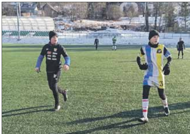
Zawodnicy Klubu Sportowego Strzelinianki uczestniczyli w zgrupowaniu w Suchoj Beskidzkiej

Drugą organizacją, która złożyła ofertę na realizację półkolonii, jest Stowarzyszenie Europolscy, które otrzymało 4 000 zł dofinansowania. Bazą półkolonii była Publiczna Szkoła Podstawowa nr 3 w Strzelinie. W ramach półkolonii dzieci aktywne spędzały czas wolny – zorganizowano piesze wycieczki, zwiedzanie miasta oraz jego okolic, korzystano z otwartej bazy rekreacyjno-sportowej Strzelina, a także przeprowadzono różnorodne gry i zabawy sportowe. W półkolonii uczestniczyły 24 osoby z gminnych szkół podstawowych (z klas od I do IV). Organizatorem kolejnej