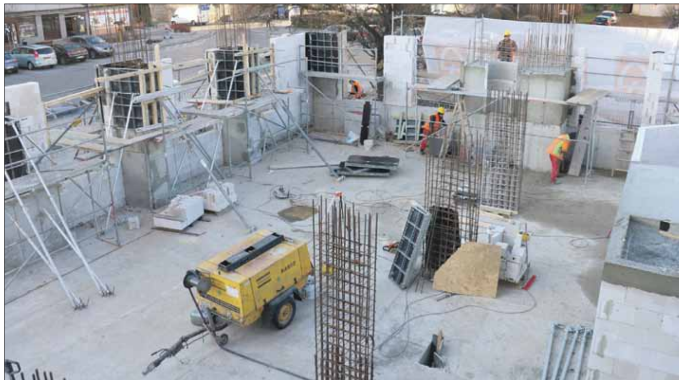
Pracownicy wykonują elementy konstrukcyjne parteru budynku

- Najbliższe miesiące zgodnie z harmonogramem to głównie kontynuacja prac przy wykonywaniu elementów konstrukcyjnych ratusza, ścian działowych – poszczególne kondygnacje aż do wykonania dachu – tzw. stan surowy oraz zakończenie czyszczenia i uzupełnienia spoinowania ścian i sklepiń piwnic ratusza.