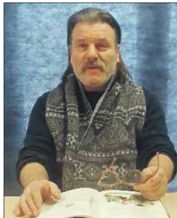
Codziennie na facebookowym profilu ośrodka prezentowano bajkę z różnych stron ziemskiego globu

zyki, ale także opowiedziały o tym, co myślą i wiedzą o swoich babcicach i dziadkach. Warto również wspomnieć o wystawie, która została umieszczona w witrynach Strzelińskiego Ośrodka Kultury. Ekspozycja, niezwykle interesująca nosi tytuł „B jak Batory” i jest realizowana w ramach zeszłorocznych obchodów stulecia odzyskania