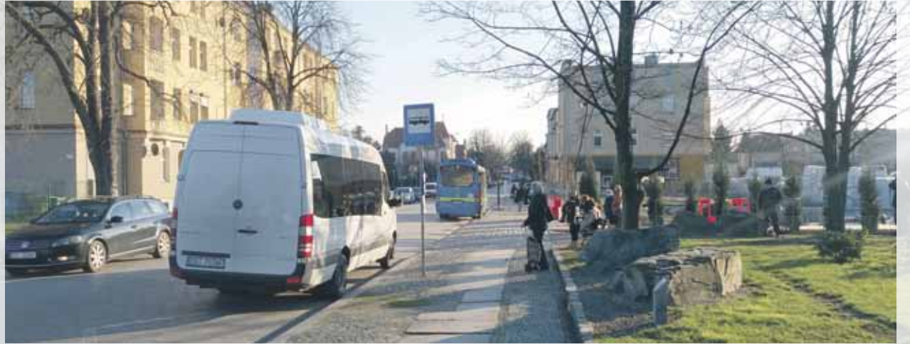
Po wybudowaniu węzła przesiadkowego przystanek przy ulicy Bolka I Świdnickiego ma zostać zlikwidowany

Oddany do użytku pod koniec grudnia 2020 roku autobusowy węzeł przesiadkowy w sposób zasadniczy poprawił bezpieczeństwo i wygodę zarówno dla pasażerów, jak i kierowców. Z ośmiu peronów - sześciu dla busów i dwóch dla autobusów - cztery zostały udostępnione dla przewoźników innych niż StrzeLińska Komunikacja Publiczna. W konsekwencji, dalsze funkcjonowanie przystan-