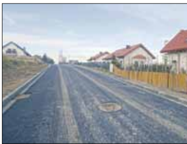
Przebudowa dotyczyła 150-metrowego odcinka drogi

Niedawno zakończyła się realizacja II etapu przebudowy ul. Słonecznej w Strzelinie. Wykonawcą zadania było Przedsiębiorstwo Robót Drogowo Mostowych z Brzegu, a koszt przebudowy 150-metrowego odcinka drogi wyniósł blisko 240 tys. zł. W ramach tej gminnej inwestycji wykonano m.in. kanalizację deszczową oraz nawierzchnię z betonu asfaltowego.