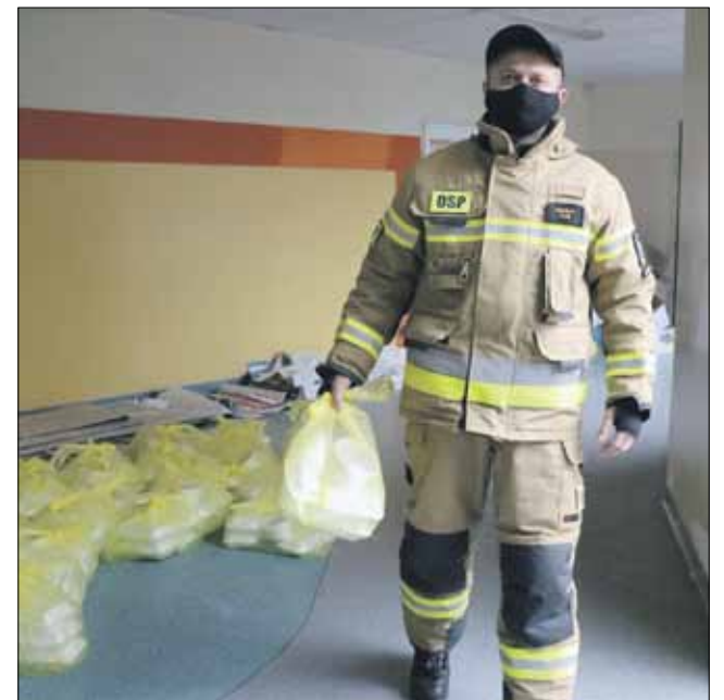
Przy rozwozieniu potraw pomagali m.in. strażacy z Kuropatnika