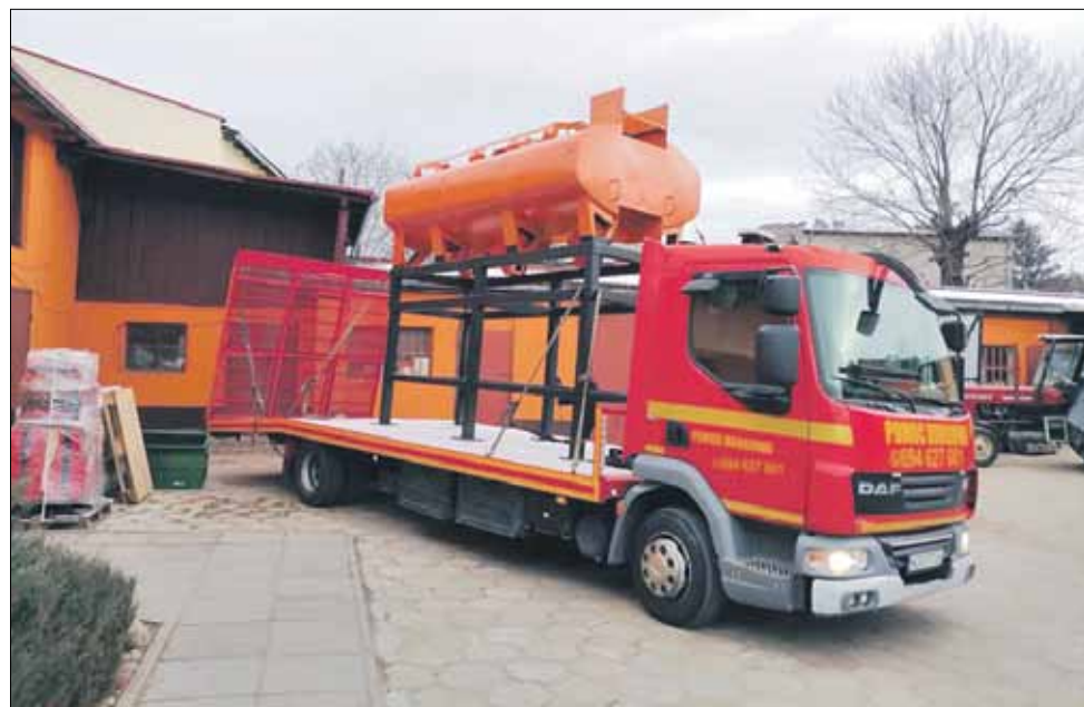
Termos do masy asfaltowej będzie służył do wykonywania prac drogowych