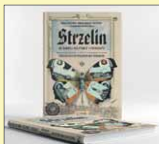
Tak wygląda okładka nowej książki o Strzelinie

Książka już w tym półroczu pojawi się w księgarniach. Mamy nadzieję, że będziemy mieli szansę na osobiste spotkanie z państwem i zaprezentowanie tego, wierzymy, bardzo ważnego dla Strzelina albumu.