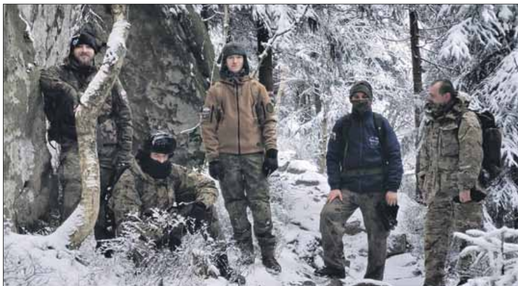
Strzeleńska Jednostka Strzeleckiej JS4330 przeprowadziła w górach marsze kondycyjne

Związek Strzelecki „Strzelec” działa w Strzelinie od blisko 3 lat. Jednostka powstała m.in. po to, aby szkolić młodzież z podstaw wojskowości, uczyć dyscypliny czy rozwijać sprawność fizyczną. Strzelcy zajmują się m.in. zarządzaniem kryzysowym oraz szkoleniami opartymi o program szkoleń Wojska Polskiego. W ostatnim czasie członkowie związku odbyli dwa marsze kondycyjne. Pierwszy w Górach Stołowych na dystansie ok. 19 km, zaś drugi na terenie Karkonoszy, gdzie pokonali ok. 16 km. Marsze miały na celu podnieść