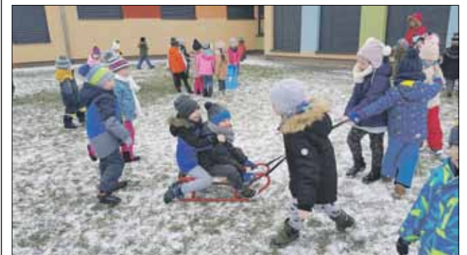
Dzieci z przyjemnością bawiły się na świeżym powietrzu