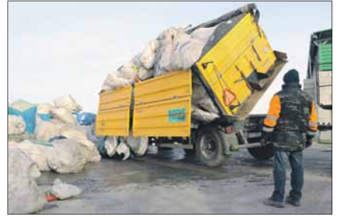
Rolnicy z gminy Strzelin mogli bezpłatnie pozbyć się odpadów pochodzących z działalności

przez gminę wynosiło 500 zł od każdej tony i w 100% pokrywało koszty usunięcia odpadów. Rolnicy nie ponosili więc opłat. Akcja na terenie naszej gminy została zorganizowana po raz pierwszy. Realizacja kolejnej jest uzależniona od możliwości pozyskania dofinansowania.