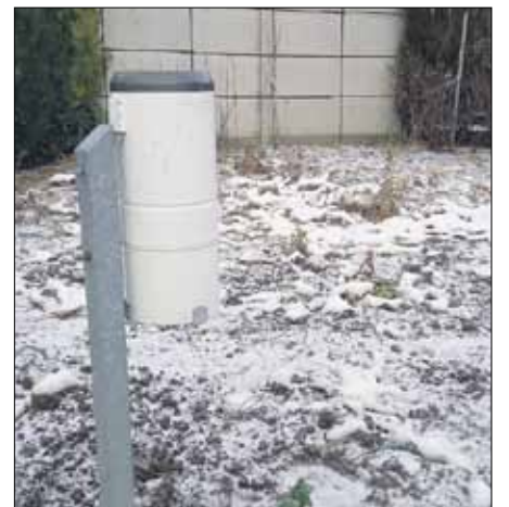
Tak wygląda deszczomierz, który służy do pomiaru opadów na stacji opadowej

Pomiar danych na stacji opadowej jest dokonywany codziennie o 7 rano (czasu zimowego) lub o 8 czasu letniego. Uzyskane dane są następnie raportowane do Instytutu Meteorologii i Gospodarki Wodnej – Państwowego Instytutu Badawczego.