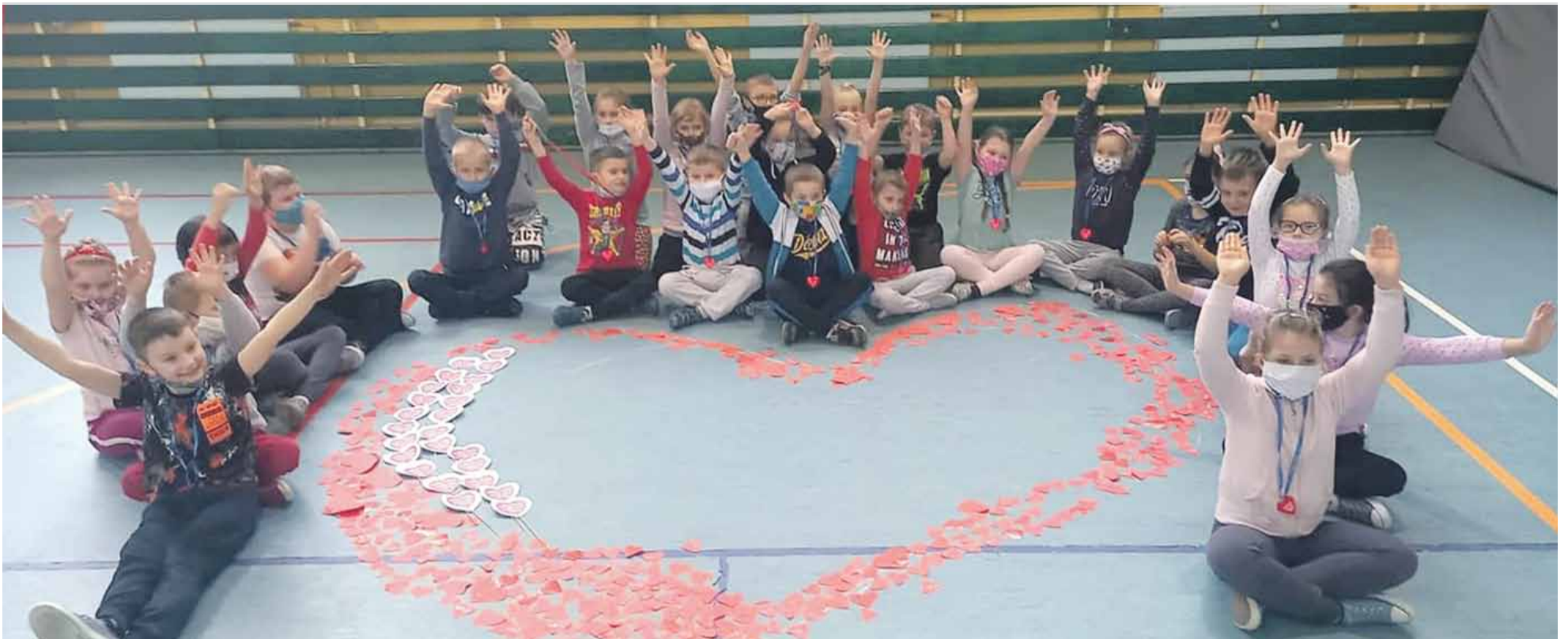
PSP nr 3 w Strzelinie