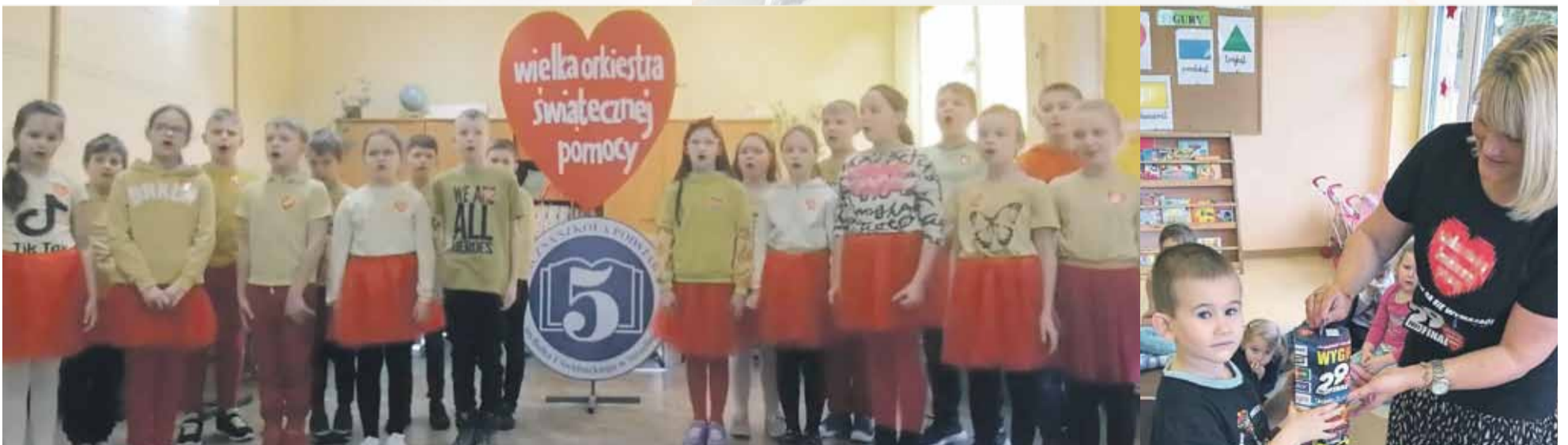
PSP nr 5 w Strzelinie