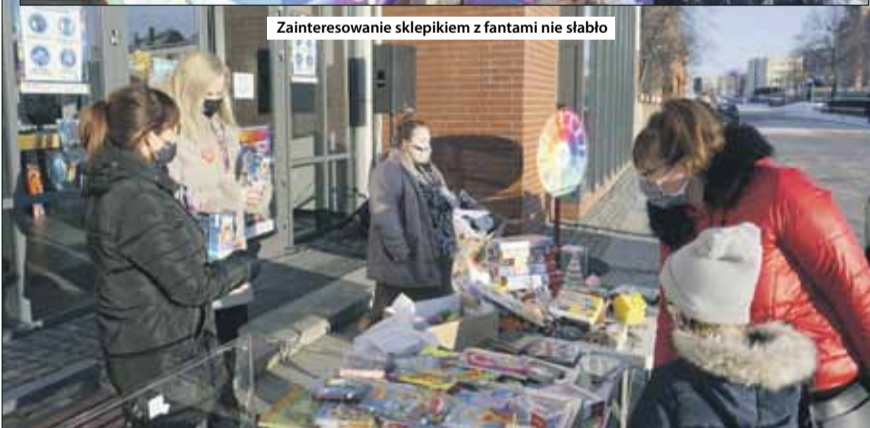
Zainteresowanie sklepikiem z fantami nie słabło