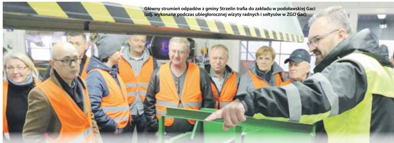
Główny strumień odpadów z gminy Strzelin trafia do zakładu w podolańskiej Gaci (zdj. wykonane podczas ubiegłorocznej wizyty radnych i sołtysów w ZGO Gać)

Instalacje komunalne zagospodarujące odpady komunalne są kluczowym elementem systemu odpadowego, a wysokość opłaty ponoszonej przez mieszkańców to właśnie w znacznej mierze efekt cen obowiązujących w takich instalacjach.