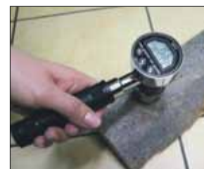
Tak wygląda urządzenie służące do monitorowania wilgotności drewna

Przyrząd posiada dwa metalowe bolce wystające z obudowy – elektrody, które wbija się w drewno, aby dokonać pomiaru. Wynik pojawia się na wyświetlaczu cyfrowym. Jeden z wilgotnościomierzy będzie wykorzystywany przez strażników miejskich podczas przeprowadzanych kontroli palenisk domowych, do sprawdzania