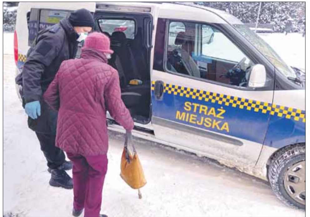
RED Strażnicy pomagają osobom starszym w dotarciu do punktów szczepień w Strzelinie

ne działania Straży Miejskiej. Z uwagi na mroźną zimą aurę strażnicy miejscy sprawdzają również potencjalne miejsca pobytu osób bezdomnych. Dotychczas żadna z nich nie deklarowała konieczności udzielenia pomocy. Strażnicy informują te osoby, iż mogą skorzystać do godziny 16:00 z gorących napojów w jadalni zlokalizowanej na ul. Pocztowej w Strzelinie.