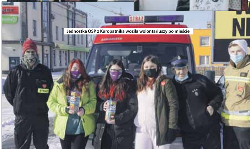
Jednostka OSP z Kuropatnika wozila wolontariuszy po mieście