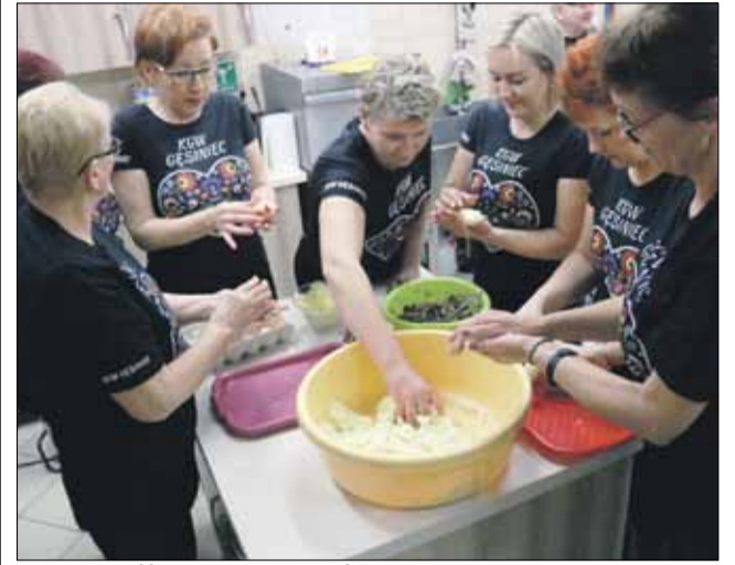
Panie z KGW szybko i sprawnie przygotowały potrawę

Ta potrawa była hitem podczas sprzedaży na bazarze świątecznym. Koło Gospodyń Wiejskich w Gęsińcu podzieliło się z naszymi czytelnikami przepisem na wykonanie krokietów ziemniaczanych.