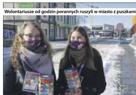
Wolontariusze od godzin porannych ruszyli w miasto z puszkami