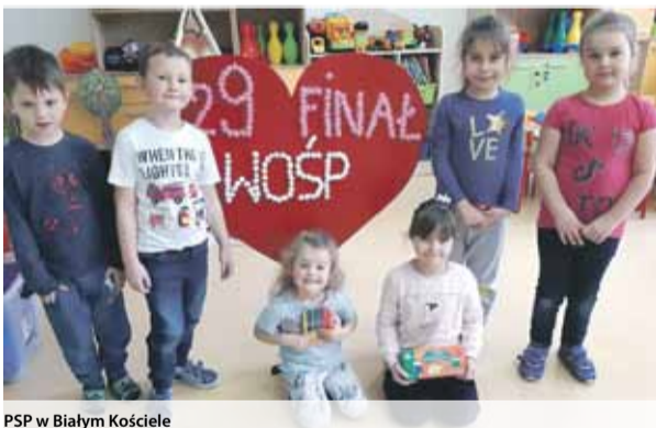
JO PSP w Białym Kościele

Z Wielką Orkiestrą Świątecznej Pomocy tradycyjnie grały gminne szkoły. We wszystkich placówkach (PSP nr 3 w Strzelinie, PSP nr 4 w Strzelinie, PSP nr 5 w Strzelinie, PSP w Kuropatniku i PSP w Białym Kościele) odbywały się zbiórki fantów, które przekazywano do strzeelińskiego sztabu WOŚP. Uczniowie przygotowali również WOŚP-owe dekoracje, które upiękшыły Strzeeliński Ośrodek Kultury. Warto dodać, że uczniowie PSP nr 3 w Strzelinie wzięli udział w szkolnych zawodach sportowych „Sztafeta po serduszek WOŚP”. Klasa, która biegła jako pierwsza nominowała następną, tzw. challenge. Na mecie stała skarbonka, do której chętni uczniowie wrzucali dowolną kwotę. Zebrano 1 343,76 zł, które przekazano do strzeelińskiego sztabu WOŚP. Dodatkowo każdy uczeń klas 1-3 wykonał serduszek, z którego powstało wielkie serce promujące pomoc. Szkoła została zarejestrowana do udziału w ogólnopolskiej akcji wspierającej WOŚP i zachęcającej do ćwiczeń online. Za każde 10 punktów zdobyte przez dzieci na platformie, Fundacja Pho3nix przekazała na konto WOŚP złotówkę. Nie można również zapomnieć o zbiórcie w Przedszkolu Miejskim „Kolorowa Kraina”. Na przedszkolnym profilu facebookowym pod koniec stycznia prowadzono licytację fantów, które cieszyły się dużą popularnością. Łącznie strzeelińskie przedszkole na rzecz Wielkiej Orkiestry Świątecznej Pomocy zebrało w tym roku blisko 8800 zł.