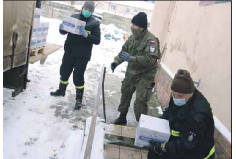
W rozładunku żywności pomagali członkowie Związku Strzeleckiego „Strzelec” ze Strzelina oraz druhowie z Ochotniczej Straży Pożarnej w Broczu

Na początku lutego do Gminnego Ośrodka Pomocy Społecznej w Strzelinie dotarła kolejna partia żywności. Tym razem dostarczono ponad 6 ton żywności, m.in. cukier, fasolkę po bretońsku, filet z makreli w oleju, groszek z marchewką, kaszę jęczmienną, koncentrat pomidorowy, makaron jajeczny, mleko czy szynka drobiowa. Produkty dostarczane są z Banku Żywności w ramach Programu Operacyjnego Pomoc Żywnościowa 2014-2020, współfinansowanego z Europejskiego Funduszu Pomocy Najbardziej Potrzebującym - Podprogram 2020. Z pomocy skorzysta 336 rodzin (684 osoby). Na jedną osobę przypada nieco ponad 42 kg żywności. W rozładunku żywności pomagali członkowie Związku Strzeleckiego „Strzelec” ze Strzelina oraz druhowie z Ochotniczej Straży Pożarnej w Broczu.