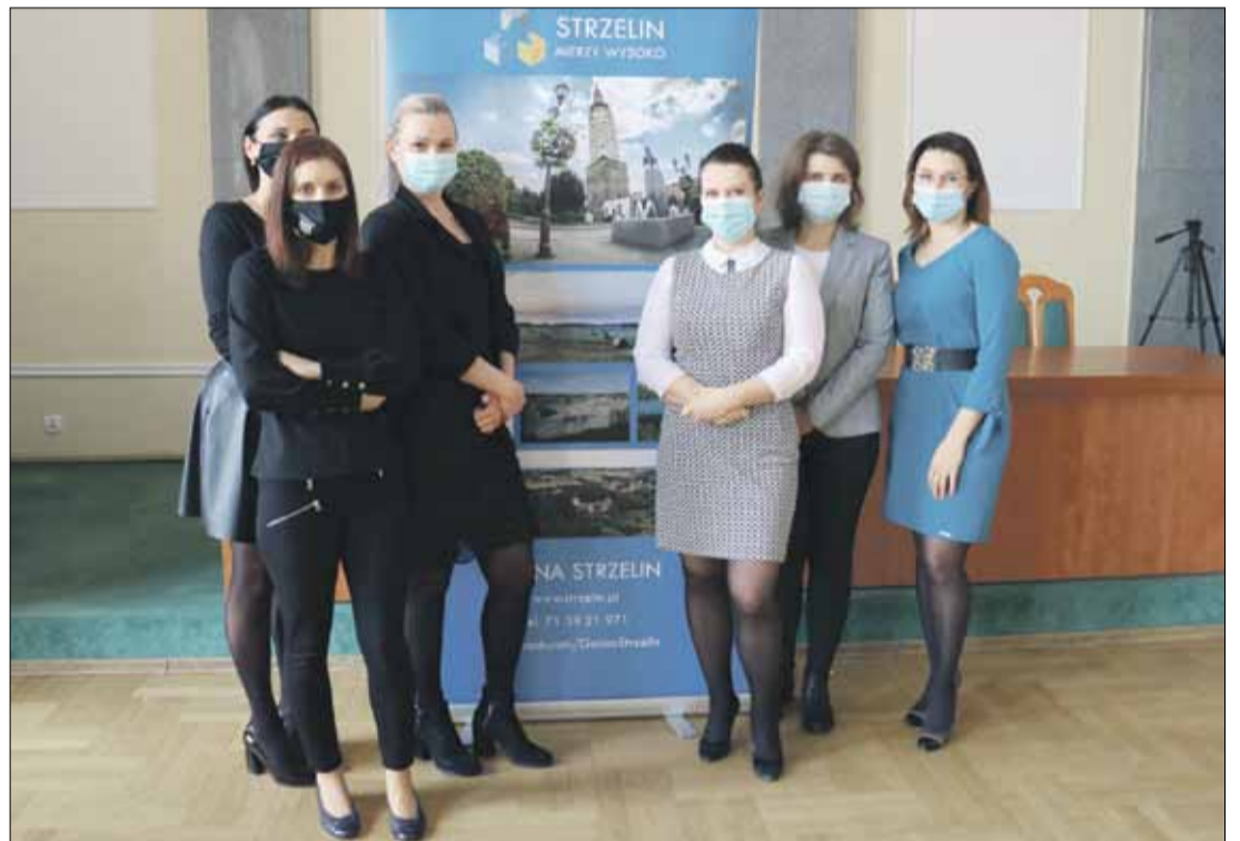
RED Roznoszeniem korespondencji do mieszkańców zajmują się m.in. pracownicy Wydziału Podatków i Opłat strzeleńskiego magistratu

Akcja potrwa do początku marca. Warto dodać, że taki sposób dostarczania decyzji podatkowych mieszkańcom jest skuteczniejszy i tańszy, a co za tym idzie korzystniejszy dla budżetu gminy.