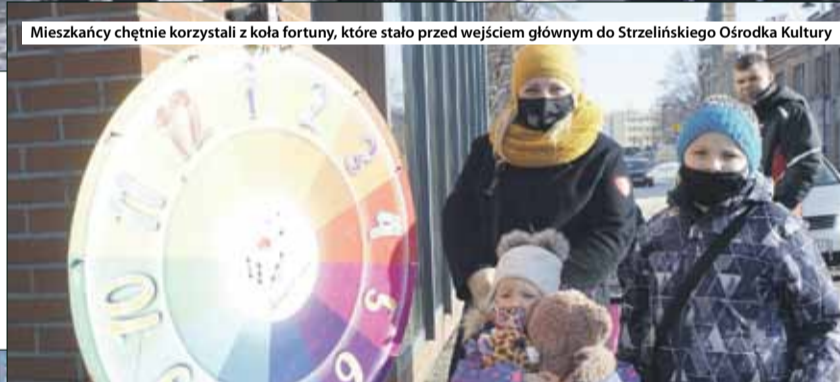
Mieszkańcy chętnie korzystali z koła fortuny, które stało przed wejściem głównym do Strzeelińskiego Ośrodka Kultury