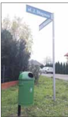
16 nowych koszy zamontowano na Osiedlu Wschodnim w Strzelinie

W 2020 roku gmina zakupiła i zamontowała 50 koszy ulicznych. Wymieniono m.in. 20 koszy na Osiedlu Stare Miasto oraz dostawiono 16 nowych na Osiedlu Wschodnim. Zakupy zostały współfinansowane z funduszy osiedlowych. Pozostałe kosze zostały zamontowane na placach zabaw oraz na ulicach w mieście. W 2021 roku zostały również zapisane środki na ten cel i kolejne ulice doczekają się nowych koszy. Niewątpliwie wpłynie to na poprawę estetyki miasta.