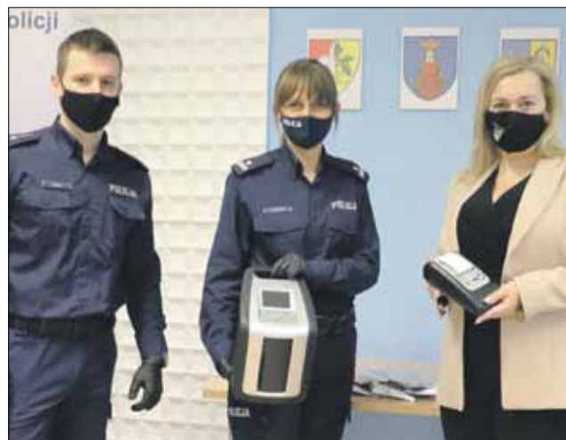
Gmina Strzelin przekazała strzeLińskieJ policji środki na zakup analizatora, który służy do wstępnego badania kierowców na zawartość w organizmie środków odurzających