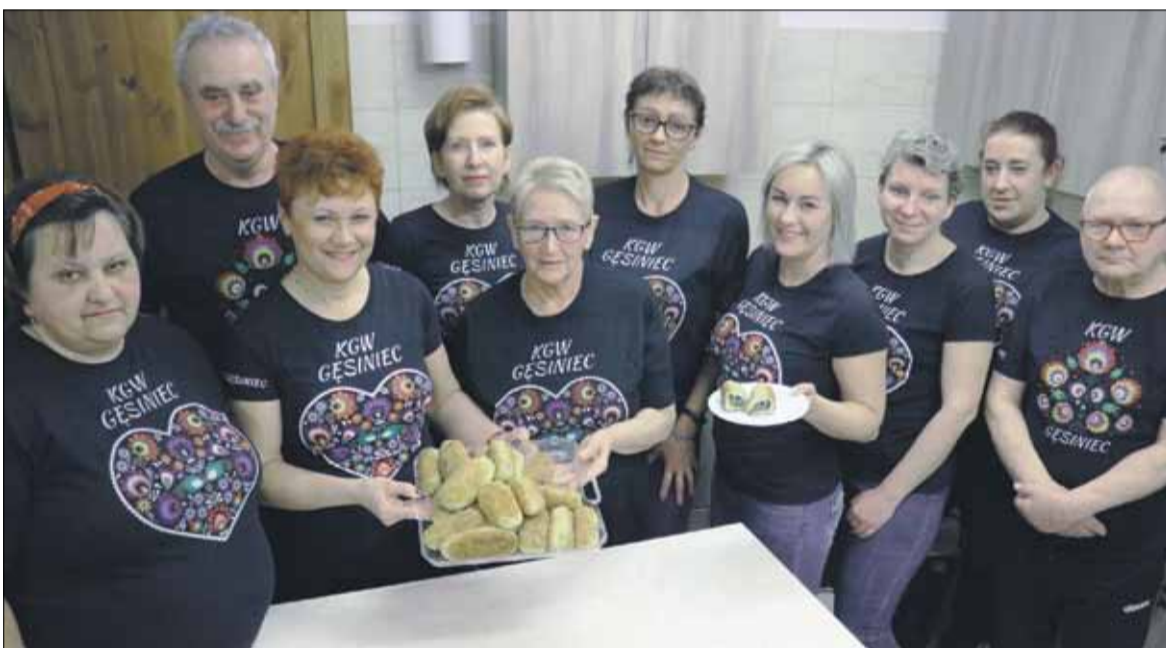
Koło Gospodyń Wiejskich w Gęsińcu podzieliło się z naszymi czytelnikami przepisem na krokiety ziemniaczane