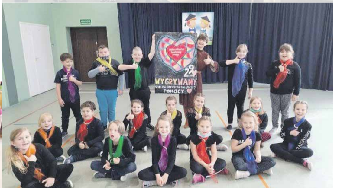
PSP w Kuropatniku