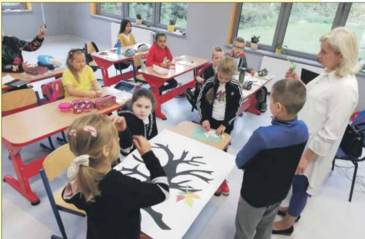
RED Uczniowie biorą udział w projekcie edukacyjnym wspierającym rozwój czytelnictwa

Uczniowie trzeciej klasy Publicznej Szkoły Podstawowej w Białym Kościele realizują międzynarodowy projekt edukacyjny wspierający rozwój czytelnictwa wśród uczniów klas I-III. W ramach projektu pn. „Czytam z klasą – lekturki spod chmurki” dzieci wybrały do przeczytania książkę M. Terlikowskiej pt. „Drzewo do samego nieba” oraz dodatkowo „Jesień liścia Jasia”. Teksty czytały wspólnie podczas zajęć rozwijających lub samodzielnie w domu. Zapoznały się z filmem promocyjnym i przeczytały opowiadanie o Tosi, aby „ruszyć na sam szczyt wiedzy”. Uczniowie wykonali swoje „Czytanie”, „chmurkę Tosię”, stworzyli „Jesienne drzewo czytelnictwa”, wspólnie uzupełnili „Lekturki”. Chętnie dzielili się swoimi wrażeniami i spostrzeżeniami po przeczytaniu książek. Trzecioklasiści przeczytali również opowiadanie pt. „Mała chmurka w krainie drzew”. Zapoznali się z budową drzew i dowiedzieli się, co nim zawdzięczamy. Poznali rodzaje lasów, leśne warstwy i zwierzęta w nich żyjące. Stworzyli oryginalne prace plastyczne z wykorzystaniem plasteliny i liści pt. „Jesienne drzewka w naszej klasie”. Wszyscy byli bardzo zaangażowani w poszczególne zadania i obecnie rozpoczęli realizację II modułu projektu pt. „Mała chmurka w krainie śniegu”, podczas którego zapoznają się z zimowymi baśniami Andersena oraz „Zimą Muminków”.