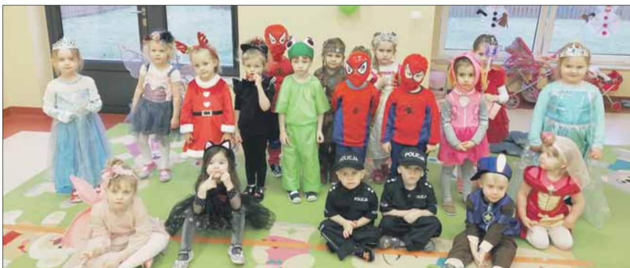
Każdy z przedszkolaków zadbał w tym dniu o odpowiedni strój