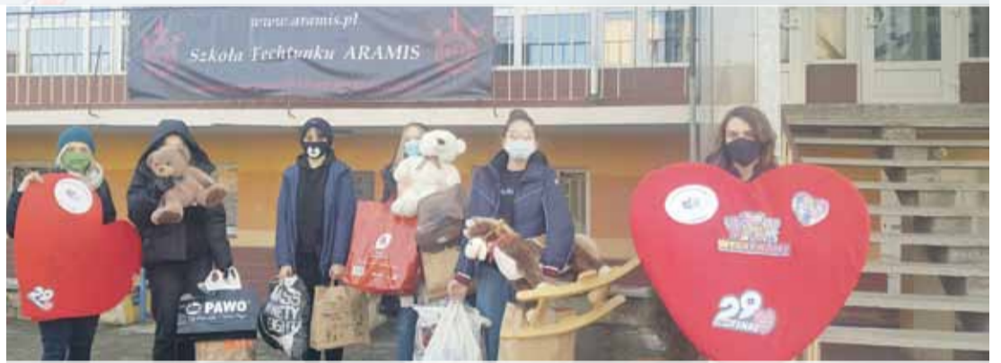
PSP nr 4 w Strzelinie