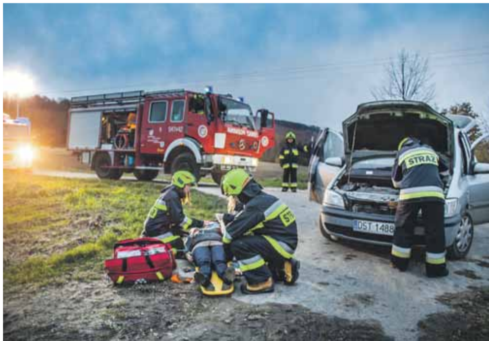
W ubiegłym roku strażacy w powiecie strzeLińskim wyjeżdżali do różnego rodzaju zdarzeń 892 razy (zdjęcie ilustracyjne)

najwięcej w marcu (40 razy), kwietniu (69 razy), gdy wypalane są trawy oraz sierpniu (29 razy), czyli w okresie wypalania ściernisk, słomy oraz resztek poźniwnych. – Te zdarzenia są w dużej mierze wynikiem lekceważenia podstawowych zasad profilaktyki pożarowej, a w szczególności nadal stosowanych praktyk wypalania traw, pozostałości roślinnych, czy w okresie żniw słomy – dodaje.