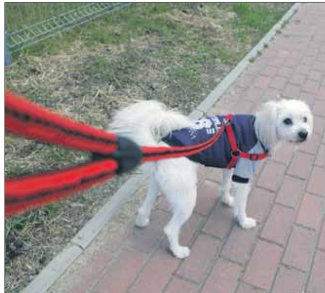
Obowiązek sprzątania po czworonogu należy do jego właściciela

Psie odchody na skwerach, placach czy chodnikach są nie tylko problemem natury estetycznej, ale również potencjalnym zagrożeniem epidemiologicznym. Nie zapominajmy, że kontakt z psimi odchodami może wywołać u ludzi groźne choroby takie jak np. toksokaroza czy bąblowica.