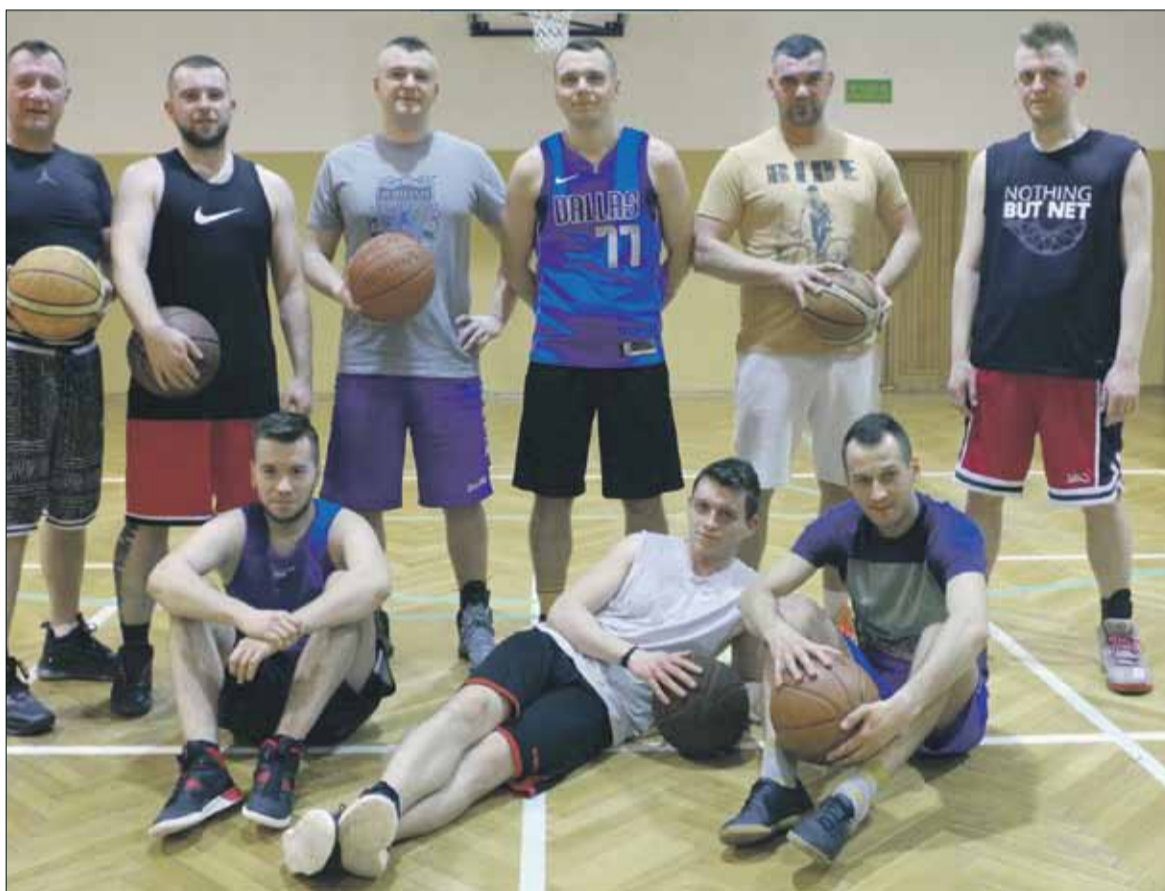
Stowarzyszenie DST Basket skupia miłośników gry w koszykówkę