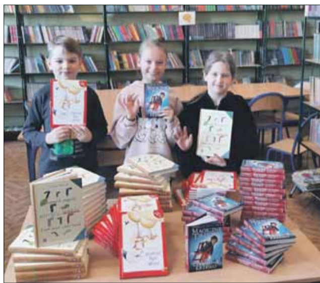
PSP nr 5 w Strzelinie W marcu na półki szkolnej biblioteki trafiły nowe książki

Biblioteka szkolna w Publicznej Szkole Podstawowej nr 5 im. Bolka I Świdnickiego w Strzelinie w swoich działaniach stara się wspierać uczniów w rozwoju kultury czytelnictwa przez różne działania. Atrakcyjność zasobów bibliotecznych niewątpliwie wpływa na zainteresowanie czytelników. W tym roku odnowiono część klasycznych pozycji i zakupiono nowości, m.in. „Cukierku, ty łobuzie” z kolejnymi częściami serii. Ta lektura szczególnie przypadła dzieciom do gustu, ponieważ w ubiegłym roku szkolnym placówka gościła jej autora Waldemara Cichonia. Lektura jest bardzo chętnie wykorzystywana w ramach akcji „Mądra szkoła czyta dzieciom”. Biblioteka szkolna od wielu lat może liczyć na życzliwość i pomoc Rady Rodziców. Dzięki jej wsparciu uczniowie znów mogli się cieszyć nowymi książkami. W marcu na półki trafiły: „Magiczne drzewo” Andrzeja Maleszki, „Niesamowite przygody dziesięciu skarpetek (czterech prawych i sześciu lewych)” Justyny Bednarek, „Kapelusz Pani Wony” Danuty Parlach. W sumie do biblioteki trafiło 78 egzemplarzy. Społeczność szkoły pragnie na łamach gazety gorąco podziękować rodzicom za ich mądrość, zrozumienie i życzliwość we wspieraniu rozwoju czytelnictwa i zasobów biblioteki szkolnej.