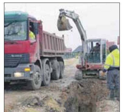
Na terenie tzw. nowego osiedla w Pławnej trwają roboty związane z budową kanalizacji sanitarnej

W Pławnej trwa budowa kanalizacji sanitarnej. Przypomnijmy, że inwestycję Zakładu Wodociągów i Kanalizacji w Strzelinie realizuje Zakład Instalacyjno-Budowlany „ISAN-BUD” z Niemodlina. W ramach projektu przewidziano budowę kanalizacji sanitarnej grawitacyjnej o długości 4,3 km na osiedlu mieszkaniowym w Pławnej w obszarze ulic: Klonowa (od nr 5), Lipowa, Sosnowa, Brzozowa, Cisowa, Akacja, Świerkowa, Strzeleńska (do wysokości nr 21 od strony Strzelina) wraz z przepompownią ścieków. Przewidywana wartość robót to 2.235.668,10 zł netto plus podatek VAT 514.203,66 zł co stanowi cenę ofertową brutto w wysokości: 2.749.871,76 zł. Roboty mają potrwać do 20 sierpnia 2021 r. Obecnie zaawansowanie prac określa się na ok. 20%. Inwestycja jest realizowana w oparciu o program „Gospodarka wodno - ściekowa w ramach Programu Rozwoju Obszarów Wiejskich na lata 2014-2020”. Przewidywana kwota dotacji ze środków UE wynosi 1 995 565,00 zł.