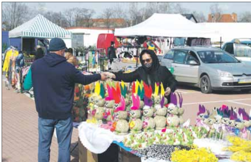
Na bazarze można było zakupić m.in. piękne ozdoby

Zakupom sprzyjała piękna, słoneczna pogoda oraz handlowa niedziela. Bazar był skromną namiastką wcześniejszego, tradycyjnego jarmarku, który przed pandemią odbywał się w strzelińskim Rynku. O organizację niedzielnego bazaru zadbało Centrum Usług Komunalnych i Technicznych w Strzelinie przy współpracy ze Strzelińskim Ośrodkiem Kultury oraz gminą Strzelin. Dodajmy, że handlujący oczywiście nie ponosili żadnych opłat za wynajem stoisk, a podobne bazarzyki odbyły się już przed ostatnimi Świętami Bożego Narodzenia.