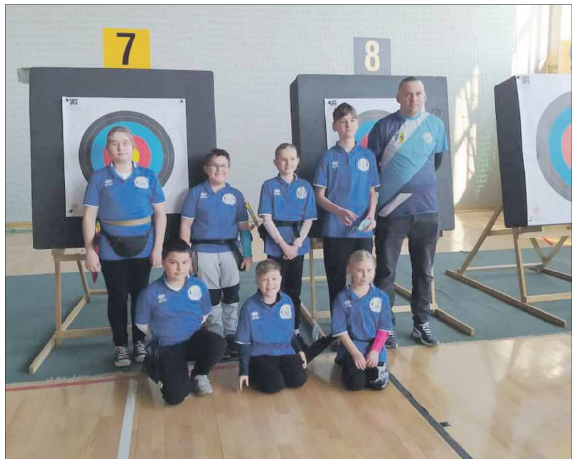
Zawodnicy strzebińskiego klubu SŁ Granit zaliczyli bardzo dobre występy podczas Halowych Mistrzostw Dolnego Śląska Dzieci i Młodzików