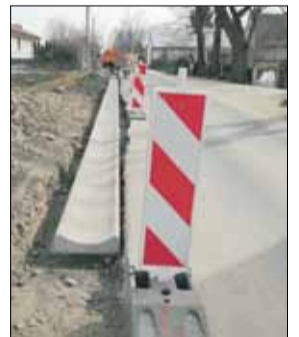
W Gęsińcu zamontowano koryta betonowe, które służą do odprowadzania wody

Warto dodać, że w ostatnim czasie pracownicy CUKiT wykonali także wjazd na plac zabaw w Gościęcicach.