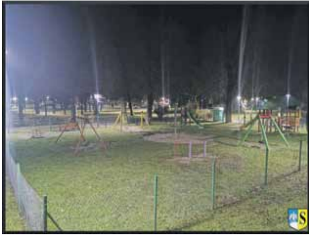
W Parku Wschodnim zamontowano 30 energooszczędnych opraw

Na początku marca zakończył się drugi etap budowy oświetlenia w Parku Wschodnim przy ul. Staszica w Strzelinie. Przypomnijmy, że tę gminną inwestycję za blisko 145 tys. zł realizowało przedsiębiorstwo ITINET z Zielonej Góry, które współpracowało już z gminą Strzelin przy wykonaniu oświetlenia w Parku Miejskim im. Armii Krajowej. W ramach zadania w Parku Wschodnim zostało