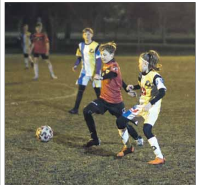
Podczas meczu rywalizacja była zacięta, a cel szczytny