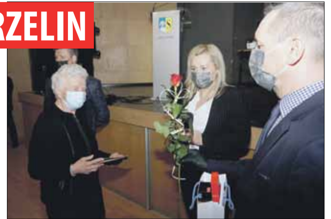
Obchody Dnia Sołtysa to doskonały moment na podziękowania przedstawicielom sołectw za ich ciężką pracę

Jedenastego marca w Polsce obchodzony jest Dzień Sołtysa. Z tej okazji w sali widowiskowej Strzełińskiego Ośrodka Kultury, z uwzględnieniem reżimu sanitarnego, odbyły się gminne obchody tego święta. Przedstawiciele lokalnych władz podziękowali sołtysom i przewodniczącym zarządów osiedli za społeczną pracę na rzecz sołectw, osiedli oraz całej gminy Strzelin. Były oczywiście życzenia oraz drobne upominki. Nie zabrakło również tradycyjnego akcentu artystycznego, którym był koncert Husynianek z Gęsińca oraz krótkiej części organizacyjnej dotyczącej tegorocznego funduszu soleckiego.