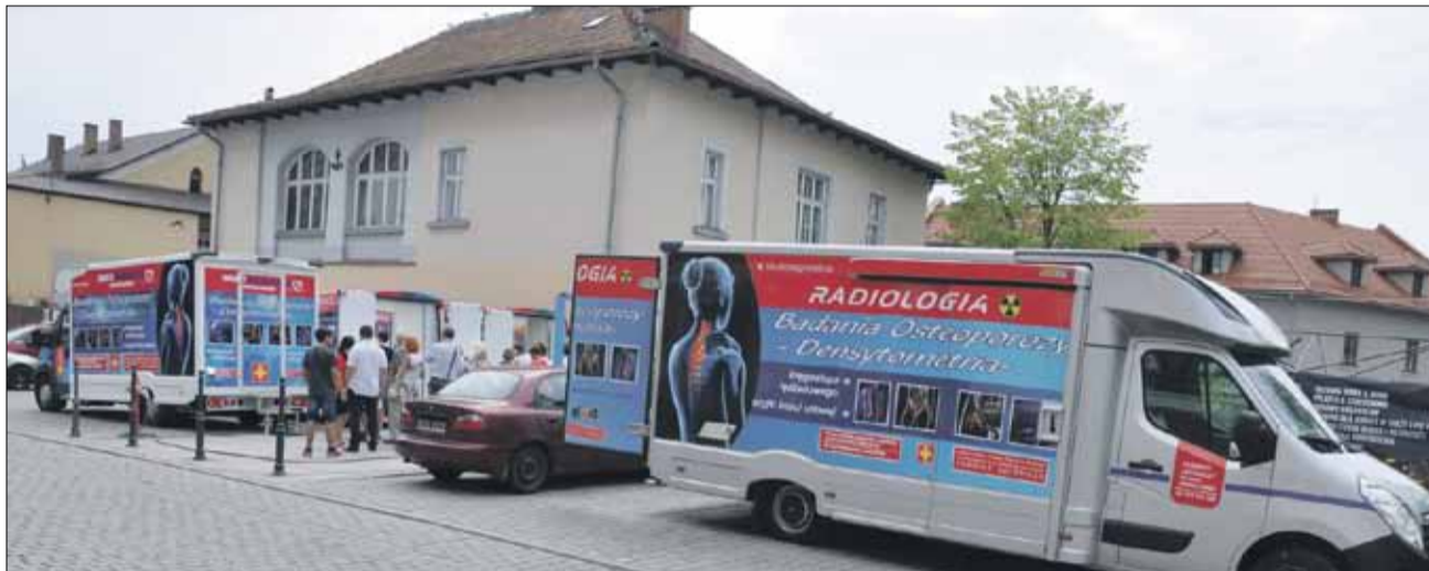
Taka mobilna pracownia densytometryczna będzie dostępna dla mieszkańców na początku kwietnia przy PZLA w Strzelinie (zdj. poglądowe)

W środę, 7 kwietnia mieszkańcy Strzelina i okolic będą mieli możliwość zbadania swoich kości w „osteobusie”. Mobilna pracownia densytometryczna stanie przy Publicznym Zakładzie Lecznictwa Ambulatoryjnego przy ul. Mickiewicza 20 w Strzelinie.