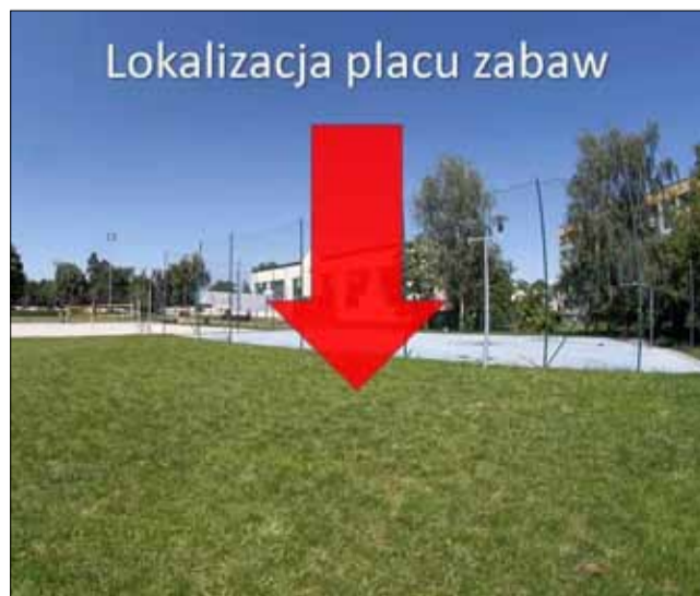
Przy PSP nr 3 w Strzelinie zostanie wybudowany plac zabaw