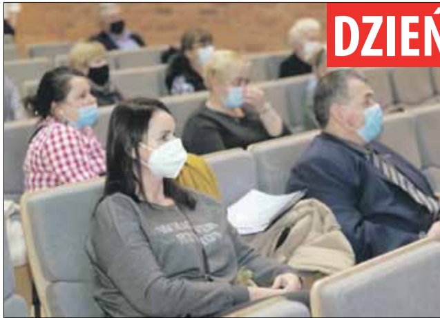
Wydarzenie odbyło się w sali widowiskowej SOK