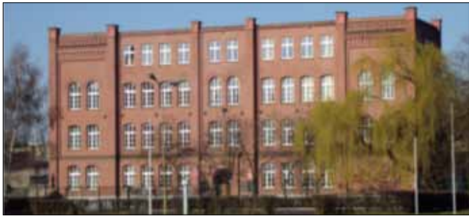
Technikum im. Bohaterów Westerplatte w Strzelinie prowadzi rekrutację w roku szkolnym 2020/2022 w następujących kierunkach: