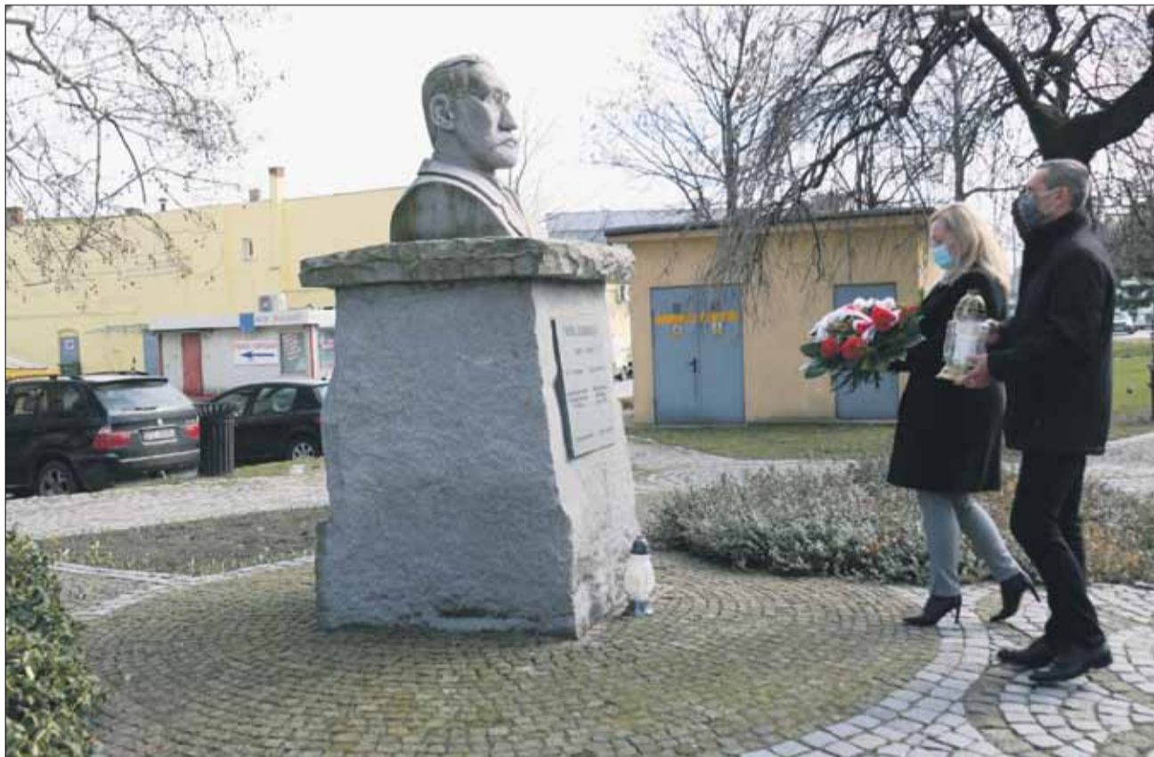
Delegacja strzeleńskiego magistratu złożyła kwiaty i zapaliła znicze przed strzeleńskim popiersiem Paula Ehrlicha

Paul Ehrlich przyszedł na świat 14 marca 1854 roku w Strzelinie (niem. Strehlen), w narożnej kamienicy na zachodniej pierzei rynku pod numerem 28, u zbiegu z Polnische Gasse. Noblista spędził dzieciństwo w Strzelinie. W latach 1860–1864 uczęszczał tu do Volksschule, odpowiednika dzisiejszej szkoły podstawowej. Gimnazjum św. Marii Magdaleny ukończył we Wrocławiu. Naukę na studiach medycznych kontynuował także we Wrocławiu, a następnie w Strasburgu, Breisgau oraz Lipsku. W 1878 roku jako młody naukowiec rozpoczął pracę w berlińskiej Klinice Medycznej.