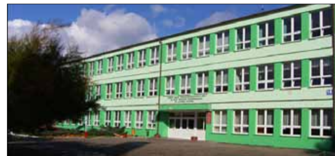
Centrum Kształcenia Zawodowego i Ustawicznego w Ludowie Polskim prowadzi rekrutację w roku szkolnym 2021/2022 w następujących kierunkach: