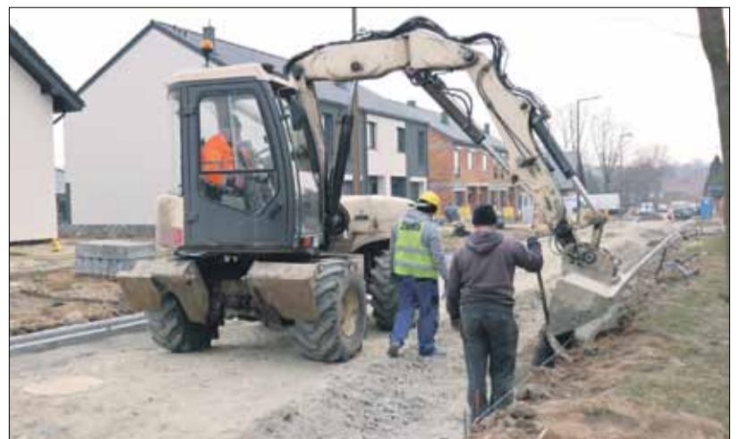
Na terenie Osiedla Wschodniego trwa remont dróg

Na drogach Osiedla Wschodniego trwają prace remontowe. Prowadzi je firma Przedsiębiorstwo Handlowo-Usługowe ZURB z Borowa. Inwestycja prowadzona jest na ulicach: Galla Anonima, Gabrieli Zapolskiej, Zofii Nalkowskiej oraz ul. Stanisława Moniuszki (wyłącznie kanalizacja deszczowa). Zakres robót obejmuje m.in. wykonanie nawierzchni asfaltowych o szerokości 5 m, które będą ograniczone krawężnikami ze ściekiem z kostki betonowej. W ramach zadania zostanie też wykonana kolejna część sieci kanalizacji deszczowej, wraz z podłączeniem do istniejących kolektorów. Koszt inwestycji to blisko 770 tys. zł. Przewidywany termin zakończenia tej gminnej inwestycji to koniec czerwca 2021 roku.