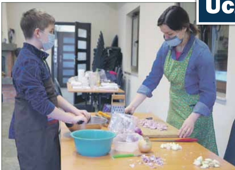
Celem zajęć jest nauka gotowania dań kuchni polskiej