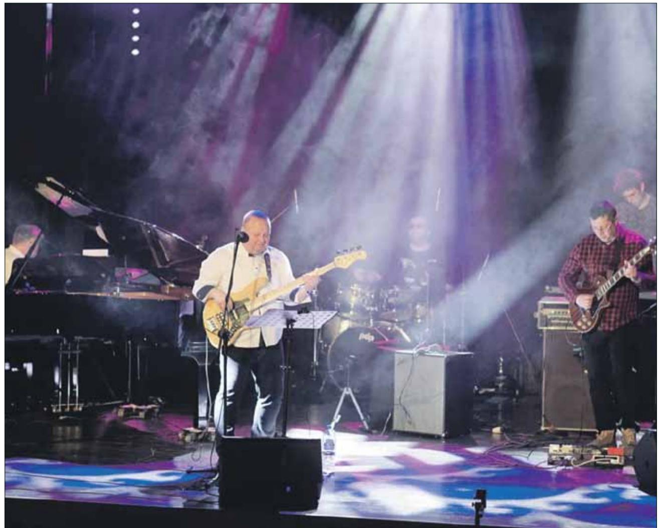
Na scenie Strzelińskiego Ośrodka Kultury wystąpił zespół Charon