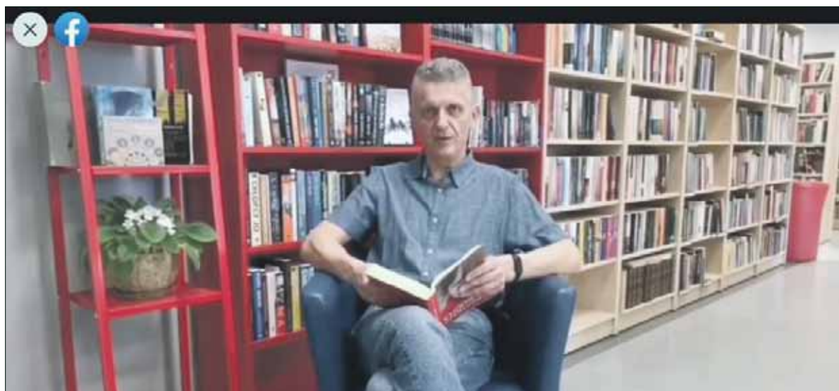
W strzelińskiej bibliotece z okazji Dnia Kobiet mężczyźni czytali wybrane wiersze

Gościem tegorocznej edycji Strzelińskiego Festiwalu Literatury będzie m.in. Radek Rak