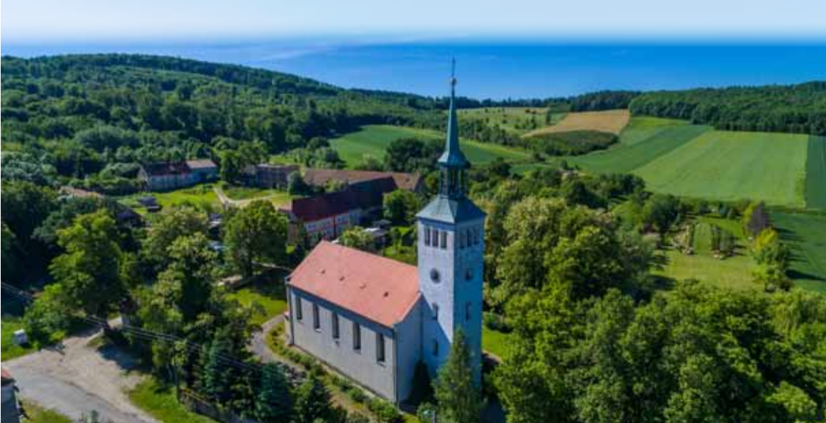
Gmina Strzelin przekaże 50 tys. zł na remont elewacji wieży Sanktuarium Maryjnego w Nowolesiu

Strzeleński samorząd troszczy się o cenne obiekty zabytkowe, konsekwentnie partycypując w kosztach prac remontowych i konserwatorskich. W 2021 roku gmina Strzelin planuje przyznać na wniosek Parafii Rzymsko-Katolickiej p.w. Św. Marcina w Nowolesiu dotację 50 tys. zł na wykonanie remontu elewacji wieży Sanktuarium Maryjnego, polega-