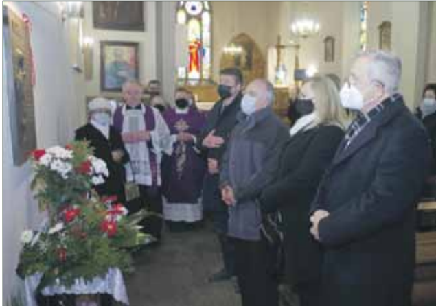
Po mszy, delegacje złożyły pod epitafium kwiaty i znicze

Skromne, z racji pandemicznych ograniczeń, uroczystości tradycyjnie zorganizowali wspólnie przedstawiciele strzeleńskiego samorządu oraz Stowarzyszenia Huta Pieniacka. W kościele przy ul. Staromiejskiej w Strzelinie odbyła się msza w intencji pomordowanych mieszkańców Huty Pieniackiej i innych kresowych miejscowości. Po jej zakończeniu złożono kwiaty i znicze pod epitafium upamiętniającym ofiary tej okrutnej zbrodni dokonanej 28 lutego 1944 r. przez żołnierzy ukraińskiej dywizji SS Galizien i banderowców. W tej masakrze, 77 lat temu zginęło ok. tysiąc Polaków, w tym wiele dzieci i kobiet. O upamiętnienie tej okrutnej zbrodni wytrwale zabiega Stowarzyszenie Huta Pieniacka, w którym aktywnie działają również mieszkańcy naszej gminy. To właśnie z inicjatywy stowarzyszenia i rodziny Kobylańskich ze Strzelina w kościele przy ul. Staromiejskiej jest epitafium przypominające o tej zbrodni. I to właśnie tam corocznie składane są kwiaty i znicze. W tym roku, w mszy uczestniczyła m.in. delegacja