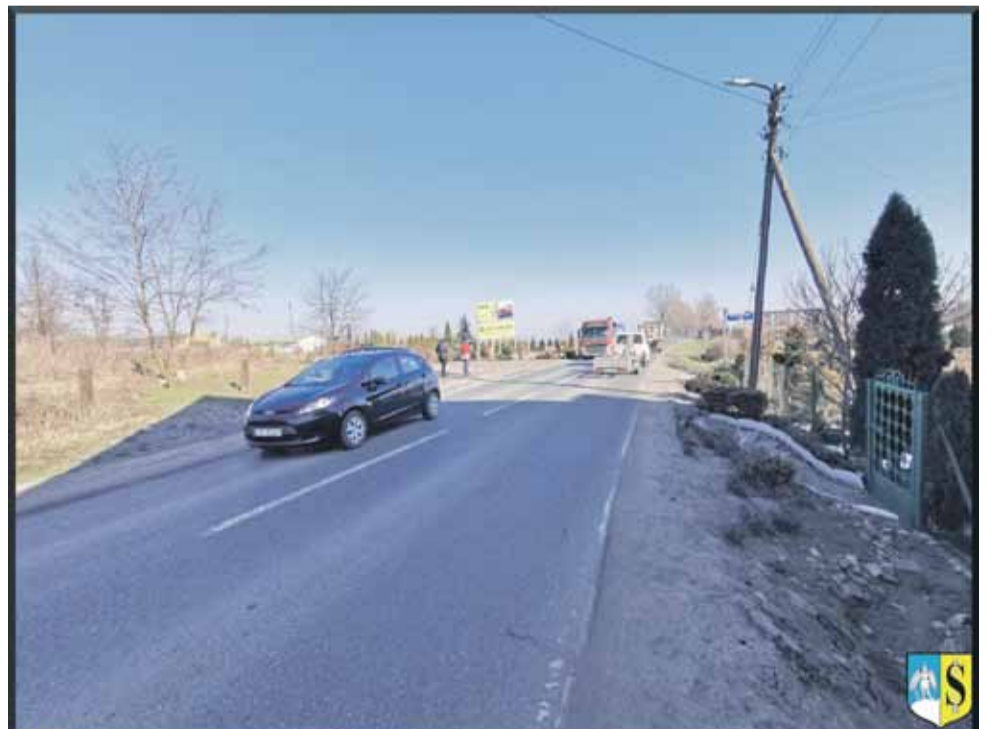
W miejscowości nie ma chodników, a jedynie wąskie, nieregularne pobocza

52%) i wykonana w zastępstwie inwestorskim przez Gminę Strzelin. Koszty wy-