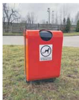
W mieście zamontowanych jest ok. 30 takich czerwonych koszy przeznaczonych na psie odchody

na też wyrzucić nie tylko do dedykowanych „psich” koszy, ale także do każdego innego pojemnika ulicznego lub tego na odpady zmieszane. Pamiętajmy jednak, aby do koszy na psie odchody absolutnie nie wrzucać innych odpadów. Każdy właściciel czworonoga powinien zapewnić sobie woreczki/torebki na psie odchody. Jednak, aby zachęcić mieszkańców do sprzątania