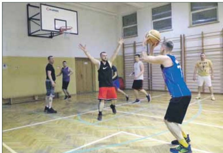
Treningi odbywają się w sali gimnastycznej PSP nr 4 w Strzelinie