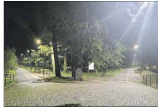
Strzeleński magistrat otrzyma niecałe 2 mln zł dofinansowania na modernizację oświetlenia ulicznego (zdjęcie poglądowe)