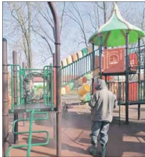
Place zabaw są przygotowywane do sezonu