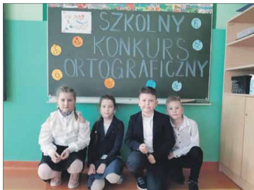
RED Konkurs ortograficzny skierowany był dla uczniów klas II i III

Wszystkim uczestnikom gratulujemy osiągniętych wyników