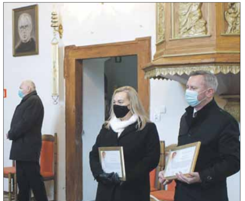
Szefowie gmin - Strzelin i Kondratowice - otrzymali upominki i listy gratulacyjne