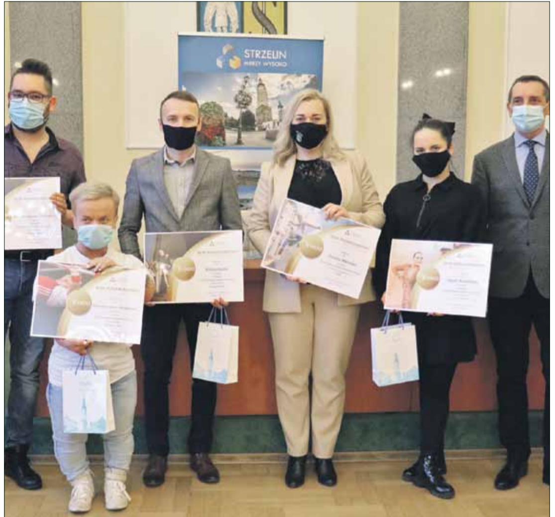
Na uroczystości wręczenia nagród pojawiło się troje sportowców

Warto podkreślić, że przyznawanie nagród finansowych zawodnikom, reprezentantom klubów i stowarzyszeń za wysokie wyniki i osiągnięcia sportowe ma być formą gratyfikacji za promowanie gminy Strzelin na arenie ogólnopolskiej i międzynarodowej. Taka forma wsparcia dla zawodników ma propagować rozwój sportu młodzieżowego w gminie oraz stymulować działania w kierunku osiągnięcia coraz lepszych wyników we współzawodnictwie sportowym.