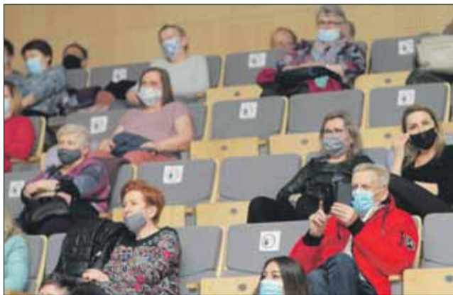
Sala widowiskowa, zgodnie z obowiązującymi obostrzeniami, mogła być zapelniona tylko w połowie