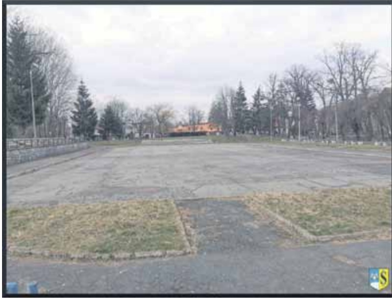
Na terenie dawnego lodowiska w tym roku ma powstać strefa aktywnego wypoczynku

Na terenie dawnego lodowiska położonego pomiędzy ulicami Wojska Polskiego, Kruczą i Młynarską zostanie utworzona strefa aktywnego wypoczynku. O realizacji tej gminnej inwestycji zdecydowali sami mieszkańcy. Właśnie ta propozycja uzyskała największą liczbę głosów w ramach Strzeleńskiego Budżetu Obywatelskiego.