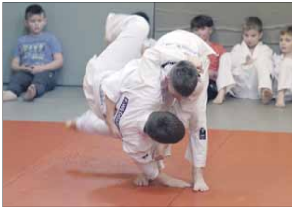
Zawodnicy wytrwale uczą się tajników tej pięknej dyscypliny sportowej

Widać, że ma on świetne podejście do swoich podopiecznych i doskonale nawiązuje z nimi kontakt. Zajęcia są ciekawe i różnorodne, a młodzi zawodnicy i zawodniczki są bardzo zdyscyplinowani. Z zapalem i ogromnym zaangażowaniem wykonują polecenia swojego trenera. A w dzisiejszych czasach, kiedy młodzi ludzie skupiają się często na wirtualnych, internetowych rozrywkach, nie jest to wcale takie oczywiste. Dlatego możemy z czystym sumieniem polecić zajęcia w klubie Judo Tigers, który ma już w naszym mieście bardzo dobrą renomę. Tę opinię potwierdzają zresztą rodzice, których cieszy to, że ich dzieci chętnie korzystają z treningów. Ogromnym atutem treningów judo jest niewątpliwie ogólnorozwojowy charakter tej dyscypliny. - W Strzeleńsku działamy już pięć lat. Zajęcia prowadzimy na obiektach Strzeleńskiego Centrum Sportowo-Edukacyjnego, w hali sportowej przy ul. Staromiejskiej 64. W tym roku udział w zajęciach bierze 45 zawodniczek i zawodników ze Strzelina. Wraz z władzami Strzeleńskiego Centrum Sportowo-Edukacyjnego udało nam się w poprzednim - 2020 roku zorganizować program UKEMI Ministerstwa Sportu oraz