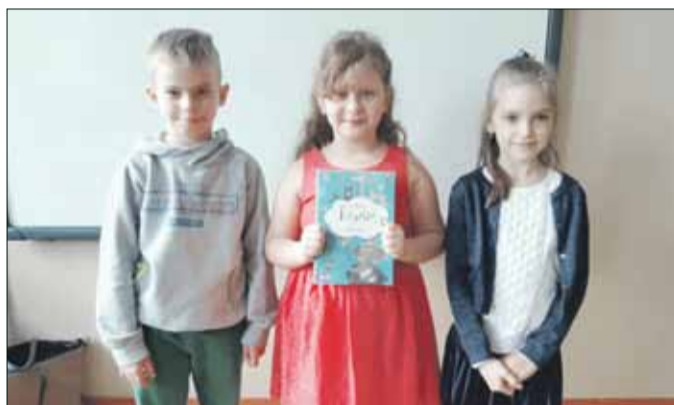
Uczniowie zaprezentowali utwory Juliana Tuwima

W Publicznej Szkole Podstawowej nr 4 w Strzelinie już od najmłodszych lat dbają o rozwój artystyczny uczniów. W marcu, w klasach pierwszych odbyły się konkursy recytatorskie. Wszyscy pięknie zaprezentowali wybrane przez siebie wiersze Juliana Tuwima. Gratulacje należą się wszystkim uczestnikom, szczególnie tym, którzy oprócz ekspresyjnej recytacji zadbał o rekwizyty do wybranego utworu. Zdobywcy pierwszych miejsc będą reprezentować klasy w Szkolnym Konkursie Recytatorskim.