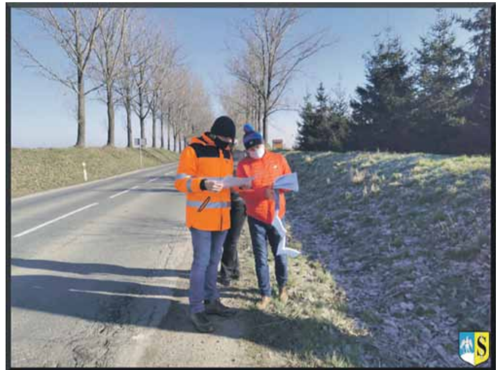
W pierwszej połowie marca w Szczodrowicach odbyła się wizja lokalna, w której uczestniczyli przedstawiciele strzeleńskiego magistratu oraz DSDiK we Wrocławiu

Zgodnie z deklaracjami inwestycja będzie współfinansowana (w wysokości