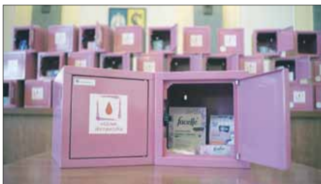
Takie różowe skrzyneczki trafiły m.in. do szkół podstawowych i ponadpodstawowych

Strzeleński samorząd zakupił już kilkadziesiąt charakterystycznych różowych skrzynek, które trafiły do naszych lokalnych szkół podstawowych i ponadpodstawowych. Gmina przekazała skrzynki z zaopatrzeniem, ale o ich regularne uzupełnianie muszą już zadbać szkoły. - Dojrzenie dziewczynek to bardzo ważny okres w ich życiu. Wspólnie postaramy się, aby miały dostęp do środków higieny osobistej i czuły się bezpiecznie