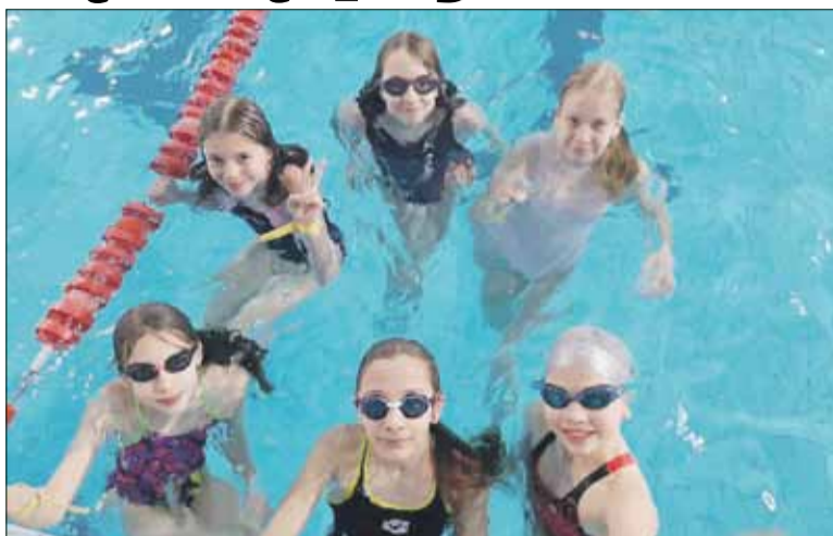
Zajęcia dla dzieci na basenie wróca, gdy tylko będzie to możliwe

Zgodnie z wytycznymi Dolnośląskiej Federacji Sportu nauki pływania dla najmłodszych będą odbywały się raz w tygodniu po 2 godziny lekcyjne przez kilka miesięcy. Zajęcia prowadzone będą w podziale na 15-osobowe grupy przez wykwalifikowaną kadrę instruktorów, pod nadzorem ratowników. Największym plusem projektu jest bezpłatna szansa na dodatkową aktywność fizyczną na krytej pływalni, dzięki której najmłodsi zdobędą podstawową wiedzę z zakresu umiejętności ply-