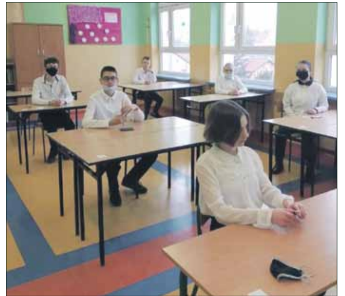
Do próbnego egzaminu ósmoklasisty przystąpili m.in. uczniowie PSP nr 4 w Strzelinie

W drugiej połowie marca uczniowie ósmych klas szkół podstawowych pisali próbny egzamin ósmoklasisty. Młodzież rozwiązywała zadania z języka polskiego, matematyki i wybranego języka obcego. Egzamin przeprowadzany był stacjonarnie w szkołach, z zachowaniem reżimu sanitarnego. Przystąpili do niego również uczniowie szkół z gminy Strzelin. Sprawdzeniem testów zajmują się nauczyciele z placówek, w których przeprowadzono egzamin. Kompleksowe wyniki poznamy niebawem. Przystąpienie do egzaminu było dobrowolne. Niewątpliwie była to jednak doskonała okazja dla uczniów do zweryfikowania swojej wiedzy i przygotowania się do właściwego egzaminu, która ma odbyć się w maju.