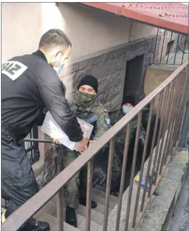
Przy rozładunku żywności pomagali druhowie z OSP Nowolesie oraz członkowie Związku Strzeleckiego „Strzelec”

W Parku Miejskim w Strzelinie, przy zapleczu odkrytego basenu, od pon. do pt. w godzinach od 9:00 do 12:45 działa mobilny punkt pobierania wymazów. Punkt będzie dostępny co najmniej do 2 kwietnia.