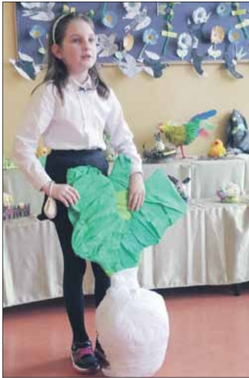
Uczestnicy konkursu z zaangażowaniem recytowali wiersze Juliana Tuwima