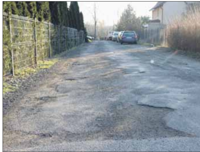
Ulica Chopina w Strzelinie zyska nową nawierzchnię oraz oświetlenie

Dwie inwestycje zrealizuje lokalny samorząd na ulicy Chopina w Strzelinie. Przypomnijmy, że remont drogi zapisano już w projekcie budżetu na 2021 r., uchwalonym na grudniowej sesji Rady Miejskiej Strzelina. Gmina chce przeznaczyć na ten cel 200 tys. zł. Podczas marcowej sesji radni zaakceptowali propozycję burmistrz Doroty Pawnuk i wprowadzili do budżetu budowę oświetlenia ulicznego. W uzasadnieniu do projektu uchwały podkreślono, że na ulicy Chopina znajduje się m.in. budynek socjalny a brak oświetlenia jest bardzo uciążliwy dla lokalnej społeczności. Wykonanie takiej inwestycji z pewnością wpłynie na poprawę bezpieczeństwa mieszkańców, a w szczególności mieszkających w tej okolicy dzieci. Na budowę oświetlenia zaplanowano 40 tys. zł.