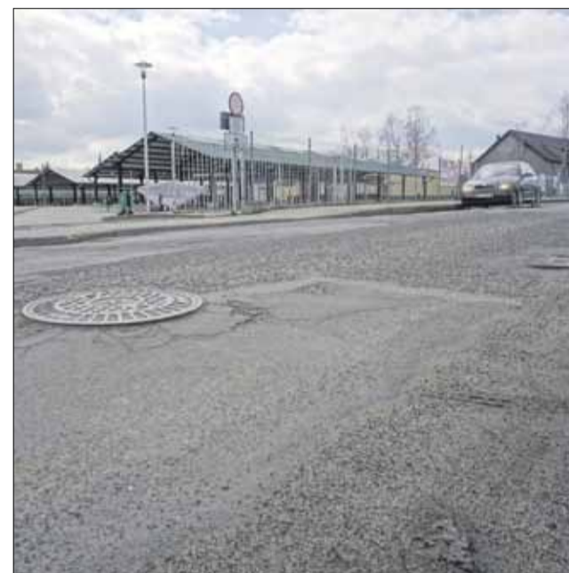
RED Ulica Okulickiego jest w kiepskim stanie i wymaga naprawy