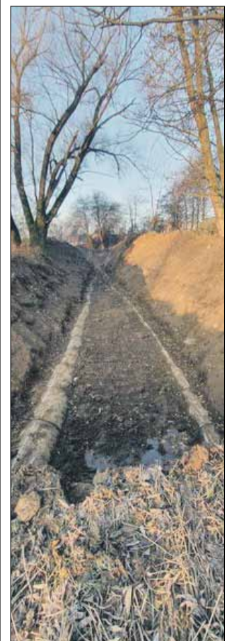
Remont dotyczy odcinka pomiędzy kanałem Młynówki a rzeką Olawą