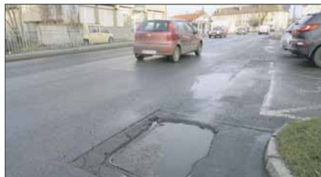
Poznaliśmy wykonawcę modernizacji ulicy Wolności w Strzelinie

Mamy dobrą wiadomość. W drugiej połowie kwietnia Dolnośląska Służba Dróg i Kolei we Wrocławiu wyłoniła w drodze przetargu wykonawcę. Najkorzystniejszą ofertę złożyła firma Berger Bau Polska z Wrocławia. Modernizacja ulicy Wolności będzie kosztowała nieco ponad 4,5 mln zł, w tym