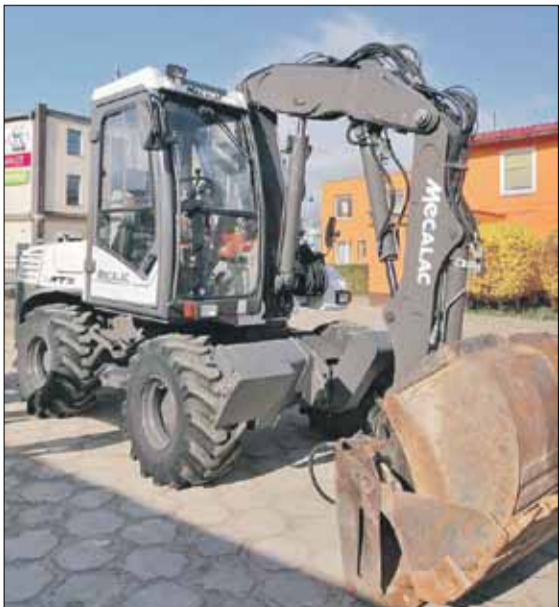
Koparko-ladowarka będzie służyć do prac drogowych

Ciemniej na trzech strzelińskich ulicach