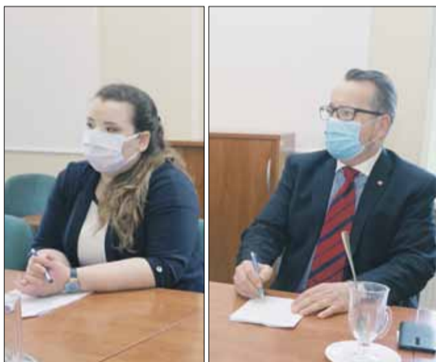
W spotkaniu uczestniczyli przedstawiciele DTBS

O przydziale mieszkań poszczególnym osobom decydować będzie gmina Strzelin w oparciu o kryteria, które w pierwszej kolejności