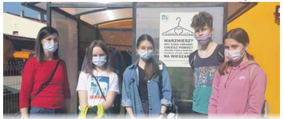
Wolontariusze PSP nr 4 w Strzelinie przekazali do szafy społecznej ubrania

W Strzelinie już od ponad półtora roku funkcjonuje tzw. Lodówka Społeczna, która znajduje się na parkingu obok Strzebińskiego Ośrodka Kultury w Strzelinie przy ul. Mickiewicza 2. Przypominamy, że lodówka jest cały czas otwarta. Każdy mieszkaniec może podzielić się żywnością. Idea jest prosta - wkładasz jedzenie do lodówki (ważne, aby było nieprzeterminowane), a każda osoba potrzebująca może takim jedzeniem się poczęstować. Dzięki temu zamiast wyrzucać nadmiar jedzenia, dzielisz się nim z każdym, kto tego potrzebuje. Zachęcamy do korzystania. Do lodówki można włożyć konserwy, jogurty, pieczywo, sery, owoce czy przygotowane w domu potrawy, których po prostu zrobiliśmy za dużo.