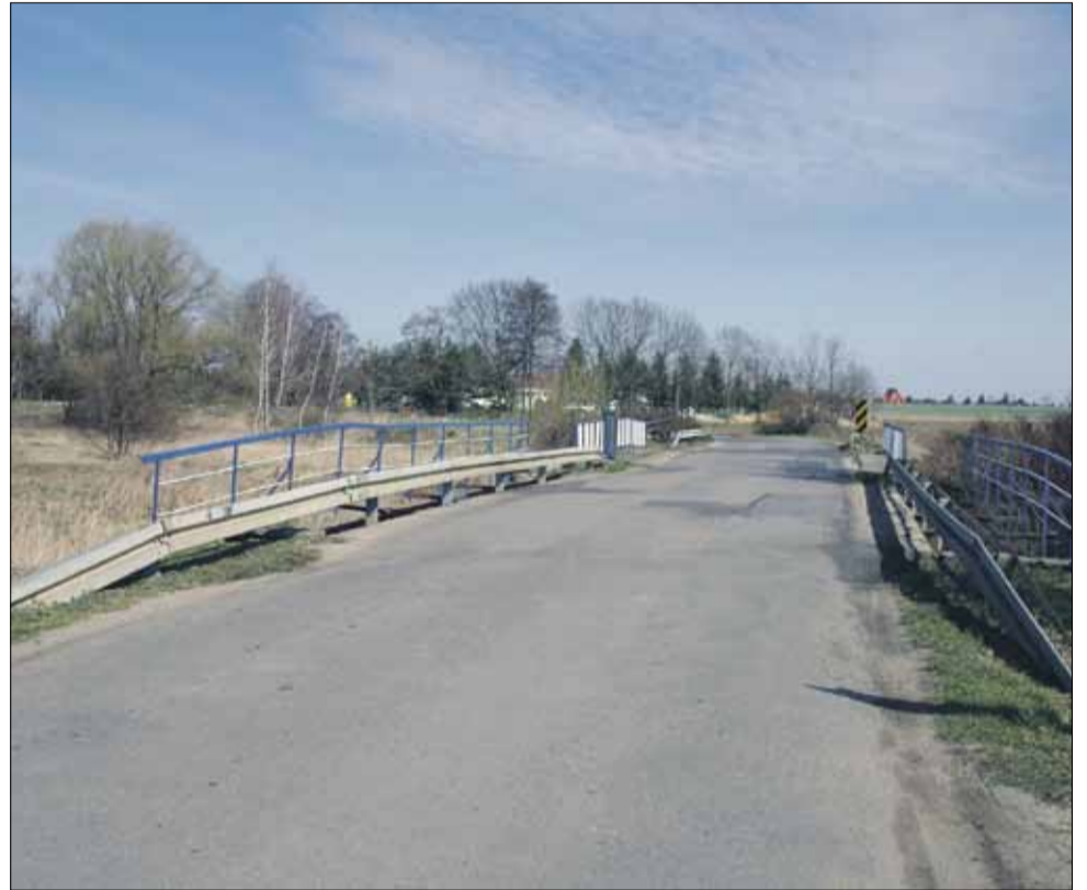
Most na ul. Brzegowej w Strzelinie jest w złym stanie technicznym i wymaga naprawy

przygotowana i to właśnie dlatego zadanie wprowadzono do budżetu. Na wykonanie dokumentacji zapisano 95 tys. zł. Kwota robi wrażenie, ale też pokazuje jak kosztownym, finansowym wyzwaniem będzie dla strzeLińskiego samorządu ta inwestycja. Burmistrz Dorota Pawnuł nie kryła do takiej inwestycji w pełni