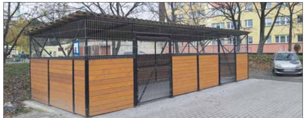
W ubiegłym roku w ramach dotacji wykonano m.in. wiat śmietnikowy, która służy mieszkańcom budynków usytuowanych przy ul. Staszica

Rodzinne Ogrody Działkowe, wspólnoty i spółdzielnie mieszkaniowe z terenu gminy Strzelin mogą wnioskować o dotacje na realizację określonych zadań. Chodzi m.in. o zakup i montaż kamer, poprawę infrastruktury ogrodowej czy budowę wiat śmietnikowych. Do kiedy jest czas na złożenie wniosku?