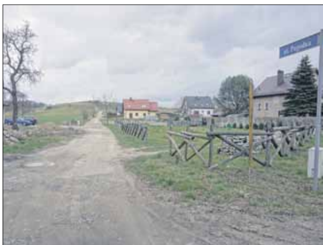
Dokumentacja techniczna ul. Pogodnej ma dotyczyć remontu nawierzchni oraz oświetlenia