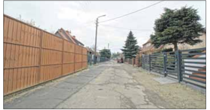
RED Strzełiński magistrat zlecił już opracowanie dokumentacji projektowej remontu ul. Żwirki i Wigury

Mieszkańcy Osiedla Piastowskiego w Strzelinie w ubiegłym roku zdecydowali, że tegoroczne środki finansowe w ramach funduszu osiedlowego przeznaczą w całości na opracowanie dokumentacji technicznej remontu ulicy Żwirki i Wigury. Przypomnijmy, że jest to wąska ulica jednokierunkowa, która łączy się z drogą gminną – ul. Grunwaldzką oraz ul. Bolesława Chrobrego. Strzełiński magistrat wyłonił już projektanta. Do niego należy m.in. ocena stanu technicznego drogi, kanalizacji deszczowej (po jej oczyszczeniu i zmonitorowaniu) oraz zaproponowanie korzystnych rozwiązań. Powstała dokumentacja techniczna uzgodniona zostanie również z właścicielami sieci, dlatego też będą oni mieli okazję poinformować o swoich ewentualnych zamierzeniach inwestycyjnych. Po otrzymaniu wstępnej koncepcji dokumentacji technicznej, strzełiński magistrat chciałby zorganizować spotkanie z mieszkańcami ulicy Żwirki i Wigury. Będzie to jednak uzależnione od zasad bezpieczeństwa związanych z epidemią COVID-19.