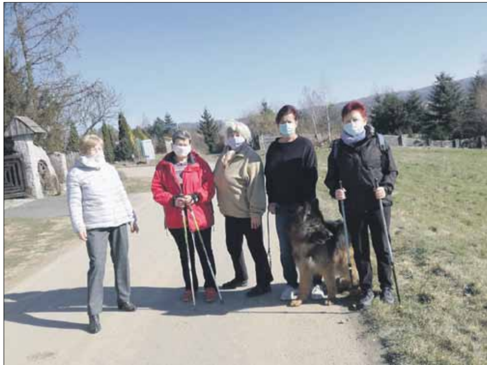
Jednym ze sposobów spędzania czasu wolnego jest nordic walking