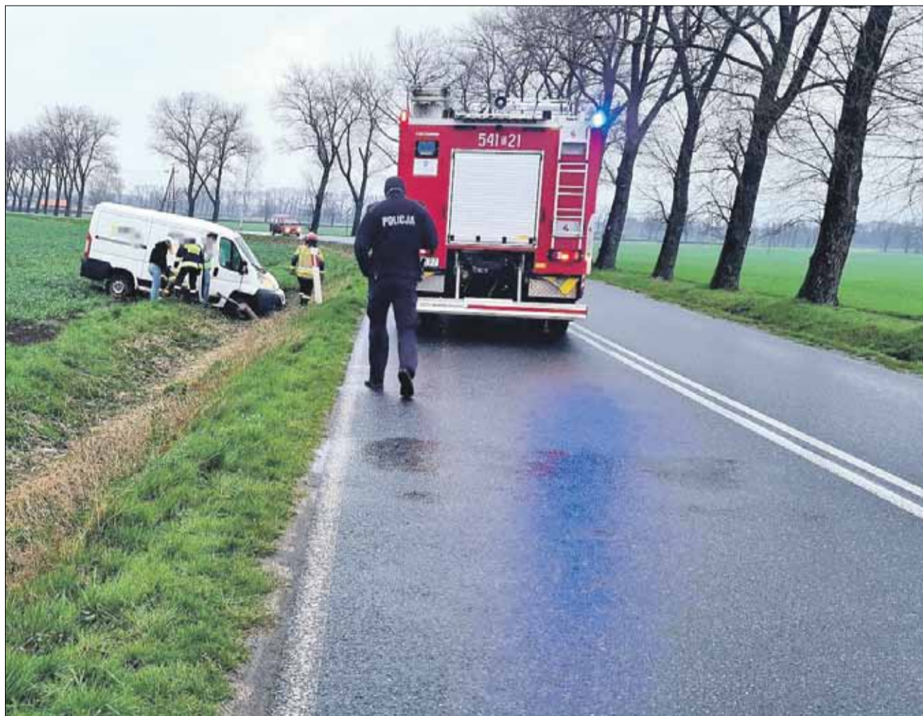
Na tzw. „esach” między Strzelinem a Ludowem Polskim często dochodzi do wypadków

Na początku kwietnia przedstawiciele władz samorządowych gmin: Strzelin, Wiązów, Ziębice, Borów, Przeworno oraz Żórawina zwrócili się z wnioskiem do zarządu województwa dolnośląskiego o pilnej potrzebie przebudowy drogi wojewódzkiej nr 395. Taką możliwość dają m.in. środki w ramach Rządowego Fun-