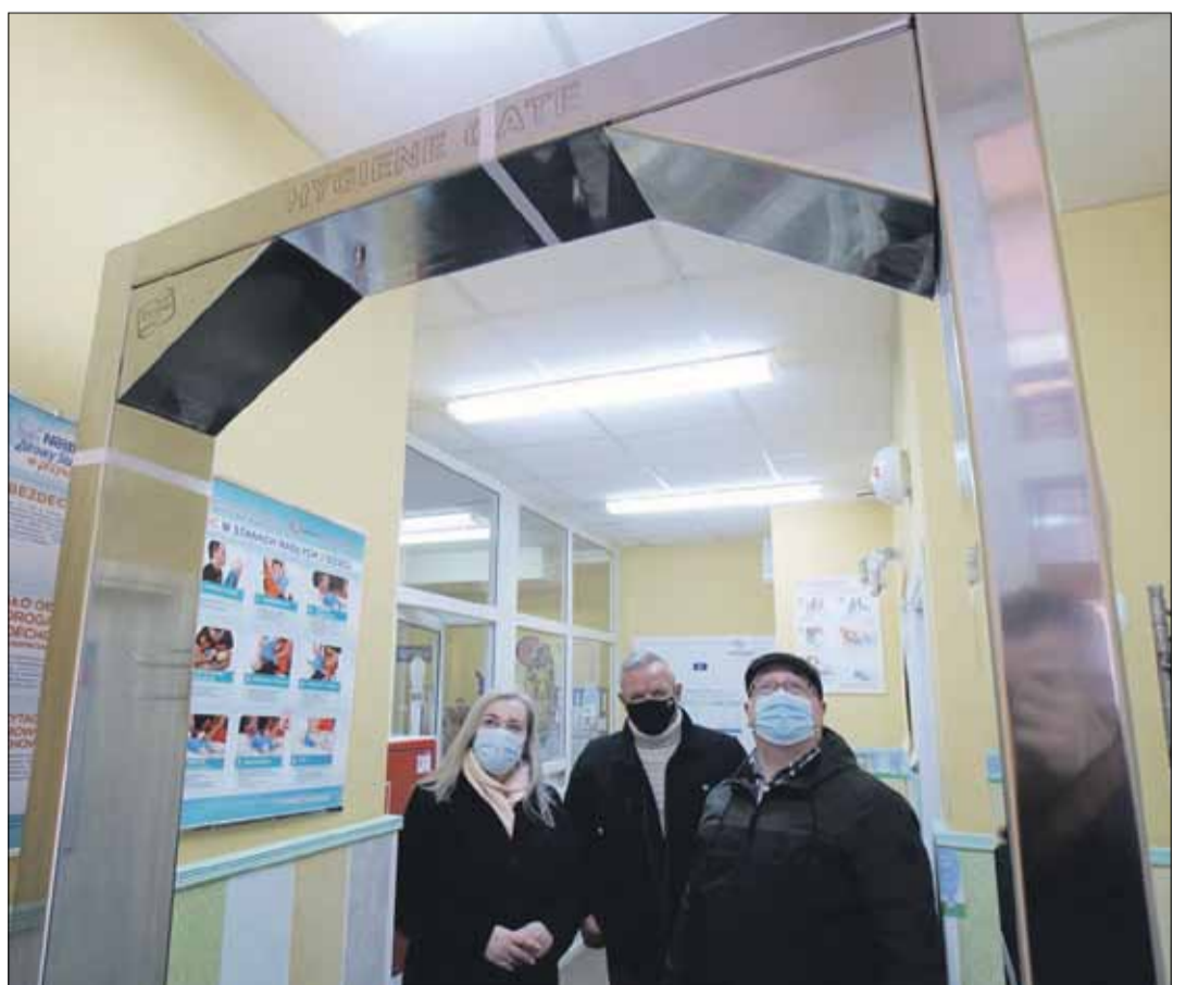
Kurtyna zakupiona przez strzełińską cukrownię