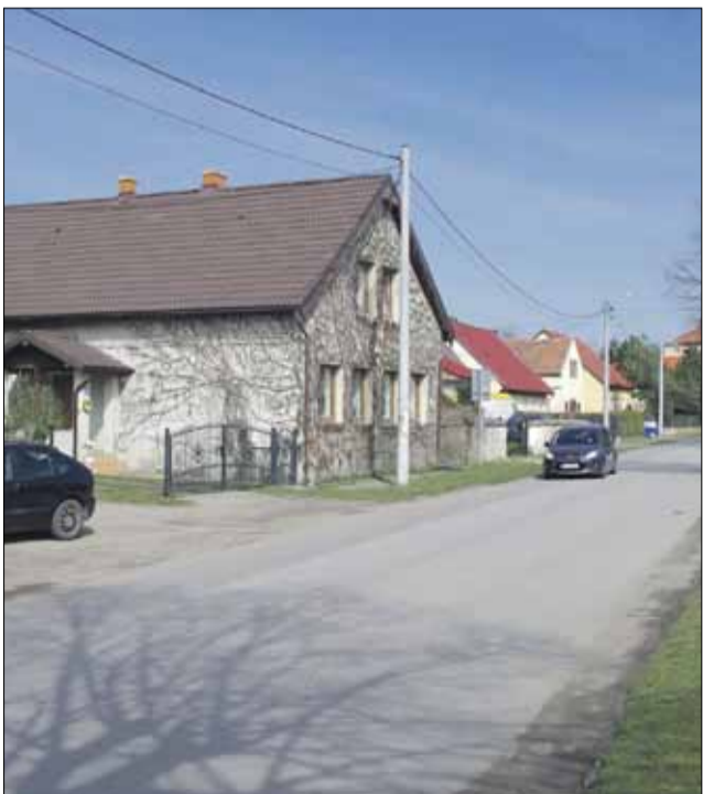
W Szczawinie planowany jest kolejny etap budowy chodnika