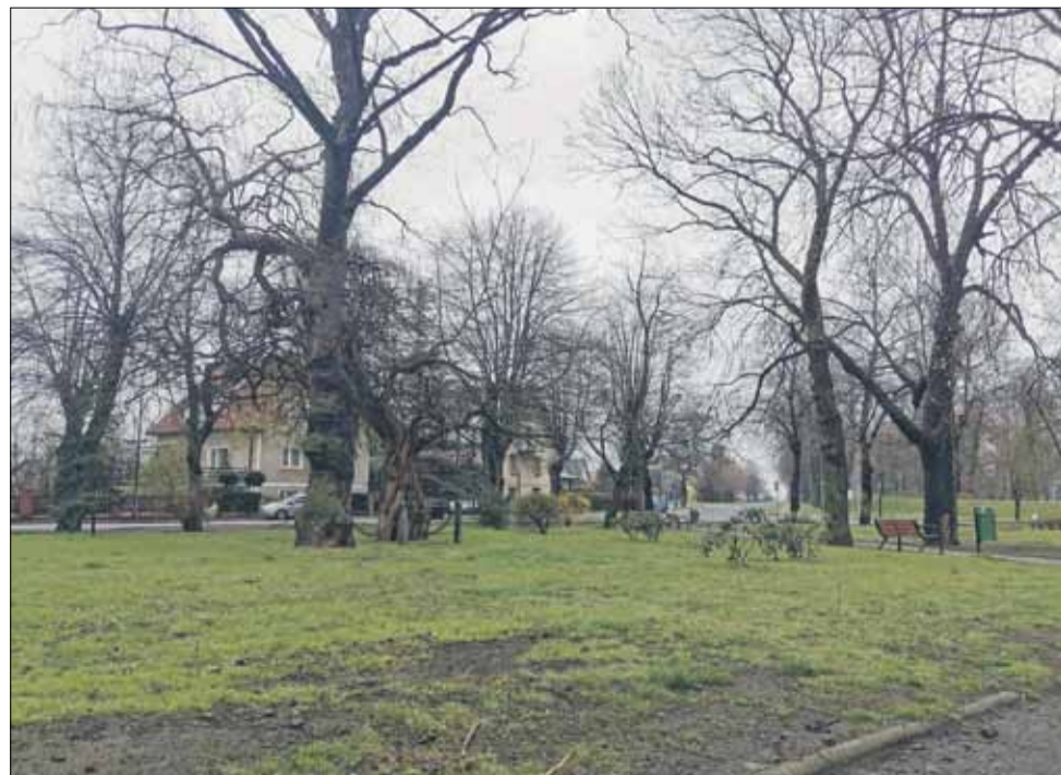
O nadanie nazwy miejskiemu skwerowi zlokalizowanemu przy skrzyżowaniu ulic Staszica i Michała Archanioła wnioskowała strzeleńska organizacja kombatancka

Taką nazwę nosi od niedawna miejski skwer zlokalizowany przy skrzyżowaniu ulic Staszica i Michała Archanioła. O nadanie nazwy wnioskował do władz gminy lokalny oddział Związku Kombatantów RP i Byłych Więźniów Politycznych, a na skwerze ma być w przyszłości kamień z tablicą, upamiętniający kombatantów walczących o wolność i niepodległość Polski. Warto podkreślić, że inicjatywa naszej organizacji kombatanckiej uzyskała wcześniej pozytywne opinie konserwatora zabytków, Instytutu Pamięi Narodowej, gminnego zespołu ds. nadawania nazw oraz komisji gospodarki komunalnej, rolnictwa i ochrony środowiska. Dodajmy, że na marcowej sesji projekt uchwały poparli wszyscy uczestniczący w obradach radni Rady Miejskiej Strzelina.