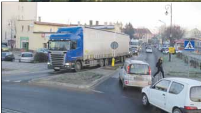
Problemem na strzelińskim rondzie są m.in. zbyt blisko usytuowane przejścia dla pieszych