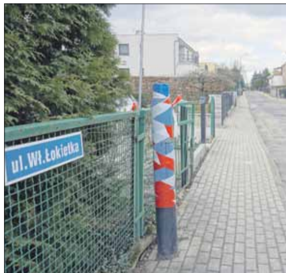
Słupy oświetleniowe zdemontowano m.in. na ul. Władysława Łokietka

Niedawno spółka Tauron poinformowała strzeliński magistrat o usunięciu w awaryjnym trybie ponad 20 słupów oświetleniowych. To efekt przeprowadzonych oględzin stanu technicznego sieci oświetlenia na trzech ulicach: Grunwaldzkiej, Władysława Łokietka i Józefa Poniatowskiego. Podczas oględzin stwierdzono zły stan techniczny słupów, ich liczne uszkodzenia a także widoczną korozję. 23 słupy, będące w najgorszym stanie, zdemontowano. Obecnie Tauron prowadzi procedurę odtworzenia zdemontowanych słupów oraz wymiany pozostałych słupów na trzech wspomnianych ulicach.