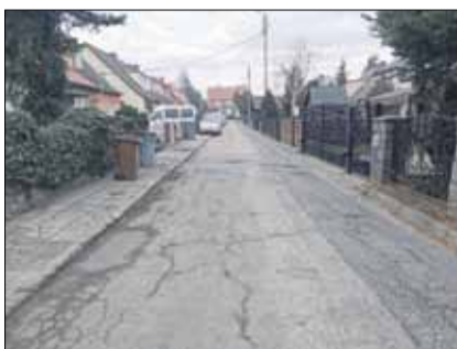
Gmina Strzelin zleciła wykonanie dokumentacji technicznej na remont ul. Matejki w Strzelinie

W bieżącym roku strzeleński magistrat zaplanował remont ulicy Matejki w Strzelinie. Jest to wąska, jednokierunkowa ulica, która łączy się z drogą gminną – ul. Słowackiego oraz ul. Wrocławską, czyli drogą wojewódzką nr 395. Gmina