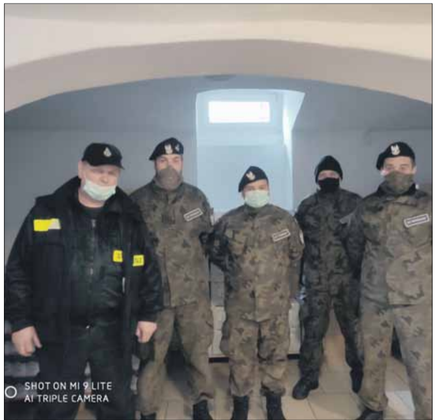
Przy rozładunku żywności pomagali członkowie Związku Strzeleckiego „Strzelec” oraz druhowie z OSP w Broźcu

W połowie kwietnia do Gminnego Ośrodka Pomocy Społecznej w Strzelinie przyjechała kolejna partia żywności w ramach Programu Operacyjnego Pomoc Żywnościowa 2014-2020 współfinansowanego z Europejskiego Funduszu Pomocy Najbardziej Potrzebujących - Podprogram 2020. Tym razem dostarczono ponad 6 ton produktów, wśród których znalazły się m.in. cukier, fasolka po bretońsku, groszek z marchewką, makaron, olej, ryż, szynka drobiowa. Przypomnijmy, że z pomocy korzysta 336 potrzebujących rodzin (684 osoby). Na jedną osobę przypada nieco ponad 42 kg żywności. Strzeliński GOPS składa serdeczne podziękowania Związkowi Strzeleckiemu „Strzelec” oraz druhom z Ochotniczej Straży Pożarnej w Broźcu za pomoc przy rozładunku żywności.