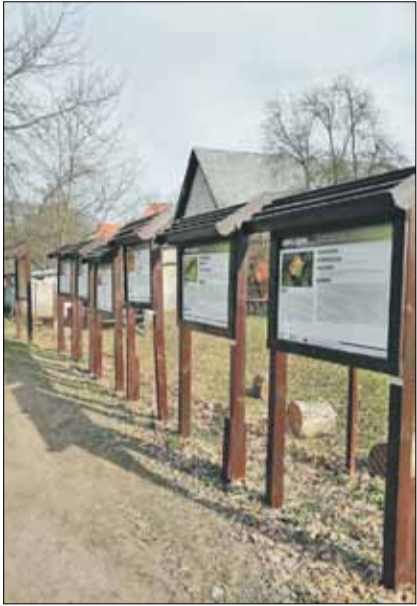
Pracownicy CUKiT przeprowadzili m.in. renowację tablic informacyjnych w Gościęcicach i Nowolesiu

Warto dodać, że na cmentarzu na terenie osiedla „Na Skarpie” wyremontowany został mur od strony drogi. Pracownicy CUKiT zamontowali piłkochwyty w Piotrowicach, pomalowali ławki na terenie skwerów w mieście, odrestaurowali kilkadziesiąt tablic informacyjnych w Gościęcicach i Nowolesiu. Nie zapomniano również o placach zabaw, gdzie nawieziono i wymieniono piasek, naprawiono urządzenia i ogrodzenia. Do ważnych zadań należało także utwardzenie wraz z wyłożeniem kostką betonową podjazdu do wiaty śmietnikowej na ul. Konopnickiej, a następnie montaż konstrukcji wiaty stalowej. Nasadzono również bratki w donicach w strzelińskim Rynku.