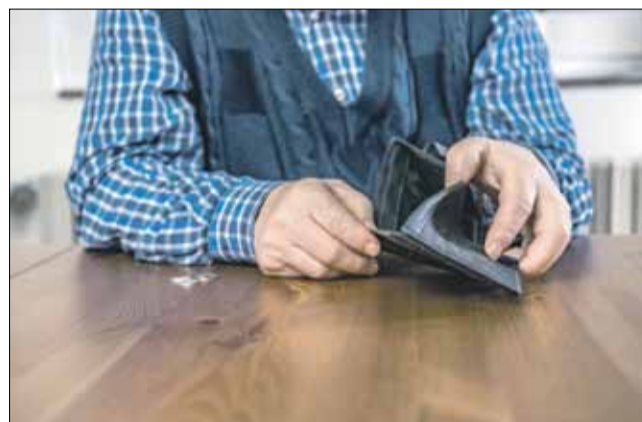
Oszuści wykorzystują coraz to nowsze sposoby do wyłudzenia pieniędzy od seniorów (zdj. ilustracyjne)

Jak podaje strzeleńska policja w naszym powiecie w ubiegłym roku odnotowano 3 przestępstwa na seniorach, zaś w 2019 r. był ich aż 16. Oszuści posługiwali się głównie wyłudzeniami na tzw. „wnuczka”.