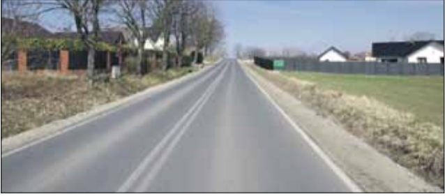
Strzeleński magistrat planuje zamontowanie oświetlenia na ul. Nyskiej

Wykonanie dokumentacji technicznej budowy oświetlenia drogowego przy ul. Nyskiej i na odcinku ulicy Brzegowej (od ZWiK-u w kierunku skrzyżowania z ul. Wojska Polskiego).