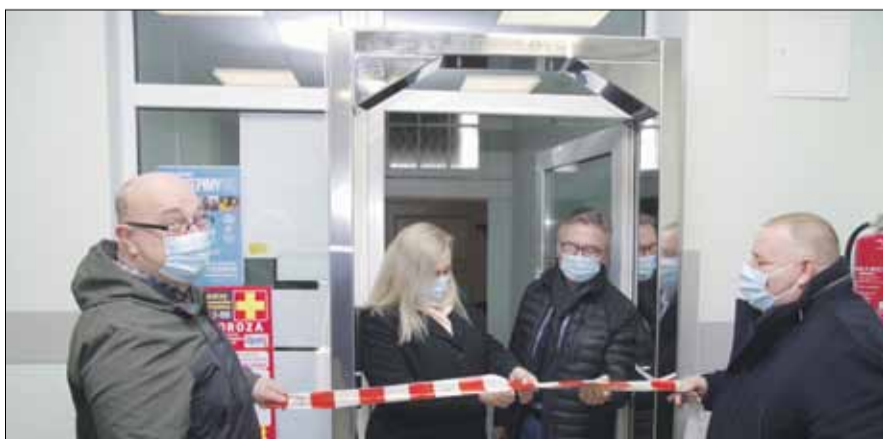
Uroczyste przekazanie kurtyny ufundowanej przez spółkę Sievert