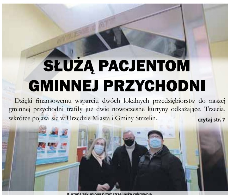
Kurtyna zakupiona przez strzelińską cukrownię