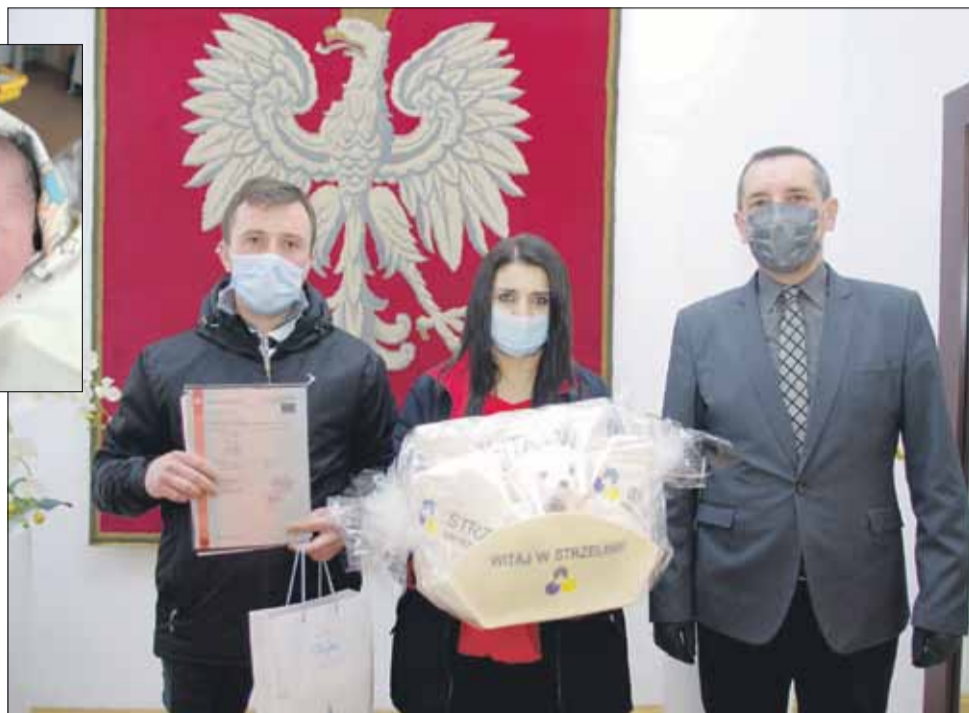
Rodzice dziewczynki odebrali w strzełińskim urzędzie akt urodzenia oraz specjalnie przygotowaną wyprawkę

cuje tam 6 lekarzy. W placówce mają odbywać się porody rodzinne. Obecnie ze względu na pandemię nie jest to możliwe. Jak informuje kierownik