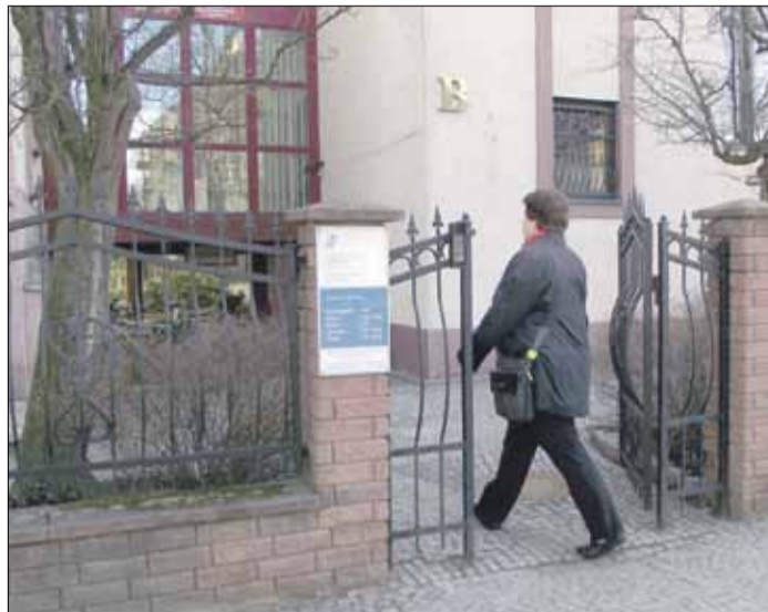
Do końca kwietnia podatnicy mają czas, aby rozliczyć się z fiskusem

i odliczeń można skorzystać wyłącznie w sytuacji, jeśli spełnione są wszystkie warunki uprawniające do ich zastosowania, określone w obowiązujących przepisach prawa. Polecamy w tym celu skorzystać z informacji zamieszczonych w serwisie internetowym www.podatki.gov.pl lub infolinii Krajowej Informacji Skarbowej tel. 801 055 055 (dla połączeń z telefonów stacjonarnych) i 22 330 03 30 (dla połączeń z telefonów komórkowych).