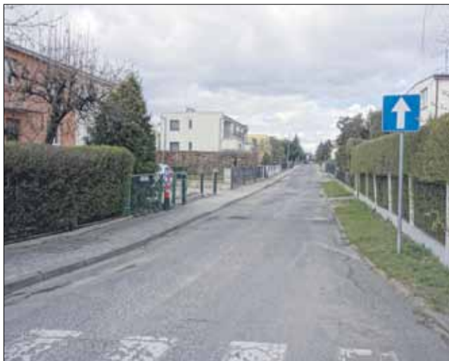
Pod koniec kwietnia upływa termin składania ofert na przebudowę ul. Łokietka w Strzelinie

Panuje tam wzmożony ruch, zwłaszcza w dni targowe