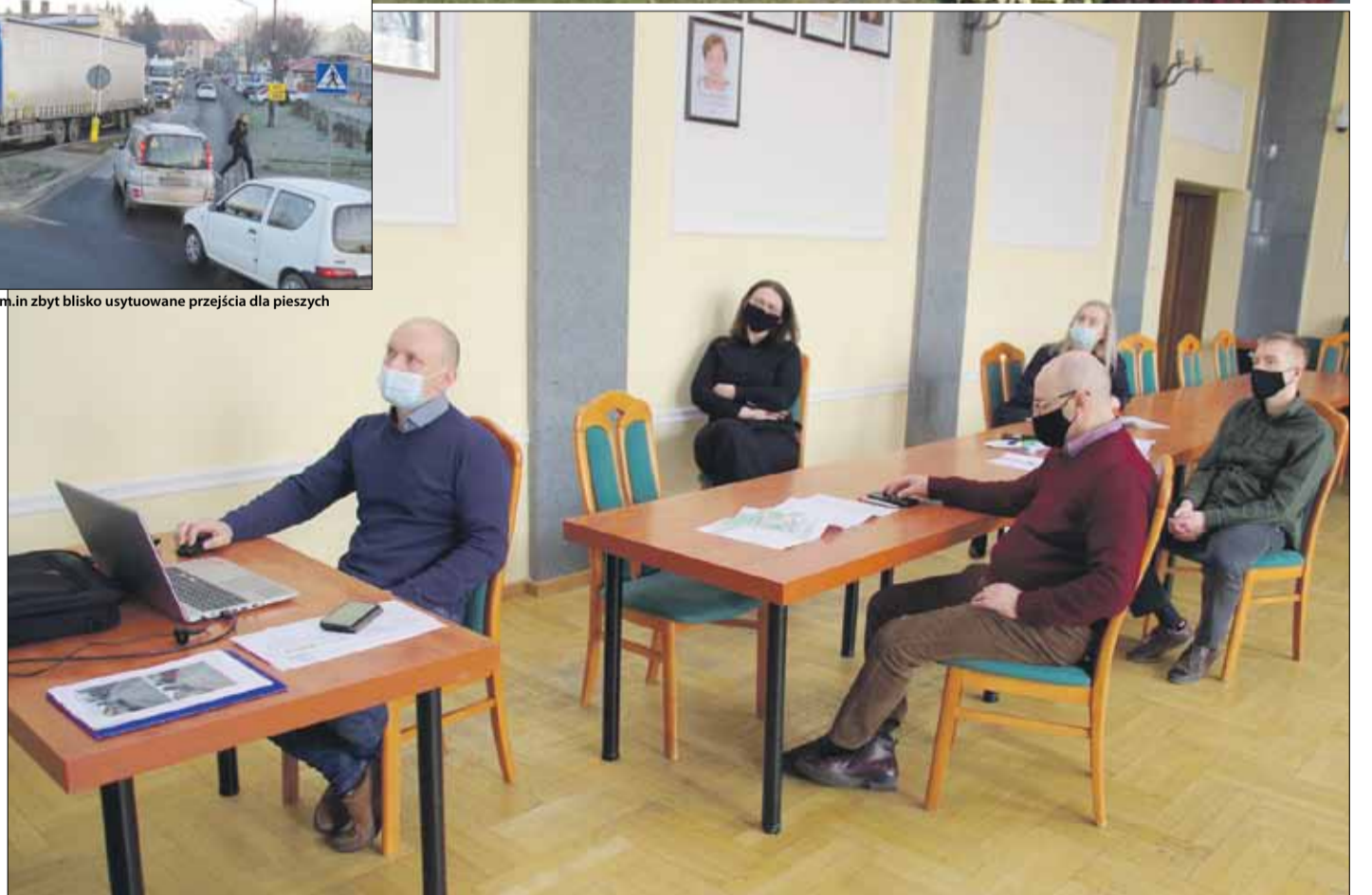
W strzelińskim magistracie odbyło się niedawno kolejne spotkanie dotyczące przebudowy ronda