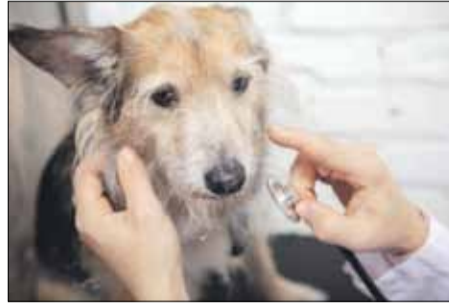
Gmina Strzelin podpisała umowy dotyczące opieki nad bezdomnymi zwierzętami (fot. ilustracyjne)

Przypomnijmy również, że odławianie bezdomnych psów, przetrzymywanie ich w schronisku oraz zapewnienie im niezbędnej opieki weterynaryjnej realizuje świdnickie schronisko dla zwierząt prowadzone przez Fundację „Mam Pomysł”. Gabinet Weterynaryjny „Kozica” na zlecenie gminy zajmuje się natomiast zabiegami sterylizacji, kastracji, wykonywaniem pakietu leczenia oraz zapewnieniem całodobowej opieki wetery-