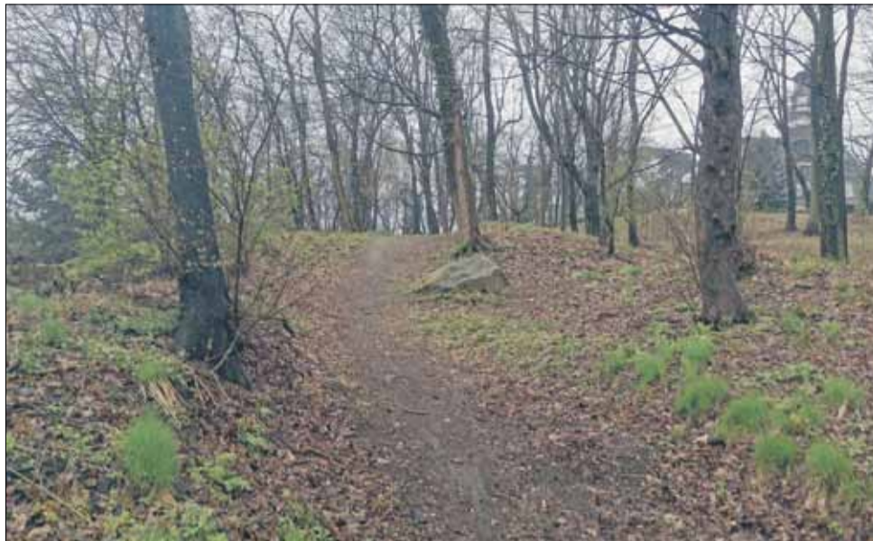
Zagospodarowanie części Parku Miejskiego zakłada m.in. remont alejek umożliwiających dojście do planowanego placu

Wykonany zostanie plac o nawierzchni z kostki kamiennej oraz płyt kamiennych wraz z remontem alejek umożliwiających dojście do placu. Powierzchnia zagospodarowanego terenu wyniesie ponad 300 m 2 . Przy pomniku ustawione zostaną ławeczki, kosze na śmieci oraz tablice informacyjne i regulamin. Zakres prac nie obejmuje wymiany nawierzchni drogi dojazdowej prowadzącej od ul. Okrzei. Działania realizowane w ramach projektu przyczynią się do głębszego poznania historii i krajobrazu regionu,