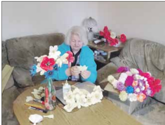
W ostatnim czasie członkinie stowarzyszenia pracowały nad stworzeniem palmy, która stała w miejscowym kościele