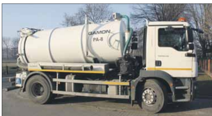
Regularne wywożenie nieczystości spoczywa na właścicielach nieruchomości (fot. ilustracyjne)

Za naszym pośrednictwem urzędniczka przypomina rów-