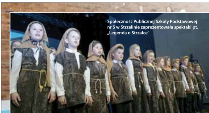
Społeczność Publicznej Szkoły Podstawowej nr 5 w Strzelinie zaprezentowała spektakl pt. „Legenda o Strzałce”