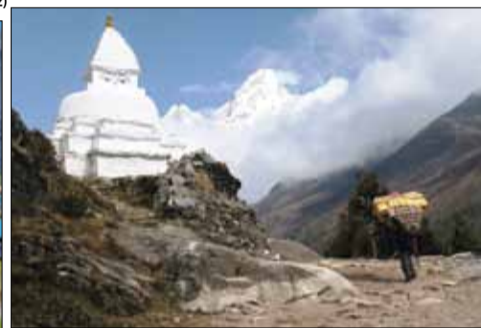
Tak podróżują w górach tamtejsi mieszkańcy (po lewej stronie buddyjska budowla sakralna w kształcie kopca, zaś w tle szczyt Ama Dablam 6812 m n.p.m)

ciekawe samoloty lądują na pasie pod górę – przyznaje Sobotnicki. Celem wyprawy było zdobycie szczytu Lobuche Peak (6119 m n.p.m), skąd roztacza się widok na Mount Everest. Kolejnym punktem wyprawy miała być góra Ama Dablam (6856 m n.p.m).