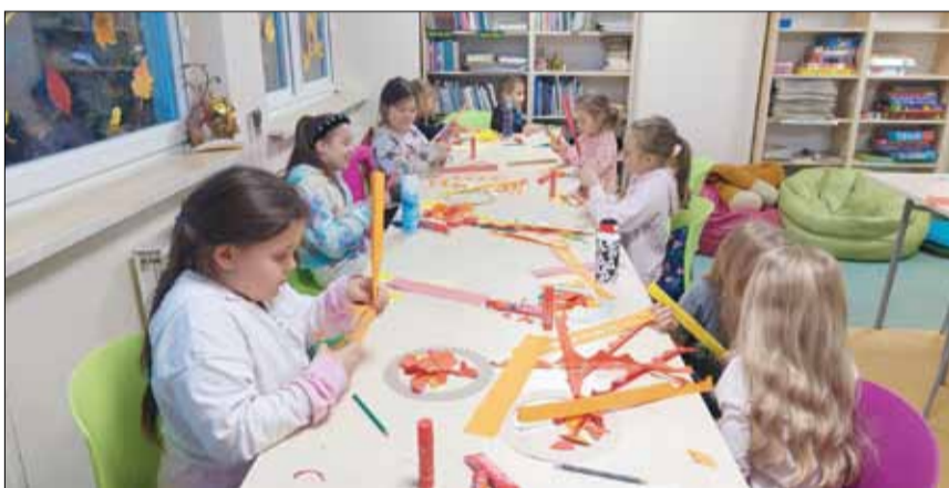
Dzieci pracowały z dużą przyjemnością i zaangażowaniem

Kolejne warsztaty plastyczne w strzelińskiej bibliotece poświęcone były jesieni. Dzieci wykonały fantastyczne wianki, do których najpierw trzeba było wyciąć mnóstwo liści w kolorach jesieni. Pracy było sporo, ale uczestnicy warsztatów świetnie sobie poradzili.