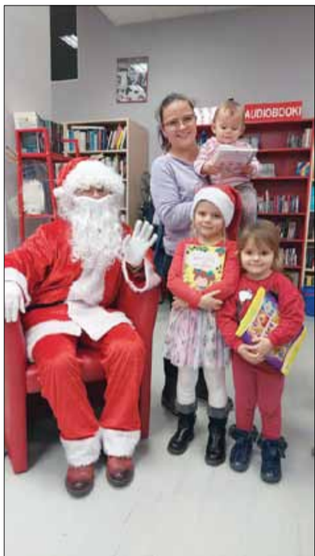
Wizyta niespodziewanego gościa bardzo ucieszyła najmłodszych uczestników warsztatów

Szósty grudnia to szczególny dzień, głównie dla dzieci. W wielu miejscach panuje wesola atmosfera. Taka była również w Miejskiej i Gminnej Bibliotece Publicznej w Strzelinie.