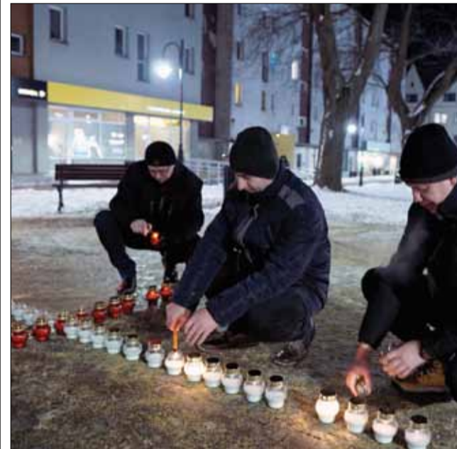
Przedstawiciele strzeleńskiego samorządu zapalili znicze na wschodniej pierzei Rynku