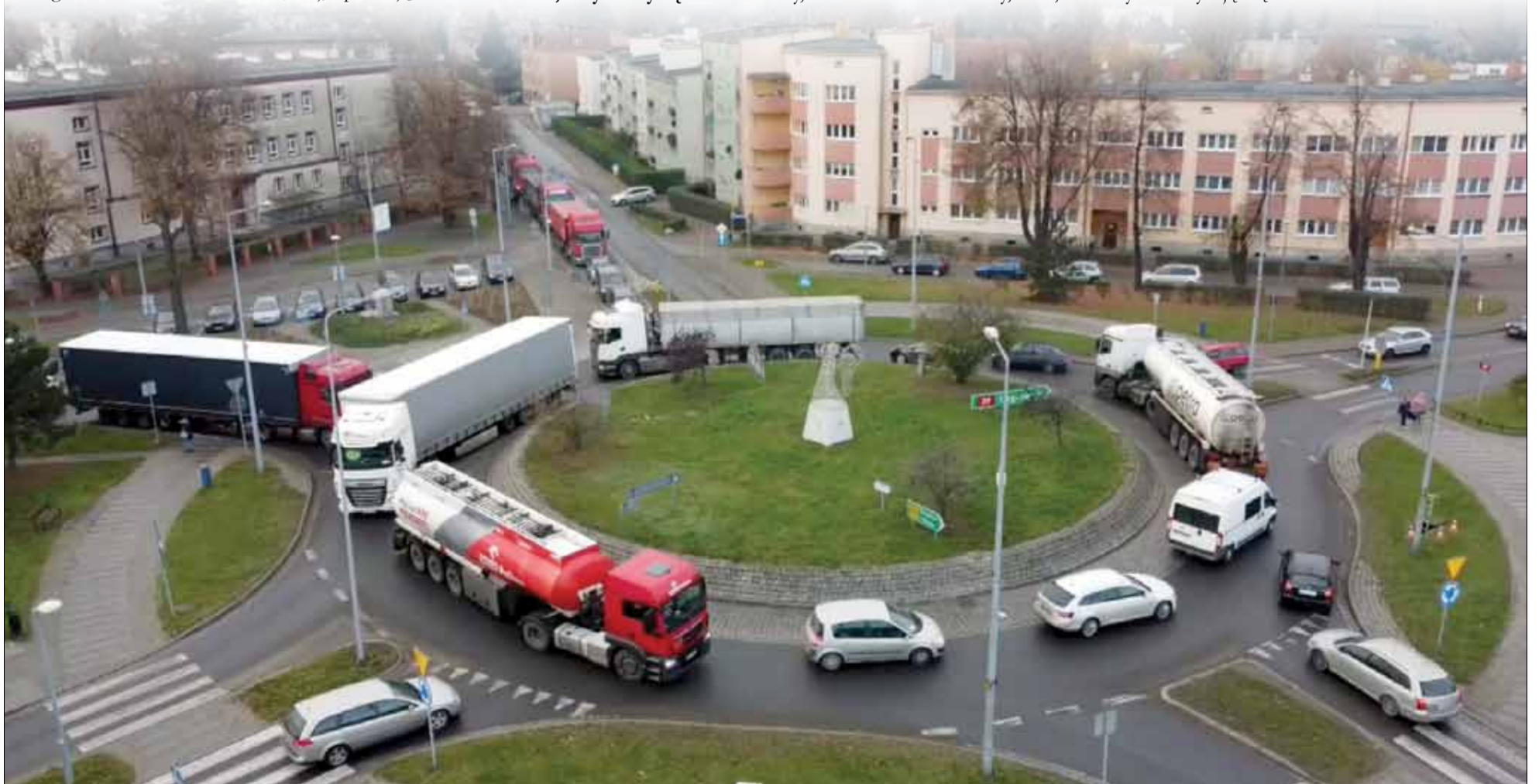
Po raz kolejny, po wytyczeniu objazdu z autostrady A4, nasze miasto zostało zakorkowane głównie przez samochody ciężarowe (zdjęcie z kamery monitoringu miejskiego)