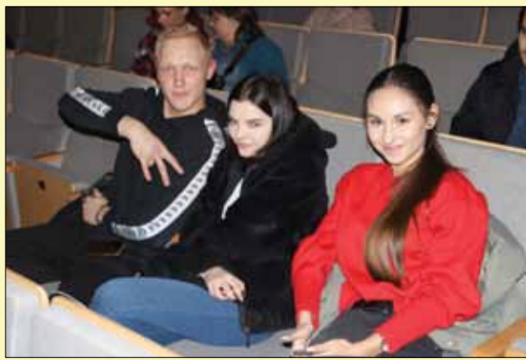
Uroczysta osiemnastka młodzieży urodzonej w 2004 roku odbyła się w Strzeleńskim Ośrodku Kultury