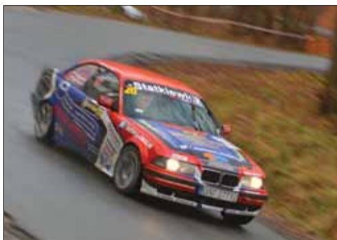
Strzeleńska załoga nie dała szans rywalom podczas 7. Rajdu Wikinga