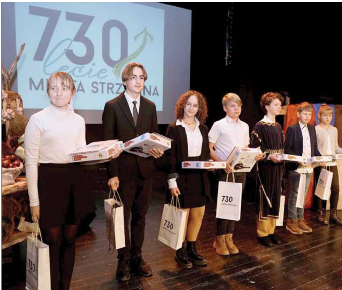
Oto laureaci Gminnego Konkursu Historyczno-Geograficznego