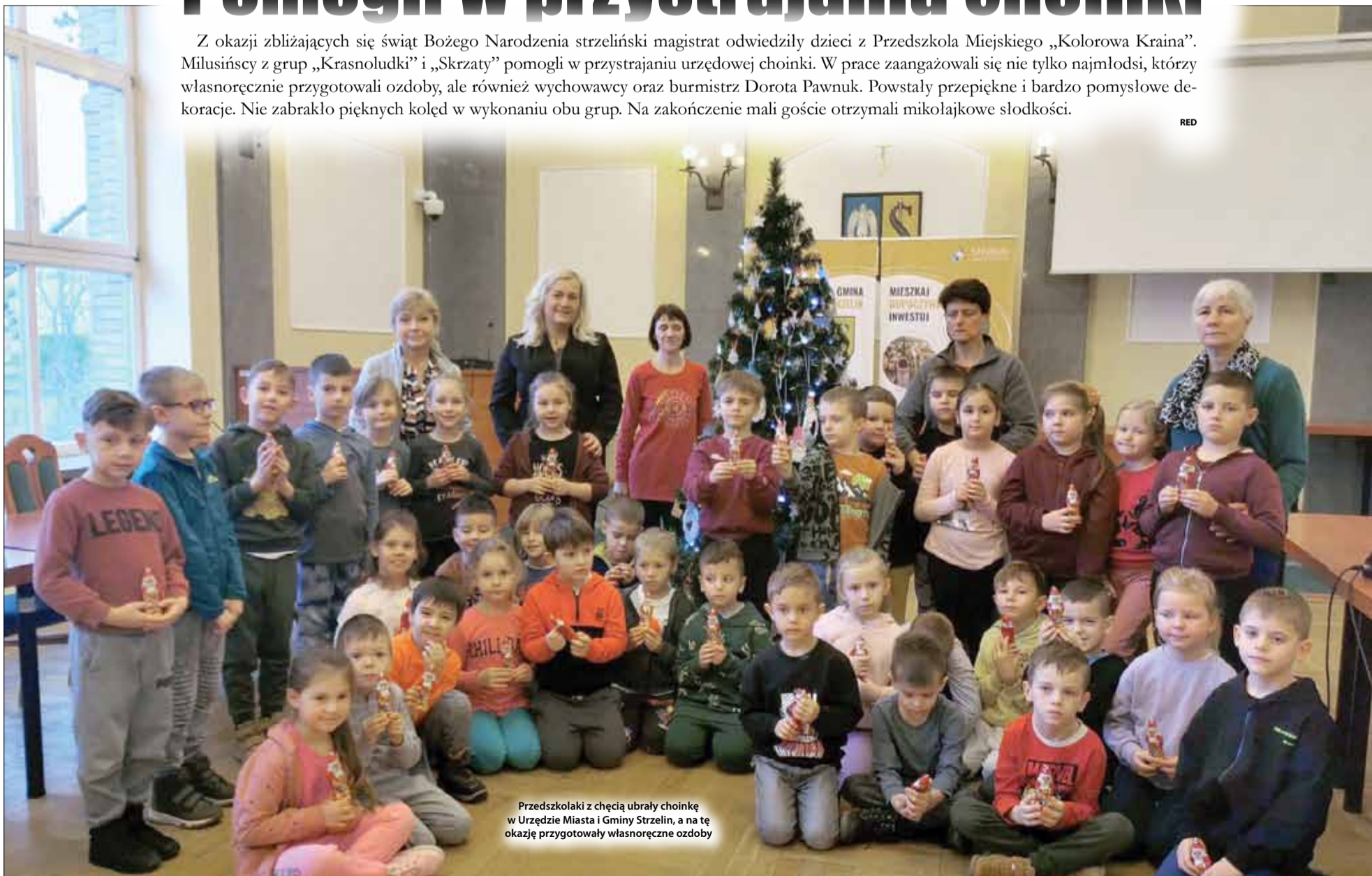
Przedszkolaki z chęcią ubrały choinkę w Urzędzie Miasta i Gminy Strzelin, a na tę okazję przygotowały własnoręczne ozdoby