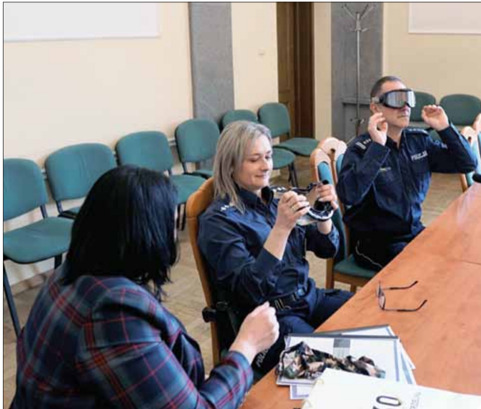
Specjalne gogle symulują m.in. percepcję osób, które spożywały alkohol lub są pod wpływem substancji odurzających