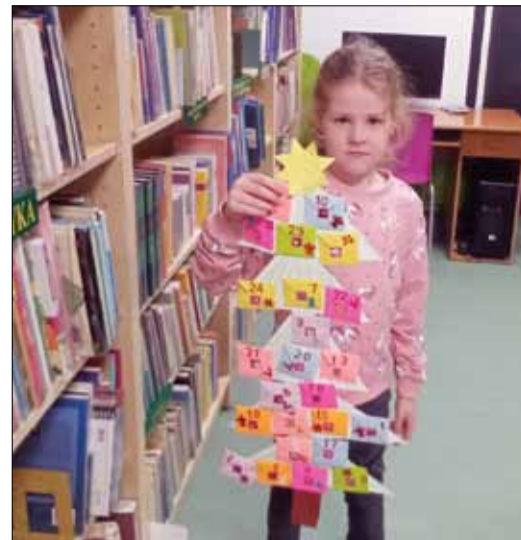
Kalendarze adwentowe dzieci stworzyły wspólnie z rodzicami

W Miejskiej i Gminnej Bibliotece Publicznej w Strzelinie niedawno wznowiono działalność Bajecznej Biblioteki. Są to popołudniowe spotkania dla rodziców z dziećmi (od 3 do 6 lat), które odbywają się w pierwsze i trzecie czwartki miesiąca. Na początku grudnia uczestnicy wspólnie przygotowali kalendarze adwentowe. Na pokolorowanej zielonej kredce papierowej choince dzieci przyklejały zrobione (z pomocą mam) małe kolorowe kopertki z numerkami. Mamy wymyślały też konkretne zadania i niespodzianki na każdy dzień adwentu. Zapewne dzieci z jeszcze większą radością i ciekawością sprawdzały co ich danego dnia spotka.