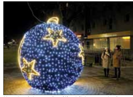
Montażem świątecznych ozdób zajęli się pracownicy Centrum Usług Komunalnych i Technicznych w Strzelinie

Całość została zrealizowana z kostki betonowej. W Gościęcicach oraz na ulicy Staromiejskiej w Strzelinie przeprowadzono prace związane z betonowaniem fundamentów i brukowaniem pod montaż wiat przystankowych.