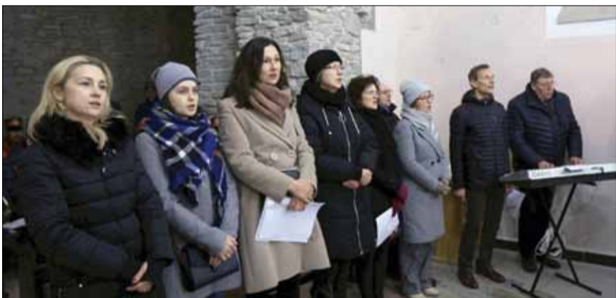
Podczas Mszy Św. o oprawę zadbał m.in. chór działający przy Parafii Podwyższenia Krzyża św. w Strzelinie