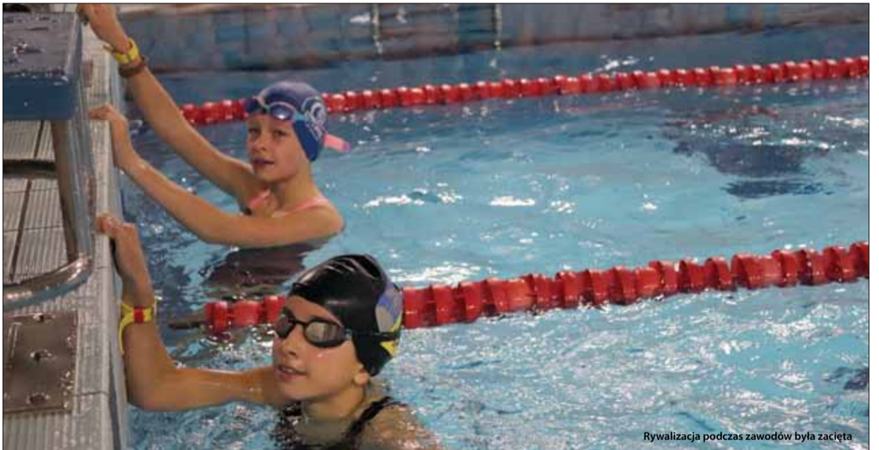
Rywalizacja podczas zawodów była zacięta