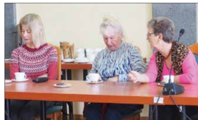
RED Podczas szkolenia seniorzy uzyskali bardzo cenne informacje m.in. o prawie spadkowym, a także prawach konsumenta

W drugiej części radca prawny miała 4-godzinny dyżur, w trakcie którego seniorzy mogli zadawać pytania, odbyć indywidualne konsultacje, uzyskać darmowe porady prawne.