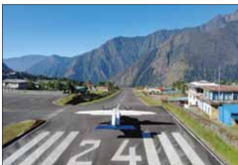
Lotnisko w Lukli uważane jest za jedno z najniebezpieczniejszych na świecie