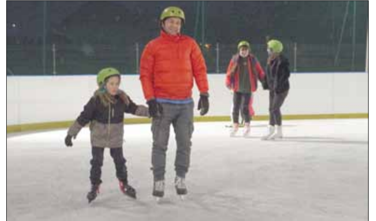
Niedługo miłośnicy łyżew znowu będą mieli możliwość szusowania po lodzie

W poprzednim numerze gazety pisaliśmy o problemach, z jakimi borykają się aquaparki w całej Polsce, w tym również w naszym mieście. Gigantyczny poziom inflacji, rosnące ceny energii, gazu i podstawowych surowców sprawiły, że wielu zarządców krytych pływalni szuka oszczędności i możliwości na prowadzenie dalszej działalności. Władze Aquaparku Granit podjęły już szereg różnych działań. Początkowo, jednym z rozwiązań miała być rezygnacja z lodowiska w tym sezonie. Ostatecznie jednak, zarządca, wychodząc naprzeciw oczekiwaniom lokalnej społeczności, szczególnie dzieci i młodzieży, podjął decyzję o uruchomieniu lodowiska. Analiza działalności lodowiska z poprzednich lat wykazała, że najbardziej sprzyjające warunki pogodowe do utrzymania właściwej jakości lodu są na przełomie grudnia i stycznia. W związku z tym tegoroczne otwarcie obiektu zostało przełożone na koniec roku kalendarzowego. Co jednocześnie zbiega się z przerwą technologiczną w aquaparku. Zatem zdecydowano się zaoszczędzone w ten sposób środki finansowe przesunąć i przekazać na działalność lodowiska. Na zmianę stanowiska w sprawie otwarcia obiektu wpłynęła również dobra wiadomość o zamrożeniu cen energii energetycznej dla obiektów sportowych. Jednocześnie okazało się, że Strzeleńskie Centrum Sportowo-Edukacyjne jako spółka gminna nie musi wykazać 10% oszczędności energetycznej, co nie obliży do konieczności zmniejszania zużycia energii.