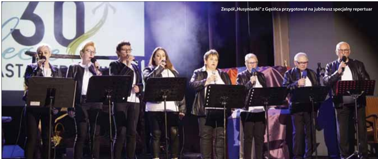
Zespół „Husynianki” z Gęsińca przygotował na jubileusz specjalny repertuar