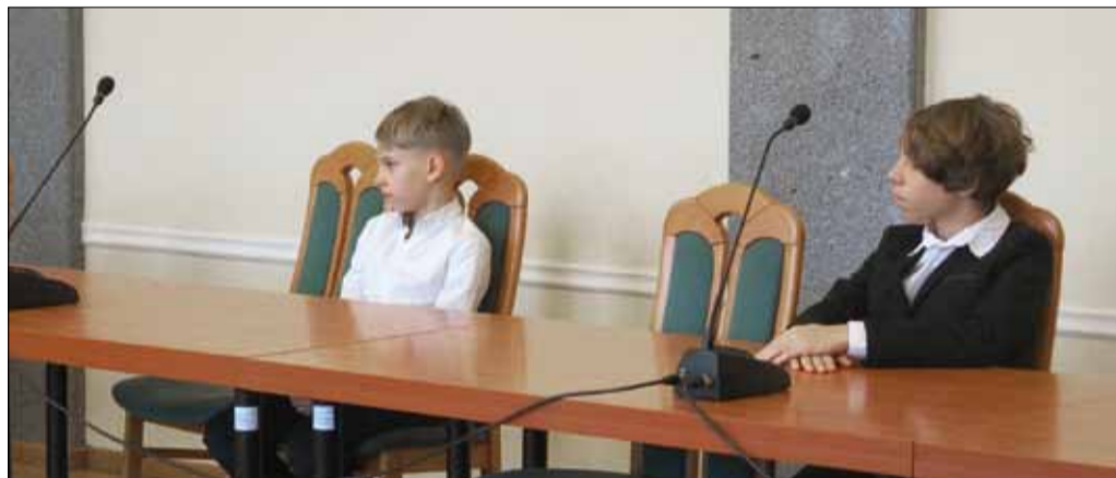
RED W listopadzie odbyło się drugie posiedzenie Młodzieżowej Rady Gminy Strzelin

Pierwsze z nich dotyczyło podjęcia uchwały w sprawie logo MRG. Radni wybierali jeden spośród czterech projektów. Następnie zajęto się harmonogramem uroczystości, w których MRG zamierza uczestniczyć. Dalej wybrano protokolanta, a także opiekuna profilu MRG na facebooku. W trakcie obrad została zwołana kolejna sesja, podczas której radni wybiorą nowego przewodniczącego MRG (obecny zrezygnował z powodu nadmiaru obowiązków).