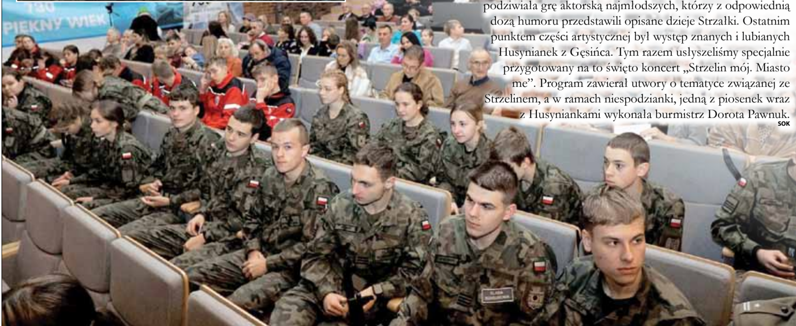
Wydarzenie przyciągnęło sporą publiczność

„Ten kryzys odbija się nie tylko na portfelach mieszkańców, ale również na samorządach”