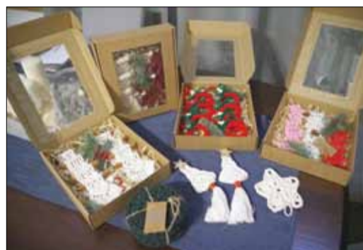
W świątecznej ofercie znajdują się również różnorodne zestawy, które sprawdzą się jako prezent lub ozdoba

interesowaniem cieszyły się różnego rodzaju torebki – okrągłe, kwadratowe, plażówki, shop-