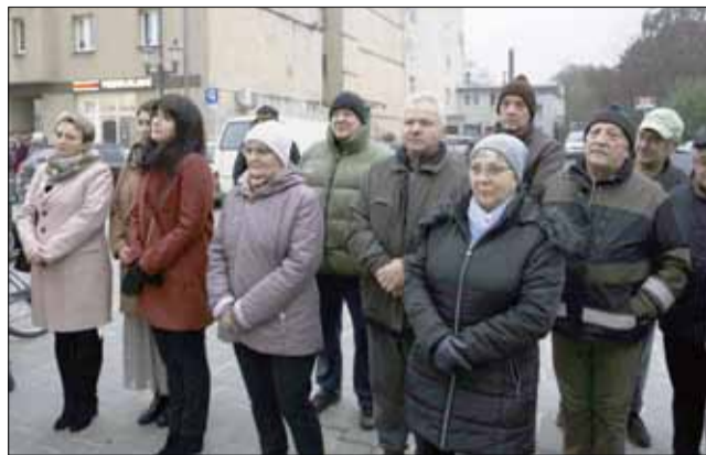
Na uroczyste odsłonięcie pamiątkowej tablicy przybyli mieszkańcy