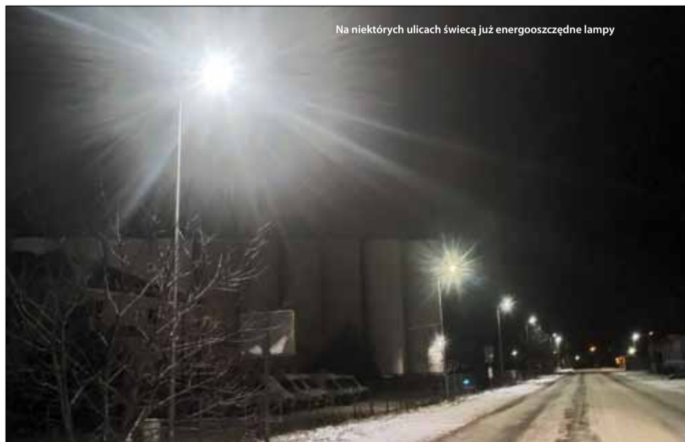
Na niektórych ulicach świecą już energooszczędne lampy

Dodajmy, że wykonawcą zadania o wartości blisko 2 mln zł jest firma SPIE Elbud Gdańsk, Kwota dofinansowania całego projektu, po stronie Gminy Strzelin, wyniesie ponad 1 mln 512 tys. zł