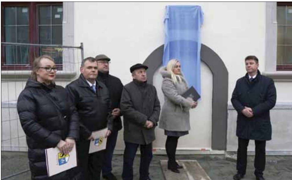
Pamiątkowa tablica zawisła na zachodniej ścianie nowego ratusza