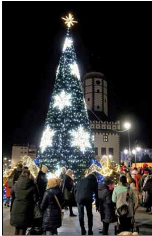
Wielu mieszkańców skorzystało z okazji i przyszło na strzeliński Rynek, aby zobaczyć moment rozświetlenia choinki

Warto podkreślić, że do charytatywnej zbiórki, zorganizowanej w strzelińskim magistracie, oprócz urzędników dołączyli jeszcze pracownicy Gminnego Ośrodka Pomocy Społecznej, Zakładu Wodociągów i Kanalizacji oraz niektórzy radni Rady Miejskiej Strzelina.