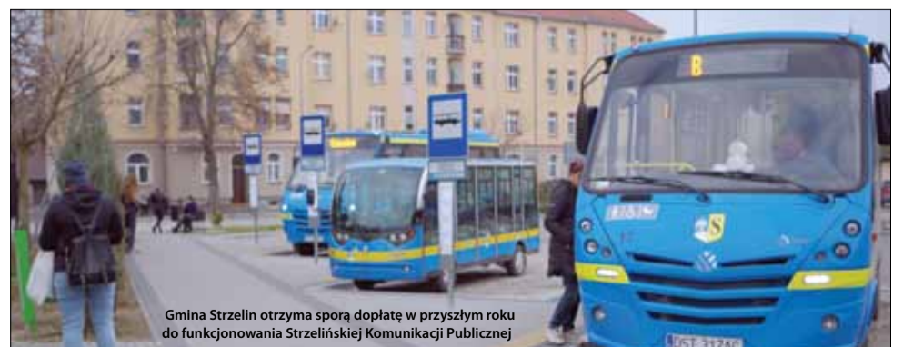
Gmina Strzelin otrzyma sporą dopłatę w przyszłym roku do funkcjonowania StrzeLińskiej Komunikacji Publicznej