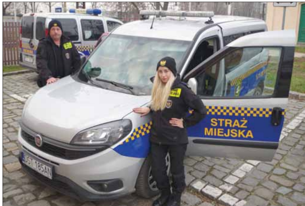
Strzełińscy strażnicy miejscy w bieżącym roku interweniowali ponad 1100 razy