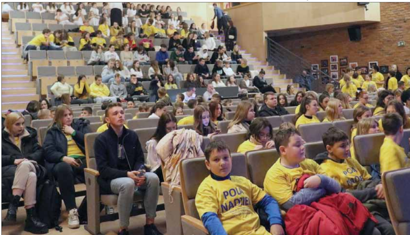
Podziękowano ludziom dobrego serca, którzy wolny czas poświęcają na rzecz pomocy potrzebującym

Przewidziano również część artystyczną. Na scenie wystąpili przedstawiciele ze Szkoły Podstawowej w Wiązowie, Liceum Ogólnokształcącego w Strzelinie oraz Centrum Kształcenia Zawodowego i Ustawicznego w Strzelinie. W sali konferencyjnej SOK był przygotowany poczęstunek w formie ciepłych i zimnych napojów, kanapek oraz ciast.