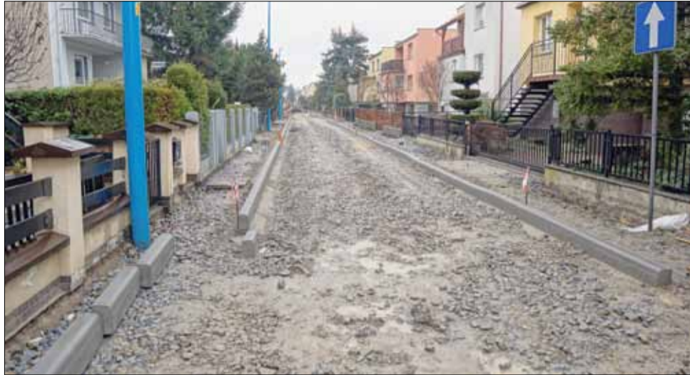
Choć remont ul. Łokietka przeciąga się i niewątpliwie stanowi utrudnienie to już niedługo mieszkańcy będą mogli cieszyć się z nowej i równej nawierzchni

złym stanie technicznym i kwalifikuje się tylko do wymiany. Mając na uwadze bezpieczeństwo mieszkańców, trwałość inwestycji, jak również zdrowy rozsądek strzeLiński samorząd wymusił na PSG całkowitą wymianę sieci gazowej. Z jednej strony to powód do zadowolenia, ale w praktyce oznacza to również wpływ na wydłużenie terminów realizacji robót. Ponadto podziemna infrastruktura techniczna w ulicy Żwirki i Wigury - głównie kanalizacja deszczowa była nieprawidłowo zinwentaryzowana geodezyjnie i jej część nie była widoczna na mapach. Przez to powstały techniczne problemy z odwodnieniem piwnic budynków mieszkal-