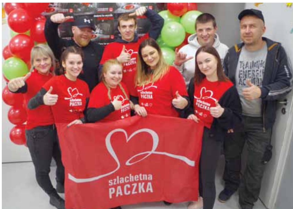
Drużyna „Super W” i osoby wspierające akcję pomaganie mają we krwi