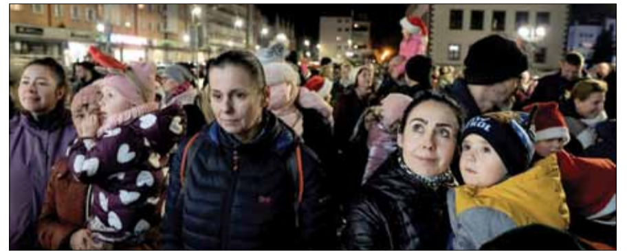
Wielu mieszkańców skorzystało z okazji i przyszło na strzeliński Rynek, aby zobaczyć moment rozświetlenia choinki

Organizatorami wydarzenia byli: Strzeliński Ośrodek Kultury i Gmina Strzelin, a w przygotowanie uroczystości i miejskiej choinki byli zaangażowani również pracownicy Centrum Usług Komunalnych i Technicznych w Strzelinie.