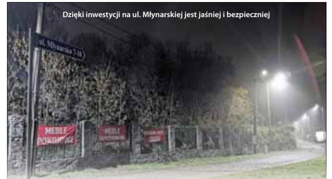
Dzięki inwestycji na ul. Młynarskiej jest jaśniej i bezpieczniej

Niedawno wrocławska firma Weber System Marzeny Lypaczewskiej, zrealizowała prace związane z budową nowego oświetlenia drogowego przy części ul. Młynarskiej (od nr 7 do 10). Przy okazji doświetlono również fragment ul. Kopernika. Wartość robót budowlanych, sfinansowanych w całości z budżetu Gminy Strzelin, to ponad 53 tys. zł. Dodajmy, że zamontowanych zostało sześć słupów oświetleniowych, na których znalazło się siedem energooszczędnych opraw typu LED. Zakres prac obejmował również m.in. budowę szafki sterowniczej. Dzięki realizacji inwestycji z pewnością zwiększyło się bezpieczeństwo i komfort mieszkańców. Było to niewielkie, ale na pewno bardzo potrzebne zadanie.