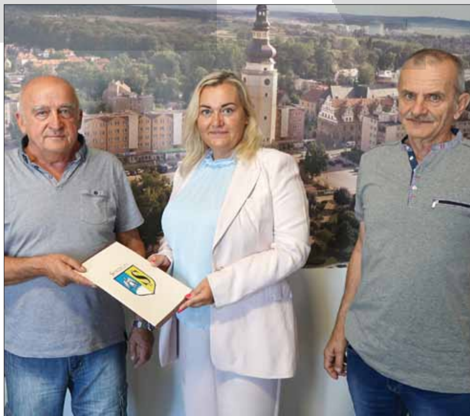
Przedstawiciele niektórych wspólnot podpisali już umowy na dofinansowanie budowy wiat śmietnikowych

Warto przypomnieć, że Gmina Strzelin uruchomiła program „Czyste podwórko” w 2019 roku. W ciągu 4 lat, wykonanych zostało 28 wiat, które bez wątpienia przyczyniają się do poprawy wizerunku miasta, a mieszkańcom ułatwiają prawidłową segregację odpadów. W latach ubiegłych wnioskodawcy mogli liczyć na dotację 5 000 zł. W tym roku Rada Miejska Strzelina podjęła uchwałę, która podwyższa tę kwotę do 8 000 zł. To dobre informacje dla spółdzielni, wspólnot i ich zarządców.