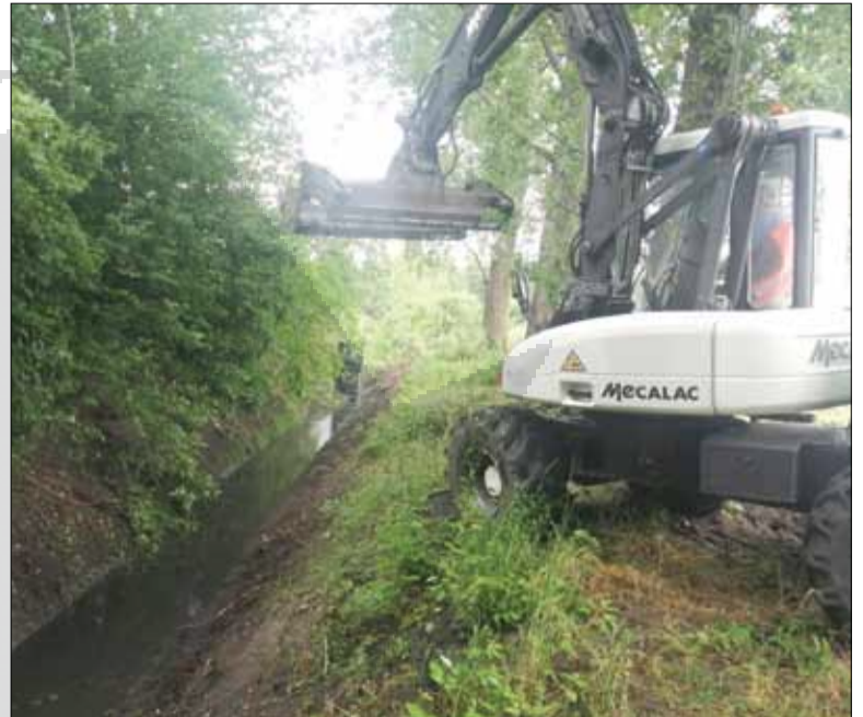
Oczyszczony i pogłębiony rów spełnia teraz swoją funkcję

zielonych administrowanych przez jednostkę. Ponadto w mieście regularnie podlewane są kwiaty i rośliny ozdobne z zastosowaniem odżywek. Z administrowanych terenów przez jednostkę, m.in. Wieży Ciśnień i kamieniołomu w Gościęcicach zbierane są regularnie śmieci. Gruntownie oczyszczony został również teren targowiska miejskiego. Pracownicy dbają również o place zabaw, gdzie sukcesywnie wymieniają m.in. piasek i uszkodzone urządzenia zabawowe.