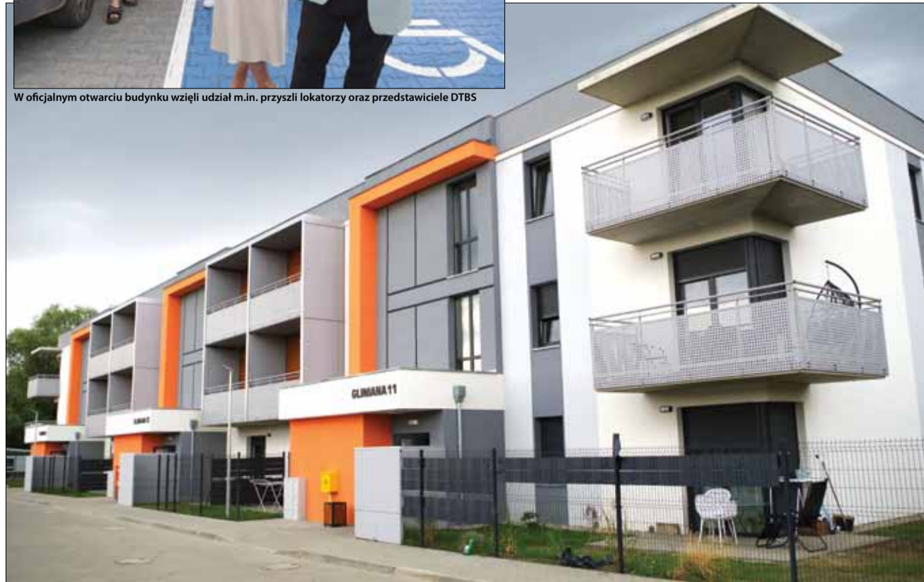
Budynek posiada trzy klatki, a znajduje się w nim 27 mieszkań

Warto zaznaczyć, że strzeLiński samorząd zamierza wybudować kolejny budynek mieszkalny w ramach DTBS. Ma on stanąć przy zbiegu ulic Okulickiego i Glinianej. W czerwcu Komisja Budżetu i Rozwoju Gospodarczego Gminy wyraziła pozytywną opinię w sprawie rozpoczęcia procedury przekazania aportem gruntu do Dzierżoniowskiego Towarzystwa Budownictwa Społecznego. To dopiero początek drogi zmierzającej do realizacji inwestycji. Kolejnym krokiem będzie podpisanie listu intencyjnego, a następnie wyodrębnienie środków na projekt budowlany. Do tematu budowy kolejnego budynku mieszkalnego w ramach DTBS wrócimy w jednym z kolejnych numerów gazety.