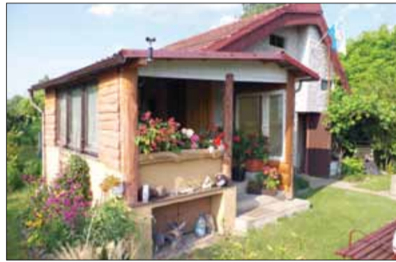
Niektóre altany na działkach robią wrażenie, tak jak ta, należąca do Jadwigi Skołuckiej

Wszystkie działki w... i oscylują w granicach 5... kową, wynosi obecnie... złoty składki członk... rocznie użytkownicy p... działki jest bardzo tru... gdy któryś z dzierżaw... dzi dodatkowa opłata... zagospodarowana jest... upiększenie. „Odstępn... ogrodową wyposażoną