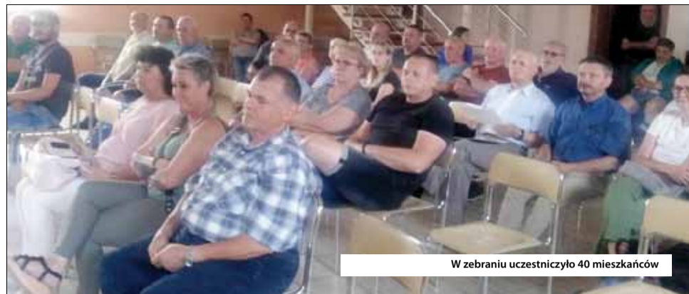
W zebraniu uczestniczyło 40 mieszkańców

Postara się o większą mobilizację mieszkańców