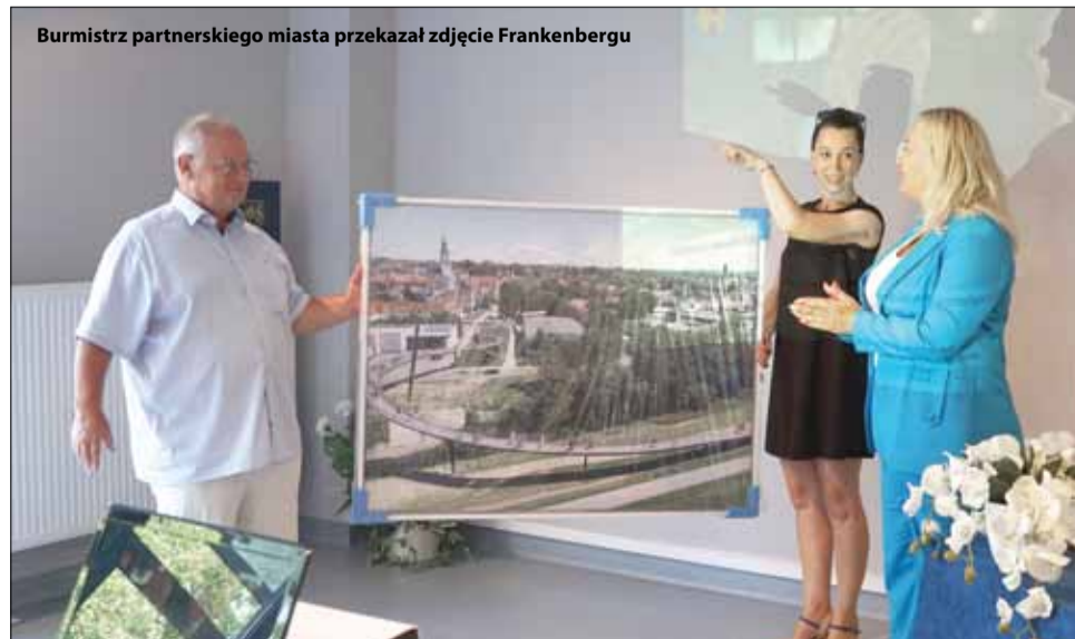
Burmistrz partnerskiego miasta przekazał zdjęcie Frankenbergu