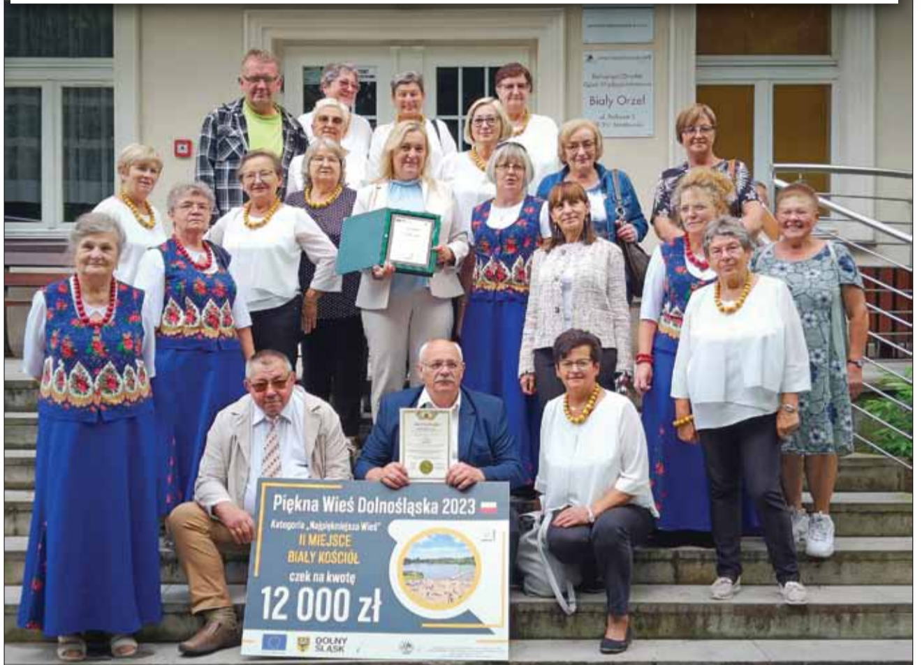
Mieszkańcy Białego Kościoła mają powody do dumy