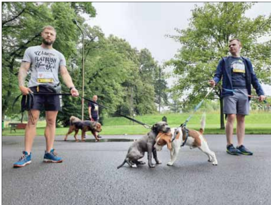
Czworonogi były bardzo przyjaźnie nastawione