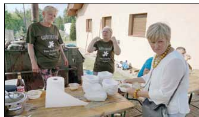
Grochówka serwowana z kuchni polowej przypadła do gustu uczestnikom