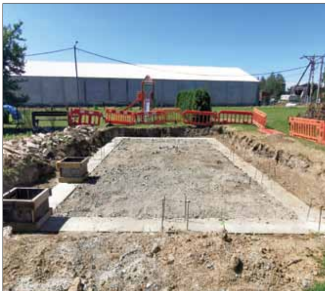
Wykonawca przygotował już fundamenty pod budowę wiaty

Przebudowa ruszyła, a na ul. Wolności pojawiły się głębokie wykopy