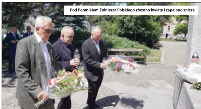
Pod Pomnikiem Żołnierza Polskiego złożono kwiaty i zapalono znicze