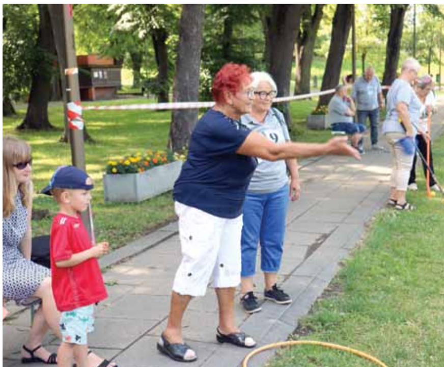
Seniorzy spędzili ten dzień bardzo aktywnie

Warto dodać, że już na początku sierpnia odbędzie się kolejne ciekawe wydarzenie dla seniorów – czyli święto kwiatów. Szczegółowy program tego wydarzenia publikujemy na kolejnej stronie.