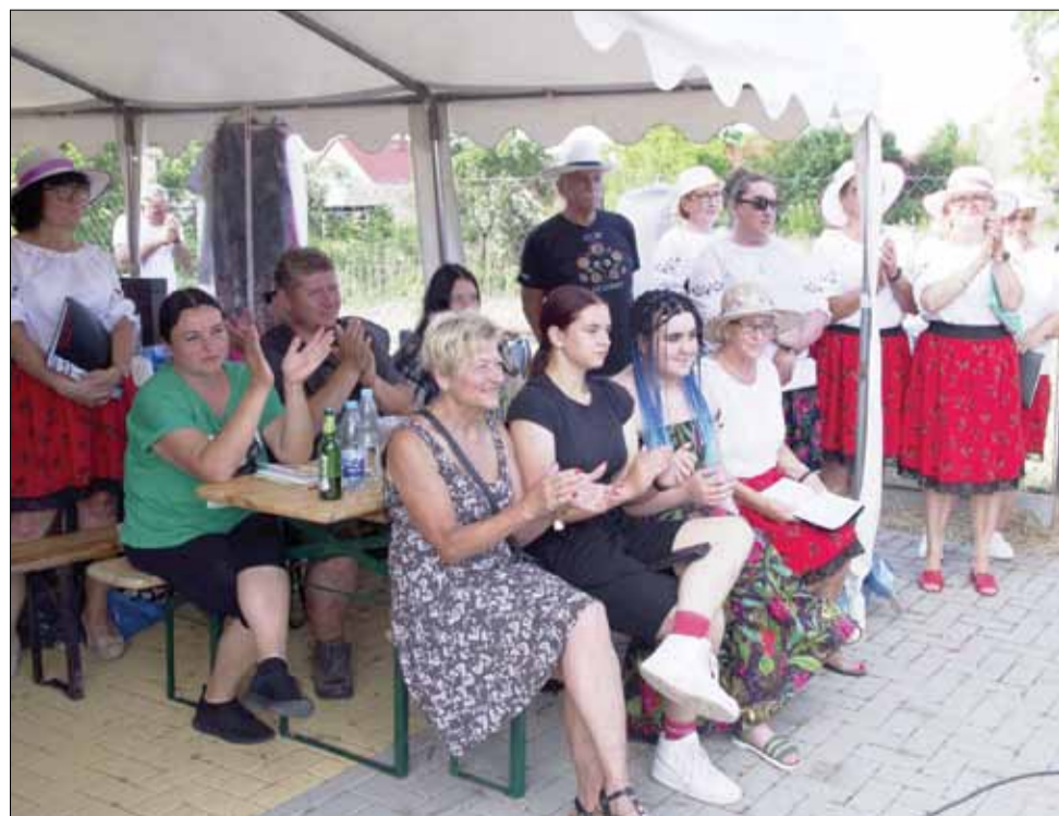
Wydarzenie cieszyło się dużym zainteresowaniem