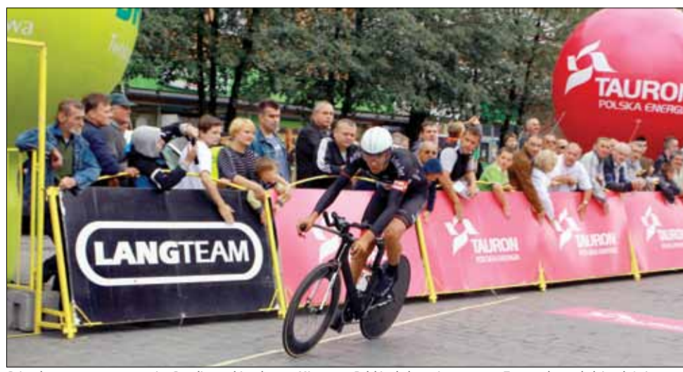
Osiem lat temu przez teren gminy Strzelin przebiegała trasa Mistrzostw Polski w kolarstwie szosowym. Teraz czeka nas kolejna duża impreza kolarska

Warto wiedzieć, że premia lotna to również dodatkowa atrakcja dla kibiców. Jest to wyznaczone miejsce na trasie wyścigu kolarskiego, na którym pierwsi zawodnicy zdobywają punkty lub inne nagrody, a więc można powiedzieć, że to taka „między-meta”, na której niejednokrotnie toczy się zażarta walka o zdobycie jak najlepszej pozycji. Premie są dobrze oznaczone, w tych miejscach stawiana jest brama oraz balony sponsorskie. W Strzelinie lotny finisz (tak jest również nazywane to miejsce) jest zaplanowany na ul. Wojska Polskiego na wysokości sklepu ogrodniczego i będzie się odbywał w trakcie przejazdu powrotnego rowe-