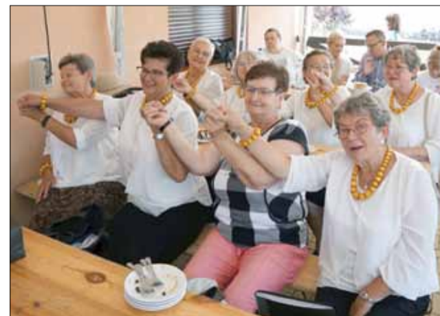
Jak przystało na ten rodzaj imprezy panowała ibleśnadsza atmosfera