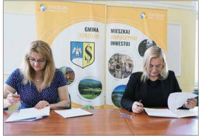
Przedstawiciele wspólnot mieszkaniowych podpisali w strzełińskim urzędzie umowy potwierdzające przyznanie dotacji

W tym roku z programu skorzystają dwie wspólnoty z ul. Wojska Polskiego 1C oraz z ul. św. Jana 28. Każda na realizację inwestycji otrzyma po 1500 zł. Umowy potwierdzające udzielenie dotacji podpisano niedawno w strzełińskim magistracie. Dzięki inwestycjom mieszkańcy powinni już wkrótce czuć się bezpieczniej.