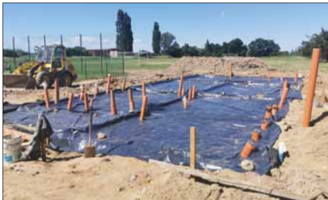
Szatnia, która powstaje w Chociwelu, będzie służyć nie tylko piłkarzom, ale także kibicom