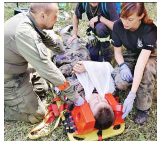
Zadaniem „Strzelców” była m.in. opieka nad poszkodowanymi

W Strzelinie od ponad pięciu lat działa Związek Strzelecki „Strzelec”. Jednostka zajmuje się m.in. zarządzaniem kryzysowym czy szkoleniami opartymi o program szkoleń Wojska Polskiego.