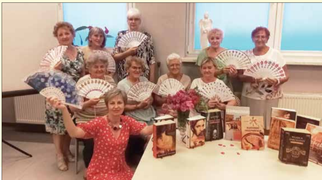
Podczas części warsztatowej ozdabiano i dekorowano wachlarze