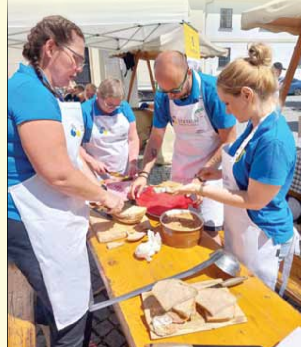
Nasza delegacja dzielnie walczyła w kulinarnym konkursie

W drugiej połowie lipca przedstawiciele strzeleńskiego samorządu wzięli udział w tradycyjnym Festiwalu Piwa, zorganizowanym w partnerskim, czeskim mieście Svitavy. Nasza delegacja, w skład której weszli pracownicy strzeleńskiego magistratu, m.in. gotowała na svitavskim rynku gulasz. Tym razem w tej kulinarniej rywalizacji nasi samorządowcy znaleźli się w połowie stawki. Piąte miejsce na dziesięć ekip to całkiem przyzwoita lokata. Wśród rywali byli m.in. samorządowcy z innych partnerskich miast - Łądką Zdroju, ukraińskiego Perecyna, słowackiego Ziaru nad Hronem oraz niemieckiego Stendal. Dodajmy, że podczas festiwalu na strzeleńskim stoisku aktywnie promowano ziemię strzeleńską, a w bogatym programie święta naszych czeskich partnerów nie zabrakło licznych atrakcji m.in. koncertów i wystaw.