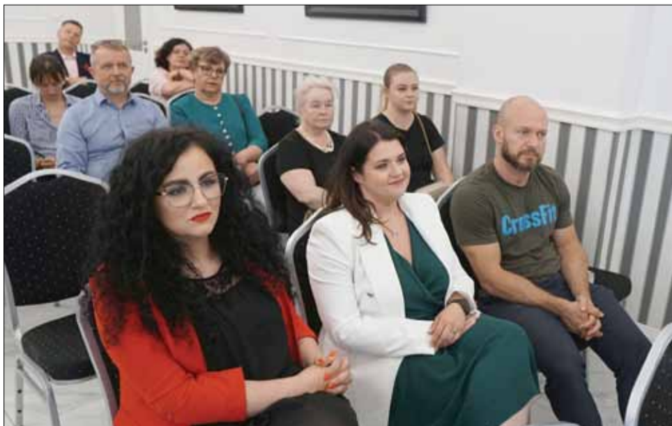
Podczas spotkania omawiano m.in. zalety i korzyści, jakie daje uczestnictwo w Partnerskich Klubach Biznesu

Więcej informacji o Partnerskich Klubach Biznesu można odnaleźć na stronie internetowej www.partnerskielubbybiznesu.pl .