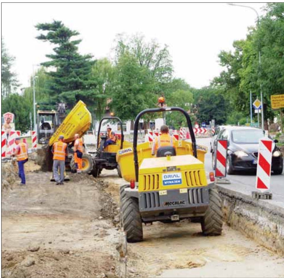
Przy skrzyżowaniu ulic Olawskiej, Wolności i Wroclawskiej trwają intensywne prace

W poprzednim numerze gazety szeroko opisywaliśmy przebudowę skrzyżowania trzech strzelińskich ulic: Olawskiej, Wolności i Wroclawskiej. Inwestycja rozpoczęła się na początku lipca, a prace realizowane są w szybkim tempie. Przypomnijmy, że inwestorem jest Dolnośląska Służba Dróg i Kolei we Wrocławiu, a wykonawcą firma Pro-Tra Building z Wrocławia. Inwestycja ma kosztować 7,7 mln złotych, a Gmina Strzelin w ramach zawartego porozumienia z Województwem Dolnośląskim przeznaczy na ten cel nieco ponad 1 mln zł. W ramach zadania, oprócz samego skrzyżowania, zmodernizowane zostaną m.in. chodniki, a strzeliński Zakład Wodociągów i Kanalizacji zrealizuje budowę sieci wodociągowej wraz z przyłączami. Skrzyżowanie z wyspą centralną zostało zaprojektowane w taki sposób, aby pojazdy włączały się do ruchu z każdego kierunku. Po realizacji inwestycji kierowcom podróżującym z kierunku Wrocławia (ul. Wroclawskiej), w stronę Olawy (ul. Olawskiej) będzie dużo łatwiej pokonać to skrzyżowanie. Dzięki przebudowie ruch powinien być płynniejszy. Przypomnijmy, że o tę inwestycję mocno zabiegały władze samorządowe Gminy Strzelin, a jej celem jest poprawa przepustowości pojazdów oraz bezpieczeństwa w ruchu. Co ważne, przebudowa będzie dopełnieniem zakończonej w ubiegłym roku modernizacji ulicy Wolności.