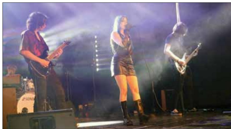
Grand Blue zbiera środki na wydanie pierwszej płyty, a ostatni koncert przybliżył ich do celu

W drugiej połowie czerwca w sali widowiskowej Strzeleńskiego Ośrodka Kultury odbył się koncert zespołu Grand Blue. Młodzi artyści z naszej gminy po raz kolejny potwierdzili duże zdolności. Koncert był energiczny, a publiczność chętnie wchodziła w interakcję z zespołem. Każdy, kto zdecydował się wziąć udział w koncercie, wsparł Grand Blue w drodze do wydania ich debiutanckiej płyty. Minimalna opłata, przeznaczona właśnie na ten cel wynosiła 25 zł. Ponadto można było kupić plakaty oraz koszulki zespołu. W holu ośrodka znajdowało się również stoisko z pysznym ciastem, które wyprzedano do ostatniego kawałka. Kolejnym ważnym punktem tego wydarzenia było stoisko DKMS - organizacji zaangażowanej w walkę z nowotworami krwi i innymi chorobami układu krwiotwórczego. Warto pomagać. Wszystkim, którzy w tym dniu nie szczędzili grosza, organizatorzy i zespół serdecznie dziękują. Tego dnia łącznie uzbierano 2922 zł.