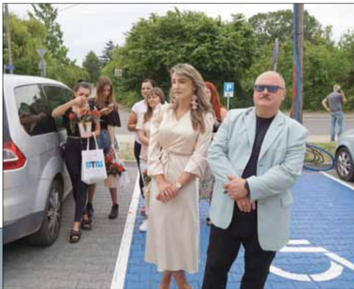
W oficjalnym otwarciu budynku wzięli udział m.in. przyszli lokatorzy oraz przedstawiciele DTBS

Ponad półtora roku trwała budowa nowego budynku mieszkalnego w Strzelinie realizowanego w ramach Dzierżoniowskiego Towarzystwa Budownictwa Społecznego. Inwestycja pochłonęła blisko 9,5 mln zł. Łącznie powstało 27 mieszkań o zróżnicowanej powierzchni. Każde z nich ma już najemcę. Zapotrzebowanie na tego typu inwestycje jest bardzo duże, dlatego strzeLiński samorząd planuje budowę kolejnego budynku.