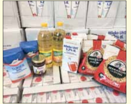
Kolejna partia żywności dotarła do Gminnego Ośrodka Pomocy Społecznej w Strzelinie

Pomocy Najbardziej Potrzebujących - Podprogram 2021. Wśród produktów znalazły się m.in. makaron, mleko, olej, cukier, konserwa, powidła. W rozładowaniu dostawy pomogli m.in. więźniowie strzeLińskiego zakładu karnego. Łącznie trafiło do jednostki nieco ponad 4300 kg żywności.