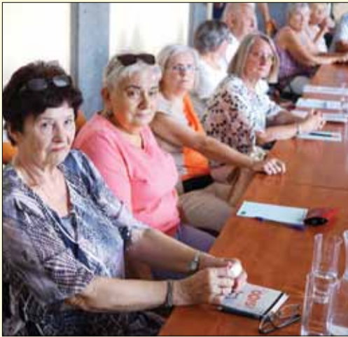
Podczas szkolenia seniorzy dowiedzieli się m.in. o kwestiach dotyczących prawa spadkowego

W szkoleniu uczestniczyli seniorzy z Uniwersytetu Trzeciego Wieku, Polskiego Związku Emerytów, Rencistów i Inwalidów, a także osoby spoza organizacji senioralnych.