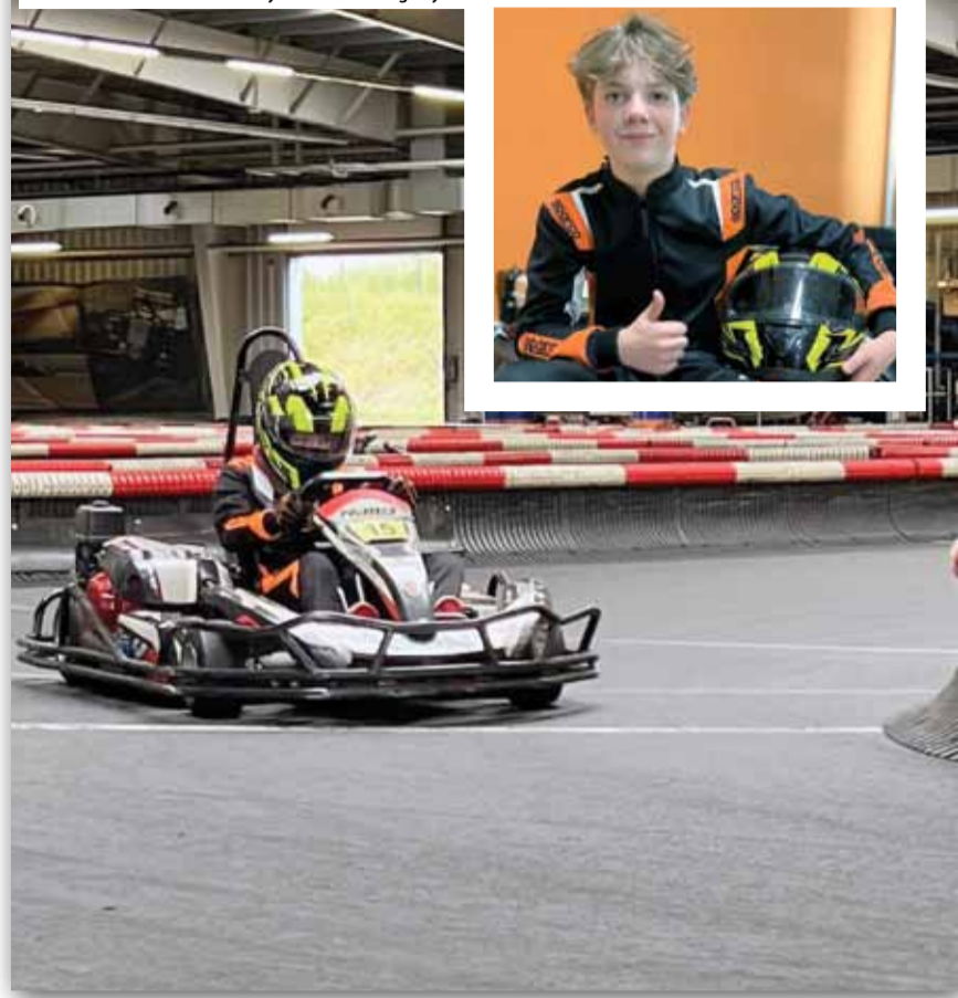
Zawodnik z Gęsińca poznaje specyfikę toru w Szczecinie

Tour de Pologne ze startem honorowym w naszym Rynku