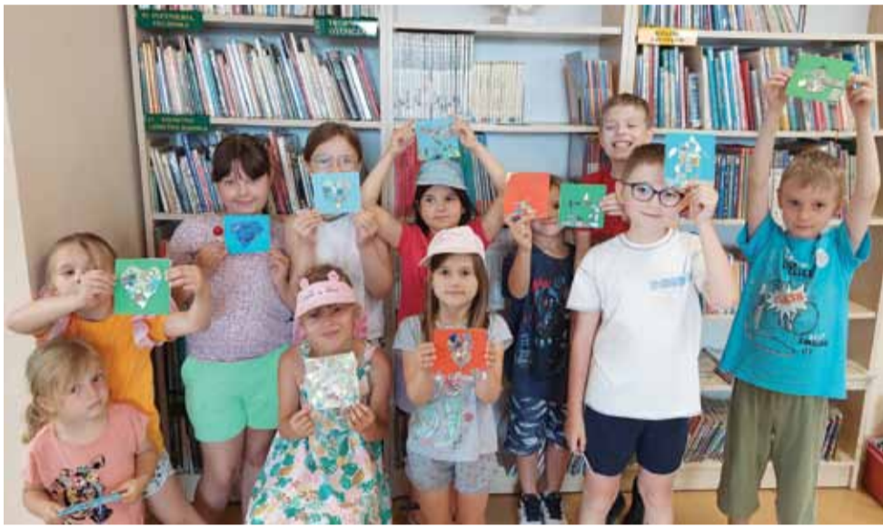
Zajęcia cieszą się bardzo dużym zainteresowaniem, a dzieci chętnie wykonują różnego rodzaju prace