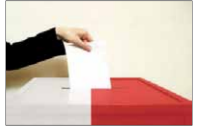
Niedługo wybierzemy skład sejmu i senatu na nową kadencję

Poniżej umieszczamy informację o warunkach udziału obywateli polskich w głosowaniu w obwodach głosowania, a więcej szczegółów o zbliżających się wyborach do Sejmu i Senatu RP można przeczytać m.in. na stronie www.strzelin.pl