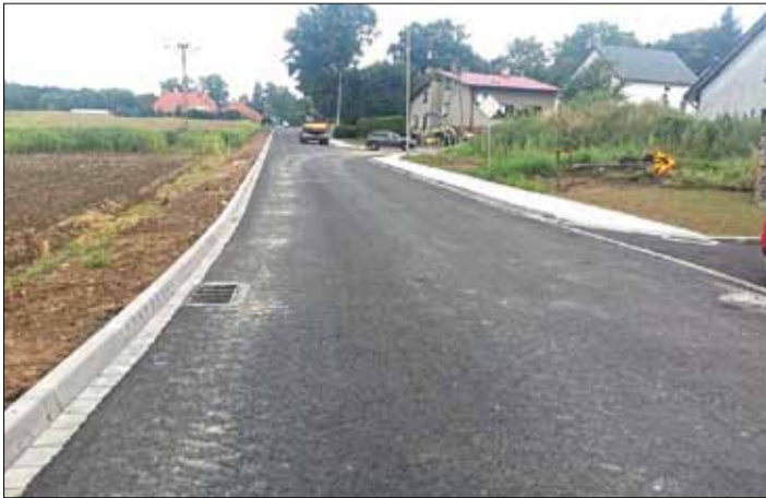
Ulica Pułaskiego w Strzelinie zyska nie tylko nową nawierzchnię, ale również m.in. chodnik

Na ukończeniu są prace związane z remontem ul. Kazimierza Pułaskiego w Strzelinie. Na tą inwestycję czekali nie tylko mieszkańcy strzeelińskiego Osiedla „Na Skarpie”, ale również kierowcy korzystający z drogi. Przypomnijmy, że ul. Pułaskiego łączy się z drogą krajową nr 39 (ul. Wojska Polskiego) oraz drogą gminną - ul. Wichrową. Zakres prac tej gminnej inwestycji