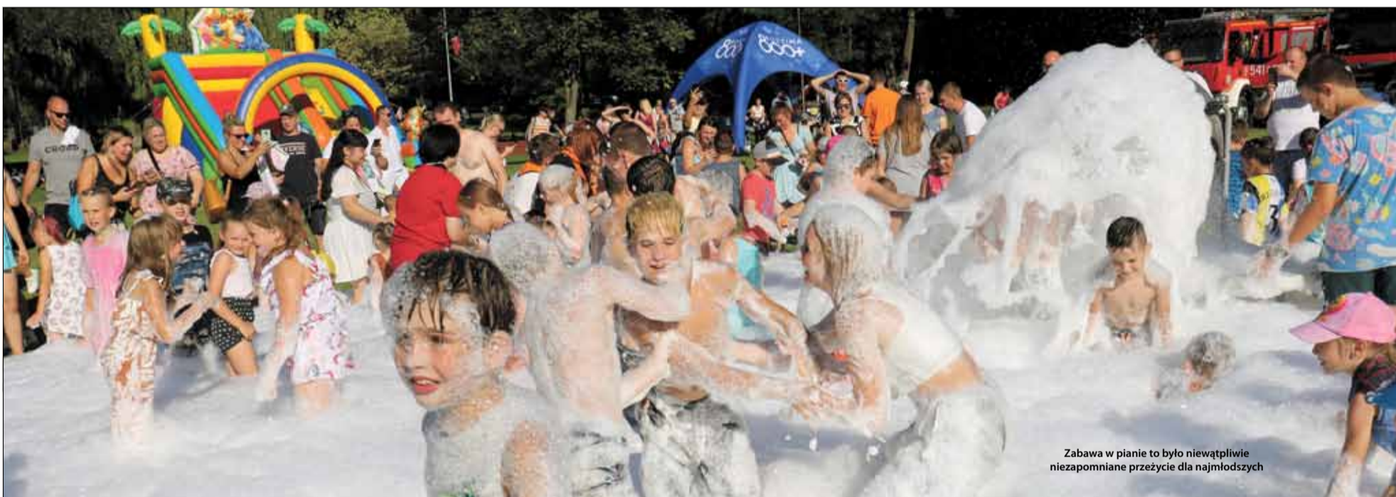
Zabawa w pianie to było niewątpliwie niezapomniane przeżycie dla najmłodszych