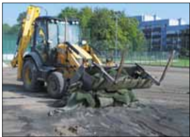
Nawierzchnia orlika przy ul. Okulickiego w Strzelinie zostanie wymieniona na nową

Niedawno na orlika przy ulicy Okulickiego (obok Strzeleńskiego Centrum Sportowo-Edukacyjnych rozpoczęła się modernizacja. Przypomnijmy, że inwestycja zakłada wymianę nawierzchni boiska (na nową z granulatem EPDM,