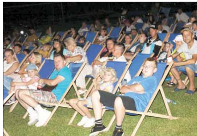
Kino plenerowe cieszyło się bardzo dużym zainteresowaniem