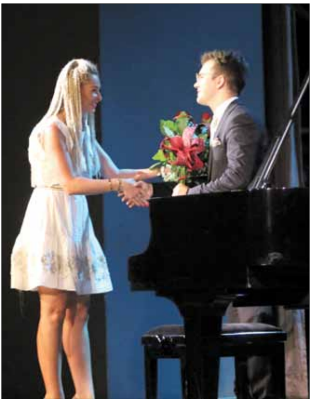
Po koncercie artysta otrzymał kwiaty