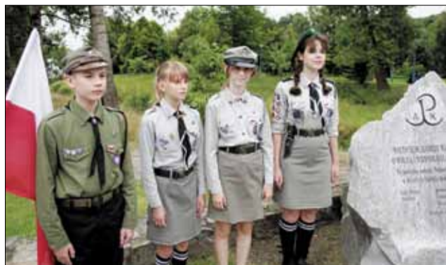
Pod obeliskiem wartę pełnili harcerze