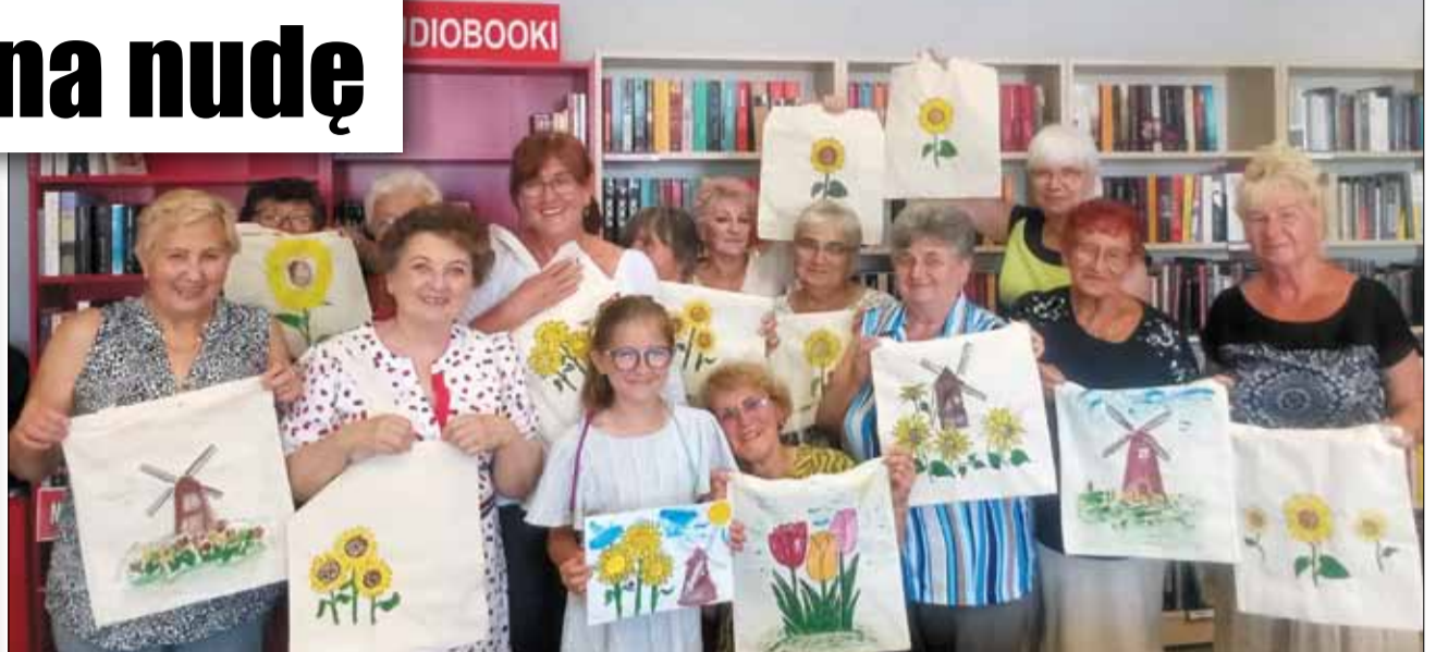
Podczas spotkań uczestnicy mogli odwiedzić różne kraje i poznać ich zwyczaje