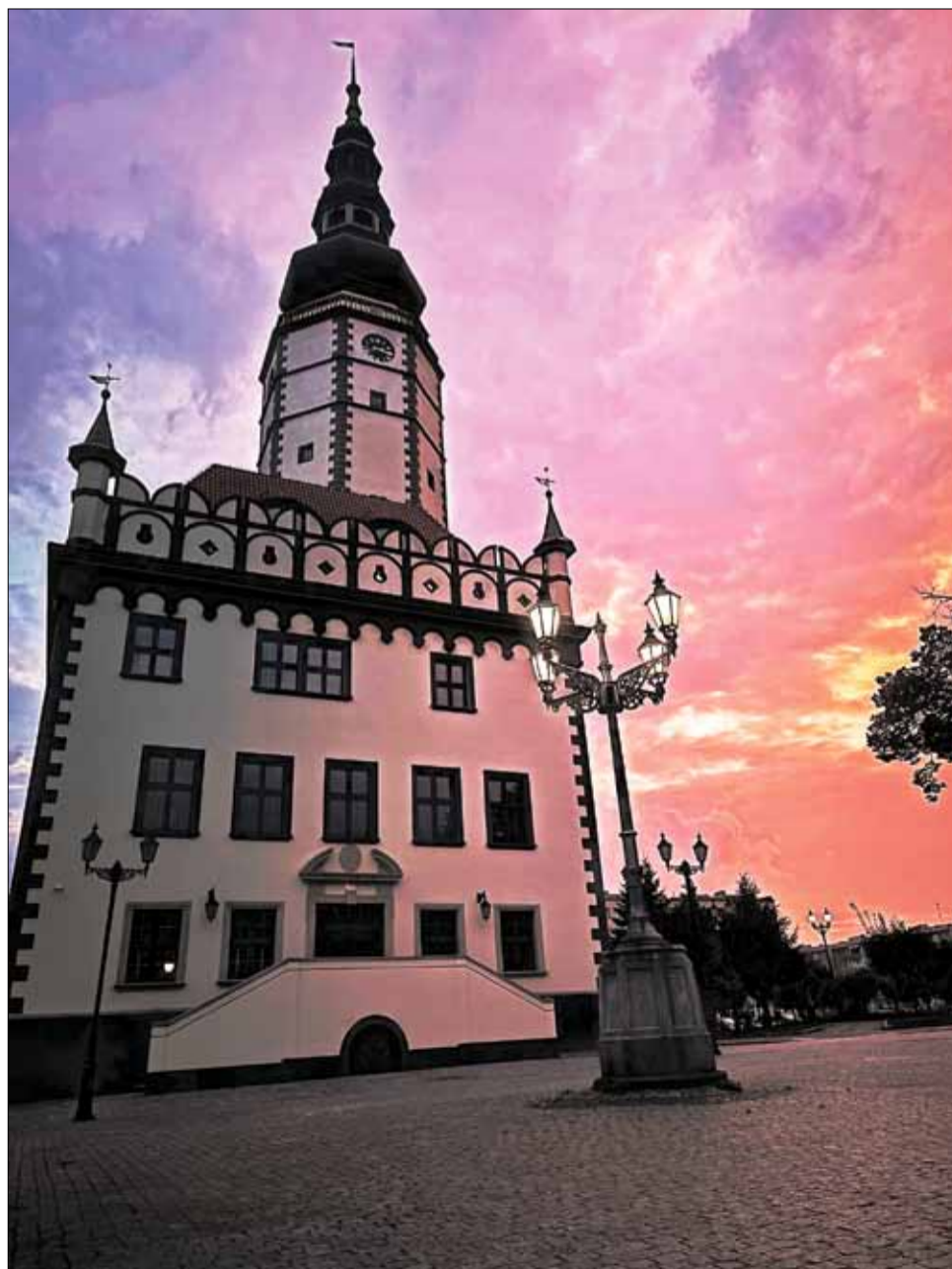
W tym roku impreza odbędzie się na strzezińskim Ryneku