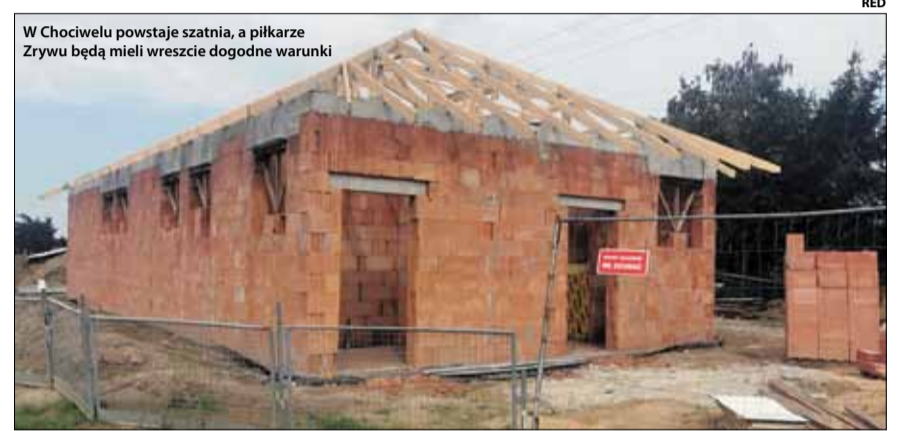
W Chociwelu powstaje szatnia, a piłkarze Zrywu będą mieli wreszcie dogodne warunki

Na sfinansowanie zadania Gmina Strzelin otrzyma 1,1 mln zł w ramach Rządowego Funduszu Polski Ład: Program Inwestycji Strategicznych (edycja III – PGR). Wkład własny strzeleńskiego samorządu wyniesie 88 tys. zł. Inwestycję realizuje firma Ciepły Dom z Karnkowa