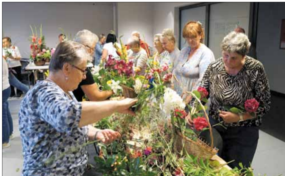
Panie wkładały całe serce w tworzenie kompozycji

Za tak cudowne kompozycje kwiatowe i trud włożony w ich wykonanie nie mogło zabraknąć nagród. W trakcie wystawy można było oddawać głosy na najpiękniejsze kompozycje. Tuż przed koncertem nagrody zwycięzcom i wyróżnionym wręczyli: Sekretarz Gminy Strzelin Ka-