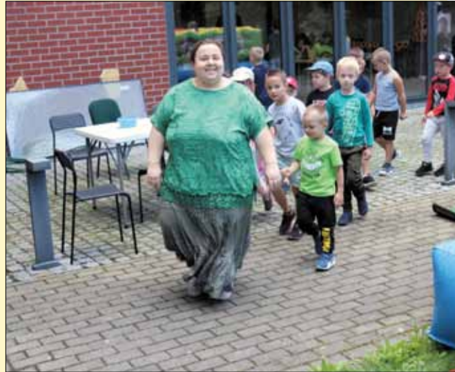
Aktywność na świeżym powietrzu to wspaniała alternatywa dla najmłodszych