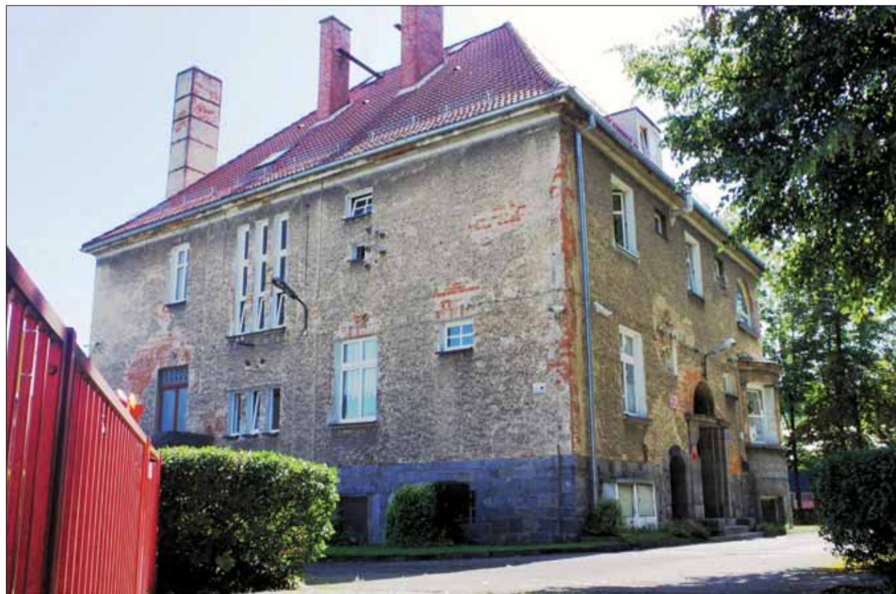
W budynku, w którym obecnie mieści się przedszkole i żłobek „Bajka” samorząd gminny zamierza uruchomić placówkę publiczną