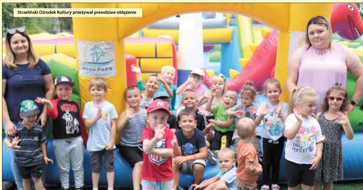
Strzeliński Ośrodek Kultury przeżywał prawdziwe obłędzenie