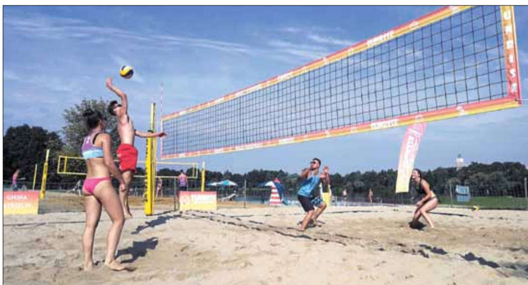
Ostatni turniej przeprowadzono w ciekawej formule

Weźmie udział w Międzynarodowych Mistrzostwach Polski