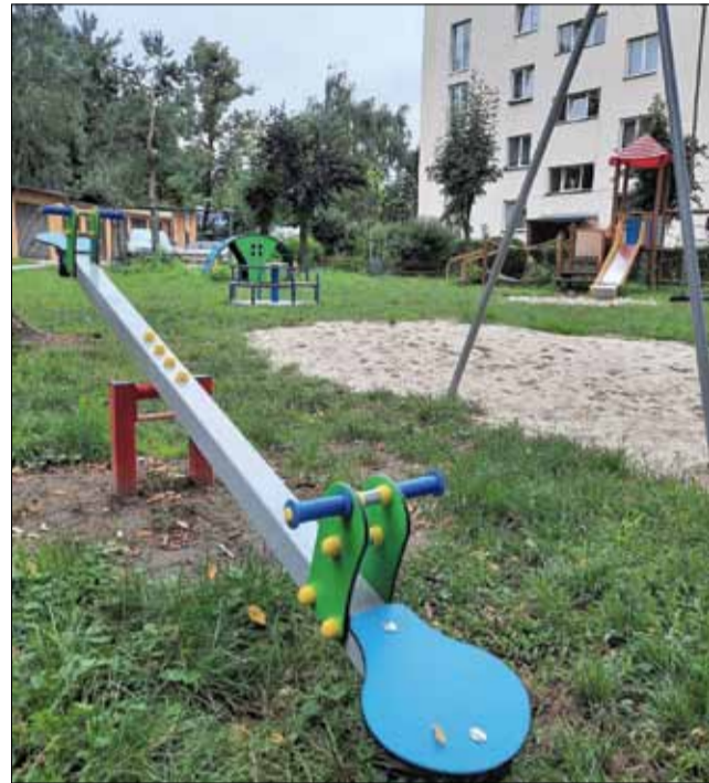
Na placu zabaw przy ul. Popieluszki w Strzelinie zamontowano m.in. huśtawkę wagową