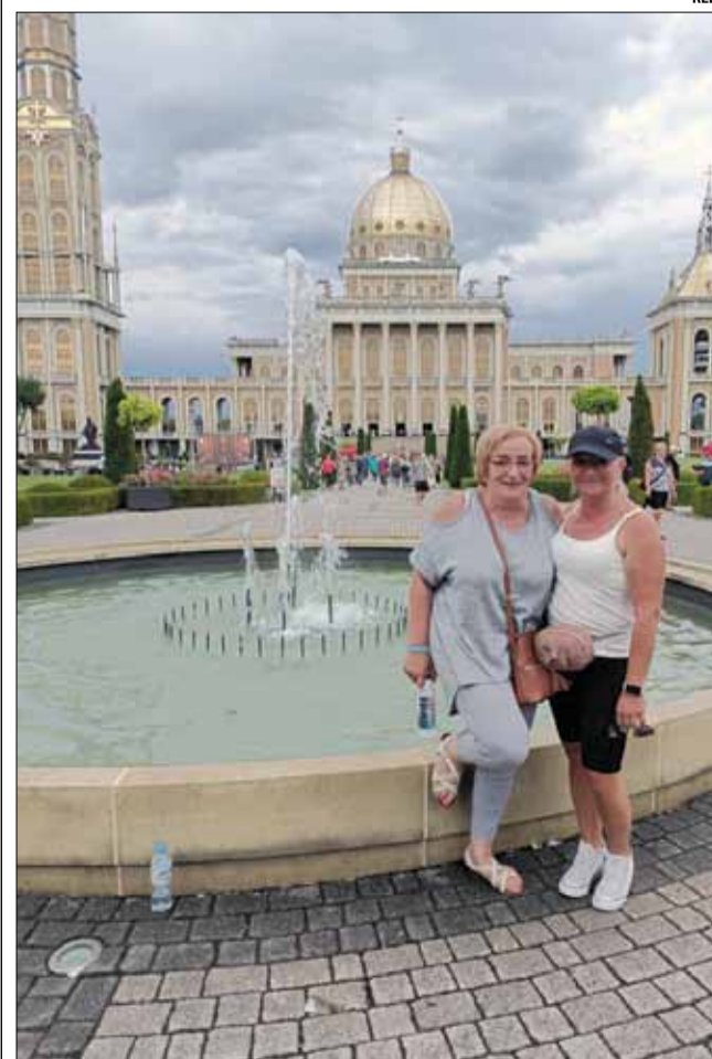
Podczas wyjazdu integracyjnego uczestnikom dopisywały humory