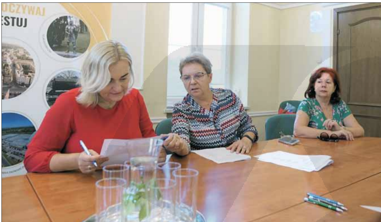
Umowy potwierdzające przyznanie dotacji podpisali przedstawiciele wspólnot mieszkaniowych

Narodowy Fundusz Ochrony Środowiska i Gospodarki Wodnej za naszym pośrednictwem zwraca się do wnioskodawców i beneficjentów programu „Czyste Powietrze” o rozważenie w wyborze dostawców i firm instalacyjnych do wykonania wymiany źródła ciepła. - Niestety, zdarzają się na rynku usług nieuczciwi wykonawcy, którzy oferują usługi i produkty niskiej jakości oraz zawyżają ceny. Prosimy o ostrożność, w szczególności w przypadku oferty akwizytorów na instalację źródła ciepła, w tym pomp ciepła. Nieuczciwi sprzedawcy proponują niedopasowane do waszego domu i potrzeb - niskiej jakości urządzenia, które w okresie grzewczym zużywają dużo prądu, a ich trwałość i jakość jest słaba – czytamy w komunikacie. Najlepiej przed podpisaniem umowy uważnie sprawdzić firmę, w szczególności jeśli pojawiają się jakiegokolwiek wątpliwości co do oferowanej ceny usługi, produktu, parametrów urządzenia lub instalacji oraz warunków serwisowania i gwarancji. - Zalecamy podejmowanie decyzji bez pośpiechu, w konsultacji z gminnym punktem konsultacyjno-informacyjnym, sołtysem lub regionalnie funkcjonującym WFOŚiGW. Warto też skorzystać z funkcjonującej w ramach programu „Czyste Powietrze” tzw. listy ZUM (listy zielonych urządzeń i materiałów) - dostępnej online pod adresem www.lista-zum.ios.edu.pl , która zawiera zweryfikowane urządzenia i materiały o potwierdzonej jakości – czytamy dalej.