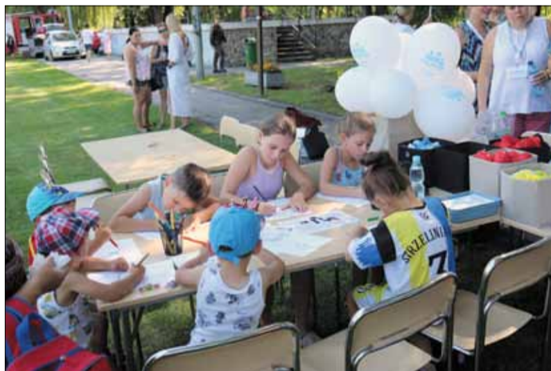
Stoisko związane z kampanią społeczną dotyczącą przeciwdziałania przemocy domowej cieszyło się zainteresowaniem

W połowie sierpnia w Parku Miejskim im. Armii Krajowej w Strzelinie odbył się Rodzinny Piknik Wojskowo – Mundurowy. W bardzo bogatym programie imprezy znalazła się m.in. kampania społeczna dotycząca przeciwdziałania przemocy domowej. Jej organizatorami byli Gminny Ośrodek Pomocy Społecznej w Strzelinie wraz z Zespołem Interdyscyplinarnym w Gminie Strzelin. Wydarzenie było jednym z działań realizowanych w ramach „Programu Przeciwdziałania Przemocy w Rodzinie oraz Ochrony Ofiar Przemocy w Rodzinie na lata 2021- 2024 dla Miasta i Gminy Strzelin”. Celem tych działań było uwrażliwienie społeczności lokalnej na problem przemocy domowej oraz kształtowanie świadomości społecznej przez informowanie i edukowanie o formach wsparcia w sytuacjach kryzysowych. Zainteresowane osoby oraz uczestnicy pikniku mogli pozyskać informacje dotyczące pomocy osobom doświadczającym przemocy domowej. Ponadto pracownicy GOPS-u informowali o możliwościach i formach pomocy, z jakich można skorzystać w ramach ustawy o pomocy społecznej oraz o świadczeniach rodzinnych, funduszu alimentacyjnym oraz dodatkach mieszkaniowych. Członkowie Zespołu Interdyscyplinarnego oraz pracownicy jednostki rozdawali również ulotki o tematyce dotyczącej przeciwdziałania przemocy domowej wraz z informacją, gdzie otrzymać bezpłatną pomoc na terenie gminy Strzelin, a także różne gadżety z hasłami przeciw przemocy domowej. Stoisko cieszyło się dużym zainteresowaniem.