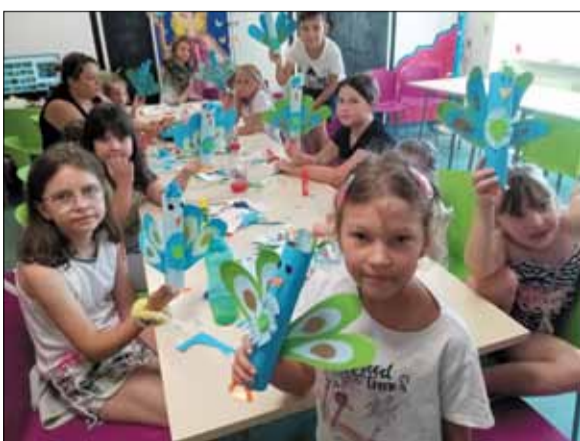
Wakacyjne zajęcia cieszyły się dużym zainteresowaniem