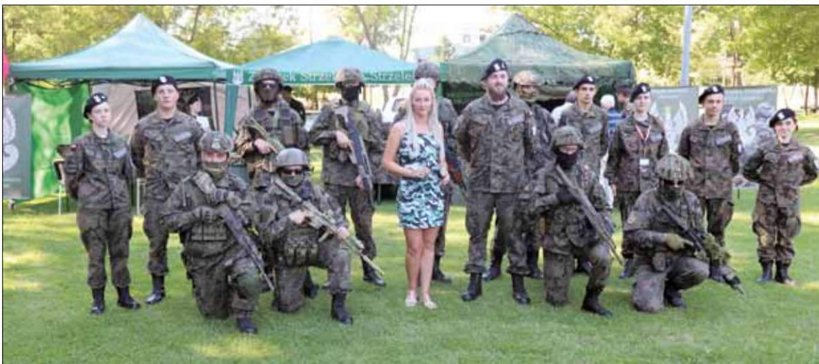
Pokaz wojskowy przygotowała Jednostka Strzelecka 4330 Strzelin