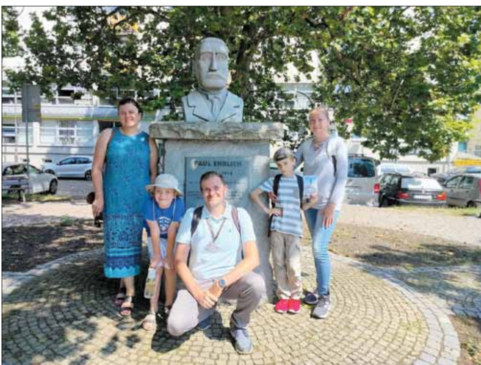
Podczas wycieczki uczestnicy mogli zobaczyć m.in. znaczące dla miasta pomniki