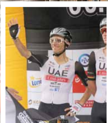
Wśród kolarskich gwiazd był m.in. Rafał Majka

To było bezsprzecznie największe i najbardziej prestiżowe wydarzenie sportowe w najnowszej historii naszej gminy oraz całej ziemi strzeelińskiej. Uroczysty start IV etapu wyścigu kolarskiego Tour de Pologne Strzelin - Opole przyciągnął do Strzelina liczną publiczność, która chciała na żywo zobaczyć największe kolarskie gwiazdy.