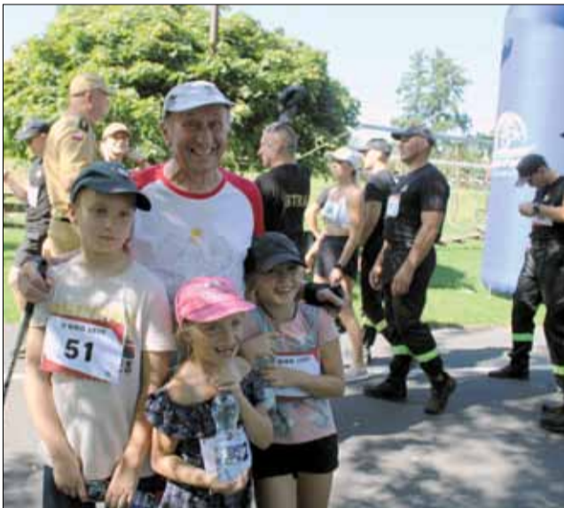
Uczestnikom dopisywał dobry humor