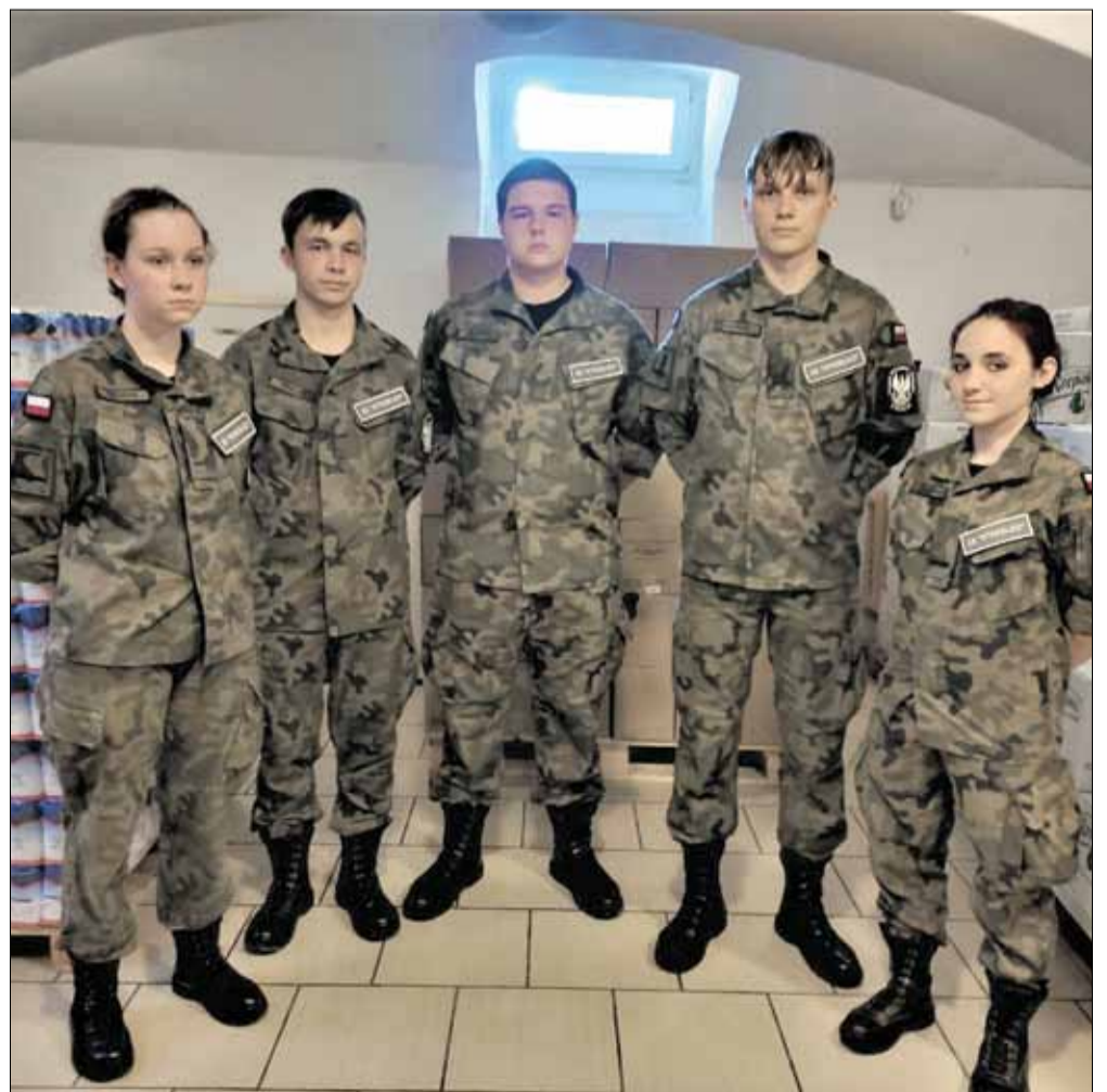
W rozładunku żywności, już nie pierwszy raz, pomagali członkowie Związku Strzeleckiego „Strzelec” Strzelin