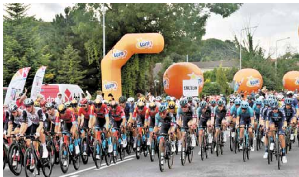
Lotna premia na ul. Wojska Polskiego