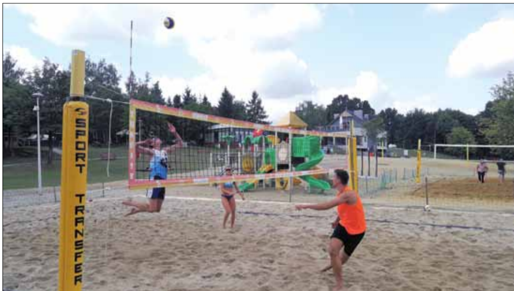
Rozgrywki stały na wysokim poziomie