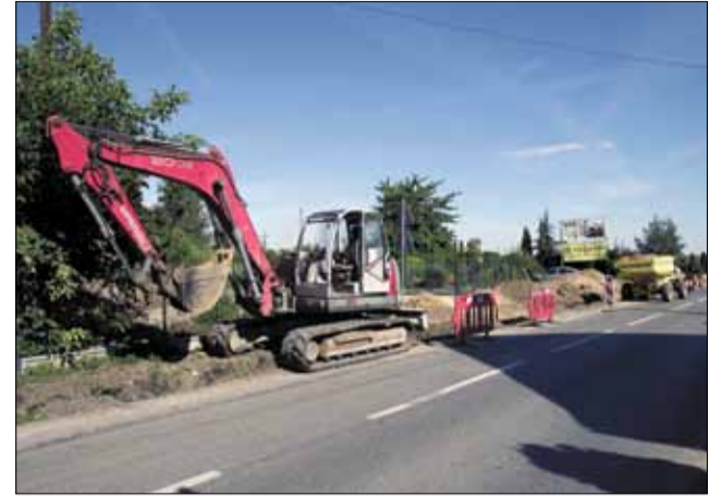
W rejonie prowadzonych prac jezdni jest zwężona, więc kierowcy powinni zachować szczególną ostrożność

W Szczodrowicach roboty przy budowie m.in. chodnika oraz zatok autobusowych przebiegają sprawnie. Przypomnijmy, że w ramach partnerskiej współpracy Gminy Strzelin z samorządem wojewódzkim przy ruchliwej drodze wojewódzkiej nr 395 powstaje chodnik (około 300 metrów), kanalizacja deszczowa, przejścia dla pieszych oraz zatoki autobusowe. Ponad połowę kosztów realizacji tego projektu poniesie samorząd gminny, który pełni rolę inwestora zastępczego. Prace realizuje lokalna firma GLO-