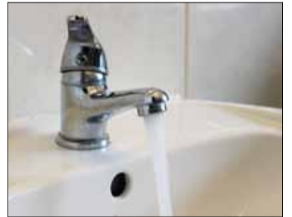
W sierpniu zmienia się taryfa opłat za wodę i ścieki

domowych kształtowały się następująco: 4,53 zł/m 3 (woda) oraz 12,05 zł/m 3 (ścieki), co łącznie dawało 16,58 zł (woda i ścieki). Do rachunku doliczano jeszcze opłatę abonamentową, która wynosiła 7,28 zł. Według nowej taryfy obowiązującej od sierpnia cena za m 3 wody wynosi 5,53 zł, natomiast za m 3 ścieków 13,27 zł. W sumie za kubik (woda+ścieki) opłata wynosi obecnie 18,80 zł. Do rachunku dochodzi jeszcze opłata abonamentowa, która według Wód Polskich powinna zostać podzielona i dla wody wynosi 5,53 zł, a dla kanalizacji 3,39 zł w przypadku gospodarstw domowych. - Wzrost obecnej taryfy to w głównej mierze (około 90%) efekt podwyżki cen prądu - podkreśla Anna Umińska-Woronecka. Nie wszyscy mogą orientować się czym tak naprawdę jest opłata abonamentowa, dlatego warto wyjaśnić, z czego składa się te dodatkowe obciążenie. - Stawka opłaty abonamentowej wynika z kosztów funkcjonowania danego przedsiębiorstwa, np. odczytów wodomierzy, rozliczeń należności, gotowości do świadczenia usług (dyżury - red.) itp. W naszym przypadku coraz więcej odczytów wodomierzy prowadzimy za pośrednictwem nadajników radiowych, co nie tylko ogranicza koszty, skraca