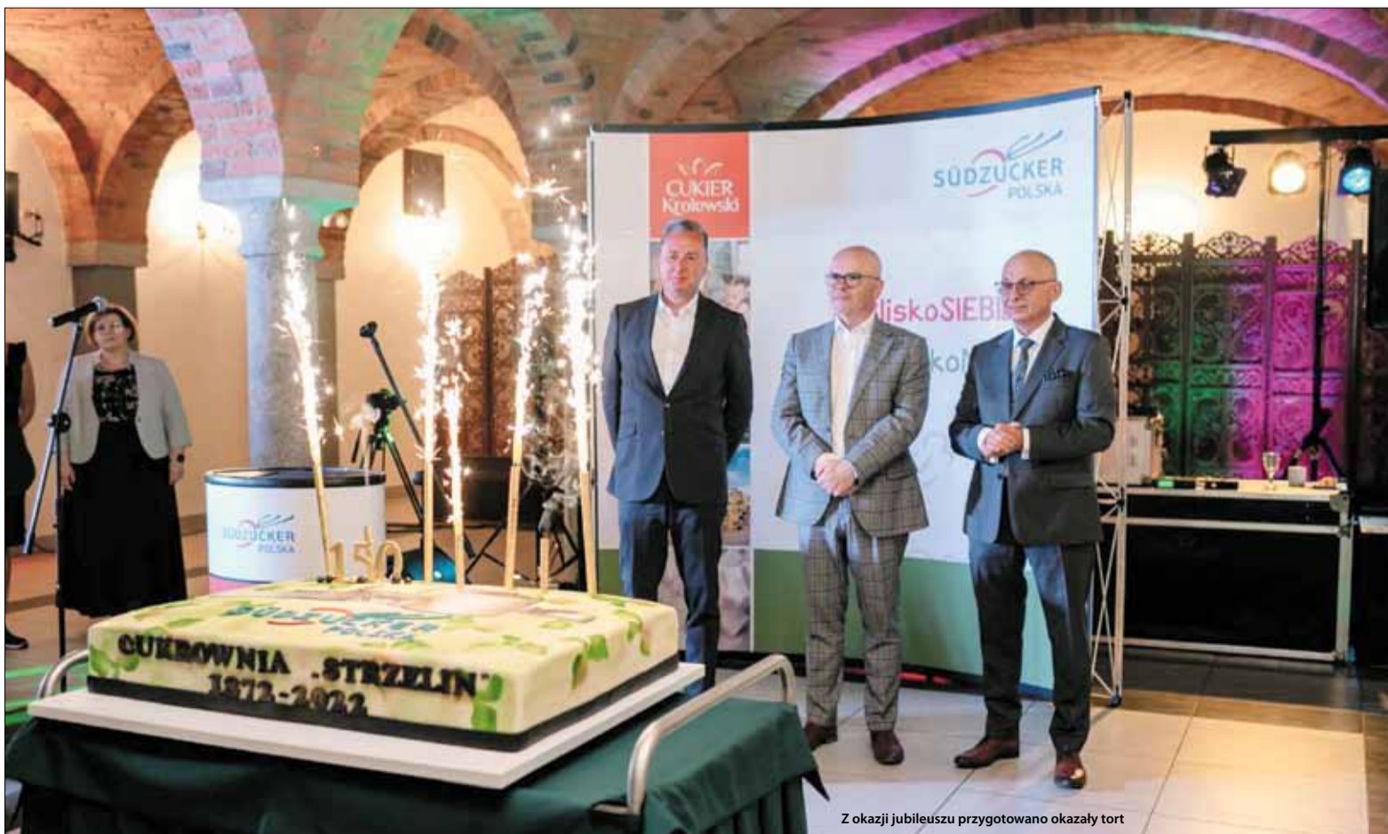
Z okazji jubileuszu przygotowano okazały tort

Informacja prasowa Südzucker Polska S.A.