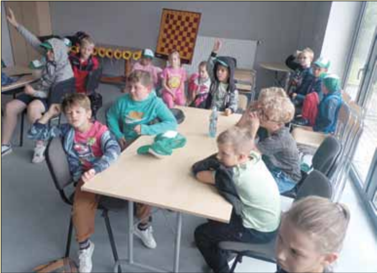
O tym, że zajęcia były ciekawe świadczy wysoka frekwencja