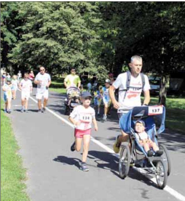
Rodzinny bieg był nie tylko dobrą zabawą, ale również lekcją historii