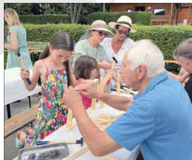
Jedną z atrakcji podczas wydarzenia były warsztaty budowy domków dla owadów

Przy tej okazji zachęcamy do zapoznania się z informacjami na tablicy edukacyjnej, znajdującej się w Parku Miejskim im. Armii Krajowej w Strzelinie. Można z niej dowiedzieć się o roślinach dobrych dla owadów zapylających oraz o domkach dla zapylaczy.