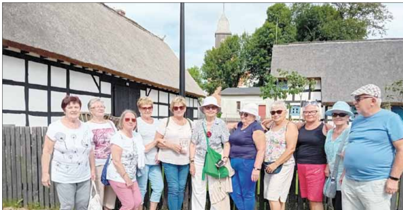
Seniorzy spędzili ponad tydzień w Mielnie - Unieściu