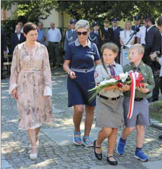
Delegacje złożyły kwiaty pod Pomnikiem Żołnierza Polskiego