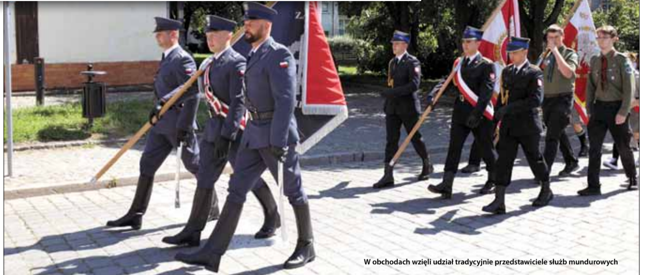
W obchodach wzięli udział tradycyjnie przedstawiciele służb mundurowych

W wtorek, 15 sierpnia w naszym mieście odbyły się lokalne obchody Święta Wojska Polskiego oraz 103. rocznicy Bitwy Warszawskiej.