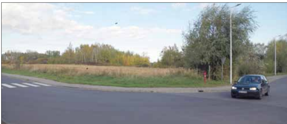
Na działce u zbiegu ulic Okulickiego i Glinianej w Strzelinie, gdzie jeszcze w tym roku rośla kukurydza, niedługo powstanie kolejny budynek mieszkalny w ramach DTBS

stwa Społecznego. Przypomnijmy. Dzięki inwestycji, która kosztowała blisko 9,5 mln zł, powstało 27 mieszkań o zróżnicowanej powierzchni – od 33 m 2 do ponad 66 m 2 . Każde z nich ma najemcę, ale zapotrzebowanie na tego typu inwestycje jest bardzo duże. Z uwagi na to strzeLiński samorząd podjął kroki zmierzające do budowy kolejnego budynku w ramach DTBS. Jeszcze w czerwcu Komisja Budżetu i Rozwoju Gospodarczego Gminy wyraziła pozytywną opinię w sprawie rozpoczęcia procedury przekazania aportem gruntu do Dzierżoniowskiego Towarzystwa Budownictwa Społecznego. Budynek ma stanąć na działce o powierzchni 1,18 ha