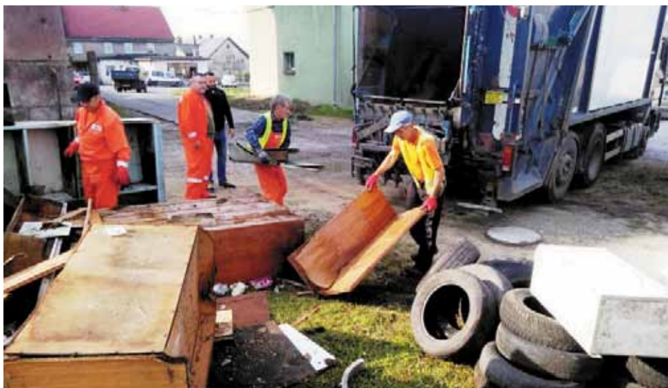
Zbiórkę odpadów na terenie sołectw gminy strzelin przeprowadzi firma KOMUS (zdj. archiwalne)