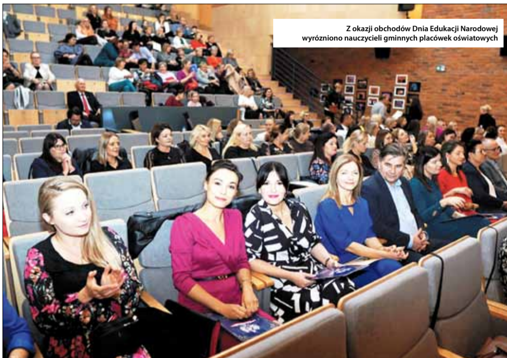
Z okazji obchodów Dnia Edukacji Narodowej wyróżniono nauczycieli gminnych placówek oświatowych