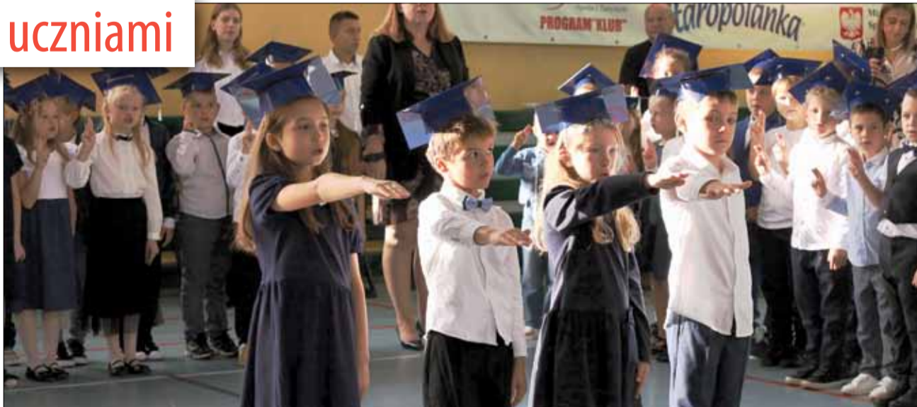
Ślubowanie to bardzo ważny moment dla każdego pierwszoklasisty