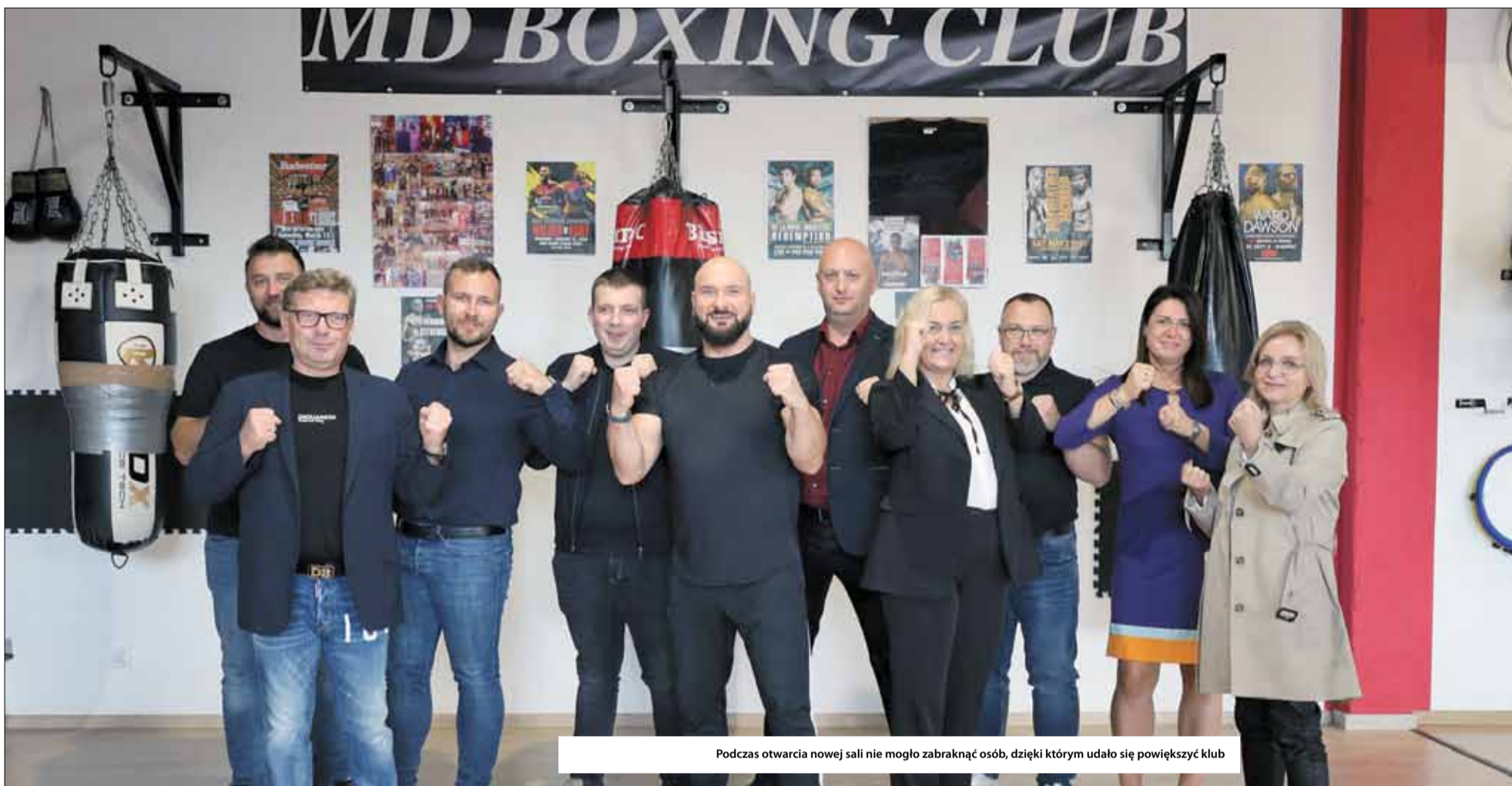
Podczas otwarcia nowej sali nie mogło zabraknąć osób, dzięki którym udało się powiększyć klub