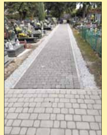
Strzełińska nekropolia zyskała kolejną część chodnika

Warto również nadmienić, że na cmentarzu parafialnym przy ul. Oławskiej w Strzelinie wybudowano chodnik (ok. 60 metrów), który jest odnogą głównego traktu na terenie nekropolii.