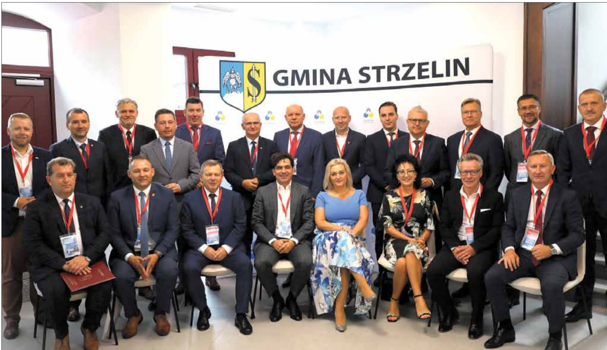
W skład Innego Instrumentu Terytorialnego Subregionu Wrocławskiego wchodzi 25. dolnośląskich gmin