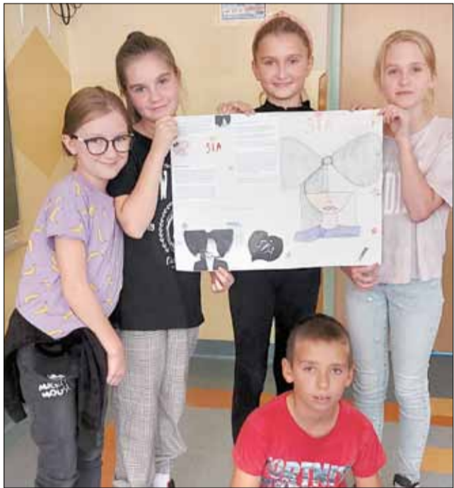
Dzieci wykonały plakaty o swoich ulubionych artystach