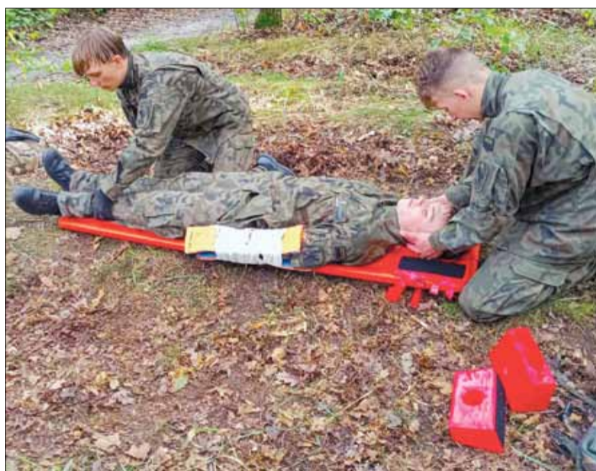
Jednym z zadań podczas Biegu Pamięci Orłąt Lwowskich w Luboniu było udzielenie pomocy poszkodowanym

czas Tour de Pologne czy wsparcie w organizacji różnego rodzaju obchodów świąt państwowych i wydarzeń kulturalnych w naszej gminie. Przekazanie kamizelek to gest, który ma podkreślić dobrą współpracę z jednostką strzelecką.