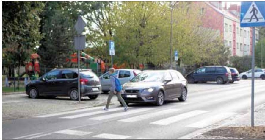
W przyszłym roku przejście dla pieszych na ul. Piłsudskiego w Strzelinie zostanie przebudowane

Już w przyszłym roku przebudowane zostaną dwa przejścia dla pieszych na strzełińskich drogach gminnych – ul. Piłsudskiego (na wysokości Parku Jordanowskiego) i ul. Jana Pawła II (na wysokości Liceum Ogólnokształcącego i Państwowej Szkoły Muzycznej I stopnia).