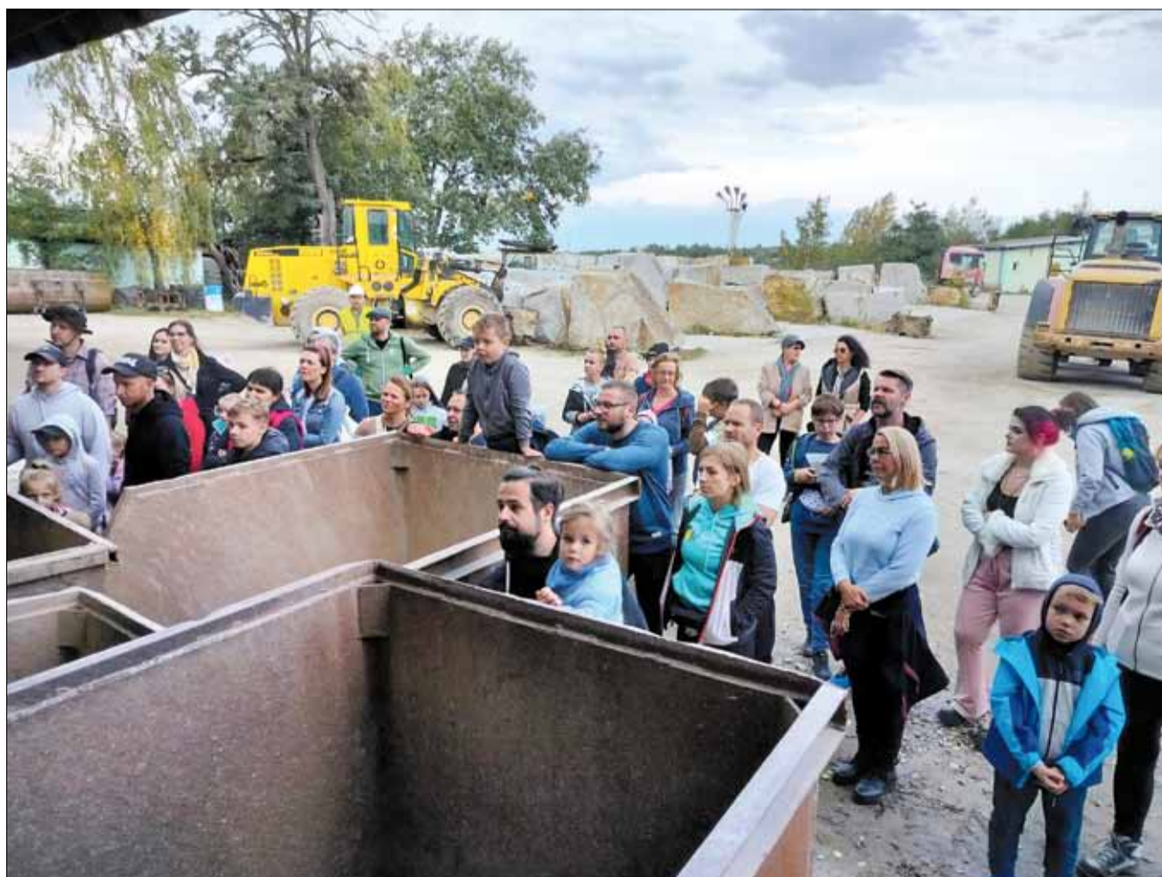
Spora osób skorzystało z okazji, aby zobaczyć strzeliński kamieniołom