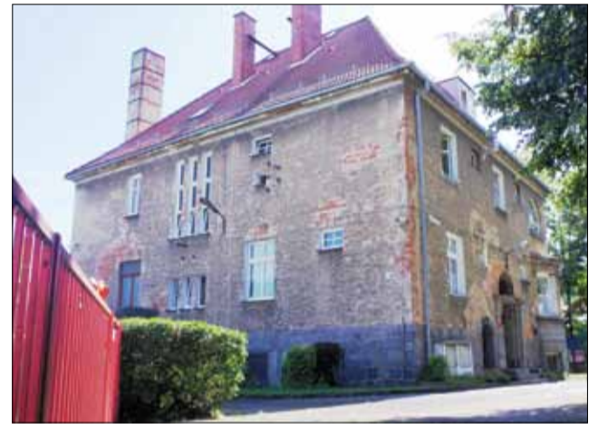
W budynku, w którym obecnie mieści się przedszkole i żłobek „Bajka” samorząd gminy uruchomi w przyszłym roku publiczny żłobek i przedszkole

Tak ma wyglądać nowe przedszkole, które powstanie przy ul. Brzegowej w Strzelinie