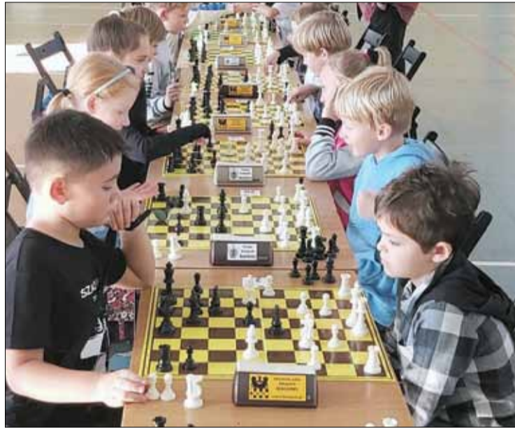
Turniej cieszy się każdego roku dużym zainteresowaniem

Fundatorami nagród byli: Burmistrz Miasta i Gminy Strzelin, Burmistrz Miasta i Gminy Ziębic, Rodzina Sobolewskich, Südzucker Polska. Szczegółowe wyniki można znaleźć na stronie www.chessarbiter.com .