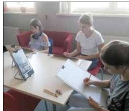
Uczestnicy zajęć studyjnych doskonale poradzili sobie z nietrywim zadaniem

Klub Planszówek i zajęcia z rysunku studyjnego na stałe wpisały się w działalność strzelińskiej biblioteki. We wrześniu i październiku odbyły się cztery spotkania Klubu Planszówek. - Bardzo cieszy nas to, że podnosimy poziom endorfin. Zapraszamy na kolejne spotkania dzieci i dorosłych – mówi dyrektor Miejskiej i Gminnej Biblioteki Publicznej w Strzelinie