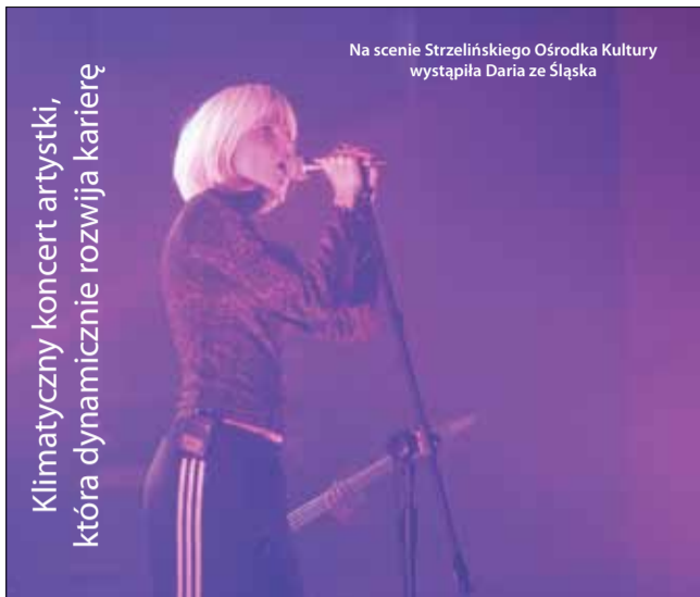
Klimatyczny koncert artystki, która dynamicznie rozwija karierę