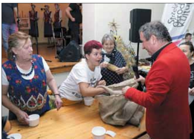
Przedstawiciele sołectw musieli wykazać się umiejętnościami kulinarnymi, artystycznymi, zręcznościowymi