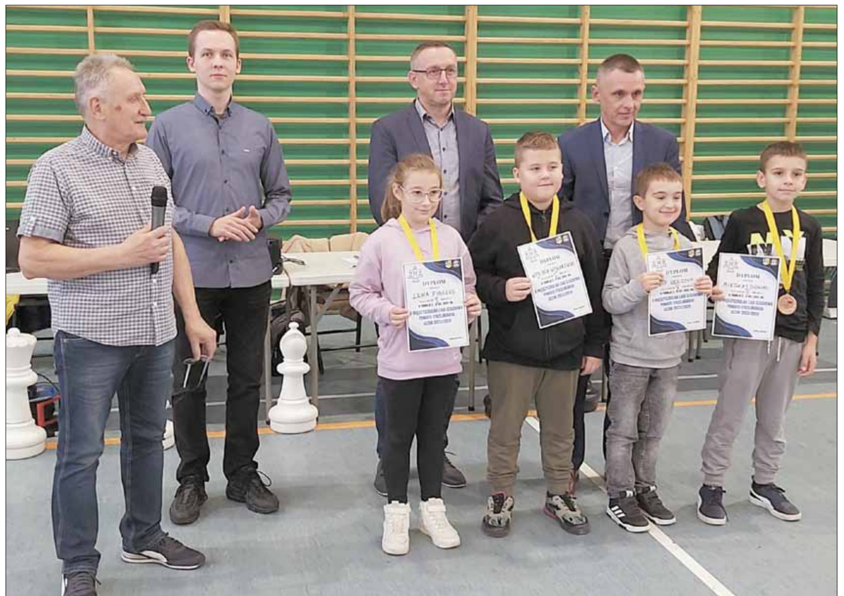
Oto laureaci najmłodszej kategorii wiekowej rocznik 2014 i młodszy

edycja Międzyszkolnej Ligi Szachowej Powiatu Strzeleńskiego to dziesięć turniejów. Kolejne zaplanowano: 22.11.2023 r., 12.12.2023 r., 8.01.2024 r., 9.02.2024 r., 7.03.2024 r., 10.04.2024 r., 7.05.2024 r., 10.06.2024 r.