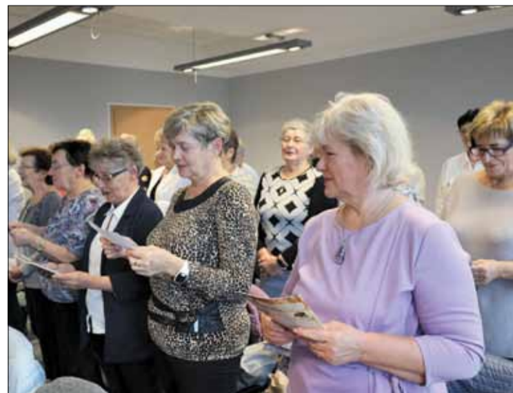
Seniorzy należący do Uniwersytetu Trzeciego Wieku w Strzelinie rozpoczęli kolejny rok akademicki