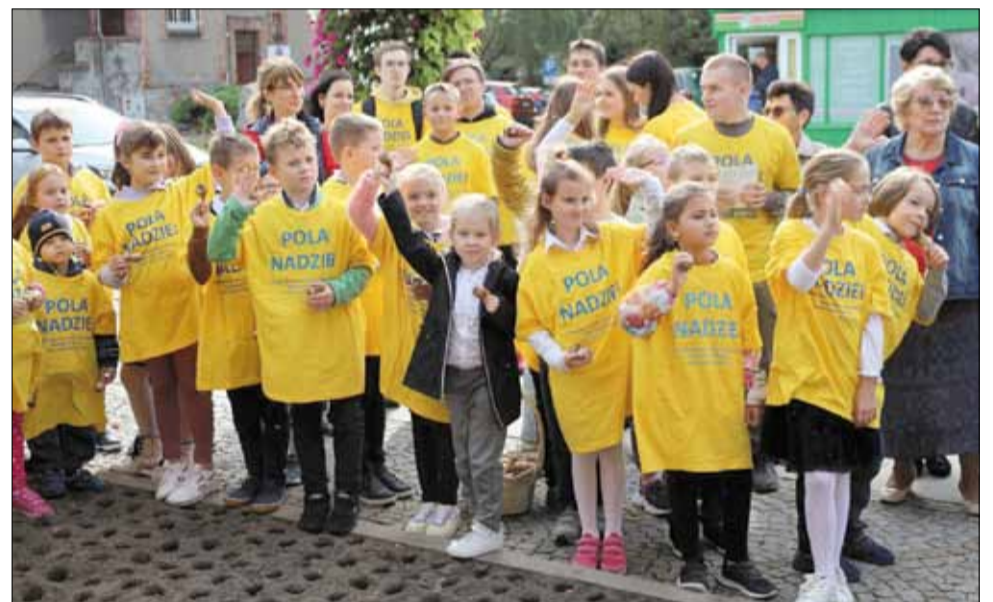
Tradycyjnie w akcję sadzenia żonkili włączyli się m.in. uczniowie lokalnych szkół