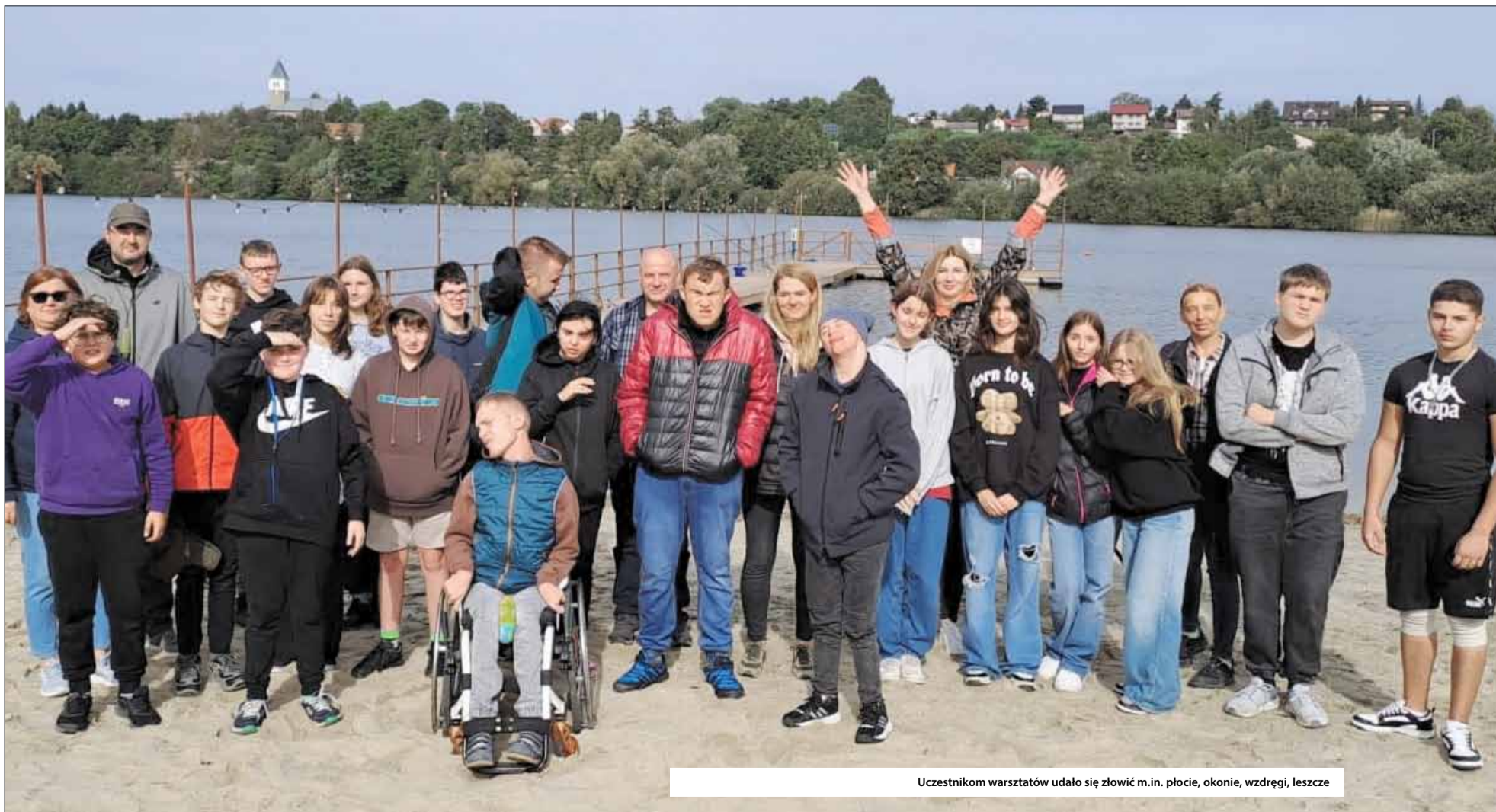
Uczestnikom warsztatów udało się złowić m.in. płocie, okonie, wzdręgi, leszcze

i zanęty dla ryb. Uczestnicy warsztatów mieli niezłe branie, wspólnymi siłami udało się złowić: płocie, okonie, wzdręgi, leszcze. Wszystkie ryby w dobrej kondycji wróciły do wody.