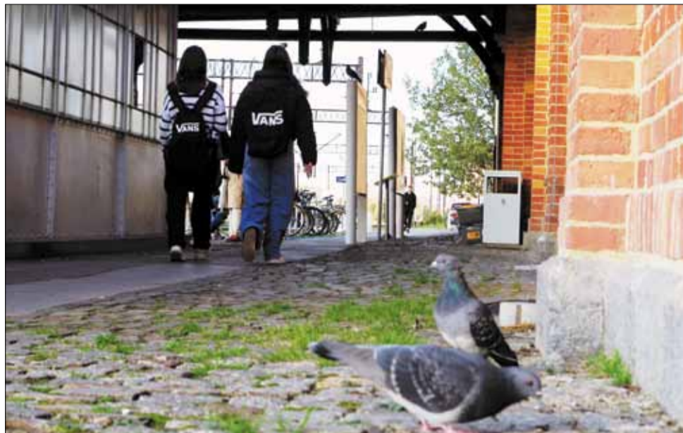
RED Obecność gołębi na strzeleńskim dworcu wiąże się z dużym problemem

Urząd Miasta i Gminy w Strzelinie poinformował mieszkańca, że perony dworca PKP w Strzelinie nie stanowią własności Gminy Strzelin i samorząd nie ma możliwości ani podstaw do zamontowania „wróblownic”. Strzeleński magistrat wniosek mieszkańca przekazał jednak instytucji, która jest właścicielem obiektu czyli do PKP Polskie Linie Kolejowe S.A. - Zakład Linii Kolejowych w Opolu. Niedawno zarządca dworca poinformował urząd i wnioskodawcę, że zawarł już umowę z wykonawcą i do 30 listopada na peronach dworca zostanie zamontowane zabezpieczenie przed ptakami. – Myślimy, że problem ciągłego brudzenia przez gołębie zostanie wyeliminowany – napisano w piśmie z PLK S.A. Zakład Linii Kolejowej w Opolu.