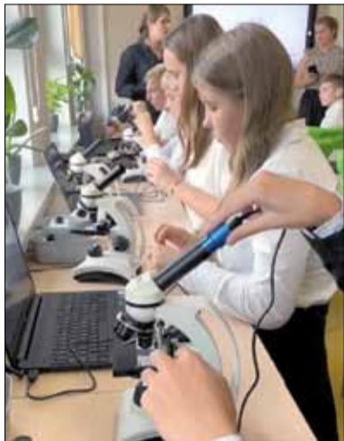
Wśród bogatego wyposażenia pracowni są m.in. zestawy preparatów mikroskopowych

Dzięki inwestycji uczniowie będą mogli zgłębiać tajniki wiedzy przy użyciu nowoczesnych narzędzi dydaktycznych. Nowoczesna ekopracownia wyposażona jest nie tylko w nowe meble, stoliki i regały, ale przede wszystkim w sprzęt - interak-