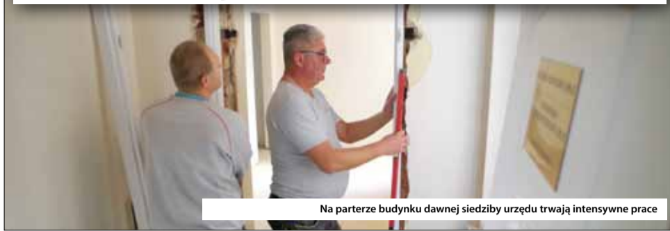
Na parterze budynku dawnej siedziby urzędu trwają intensywne prace

kości 178 tys. zł. Wyodrębniona zostanie przestrzeń m.in. na salę spotkań, szatnię, kuchnię, bibliotekę, czytelnię, salę komputerową, pomieszczenie gospodarcze, toalety. Oczywiście pomieszczenia zostaną wyposażone w meble oraz niezbędny sprzęt. Roboty budowlane wykonuje wyłoniona w ramach przetargu lokalna firma Zakład Handlowo-Usługowy Konrad-Bud Tadeusza Jakubowskiego.