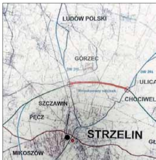
Na mapie, w kolorze czerwony zaznaczono odcinek planowanego łącznika

Planowane połączenie dwóch dróg wojewódzkich nr 395 i 396 ma zostać wytyczone częścią trasy przyszłej obwodnicy Strzelina. Dokładnie trasa miałaby przebiegać między Ulicą a Chociwem i łączyć się z drogą wylotową na Wrocław przed Ludowem Polskim (patrz mapa). Intencją samorządów jest podjęcie