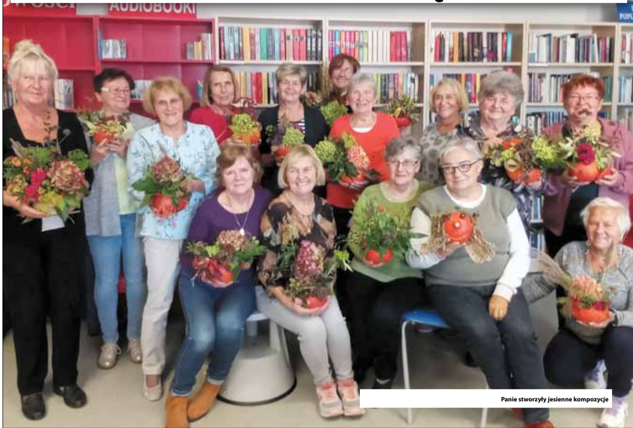
Panie stworzyły jesienne kompozycje

W ramach corocznych Senioraliów, w strzeLińskiej bibliotece odbyły się warsztaty pt. „Dyniowe inspi-