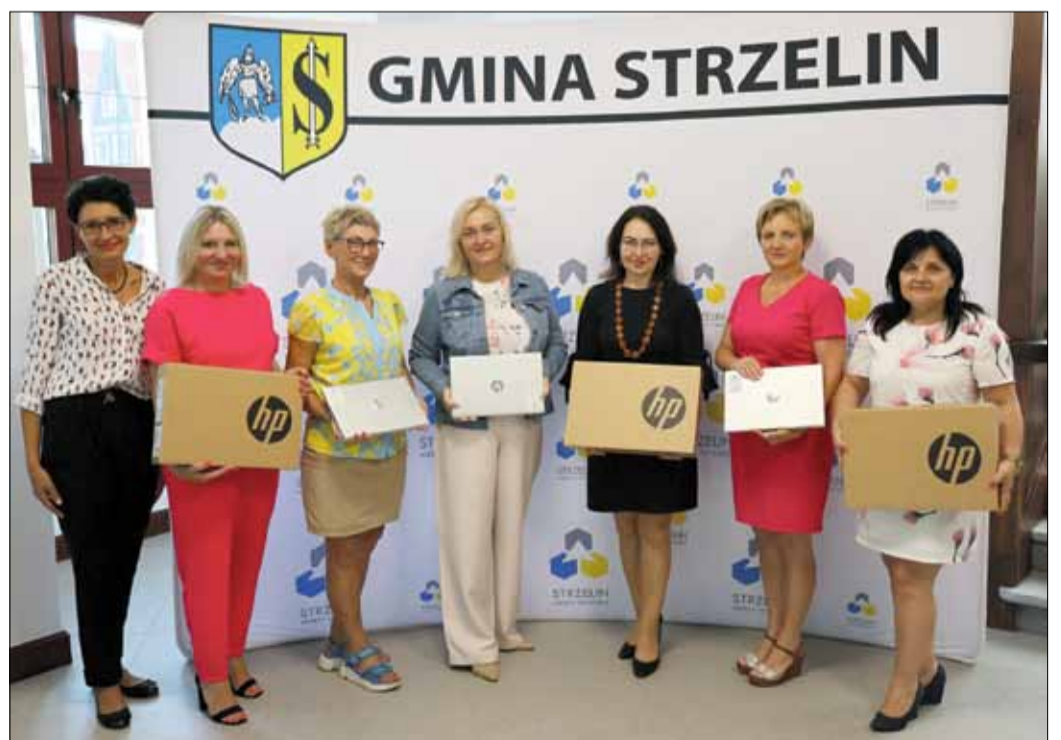
Dyrektorzy gminnych placówek oświatowych odebrali z rąk burmistrza Strzelina laptopy, które trafią do uczniów czwartych klas