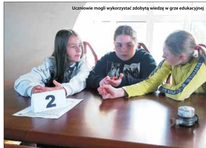
Uczniowie mogli wykorzystać zdobytą wiedzę w grze edukacyjnej

W środę, 11 października Zakład Wodociągów i Kanalizacji w Strzelinie gościł w siedzibie uczniów Szkoły Podstawowej w Białym Kościele. Wizyta odbyła się w ramach Edukacji Ekologicznej. Celem spotkania było zwiększenie świadomości uczestników jak cennym surowcem jest woda. Warsztaty zostały podzielone na trzy części. Pierwszą z nich była prezentacja, która zawierała informacje dotyczące procesu produkcji wody, sposobów oszczędzania, przedstawienie obiektów zakładu wodociągów oraz zagrożeń wynikających z nieprzestrzegania zasad prawidłowego korzystania z sieci kanalizacyjnej. W kolejnej części uczniowie mogli wykorzystać oraz utrwalić wiedzę w grze edukacyjnej pn. „Milionerzy”. Zwycięzcom wręczono drobne upominki oraz butelki filtrujące wodę. W ostatniej części uczestnicy mieli możliwość zapoznania się z procesem technologicznym Stacji Uzdatniania Wody w Strzelinie.