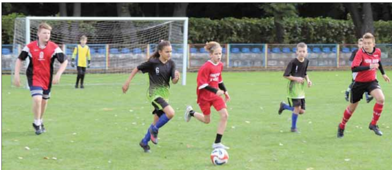
W turnieju wystartowało aż 17 drużyn reprezentujących szkoły z powiatu strzelińskiego

opr. na podstawie informacji z KPP Strzelin