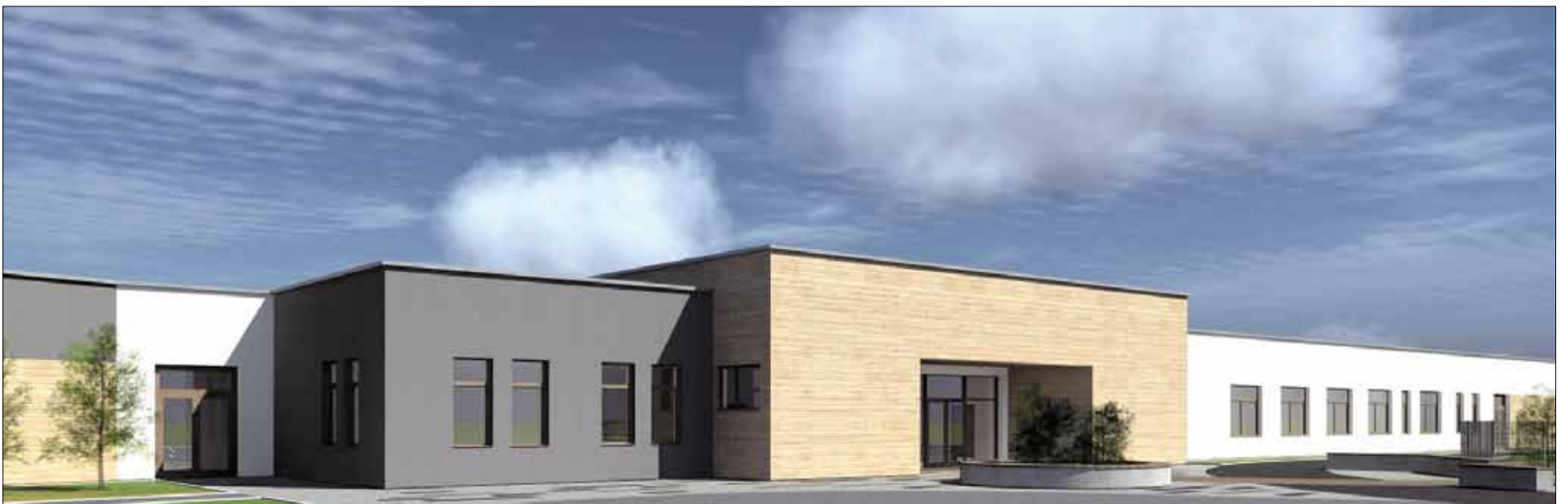
Tak ma wyglądać nowe przedszkole, które powstanie przy ul. Brzegowej w Strzelinie