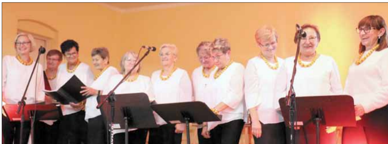
Na scenie zaprezentowało się m.in. Stowarzyszenie Słoneczna Droga z Białego Kościoła