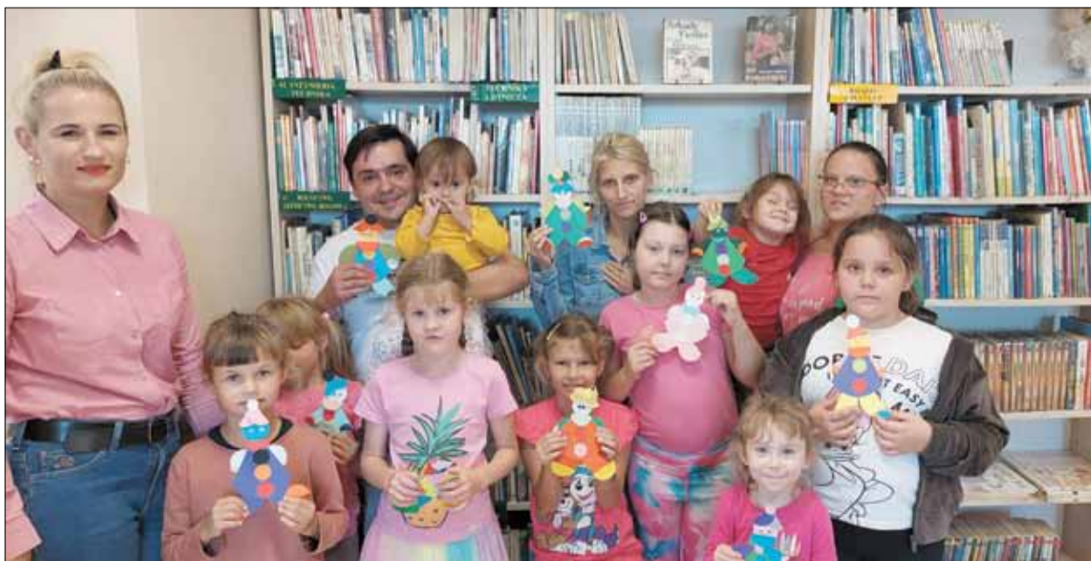
Dzieci wykonały oryginalne pajacyki metodą origami płaskiego z koła