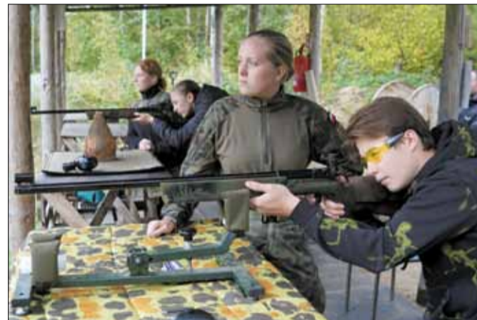
Zawody, w których wzięli udział m.in. uczniowie strzeleńskich szkół odbyły się na terenie strzelnicy w Krzelkowie

Katolickie Liceum Ogólnokształcące w Henrykowie organizuje cykl zawodów sportowo-obronnych pn. „Sprawni jak kadeci” skierowanych do szkół podstawowych z gminy Strzelin i Ziębice. Program zakłada pięć spotkań - trzy na