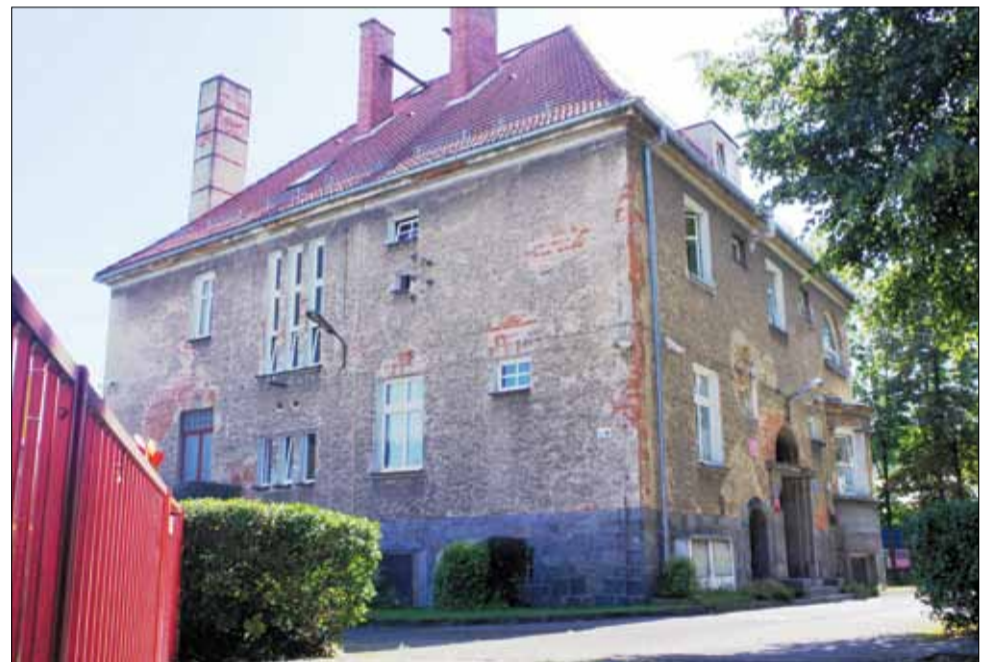
W budynku, w którym obecnie mieści się przedszkole i żłobek „Bajka” samorząd gminny uruchomi w przyszłym roku publiczny żłobek i przedszkole