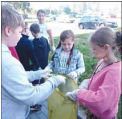
Udział uczniów „Czwórki” w corocznej akcji sprzątania świata to już tradycja

Co roku uczniowie starszych i młodszych klas Publicznej Szkoły Podstawowej nr 4 w Strzelinie biorą udział w akcji pn. „sprzątanie świata”. Tegoroczna edycja została poprzedzona warsztatami dotyczącymi prawidłowej segregacji odpadów. Uczniowie oglądali filmy podczas lekcji przyrody. Był również czas na pokaz worków do segregacji oraz trening praktyczny dotyczący kolorów worków oraz przypisanych im odpadów. Zwieńczeniem całości było sprzątanie i segregacja śmieci na pobliskich chodnikach i trawnikach.