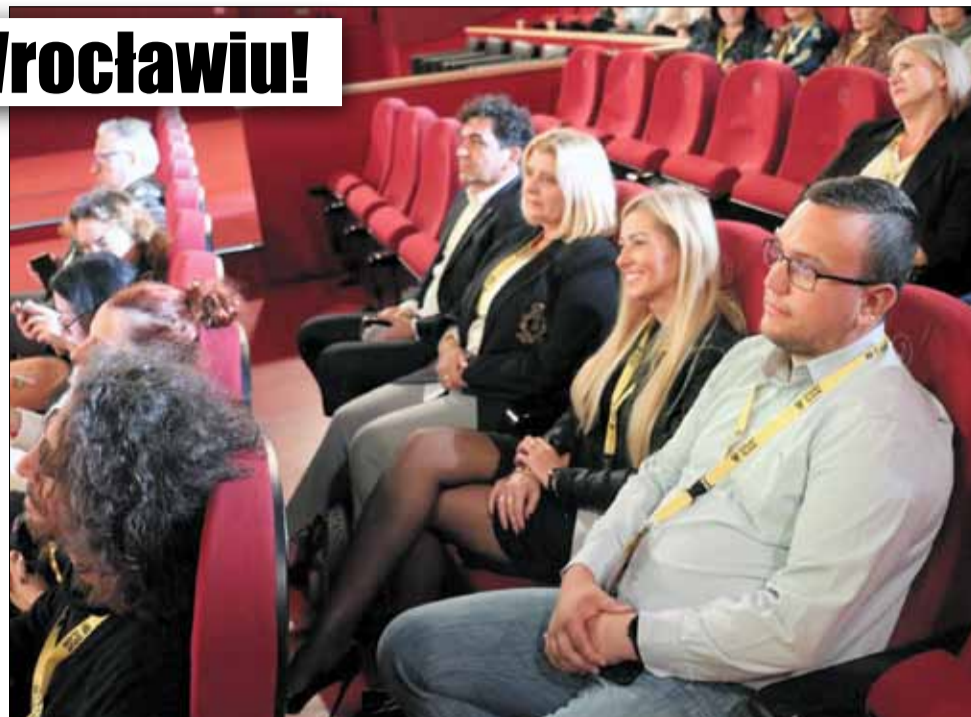
SOK Reprezentacja Strzeleńskiego Ośrodka Kultury wzięła udział w Dolnośląskim Kongresie Kultury

- Zawsze chętnie poszerzamy horyzonty współpracy i działalności kulturalnej. Rozwijamy się dla Was – czytamy na profilu facebookowym Strzeleńskiego Ośrodka Kultury, tuż po powrocie z kongresu.