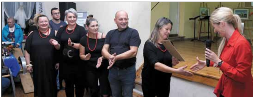
Atrakcyjne nagrody ufundowali lokalni sponsorzy