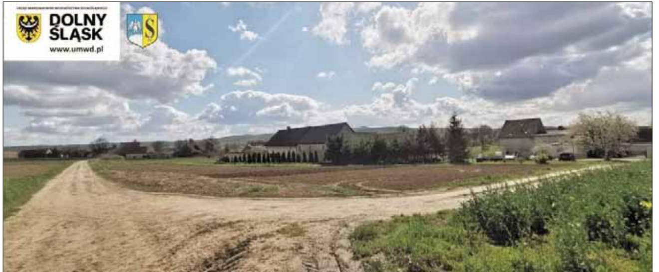
RED Remont dotyczy blisko 400-metrowego odcinka drogi śródpolnej