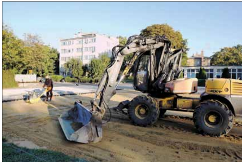
W obrębie ulic Kościelnej, Staszica i Rycerskiej dostępnych będzie kilkadziesiąt miejsc parkingowych

Wracamy do opisywanej na łamach naszej gazety budowy miejsc parkingowych w pobliżu strzełińskiego Rynku. Przypomnijmy, że strzełiński samorząd od wielu miesięcy pracował nad rozwiązaniem kwestii parkowania w rejonie Rynku po przeniesieniu magistratu do odbudowanego Ratusza. Jedno z nich zakłada zagospodarowanie placu przy starym browarze (w obrębie ulic: Kościelnej, Staszica i Rycerskiej). Ostatecznie, w uzgodnieniu z Dolnośląskim Wojewódzkim Konserwatorem Zabytków opracowano projekt, który zakłada stworzenie w tym miejscu kilkadziesiąt miejsc parkingowych, bez ich wyznaczenia. W drugiej połowie października ruszyły roboty, a inwestycję wykonuje strzełińska firma M-Projekt. Zakres prac obejmuje profilowanie gminnego terenu położonego pomiędzy ulicami: Kościelną, Rycerską i Staszica oraz ułożenie geokraty parkingowej, wraz z wypełnieniem materiałem kamiennym. Wjazd na parking będzie możliwy od strony ulicy Rycerskiej, czyli bezpośrednio przy starym browarze. Drzewa, które rosną na placu zostaną na swoim miejscu. Inwestycja ma być realizowana do końca listopada.