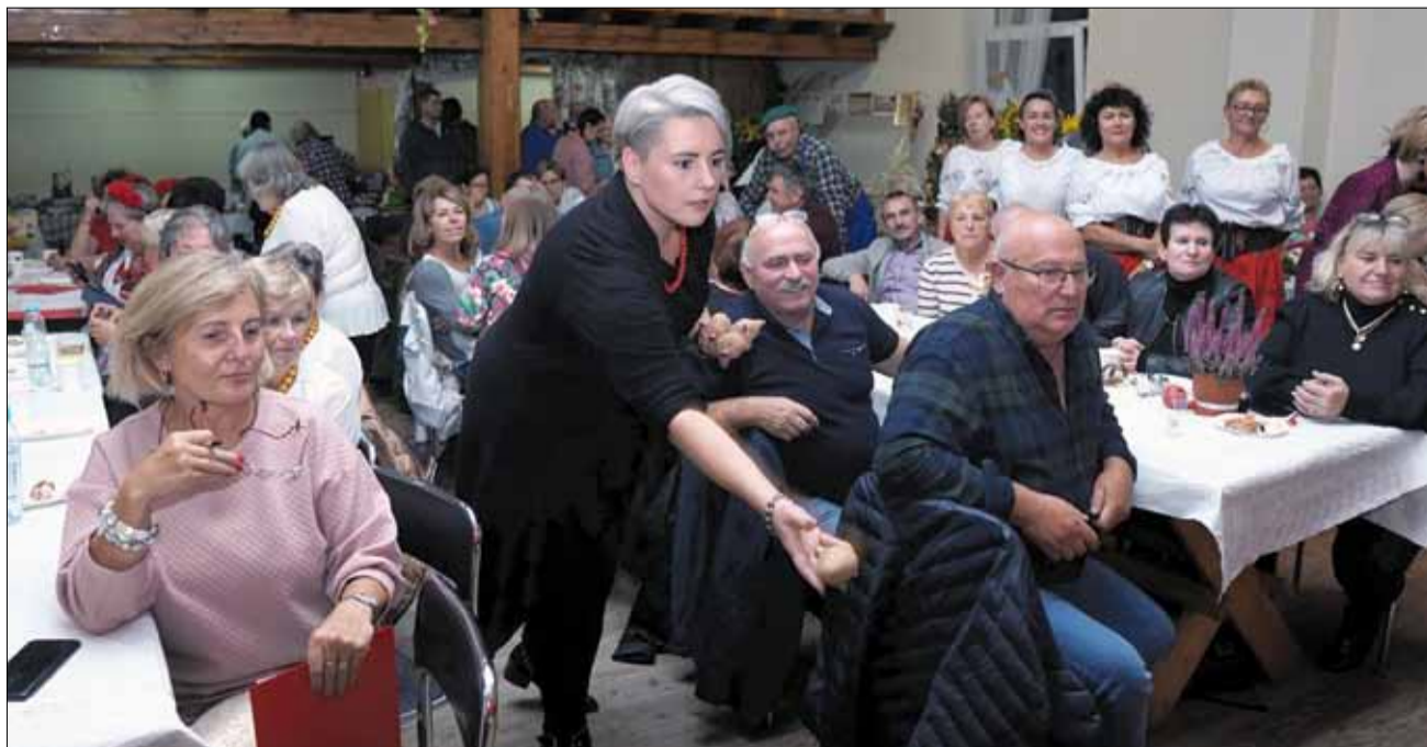
Mimo rywalizacji panowała miła i radosna atmosfera