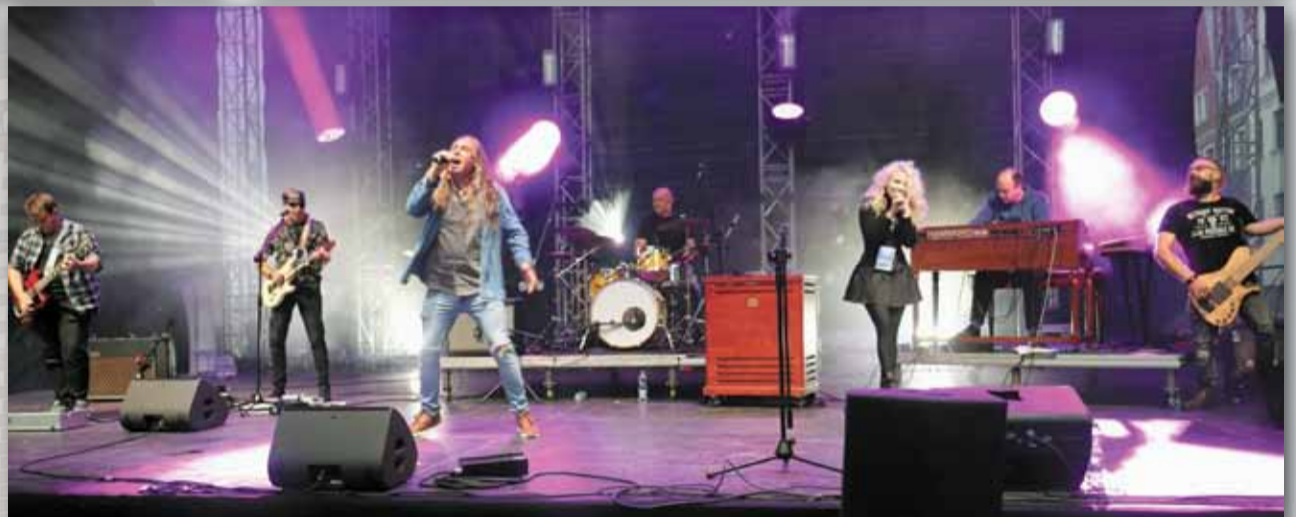
Classic Rock Band