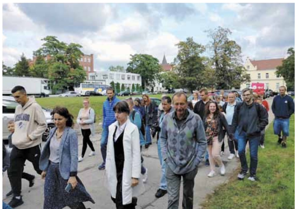
Wycieczka cieszyła się dużym zainteresowaniem