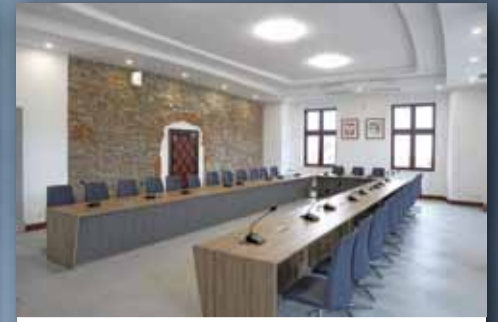
SALA OBRAD, W KTÓREJ ODBYWAJĄ SIĘ SESJE RADY MIEJSKIEJ STRZELINA