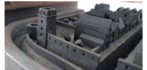
Artyści umiejętnie odwzorowali wygląd XVIII-wiecznego Strzelina