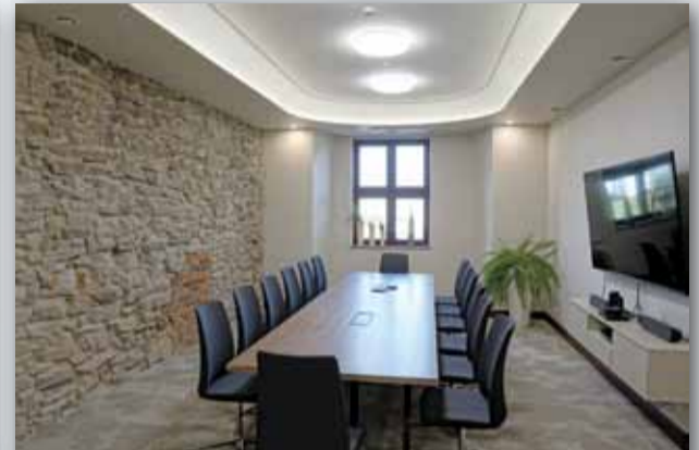
SALA NARAD PRZY SEKRETARIACIE BURMISTRZA