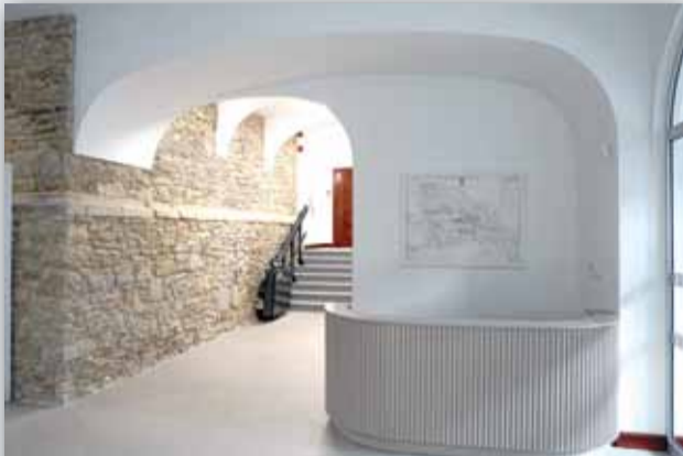
HOL NA PARTERZE URZĘDU

Prezentujemy fotoreportaż pokazujący wybrane pomieszczenia strzełińskiego ratusza, który po odbudowie stał się nową siedzibą lokalnych władz: Burmistrza Miasta i Gminy Strzelin, Rady Miejskiej Strzelina oraz Urzędu Miasta i Gminy w Strzelinie. W ratuszu działa również Terenowe Biuro Paszportowe. Zachęcamy do odwiedzania ratusza.