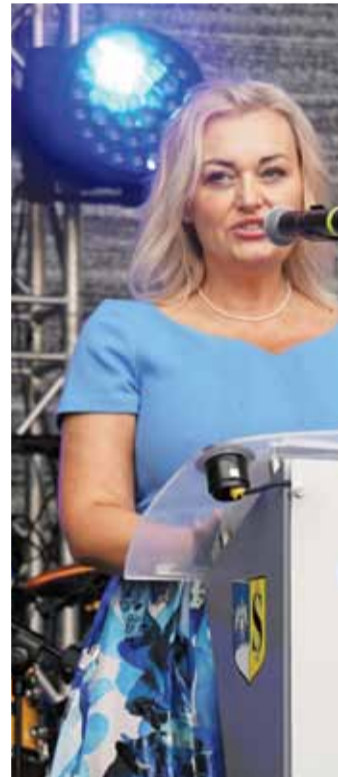
Historię ratusza i jego odbudowy przed...

odbudowę ratusza. Niestety, mimo licznych prób środków nie udało się pozyskać. Podstawową przyczyną takiego stanu rzeczy była wysoka szacunkowa kwota odbudowy ratusza wynosząca blisko 12 mln PLN. Głównie z tego powodu zdecydowano się na etapowanie odbudowy budynku ratusza wraz z wieżą ratuszową. Miało to umożliwić dalszą odbudowę ratusza. W roku 2007 dokumentację techniczną odbudowy ratusza podzielono na etapy realizacji. Etapem przewidzianym w I kolejności do realizacji była odbudowa całości wieży ratuszowej tj. od 20,5 m do 72,20m wraz z odgruzowaniem piwnic od wschodniej pierzei rynku. Na taki zakres prac udało się pozyskać zewnętrzne środki finansowe z Regionalnego Programu Operacyjnego – Turystyka Zabytkowa. Wykonawcą tych prac była firma z Nysy. Prace realizowane były w okresie od czerwca 2010 r. do listopada 2011 r. W wyniku przeprowadzonych robót stan wieży ratuszowej został doprowadzony do stanu, w jakim widzimy go w dniu dzisiejszym.