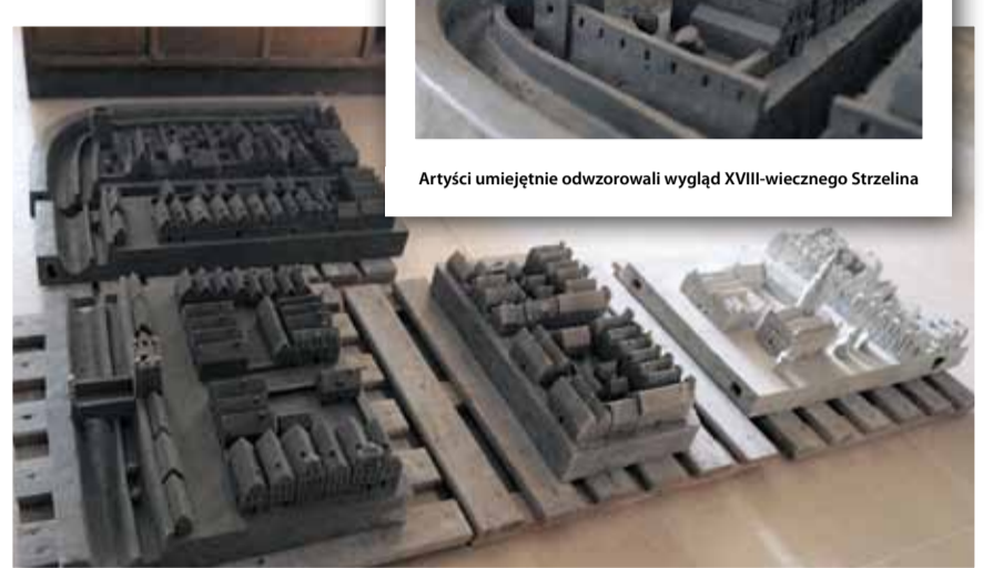
Makieta składa się z kilku części, które finalnie zostaną połączone w jedną całość