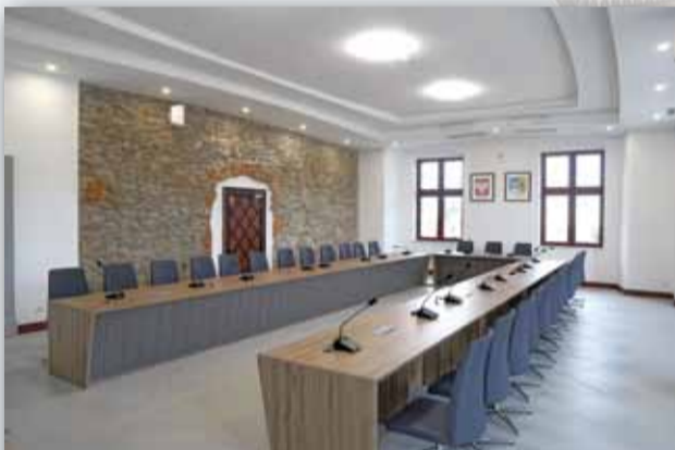
SALA OBRAD, W KTÓREJ ODBYWAJĄ SIĘ SESJE RADY MIEJSKIEJ STRZELINA