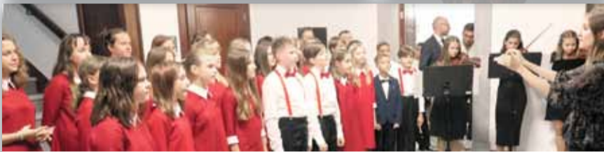
Koncert Uczniów i Nauczycieli ze Szkoły Muzycznej I stopnia w Strzelinie