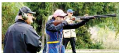
W zawodach uczestniczyły również panie