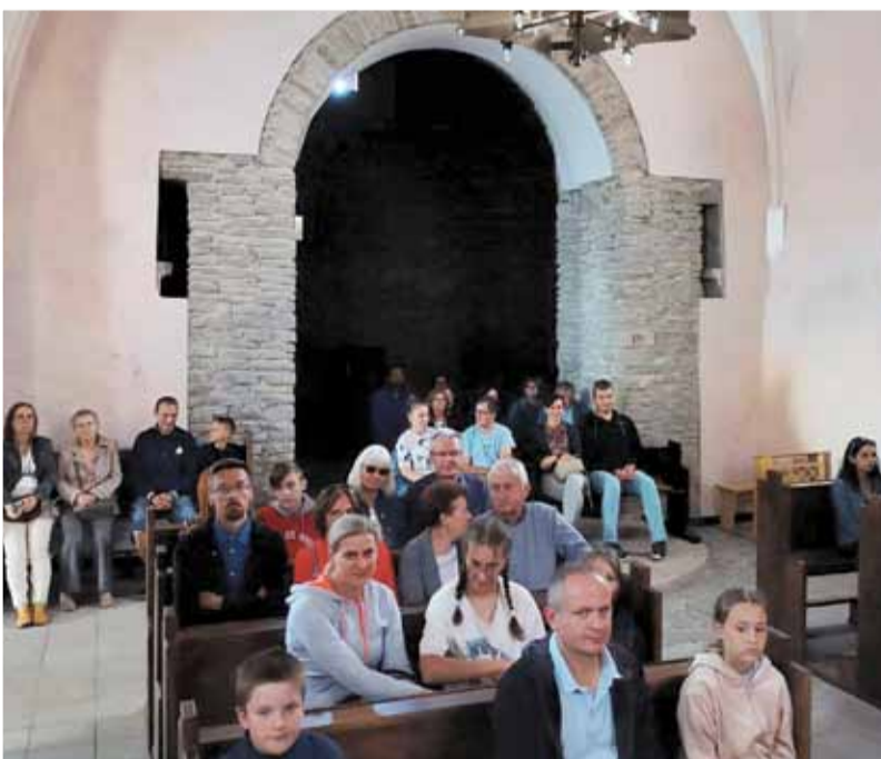
W programie wycieczki było m.in. zwiedzanie Rotundy św. Gotarda