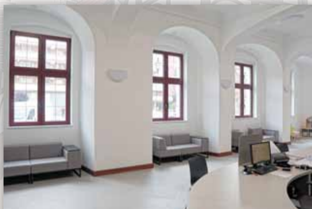
W BIURZE OBSŁUGI KLIENTA MOŻNA POCZEKAĆ NA ZAŁATWIENIE SWOJEJ SPRAWY