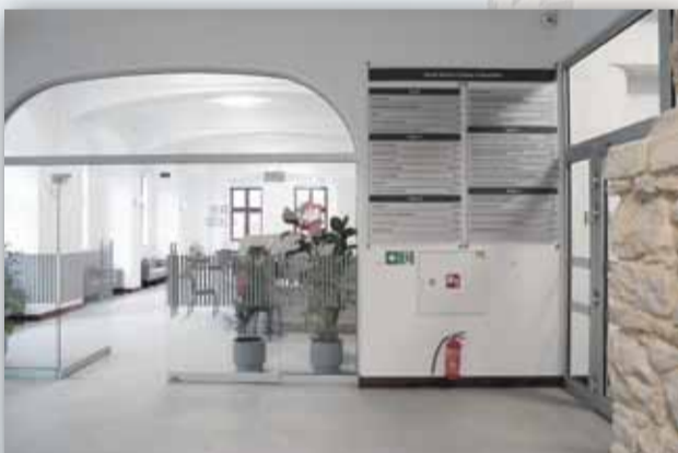
WEJŚCIE DO BIURA OBSŁUGI KLIENTA