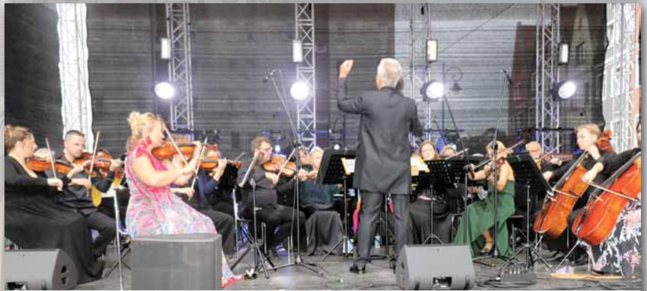
Orkiestra Filharmonii Sudeckiej