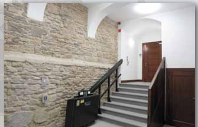
RATUSZ JEST DOSTOSOWANY DO POTRZEB OSÓB NIEPEŁNOSPRAWNYCH