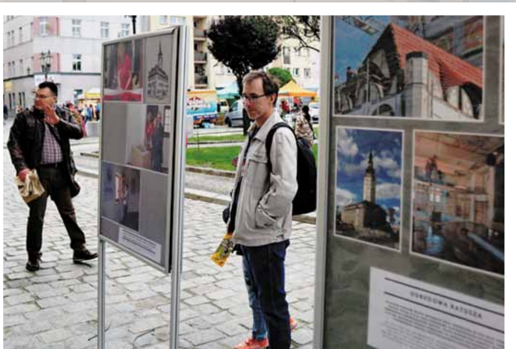
Wystawa wzbudziła duże zainteresowanie