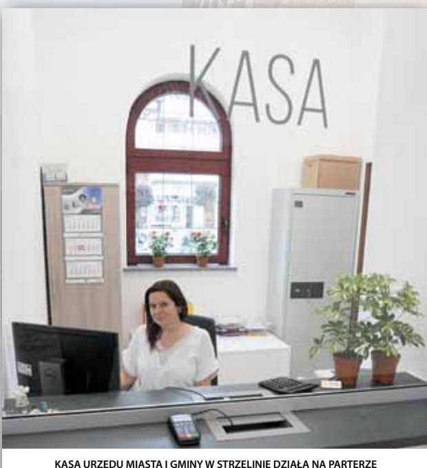
KASA URZĘDU MIASTA I GMINY W STRZELINIE DZIAŁA NA PARTERZE