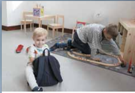
W BIURZE OBSŁUGI KLIENTA JEST KĄCIK DZIECIĘCY