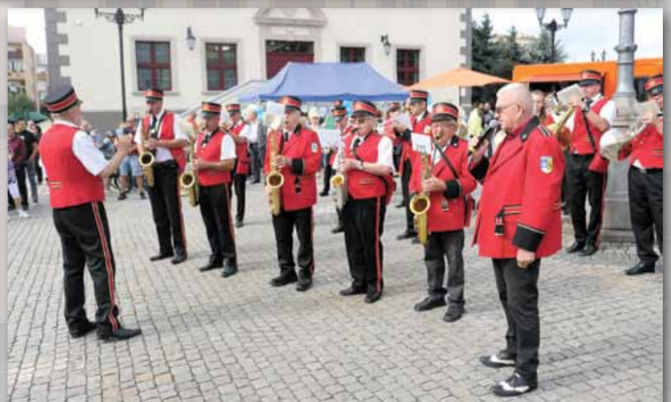
Strzełińska Orkiestra Dęta