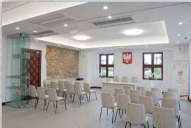
SALA ŚLUBÓW URZĘDU STANU CYWILNEGO W STRZELINIE