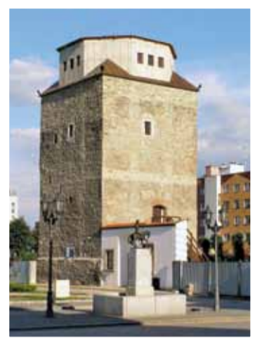
fol. M. Kępa