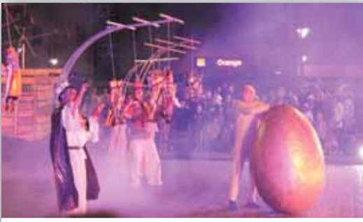
Teatr Kliniki Lalek