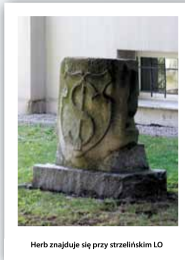
Herb znajduje się przy strzełińskim LO