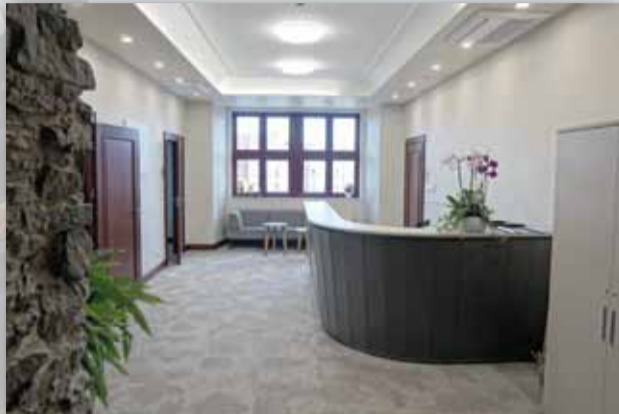
SEKRETARIAT BURMISTRZA MIASTA I GMINY STRZELIN