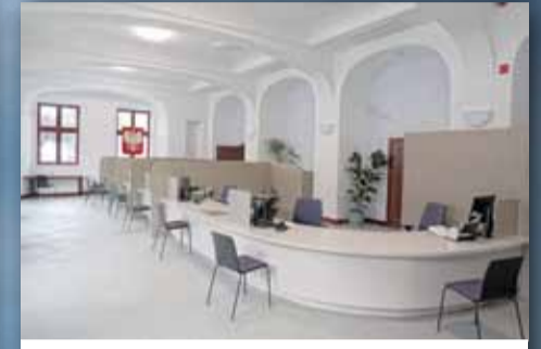
BIURO OBSŁUGI KLIENTA