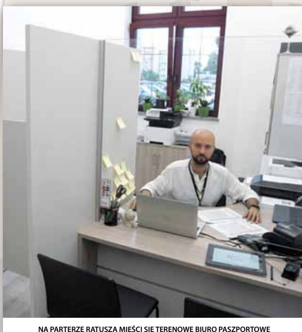
NA PARTERZE RATUSZA MIEŚCI SIĘ TERENOWE BIURO PASZPORTOWE