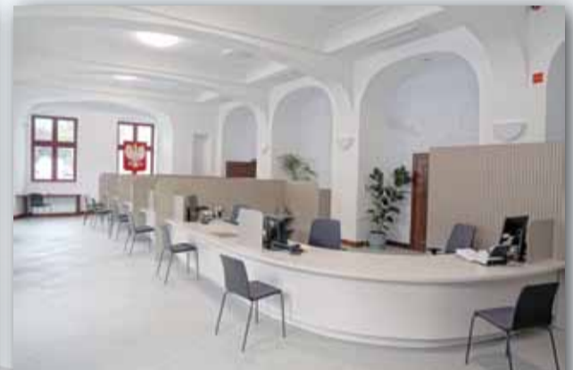
BIURO OBSŁUGI KLIENTA