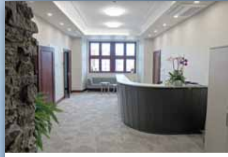
SEKRETARIAT BURMISTRZA MIASTA I GMINY STRZELIN