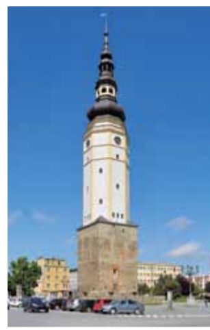
fol. M. Kępa