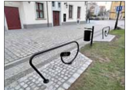
W strzeLińskim Rynku pojawiło się udogodnienie, z którego zadowoleni będą rowerzyści

Dzięki temu udogodnieniu rowerzyści będą mogli bezpiecznie zostawić swój jednolad i załatwić sprawy w Rynku, w tym także w magistracie.