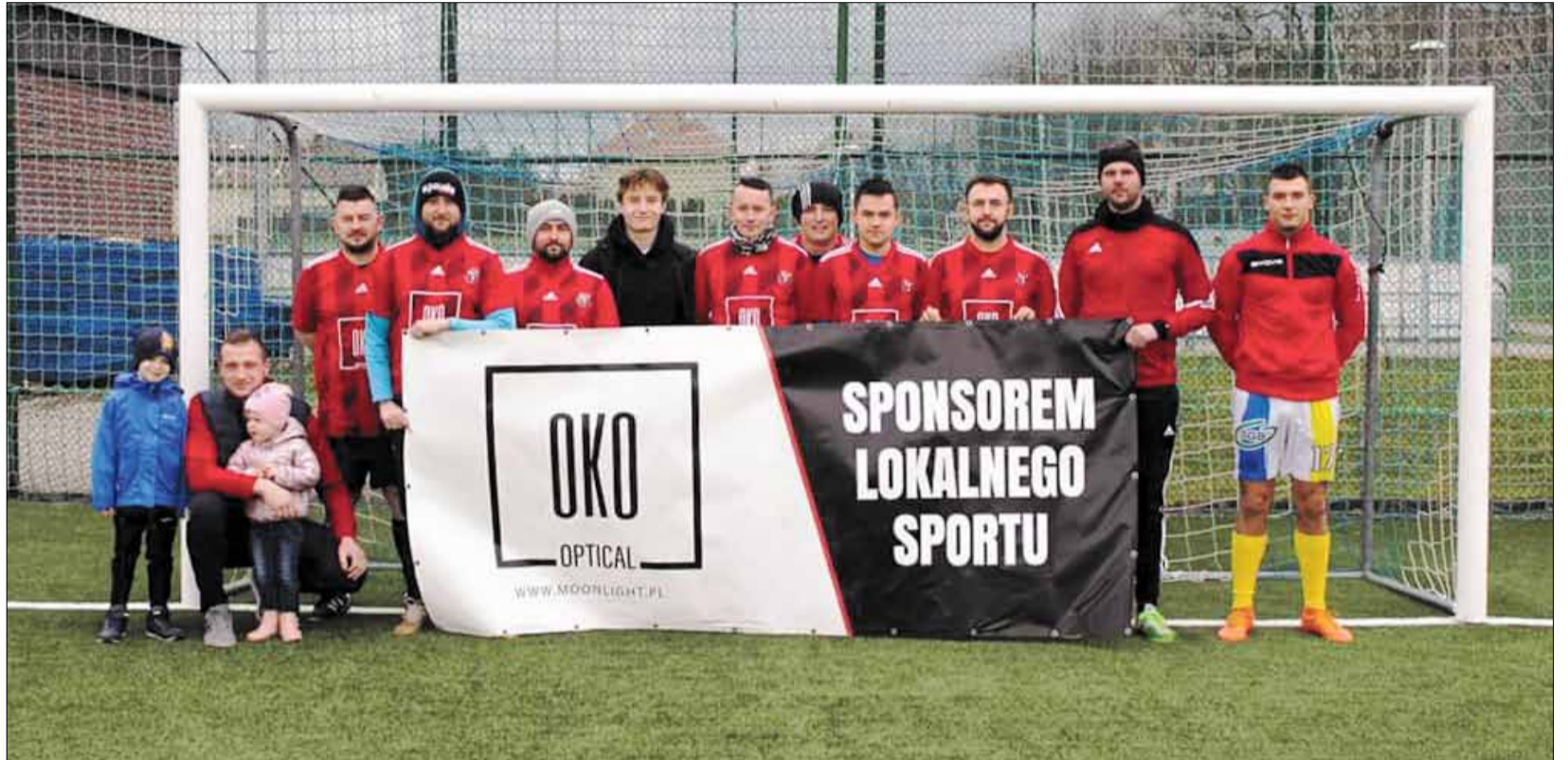
Tegoroczną edycję zimowych rozgrywek wygrał zespół OKO Optical