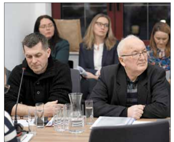
Sołtysi oraz przewodniczący zarządów osiedli licznie przybyli na spotkanie noworoczne z władzami Gminy Strzelin

Ostatnim punktem w programie spotkania były sprawy bieżące, w których pojawił się m.in. temat inwestycji drogowych, współpracy z samorządem powiatowym itp.