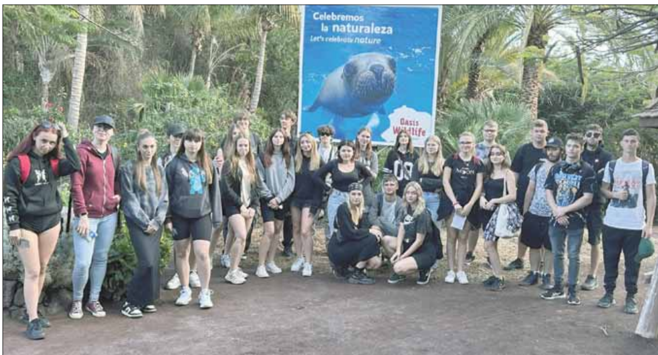
Uczniowie nie tylko pracowali, ale mieli również możliwość zwiedzania