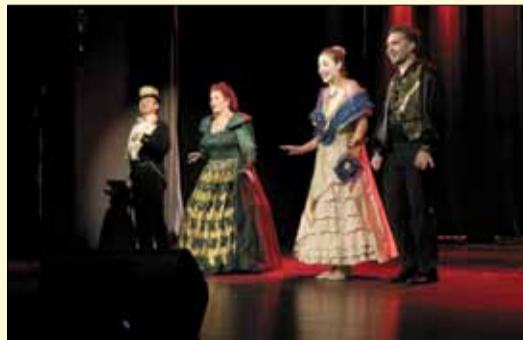
Artysty wykonali ponadczasowe przeboje, które podbiły sceny muzyczne na całym świecie