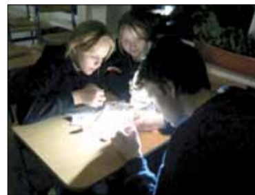
Uczestnicy zabawy większość zadań musieli wykonać w ciemności lub przy świetle kieszonkowych latarek

W piątek, 16 lutego w Publicznej Szkole Podstawowej nr 5 w Strzelinie odbyła się kolejna edycja projektu pn. „Nocna Przygoda z Historią”. Tym razem szkolne mury zamieniły się w powstańczą Warszawę, a uczniowie w żołnierzy Armii Krajowej.