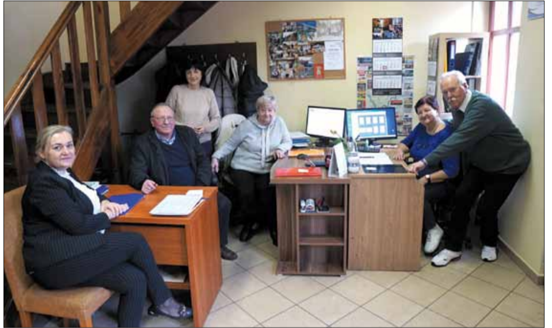
Strzeleńskim oddziałem Polskiego Związku Emerytów, Rencistów i Inwalidów pozyskał do biura dwa komputery