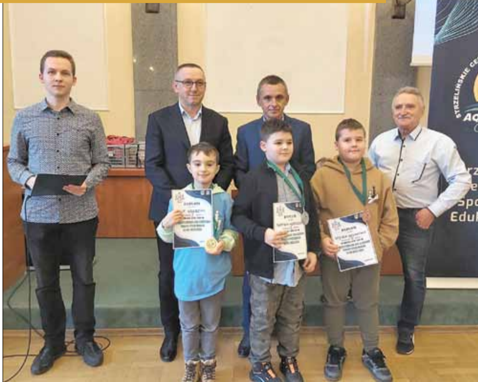
RED Oto zwycięzcy szóstego turnieju w kategorii rocznik 2010 i młodszy

Kolejne zawody zaplanowano: 7.03.2024 r., 10.04.2024 r., 7.05.2024 r., 10.06.2024 r.