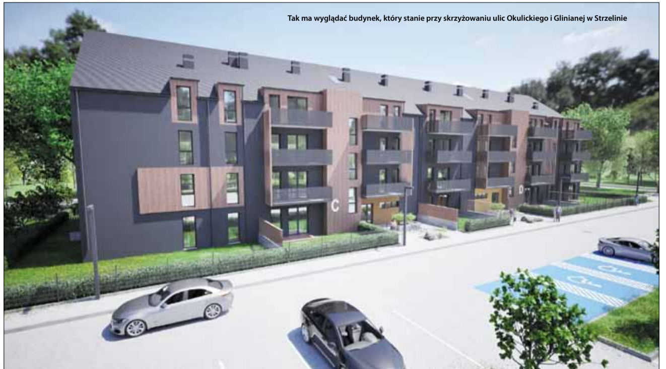
Tak ma wyglądać budynek, który stanie przy skrzyżowaniu ulic Okulickiego i Glinianej w Strzelinie

samorząd wraz ze spółką zdecydowali o budowie kolejnych budynków. Kompleks powstanie przy zbiegu ulic Okulickiego i Glinianej w Strzelinie. W pierwszym etapie nowej inwestycji budowany będzie budynek od strony ul. Glinianej, w którym znajdzie się łącznie 31 mieszkań dwupokojowych lub trzypokojowych o pow. od 45 m 2 do 65 m 2 . Do końca I kwartału 2024 r. strzeliński samorząd zamierza przekazać do spółki DTBS aportem pierwszą działkę o pow. około 3300 m 2 . Jednocześnie będzie trwał proces projektowo-budowlany, aby uzyskać pozwolenia na budowę oraz formalna strona pozyskania przez spółkę dofinansowania w oparciu o kredyt udzielony przez Bank Gospodarstwa Krajowego na preferencyjnych warunkach z wykorzystaniem środków z Funduszu Dopląt oraz innych dostępnych, bezzwrotnych źródeł finansowania zewnętrznego.