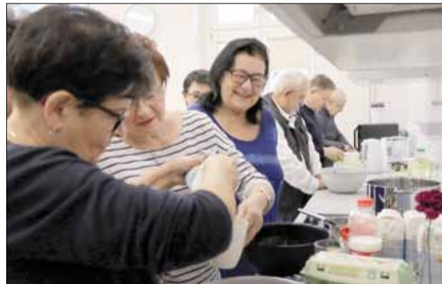
Seniorzy mają teraz odpowiednie miejsce do aktywnego spędzania czasu

Po przywitaniu gości i przemowach nadszedł czas na symboliczne przecięcie wstęgi, a następnie na zwieżdanie nowego obiektu.