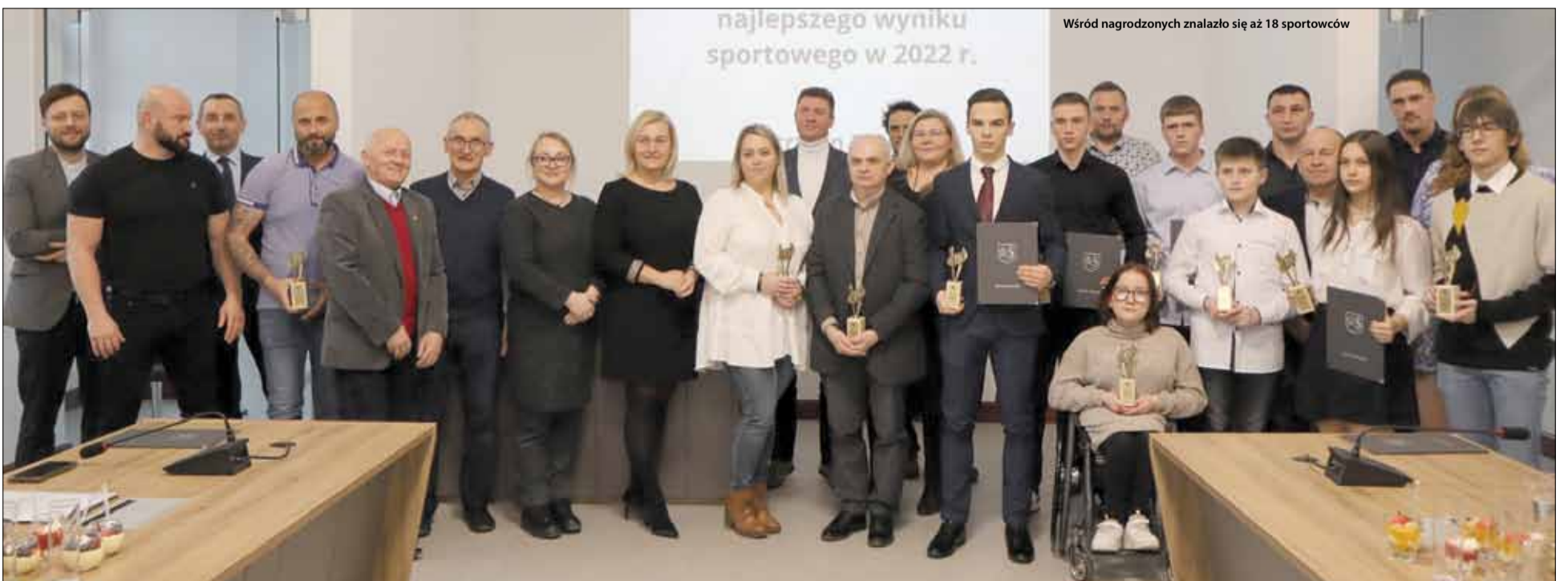
Wśród nagrodzonych znalazło się aż 18 sportowców