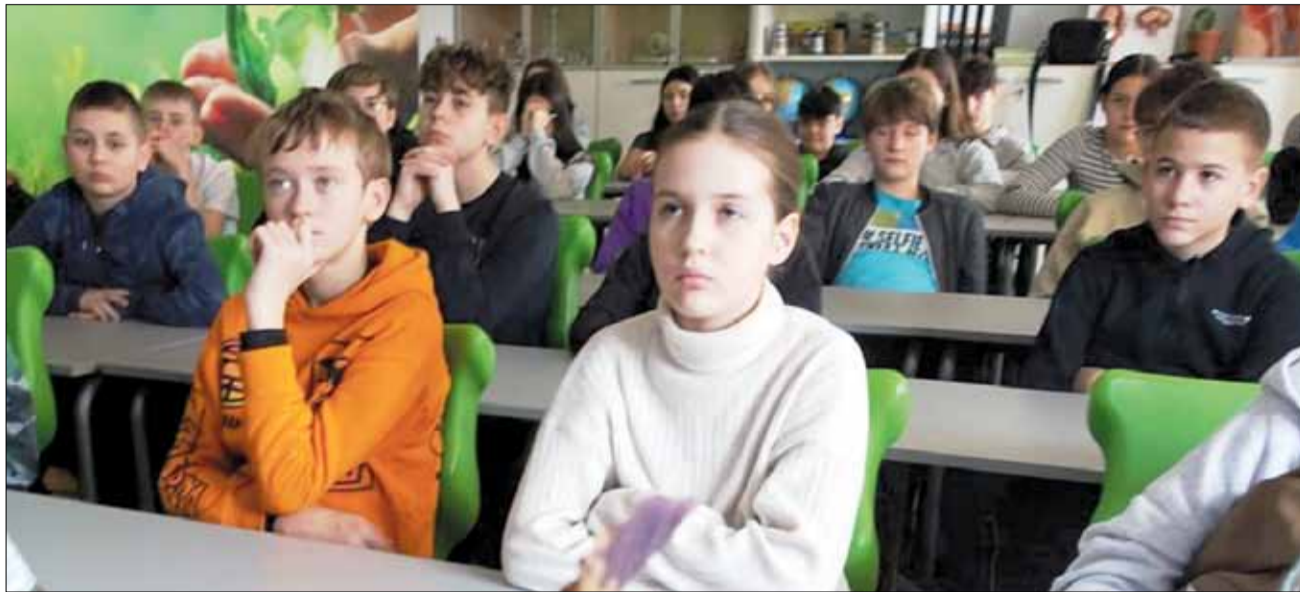
Uczniowie z uwagą słuchali zagadnień dotyczących segregacji odpadów