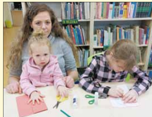
Podczas jednych z zajęć dzieci z rodzicami wykonywali kartki walentynkowe

W lutym odbyły się cztery spotkania. Najpierw najmłodszy wykonywali oryginalne kartki walentynkowe z ruchomym serduszkami. Po ciężkiej pracy, z racji wyjątkowego „tłustego czwartku”, bibliotekarki wzmocniły twórców pysznymi pączkami. Podczas kolejnych zajęć dzieci wysłuchały opowiadanie „Kotka Miłusia” w teatryku kamishibai z okazji Dnia Kota. W części praktycznej uczestnicy wykonali te zwierzątko z papieru. W drugiej połowie lutego odbyły jeszcze zajęcia pn. „domki na drzewie” oraz „trawiaste stworki”.