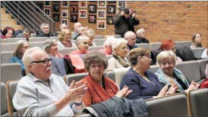
Podczas warsztatów seniorzy uzyskali szereg cennych informacji