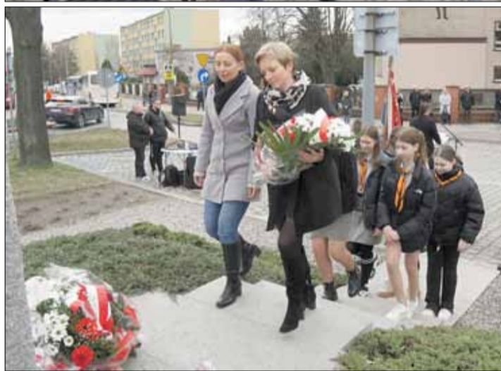
Kwiaty i znicze złożyły pod pomnikiem liczne delegacje