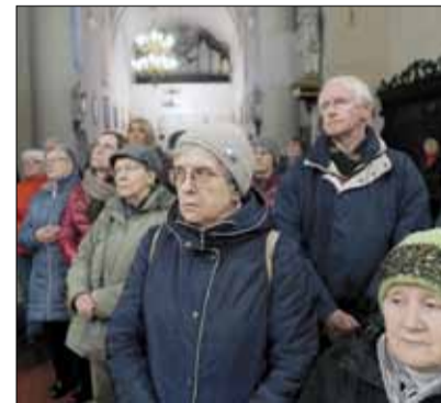
Sporo osób skorzystało z możliwości zwiedzania Kościoła pw. Podwyższenia Krzyża Świętego w Strzelinie

Gorąco zachęcamy do śledzenia profilu facebookowego Centrum Informacji Turystycznej w Strzelinie, gdzie pojawiają się zapowiedzi turystycznych wydarzeń oraz posty dotyczące naszych zabytków i innych atrakcji.