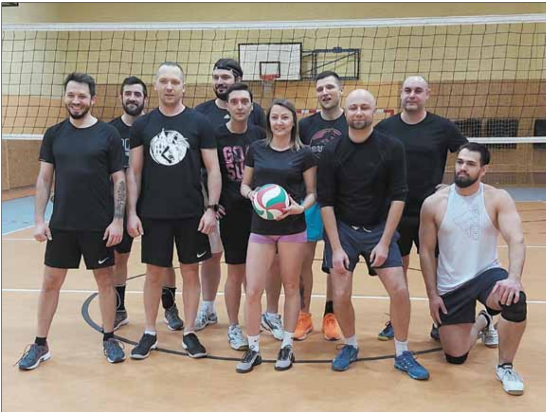
W Amatorskiej Lidze Siatkówki rywalizuje osiem drużyn (na zdjęciu jedna z ekip - White Church Volley)