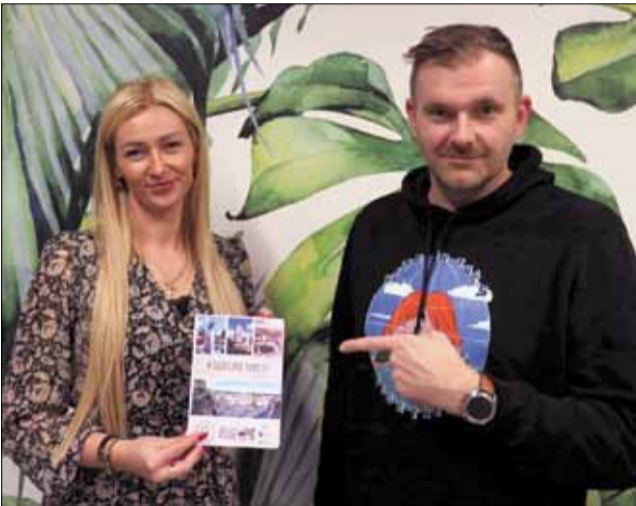
Osoby, które zbiorą co najmniej 10 pieczątek w Książeczce Turysty otrzymają nagrody

Niedługo wiosna, więc ruszy kolejny sezon turystyczny. W związku z tym Gmina Strzelin, StrzeLiński Ośrodek Kultury oraz Centrum Informacji Turystycznej przygotowali specjalną Książeczkę Turysty.