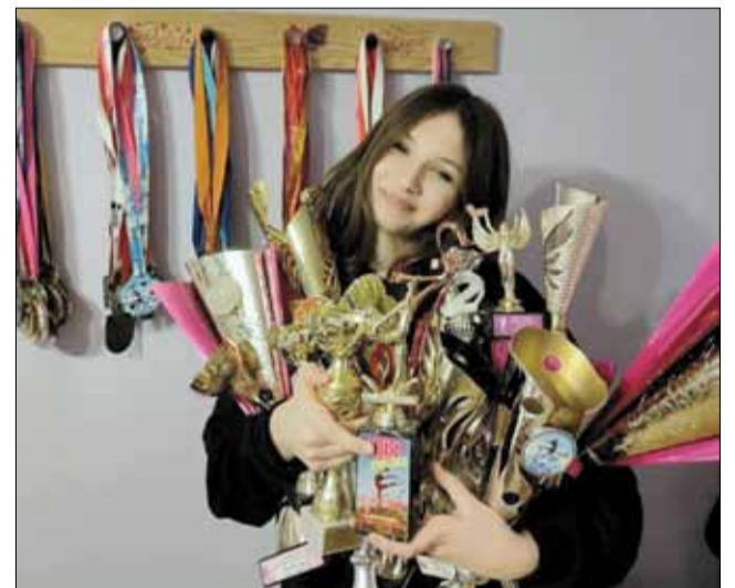
Na koncie zawodniczki jest już pokaźna liczba pucharów

lejne drzwi. Razem z kilkoma zawodniczkami Stowarzyszenia Gimnastyki Artystycznej „Gracja” wzięła udział w Międzynarodowym Turnieju Gimnastyki Artystycznej „Golden Cup” w Costa Brava w Hiszpanii. Podczas zawodów zaprezentowała układ z wykorzystaniem obręczy. - Trenowałam go wielokrotnie i pokazywałam również na innych