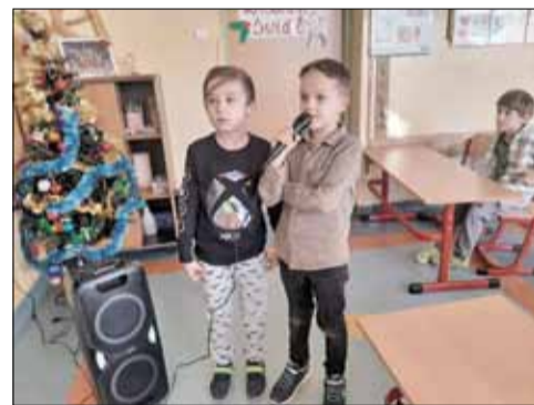
Uczniowie „Czwórki” mieli już okazję wypróbować sprzęt nagłaśniający