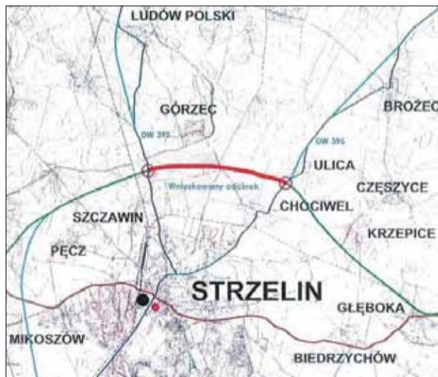
Na mapie w kolorze czerwonym zaznaczono przebieg trasy łącznika

Na łamach „Nowin Strzełińskich” poruszaliśmy już sprawę budowy pozamiejskiego łącznika dróg wojewódzkich nr 395 (kierunek Wrocław) i 396 (kierunek Olawa). Przypomnijmy, że chodzi o blisko 3 - kilometrowy odcinek, dzięki któremu ruch tranzytowy częściowo przeniósłby się poza granice miasta. Strzełiński samorząd wielokrotnie, na przestrzeni kilku lat, sygnalizował najwyższym władzom w kraju pilną konieczność budowy obwodnicy naszego miasta, która miałaby prowadzić z drogi krajowej nr 39 na wysokości Głębokiej i przebiegać za Chociwem, Szczawinem, Pęczem, a następnie łączyć się ponownie z drogą nr 39 na wysokości Piotrowic. Nie ma wątpliwości, że byłaby to ważna inwestycja dla całego regionu, lokalnych inwestorów oraz użytkowników dróg, w tym przewoźników kruszyw z lokalnych kopalni. Niestety, zadanie ujęte zostało jedynie na liście rezerwowej rządowego programu budowy 100 obwodnic na lata 2020-2030. I na razie nie wiadomo czy ma szansę doczekać się realizacji. Z tego względu Gmina Strzelin i Województwo Dolnośląskie postanowiły podjąć działania zmierzające do budowy łącznika, który leży w ciągu wspomnianej wcześniej obwodnicy Strzelina. Dokładnie trasa miałaby przebiegać między Ulicą a Chociwem i łączyć się z drogą wylotową na Wrocław przed Ludowem Polskim. Pod koniec ubiegłego roku samorządy podpisały w tej sprawie list intencyjny.