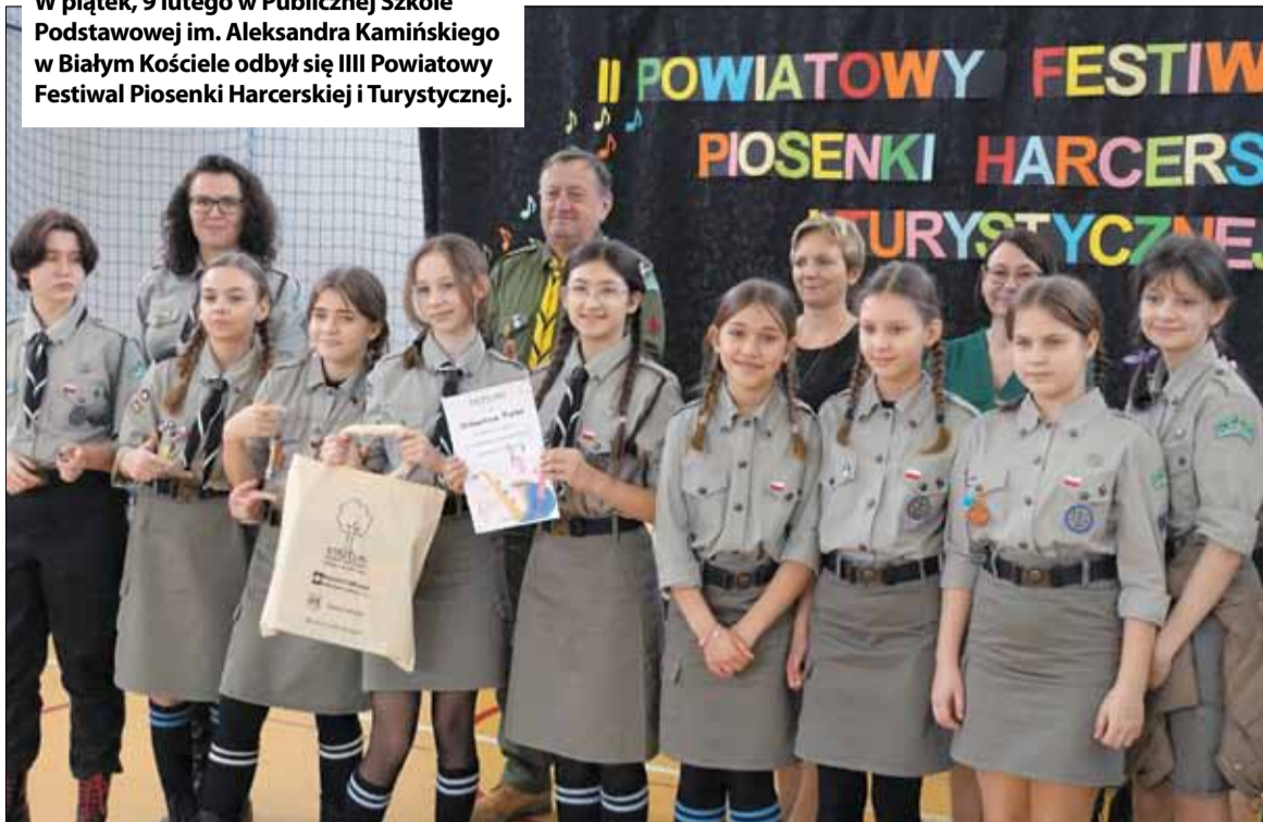
Wśród zespołów z klas IV-VIII zwyciężyła drużyna z PSP nr 5 w Strzelinie

W piątek, 9 lutego w Publicznej Szkole Podstawowej im. Aleksandra Kamińskiego w Białym Kościele odbył się III Powiatowy Festiwal Piosenki Harcerskiej i Turystycznej.