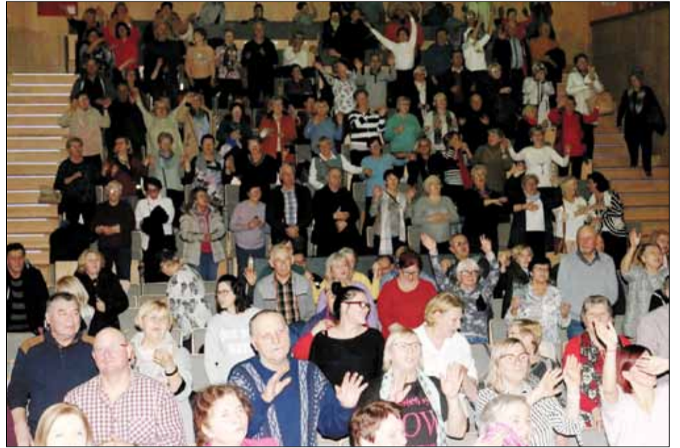
Widownia bawiła się wyśmienicie

Godnie reprezentowali naszą gminę na arenie krajowej i międzynarodowej