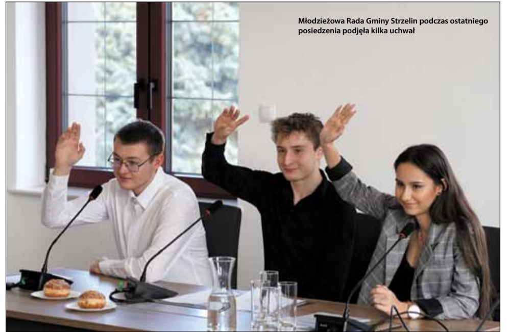
Młodzieżowa Rada Gminy Strzelin podczas ostatniego posiedzenia podjęła kilka uchwał

Trzykilometrowy odcinek drogi miałby połączyć dwie drogi wojewódzkie