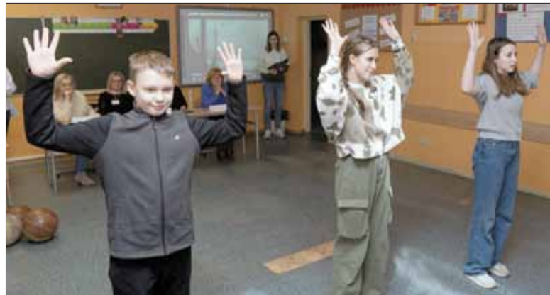
Młodzi żołnierze przeszli wojskową kwalifikację

W piątek, 16 lutego w Publicznej Szkole Podstawowej nr 5 w Strzelinie odbyła się kolejna edycja projektu pn. „Nocna Przygoda z Historią”. Tym razem szkolne mury zamieniły się w powstańczą Warszawę, a uczniowie w żołnierzy Armii Krajowej.