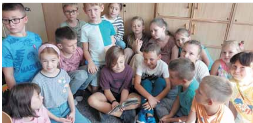
W ramach realizowanego Narodowego Programu Rozwoju Czytelnictwa w PSP nr 4 w Strzelinie odbyło się szereg różnych przedsięwzięć