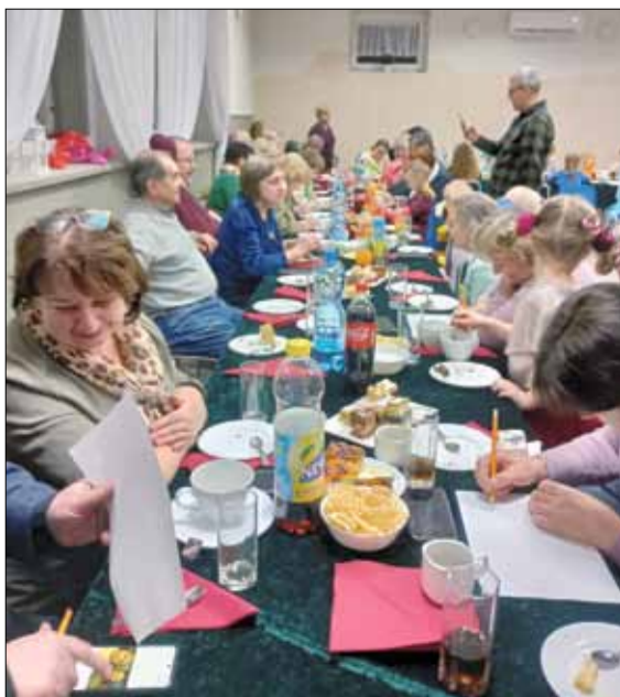
Zajęcia spotykały się ze sporym zainteresowaniem

Strzeliński Ośrodek Kultury we współpracy z sołectwami organizuje wiele ciekawych, tematycznych ofert trafiających do wszystkich pokoleń. Warto z uwagą śledzić ogłoszenia o kolejnych wydarzeniach, które przed nami.