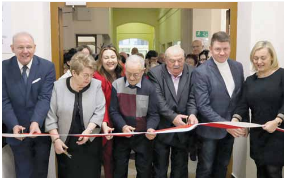
Podczas oficjalnego otwarcia uroczystie przecięto wstęgę