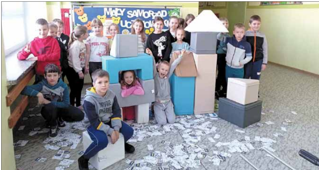
Zestaw piankowy ucieszył najmłodszych uczniów PSP nr 5 w Strzelinie