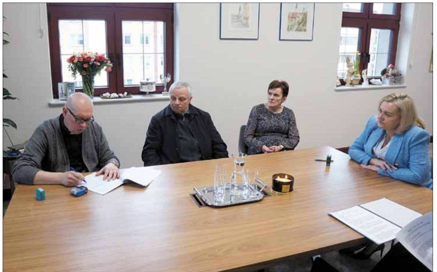
Umowy powierzające przyznanie dofinansowań proboszczowie podpisali w siedzibie strzelińskiego magistratu

Parafia Rzymskokatolicka pw. św. Antoniego Padewskiego w Jęglowej otrzyma 30 751 zł i przeznaczy dotację na wykonanie: badań stratygraficznych ścian wewnętrznych kościoła filialnego pw. Matki Boskiej Szkaplerznej w Żeleźniku, ekspertyzy dotyczącej elementów kamiennych wystroju kościoła oraz dokumentacji projektowo-kosztorysowej remontu wnętrza kościoła.