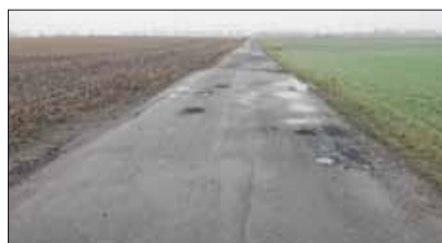
Gmina Strzelin pozyskała środki na remont drogi śródpolnej między Karszowem a Piotrowicami

Druga inwestycja będzie świetną alternatywą m.in. dla rowerzystów i umożliwi im bezpieczny dojazd m.in. do Ośrodka Wypoczynkowego „Nad Stawami” w Białym Kościele oraz tras rowerowych zlokalizowanych na Wzgórzach Strzełińskich. Chodzi o przebudowę drogi relacji Dębniak-Gębczyce-Biały Kościół o długości ok. 630 m, która zyska nową nawierzchnię bitumiczną. Trasa rozpoczyna przebieg od drogi powiatowej, tj. ulicy Leśnej w Białym Kościele, po drodze mija górny zbiornik wodny w Białym Kościele, kończąc na drodze powiatowej relacji Gębczyce-Romanów. Warto zaznaczyć, że droga ta ujęta jest również w ramach tzw. „Cyklostrady Dolnośląskiej” jako „Trasa Złota”. Na ten cel gmina otrzyma 252 tys. zł dofinansowania.