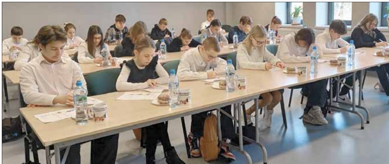
Uczestnicy zmierzali się z testem wiedzy pożarniczej