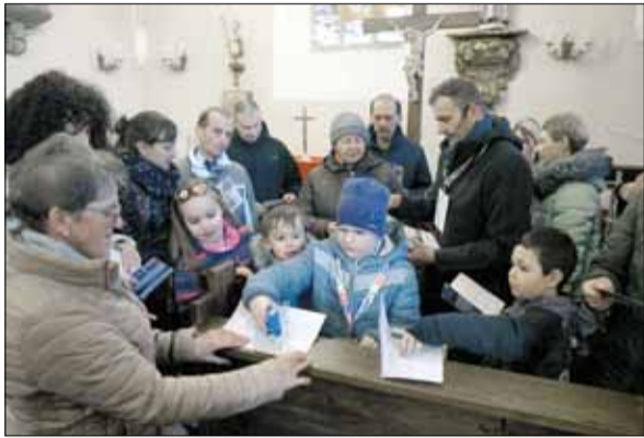
Na zakończenie wydarzenia uczestnicy mieli możliwość zdobycia kolejnej pieczętki w StrzeLińskiej Książeczce Turysty

W ostatnim czasie bardzo dużą popularnością cieszą się turystyczne wydarzenia organizowane w naszym mieście. Pod koniec lutego grupa pięćdziesięciu osób skorzystała z możliwości zwiedzania naszego najcenniejszego zabytku - Rotundy św. Gotarda.