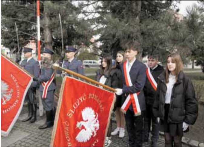
Uroczystości tradycyjnie odbyły się pod pomnikiem Żołnierza Polskiego w Strzelinie