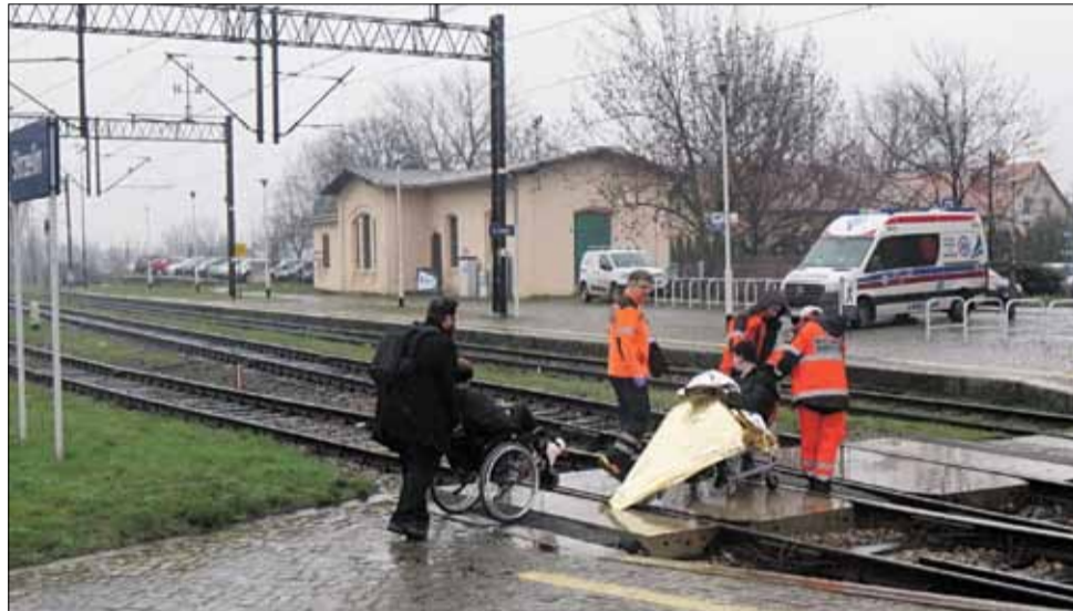
Przejście na drugi peron szczególnie utrudnione mają niepełnosprawni, ale również osoby starsze i rodzice z dziećmi w wózkach