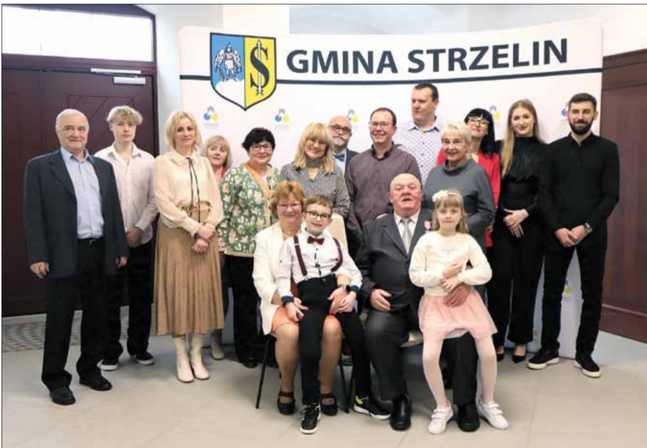
Podczas uroczystości z okazji pięćdziesiątej rocznicy ślubu nie mogło zabraknąć najbliższej rodziny jubilatów