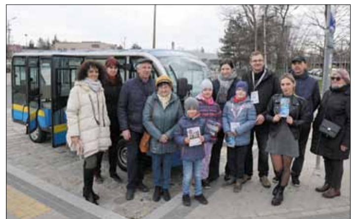
Zwiedzanie miasta melexem przeprowadzono po raz pierwszy. Z tej możliwości skorzystało sporo mieszkańców, dlatego wydarzenie zapewne zostanie powtórzone