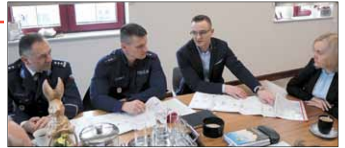
Samorządowcy oraz policja widzą potrzebę wdrożenia kompleksowych rozwiązań zapewniających zwiększenie bezpieczeństwa na ulicy Kościuszki w Strzelinie

Warto podkreślić, że jest to już kolejne spotkanie poświęcone temu zagadnieniu. Sprawa jest istotna, bo mieszkańcy od lat zwracają uwagę na problemy właśnie przy tej głównej ulicy Strzelina. Chodzi m.in. o parkowanie zbyt blisko przejścia dla pieszych obok sklepu zabawkowego. Straż Miejska reaguje na takie wykroczenia pouczeniami i mandatami, ale są to jedynie działania doraźne. Samorządowcy oraz policja widzą potrzebę wdrożenia kompleksowych rozwiązań, które ma właśnie uwzględnić projekt nowej organizacji ruchu. Aktualnie gmina, w porozumieniu z projektantem, przygotowuje zmiany, które mają poprawić bezpieczeństwo przy przejściach dla pieszych przy skrzyżowaniach ul. Kościuszki z ul. Grahama Bella i ul. Pocztową. Efektem tych zmian ma być m.in. poprawa oznakowania przejść dla pieszych.