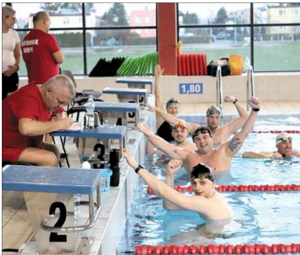
Zawodnikom dopisywał dobry humor

Za naszym pośrednictwem załoga Aquaparku Granit w Strzelinie składa podziękowania za udział w zawodach wszystkim uczestnikom.