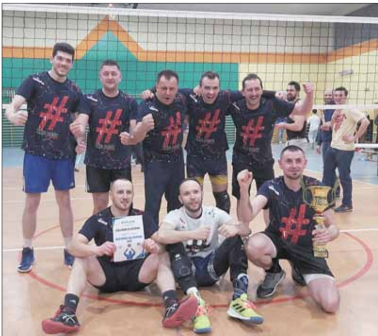
Zwycięzcą tegorocznej edycji Amatorskiej Ligi Siatkówki został zespół Uzależnieni od Siatkówki