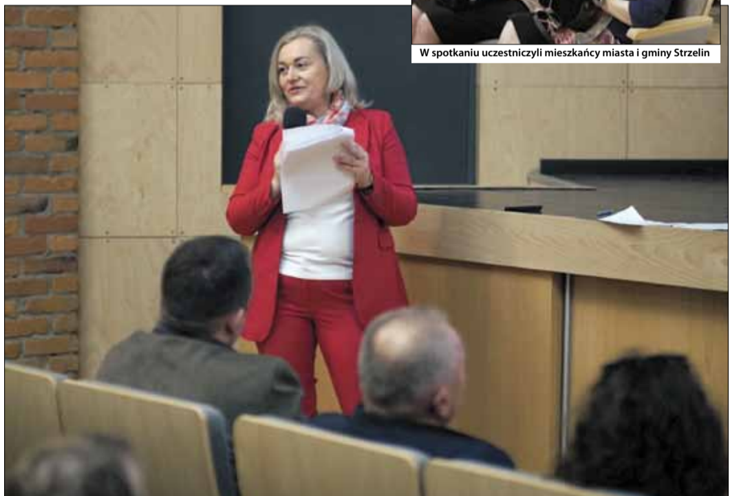
Podczas blisko 1,5-godzinnego wystąpienia burmistrz omówiła zrealizowane inwestycje i przedstawiła kolejne zamierzenia