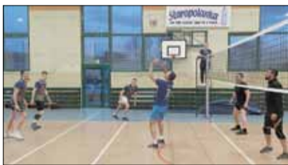
W zawodach rywalizowało łącznie osiem drużyn