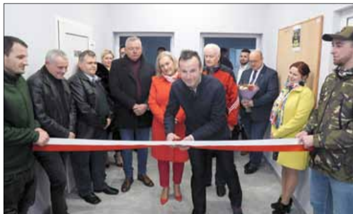
Otwarcie piłkarskiej szatni