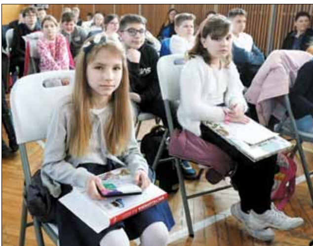
Laureaci oprócz dyplomów otrzymali m.in. książki