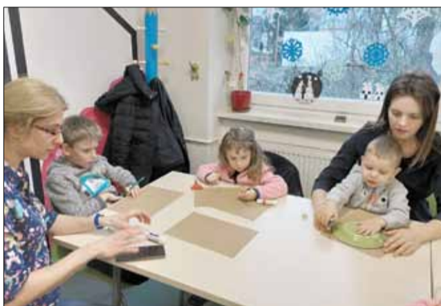
Zadaniem uczestników było wykonanie papierowych kwiatów