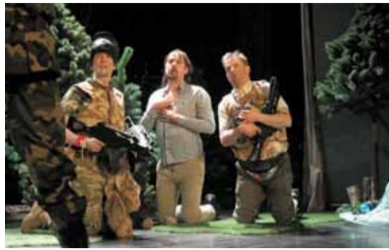
Uczestnicy wydarzenia zobaczyli spektakl pt. „Obóz przetrwania”

Za pyszne ciasta organizatorzy dziękują ochotniczym strażom pożarnym, sołectwom, rodzicom z naszych szkół, kołom gospodyń wiejskich, osobom prywatnym oraz wszystkim darczyńcom.