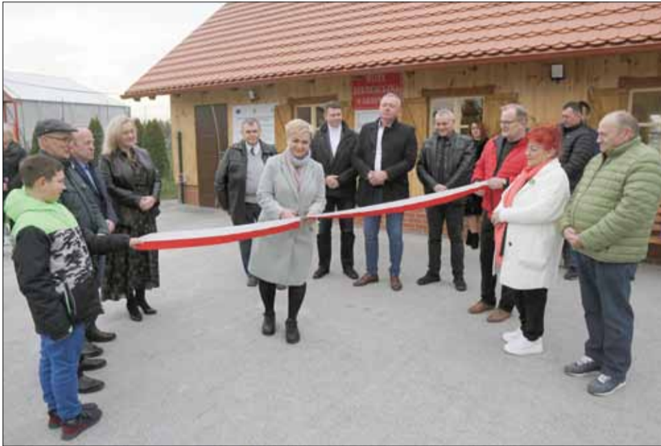
Podczas uroczystości nie zabrakło tradycyjnego przecięcia wstęgi