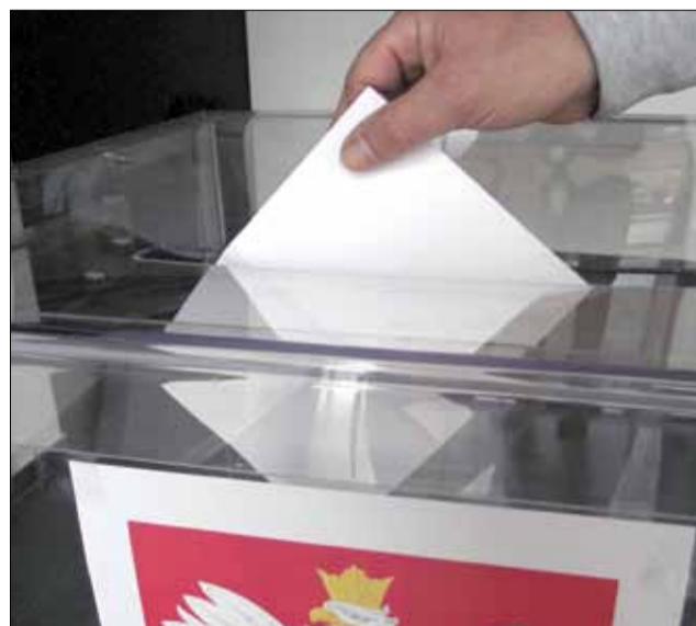
Wybory samorządowe odbędą się w drugą niedzielę kwietnia

W niedzielę, 7 kwietnia w naszym kraju odbędą się wybory samorządowe. Mieszkańcy miast, miasteczek i wsi zdecydują o przyszłości swoich małych ojczyzn. Należy zaznaczyć, że głosując wybieramy władze, które decydują o najbliższej nam okolicy, codziennych sprawach – lokalnej infrastrukturze, remontach dróg, chodników, edukacji itp. Lokale wyborcze będą otwarte w godzinach od 7:00 do 21:00, a głosować będą mogli wszyscy pełnoletni Polacy, którzy mają czynne prawa wyborcze i stale zamieszkują w danym miejscu. Wyborcy uprawnieni do głosowania po okazaniu dowodu tożsamości i podpisaniu listy wyborczej, otrzymają karty do głosowania. W przypadku mieszkańców powiatu strzelińskiego każdy wyborca otrzyma cztery karty do głosowania - z listą kandydatów do: rady gminy,