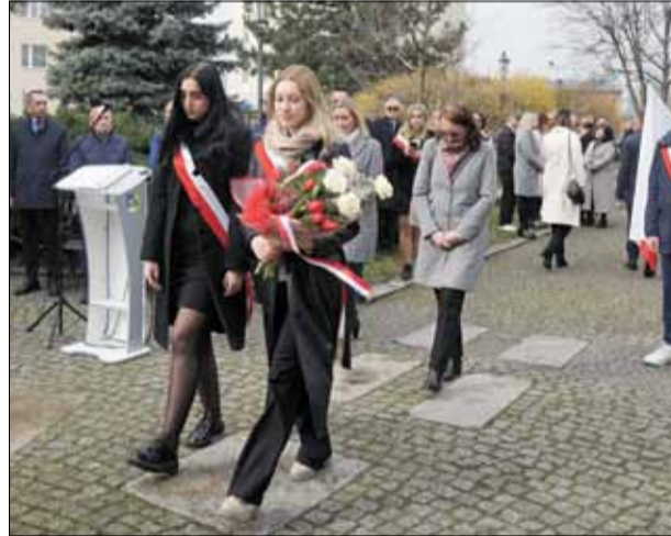
Delegacje złożyły wiązanki i zapaliły znicze