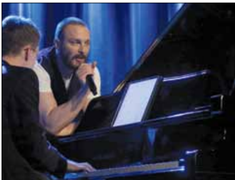
Na scenie wystąpił Sławek Uniatowski