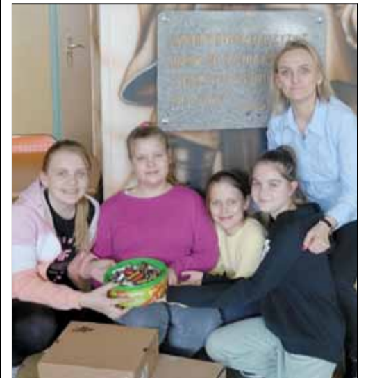
Uczniowie z zaangażowaniem włączyli się w akcję zbiórki baterii

Warto zaznaczyć, że wszystkie zużyte baterie i telefony poddawane są recyklingowi, dzięki czemu: zmniejsza się zanieczyszczenie środowiska, odzyskuje się wiele cennych surowców np. cynk, zmniejsza się ilość odpadów na składowisku.