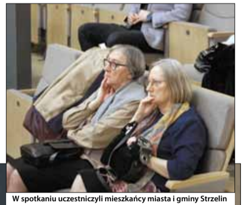
W spotkaniu uczestniczyli mieszkańcy miasta i gminy Strzelin

Sobotnie wydarzenie było kontynuacją cyklu spotkań burmistrza z mieszkańcami wszystkich miejscowości naszej gminy.