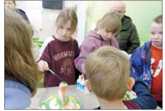
W ramach Dnia Otwartego dzieci odwiedzające szkołę m.in. przeprowadzały eksperymenty

Pod koniec lutego w Publicznej Szkole Podstawowej nr 4 w Strzelinie odbył się Dzień Otwarty. Najpierw placówkę odwiedzili przedszkolaki. Wizyta rozpoczęła się uroczystym powitaniem oraz występami artystycznymi uczniów „Czwórki”. Dzieci prezentowały układy taneczne, śpiewały i grały na instrumentach. Następnie przedszkolaki zwiedziły szkołę. Miały okazję zobaczyć jak uczą się starsi koledzy, wejść do klas, a nawet zasiąść w ławkach. Na pamiątkę wizyty otrzymały kolorowe zakładki do książek. Po południu do „Czwórki” przyszły starsze dzieci z rodzicami, aby poznać ofertę placówki. Każdy znalazł coś dla siebie. Były zabawy rytmiczne i muzyczne, rozgrywki szachowe, eksperymenty, malowanie, rysowanie, sala gier planszowych, zabawy w programowanie z Ozobotami, a nawet ... magiczny dywan. Dla miłośników sportu przygotowano tor przeszkód. Na wszystkich czekały pamiątkowe upominki, a na tych, którzy w czasie warsztatów stracili sporo energii - pyszne tosty.