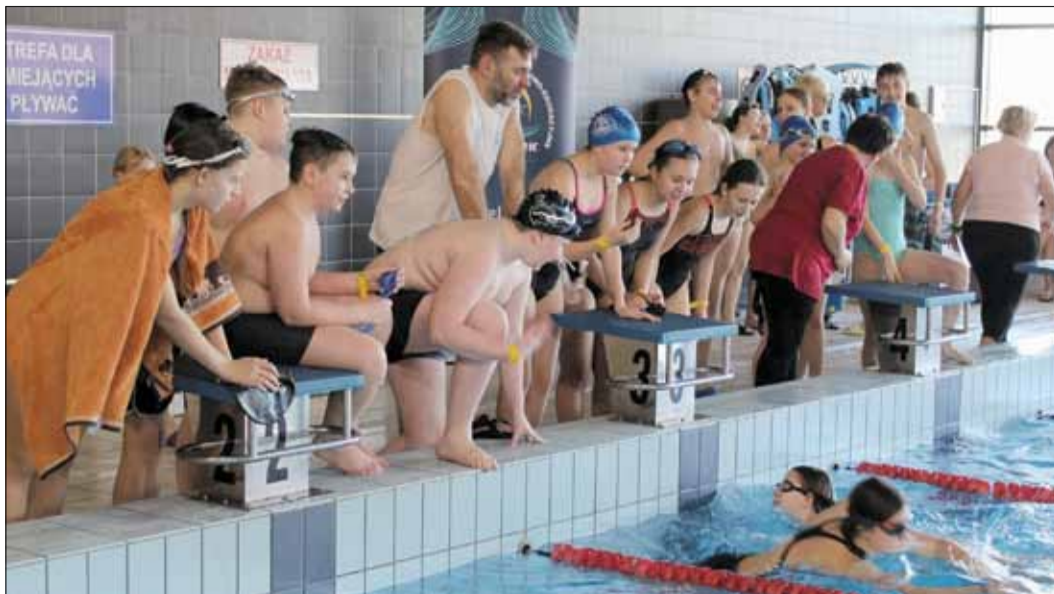
Jedną z konkurencji podczas zawodów była sztafeta 6 x 50 metrów