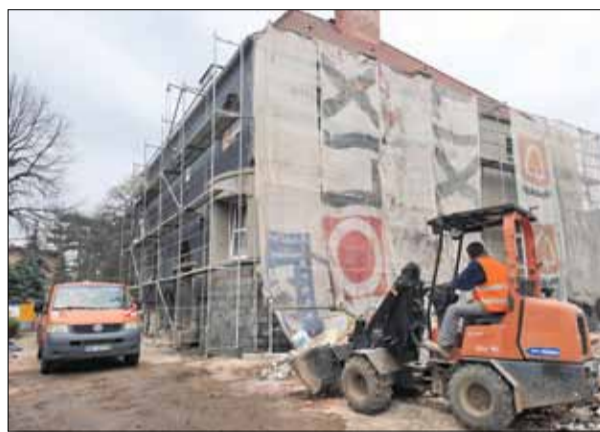
W budynku przy ul. Popieluszki trwają intensywne prace

W przypadku, gdy ilość wniosków przekroczy limit wolnych miejsc pierwszeństwo w przyjęciu będzie miało dziecko, które uzyska największą sumę punktów w postępowaniu rekrutacyjnym. Jakie kryteria będzie brała pod uwagę komisja? - Po pierwsze wcześniejsze uczęszczanie przez dziecko w 2024 r. do Niepublicznego Żłobka „Bajka” w Strzelinie. Po drugie posiadanie przez