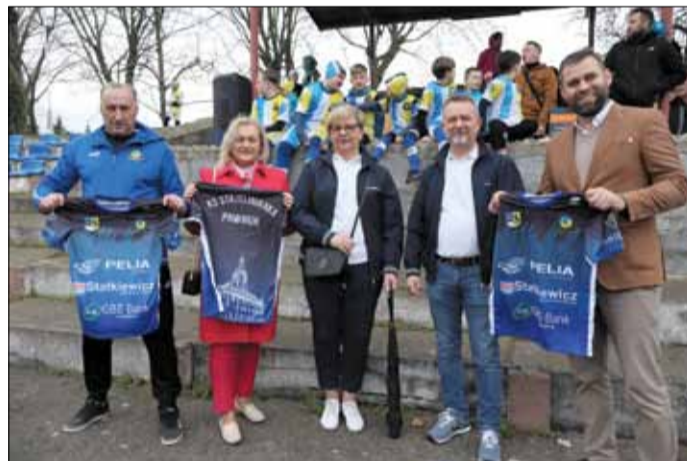
Symboliczne przekazanie nowych strojów