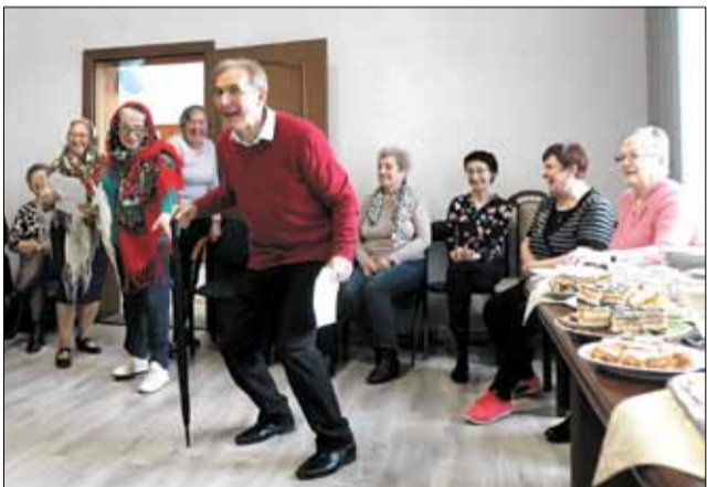
Seniorzy zaprezentowali zabawny skecz