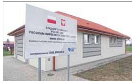
Nowe zaplecze szatniowe w Chociwelu