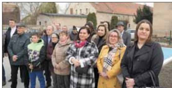
W wydarzeniu uczestniczyli mieszkańcy Krzepic, przedstawiciele strzeleńskiego samorządu, Stowarzyszenia Lokalna Grupa Działania „Gromnik”, a także radni