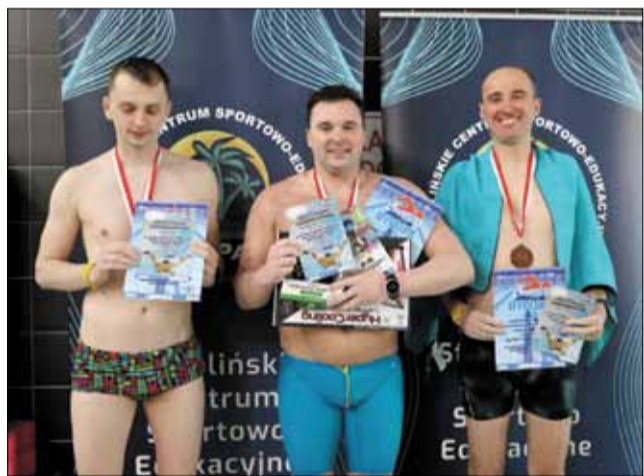
Oto zwycięzcy tegorocznej strzelińskiej edycji Otyliady

W nocy z 16 na 17 marca w Aquaparku Granit w Strzelinie odbył się Nocny Maraton Pływacki. Podczas tegorocznej edycji Otyliady w strzelińskiej pływalni rywalizowało 31 pływaków.