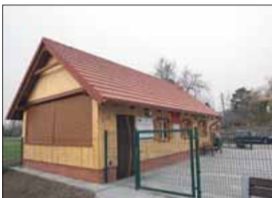
Wiata różni się od tych, które dotychczas powstały w miejscowościach gminy Strzelin