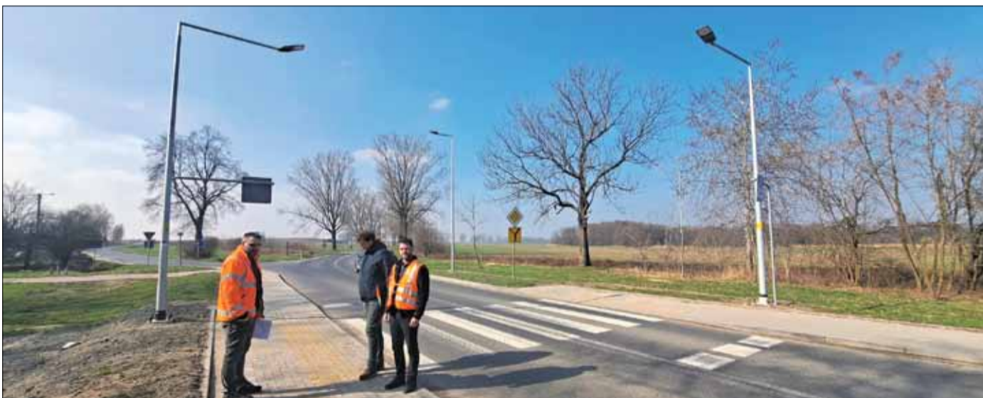
Zamontowane oświetlenie poprawi bezpieczeństwo przy przejściu dla pieszych i skrzyżowaniu dróg

Należy zaznaczyć, że to zadanie jest drugim z czterech planowanych na terenie naszej gminy w latach 2023-2024. W grudniu ubiegłego roku zakończono budowę doświetleń 12 przejść dla pieszych zlokalizowanych przy drodze krajowej na terenie miasta i gminy Strzelin, w tym dwóch w Piotrowicach, trzech w Mikoszowie oraz na terenie miasta przy ulicach: Borowskiej, Dzierżonowskiej, Bolka I Świdnickiego oraz Wojska Polskiego. W bieżącym roku planowana jest jeszcze budowa zatoki autobusowej w Biedrzychowie wraz z chodnikiem i oświetleniem oraz doświetlenie kolejnych ośmiu przejść dla pieszych przy ul. Wojska Polskiego w Strzelinie.